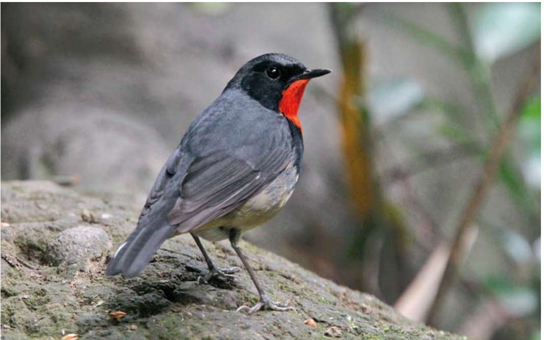
34 Firethroat / Père Davids Nachttegaal Calliope pectardens , male, Chengdu, Sichuan, China, 2 May 2012 (Werner Müller)