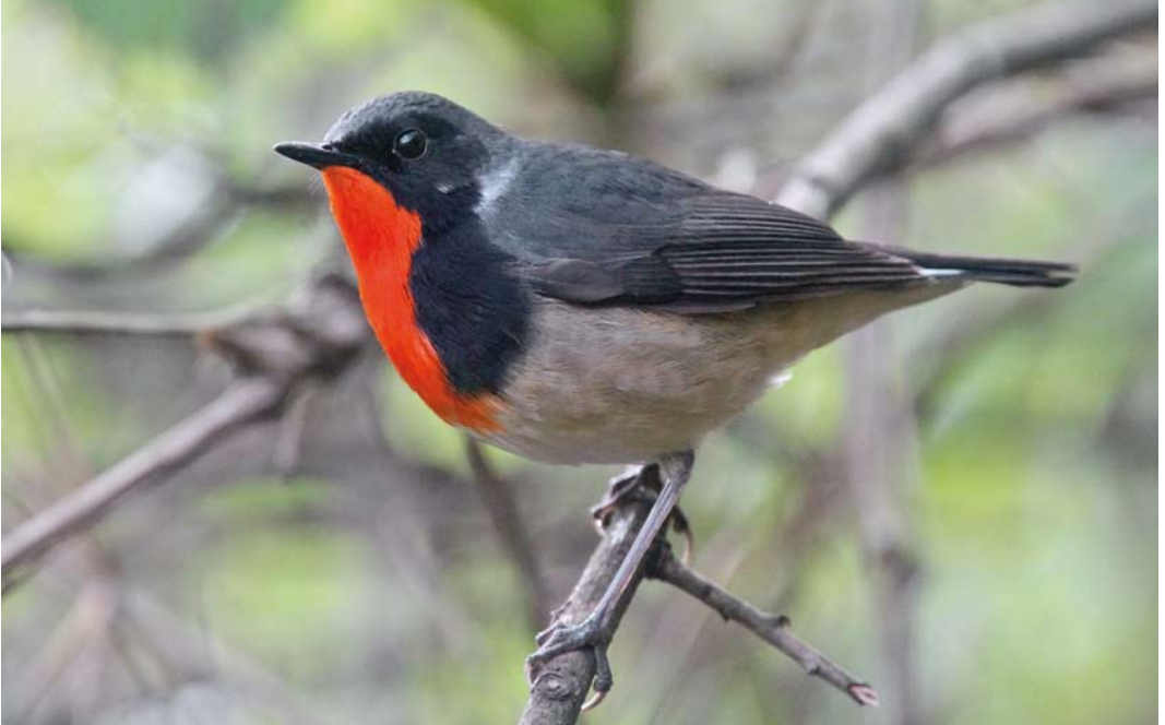
33 Firethroat / Père Davids Nachttegaal Calliope pectardens , male, Wolong Biosphere Reserve, Sichuan, China, 10 May 2012 (Werner Müller)