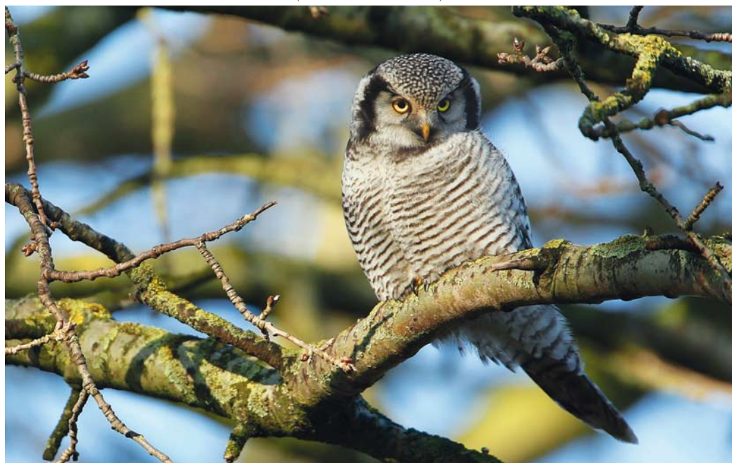
6 Sperweruil / Northern Hawk-Owl Surnia ulula , Zwolle, Overijssel, 20 december 2013