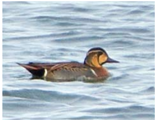
70 Vale Gierzwaluw / Pallid Swift Apus pallidus , juveniel, Oosterscheldekering, Zeeland, 2 november 2013 ( Alex Bos ) 71 Swinhoes Boszanger / Two-barred Warbler Phylloscopus plumbeitarsus , Kamperhoek, Flevoland, 2 december 2013 ( Marten Miske ) 72-73 Provençaalse Grasmus / Dartford Warbler Sylvia undata , Westkapelle, Zeeland, 2 november 2013 ( Corstiaan Beeke ) 74 Izabeltapuit / Isabelline Wheatear Oenanthe isabellina , eerste-winter mannetje, Kroonspolders, Vlieland, Friesland, 2 november 2013 ( Sander Lagerveld ) 75 Siberische Taling / Baikale Teal Anas formosa , eerste-winter mannetje, Driel, Gelderland, 25 december 2013 ( Alex Bos )