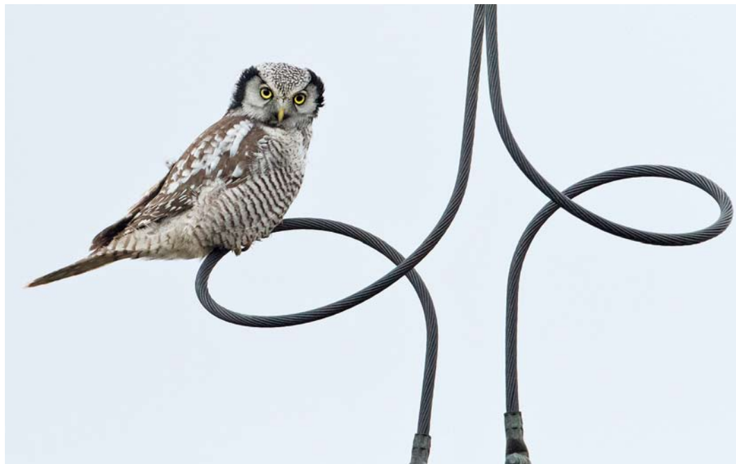
5 Sperweruil / Northern Hawk-Owl Surnia ulula , Zwolle, Overijssel, 2 januari 2014