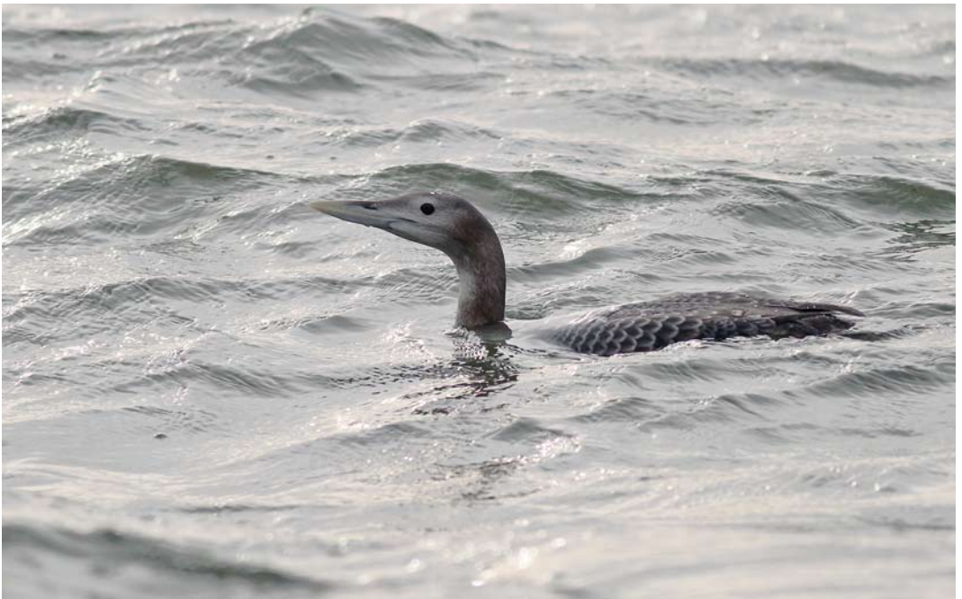
49 Yellow-billed Loon / Geelsnavelduiker Gavia adamsii , first-year, Goczałkowicki reservoir, Slaskie, Poland, 29 December 2013