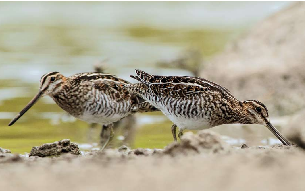
51 Wilson's Snipes / Amerikaanse Watersnippen Gallinago delicata , Tejina, La Laguna, Tenerife, Canary Islands, 26 October 2013 (Ramón Fernández Febles)