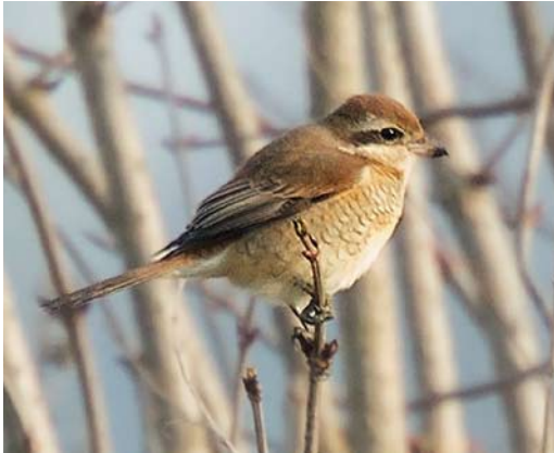
97 Bruine Klauwier / Brown Shrike Lanius cristatus , tweede-kalenderjaar, Azewijnsche Broek, Gelderland, 19 januari 2014