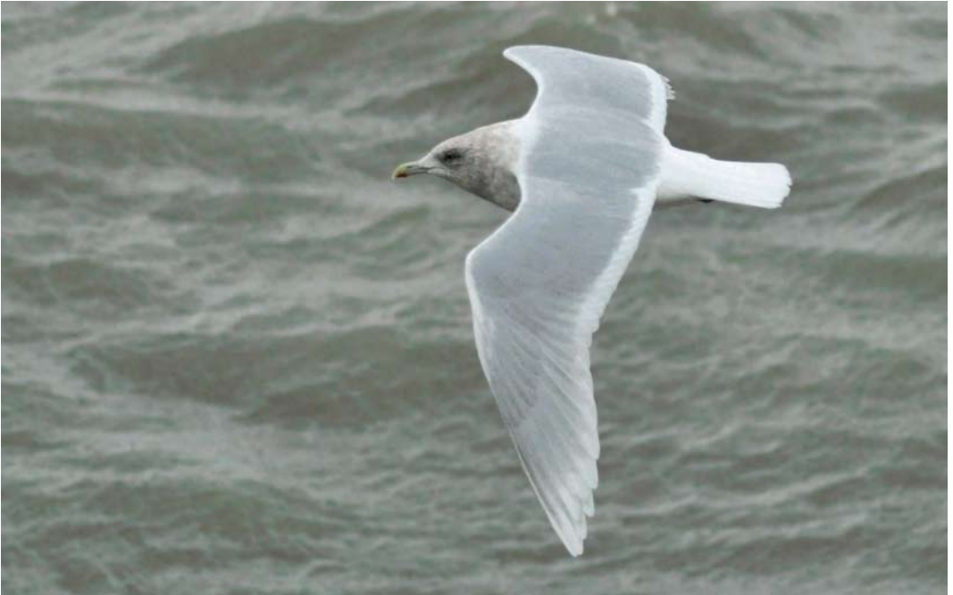
68 Kumliens Meeuw / Kumlien's Gull Larus glaucooides kumlieni , adult, Scheveningen, Zuid-Holland, 24 december 2013 (Vincent van der Spek)