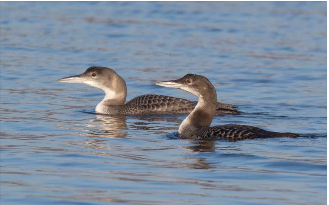
69 Ijsduikers / Great Northern Loons Gavia immer , eerstejaars, Heel, Limburg, 10 december 2013