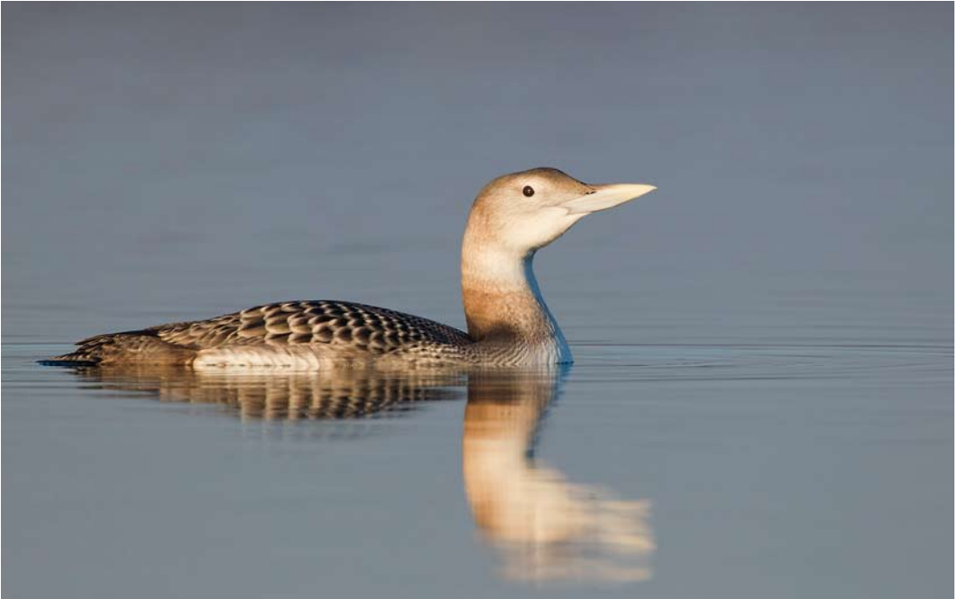
46 Yellow-billed Loon / Geelsnavelduiker Gavia adamsii , first-year, Lac du Der-Chantecoq, Sainte-Marie-du-Lac-Nuisement, Marne, France, 13 December 2013 ( David Monticelli )