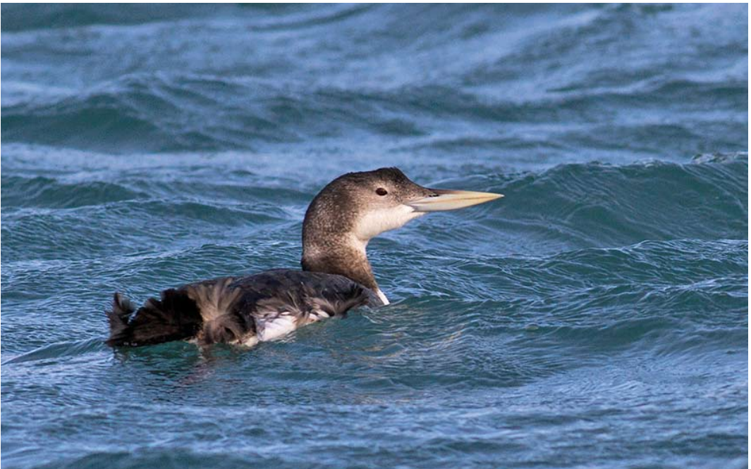
47 Yellow-billed Loon / Geelsnavelduiker Gavia adamsii , adult, Brixham, Devon, England, 3 January 2014