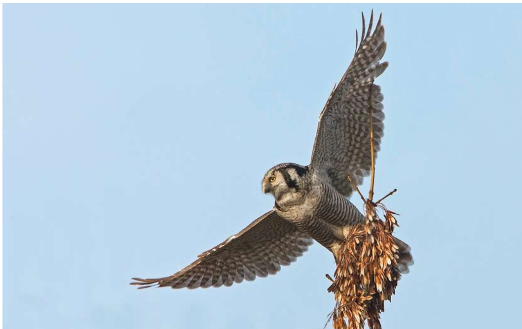
10 Sperweruil / Northern Hawk-Owl Surnia ulula , Zwolle, Overijssel, 18 januari 2014 (Rob Olivier)