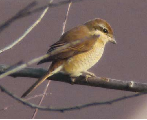
64 Brown Shrike / Bruine Klauwier Lanius cristatus , second calendar-year, Azewijnsche Broek, Gelderland, Netherlands, 19 January 2014 (Norbert Uhlhaas)

was the first for Denmark since 1959 (when the species became extinct as a breeder). A Brown Shrike Lanius cristatus at Azewijnsche Broek, Achterhoek, Gelderland, from 18 January onwards was the first for the Netherlands and the c 27th for Europe (of which 10 were in Scotland and seven in England). The first Streak-throated Swallow Petrochelidon iluvicola for Kuwait and second for the WP sensu BWP was photographed at Jahra Pools Reserve, Al-Jahra, on 6-7 December; the first for the WP was in Egypt on 19 November 2003.