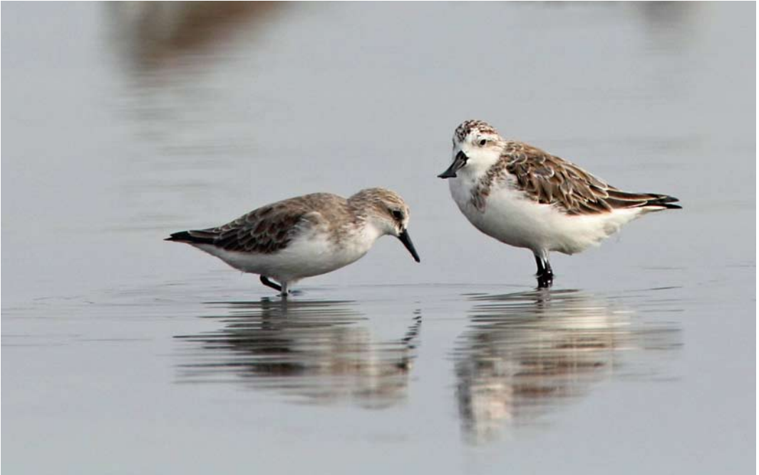
50 Spoon-billed Sandpiper / Lepelbekstrandloper Calidris pygmaea , adult winter, with Red-necked Stint / Roodkeelstrandloper C ruficollis , adult winter, Pak Thale, Thailand, 8 January 2014 ( Edwin Winkel )