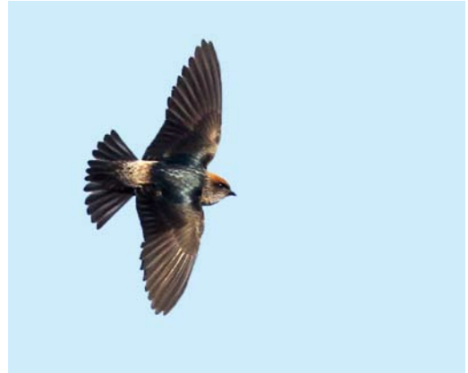
59 Streak-throated Swallow / Indische Klifzwaluw Petrochelidon fluvicola , immature, Jahra Pools Reserve, Kuwait, 7 December 2013