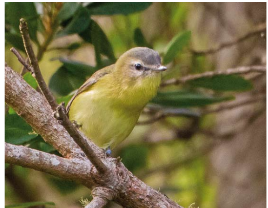
537 Great Knot / Grote Kanoet Calidris tenuirostris (right), with Red Knots / Kanoeten C canutus , Agadir, Oued Souss, Souss-Massa-Draâ, Morocco, 8 November 2014 (Arnaud B van den Berg) 538 Great Knot / Grote Kanoet Calidris tenuirostris (left), with Red Knots / Kanoeten C canutus , Agadir, Oued Souss, Souss-Massa-Draâ, Morocco, 8 November 2014 (Arnaud B van den Berg) 539 White-headed Duck / Witkoppeend Oxyura leucocephala , Dzierżno Duże reservoir, Upper Silesia, Poland, 5 November 2014 (Zbigniew Kajzer) 540 Philadelphia Vireo / Philadelphiavireo Vireo philadelphicus , Corvo, Azores, 11 October 2014 (Vincent Legrand)

November. A second-winter Audouin's Gull Larus audouinii photographed at Dungeness, Kent, on 12 October was the third for Dungeness and the seventh for Britain. On 16 October, another second-winter was present at a research platform in the North Sea north of Borkum, Schleswig-Holstein, Germany. In Cornwall, England, a Bridled Tern Onychoprion anaethetus flew past Pendeen on 21 October and a Forster's Tern Sterna forsteri flew past Cape Cornwall on 22 October. In Ireland, the adult Forster's returned first to Dublin in October and then to Galway in November.