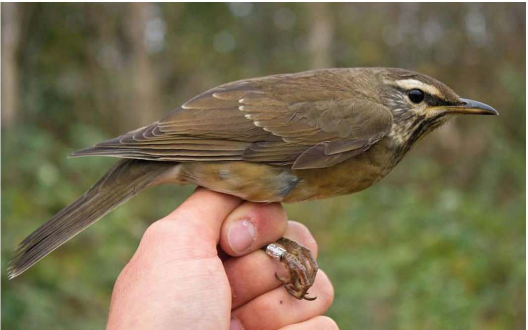
542 Eyebrowed Thrush / Vale Lijster Turdus obscurus , first-year, Gedser, Nordjylland, Denmark, 18 October 2014