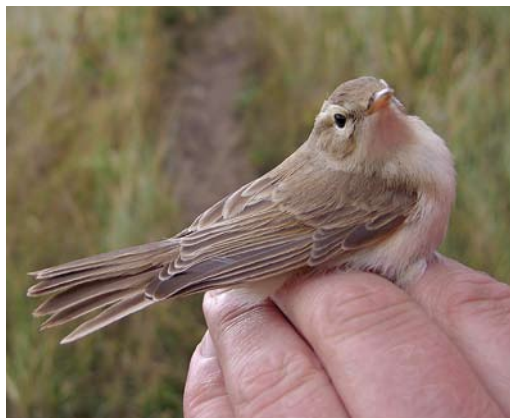
513 Booted Warbler / Kleine Spotvogel Iduna caligata , Castricum, Noord-Holland, 9 September 2013 (André J van Loon)

24 August, IJmuiden, Velsen , Noord-Holland, photographed (R Alberts); 28 August, IJmuiden, Velsen , Noord-