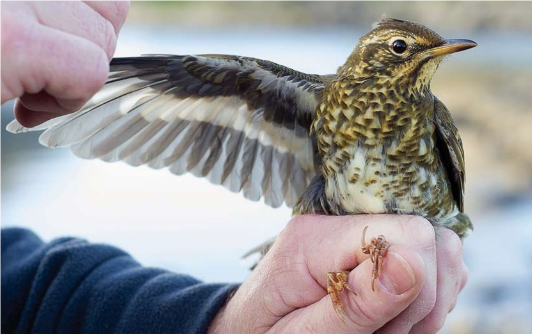
541 Siberian Thrush / Siberische Lijster Geokichla sibirica , first-year female, Træna, Nordland, Norway, 24 September 2014