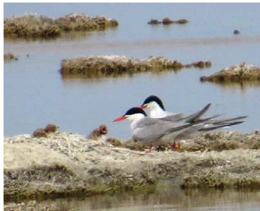
27 Common Terns / Visdieven Sterna hirundo , parents with three chicks of few days old, west of Port Said, Egypt, 24 May 2013

turbance by feral dogs but, so far, it is a muddy substrate difficult to access by humans, so it is naturally protected. In order to safeguard this significant colony for the future, signs could be posted to prevent people entering the area during the breeding season, especially when birds are nesting and raising chicks. The site should also be monitored every year, and any disturbances noted. Disturbance by feral dogs could constitute a problem and, if necessary, should be controlled. Natural predation of eggs or chicks, eg, by foxes or other mammalian or avian predators, could also constitute a threat to the viability of the colony. Such issues can only be determined through regular monitoring. However, monitoring itself can also serve as a disturbance factor for breeding birds so must be executed with great care.