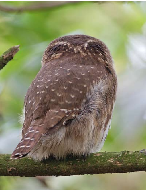
88-89 Dwerguil / Eurasian Pygmy Owl Glaucidium passerinum , Lettele, Overijssel, 4 januari 2014

De laatste uilensoort van 2013, Sneeuwuil, kondigde