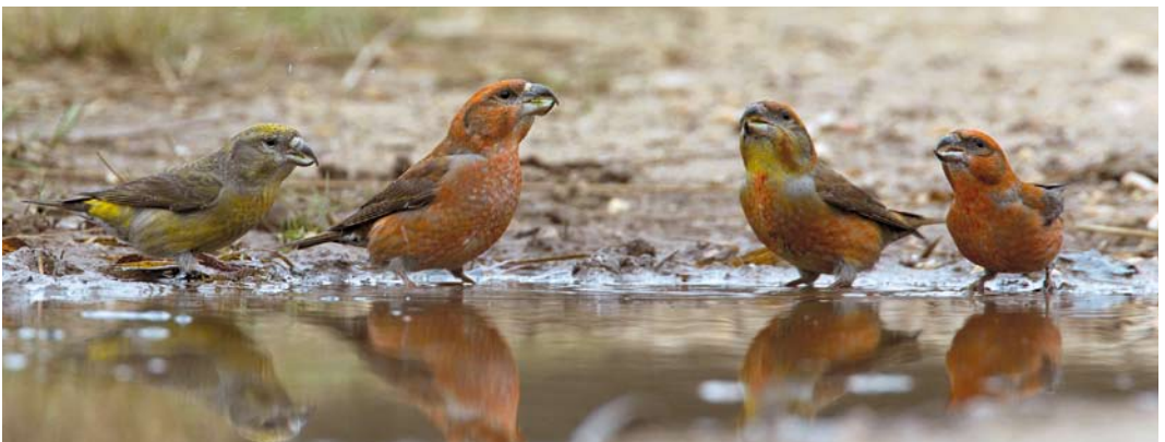
82 Witbandkruisbekken / Two-barred Crossbills Loxia leucoptera , mannetje en vrouwtje, Drents-Friese Wold, Friesland, 20 november 2013 ( Maartje Doorn ) 83 Grote Kruisbek / Parrot Crossbill Loxia pytyopsittacus , mannetje, Drents-Friese Wold, Drenthe, 19 oktober 2013 ( Lazar Brinkhuizen ) 84 Witbandkruisbek / Two-barred Crossbill Loxia leucoptera , mannetje, Drents-Friese Wold, Friesland, 20 november 2013 ( Ipe Weeber ) 85 Witbandkruisbek / Two-barred Crossbill Loxia leucoptera , eerstejaars mannetje, Noordlaarderbos, Groningen, 30 december 2013 ( Gerrit Kiekenbos ) 86 Grote Kruisbekken / Parrot Crossbills Loxia pytyopsittacus (midden), met Kruisbekken / Red Crossbills L. curvirostra (links en rechts), Mulderskop, Limburg, 17 januari 2014 ( Harvey van Diek )