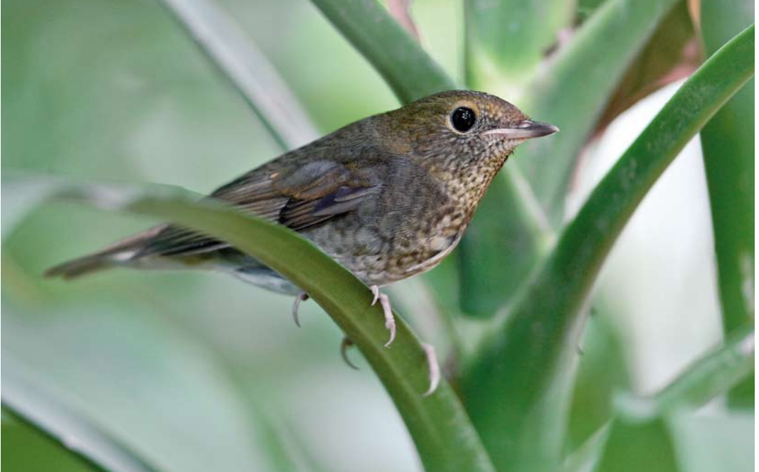
29-31 Rufous-headed Robin / Roodkopnachttegaal Larivora ruficeps , first-winter female, Phnom Penh, Cambodia, 20 November 2012