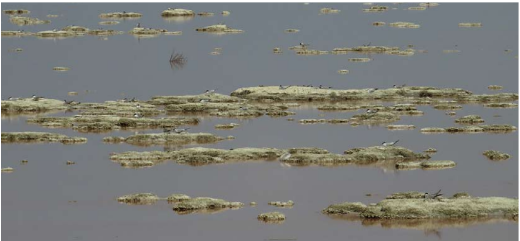
25 Common Terns / Visdieven Sterna hirundo , overview of colony west of Port Said, Egypt, 25 May 2013

Birds in general are under wide threat in Egypt, especially from disturbance, shooting and trapping, and degradation of habitats, especially for breeding. This area in particular is subject to dis-