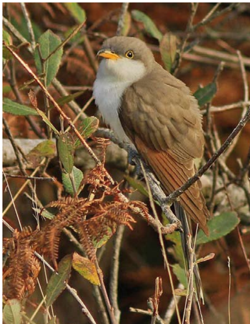
561 Yellow-billed Cuckoo / Geelsnavelkoekoek Coccyzus americanus , Porthgarra, Cornwall, England, 24 October 2014