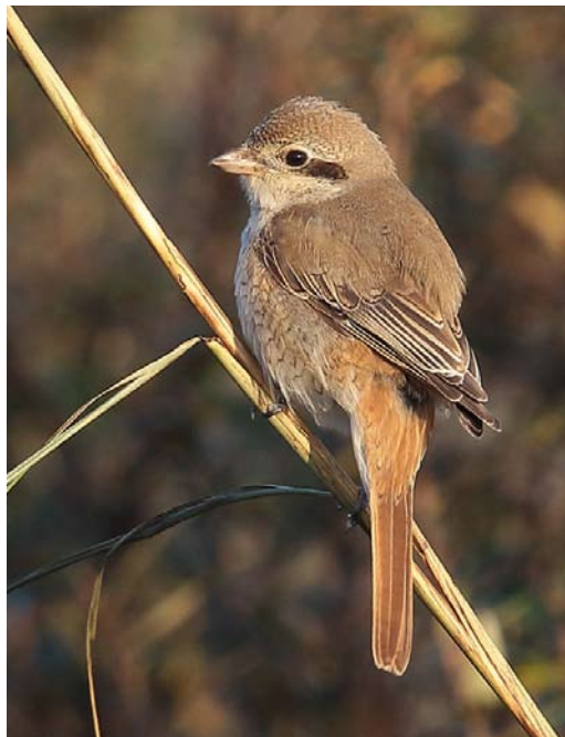
562 Presumed Red-tailed Shrike / vermoedelijke Turkestaanse Klauwier Lanius phoenicuroides , first-year Castricum, Noord-Holland, Netherlands, 21 November 2014

for the Azores. A late Thrush Nightingale Luscinia luscinia was photographed at Warszawa, Poland, on 18 November. A male Siberian Rubythroat Calliope calliope stayed at Levenwick, Mainland, Shetland, on 3-8 October. A Red-flanked Bluetail Tarsiger cyanurus at Blacksod, Mayo, was (only) the fourth for Ireland. Presumed Stejneger's Stonechats Saxicola stejnegeri were found, eg, at Lauwersmeer, Groningen, the Netherlands, on 28 October and on Fair Isle from 31 October to 2 November. Pied Wheatears Oenanthe pleschanka occurred, for instance, at Furilden, Gotland, Sweden, on 27 October; Mortsel, Antwerpen, Belgium, from 8 November; Zoeterwoude, Zuid-Holland, the Netherlands, on 10-13 November; and Madland, Rogaland, Norway, from 11 November. If accepted, an adult White-crowned Wheatear O leucopyga at Poelgeest, Oegstgeest, Zuid-Holland, from at least 23 September through November will be the first for the Netherlands; its tattered appearance provoked lengthy and sometimes entertaining discussions about its provenance (there have been records in c 13 other European countries, north to Denmark and England). Another individual, apparently wearing a red ring, was photographed on Ameland, Friesland, the Netherlands, on 2 November, adding more spice to the discussion.