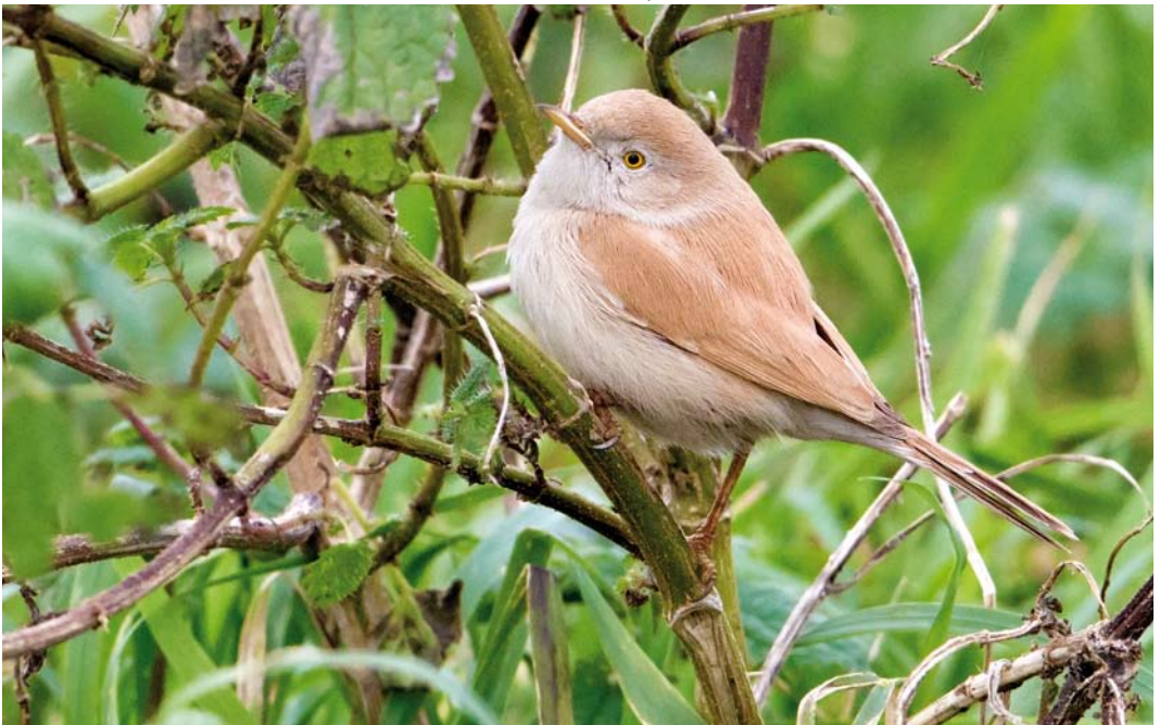
587 Afrikaanse Woestijngrasmus / African Desert Warbler Sylvia deserti , Alphen aan den Rijn, Zuid-Holland, 26 november 2014 (Jaap Denee)