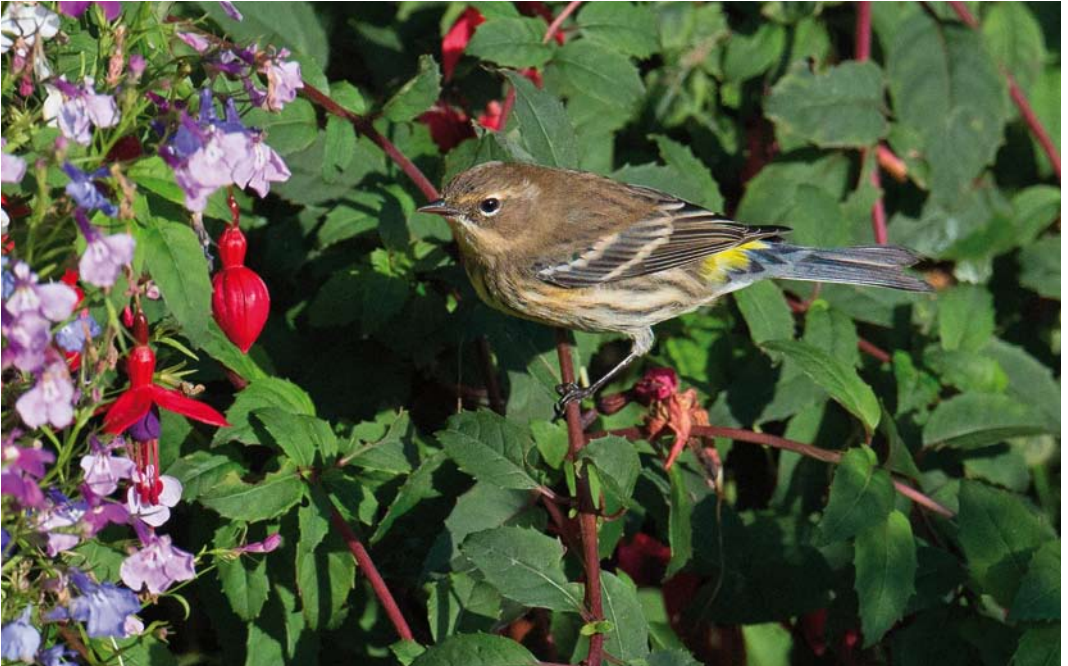
549 Myrtle Warbler / Mirtezanger Setophaga coronata , Grutness, Mainland, Shetland, Scotland, 30 September 2014