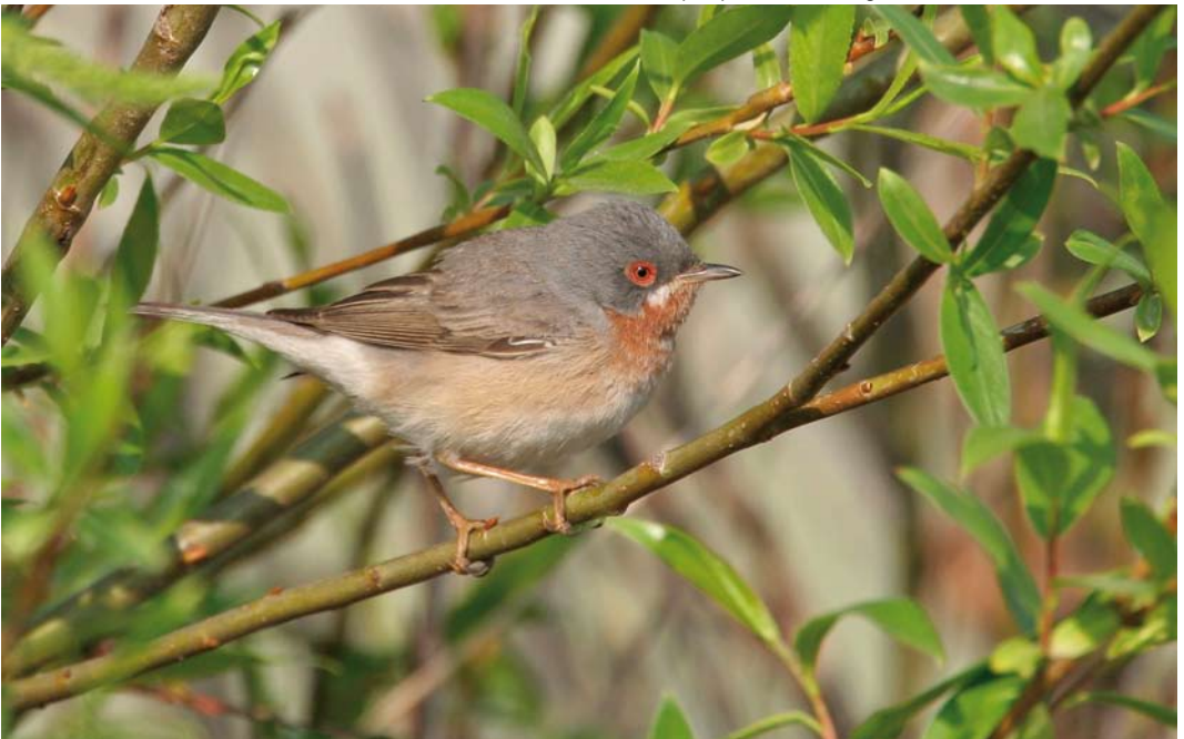
524 Balkanbaardgrasmus / Eastern Subalpine Warbler Sylvia cantillans , tweede-kalenderjaar mannetje, Maasvlakte, Zuid-Holland, 11 mei 2006