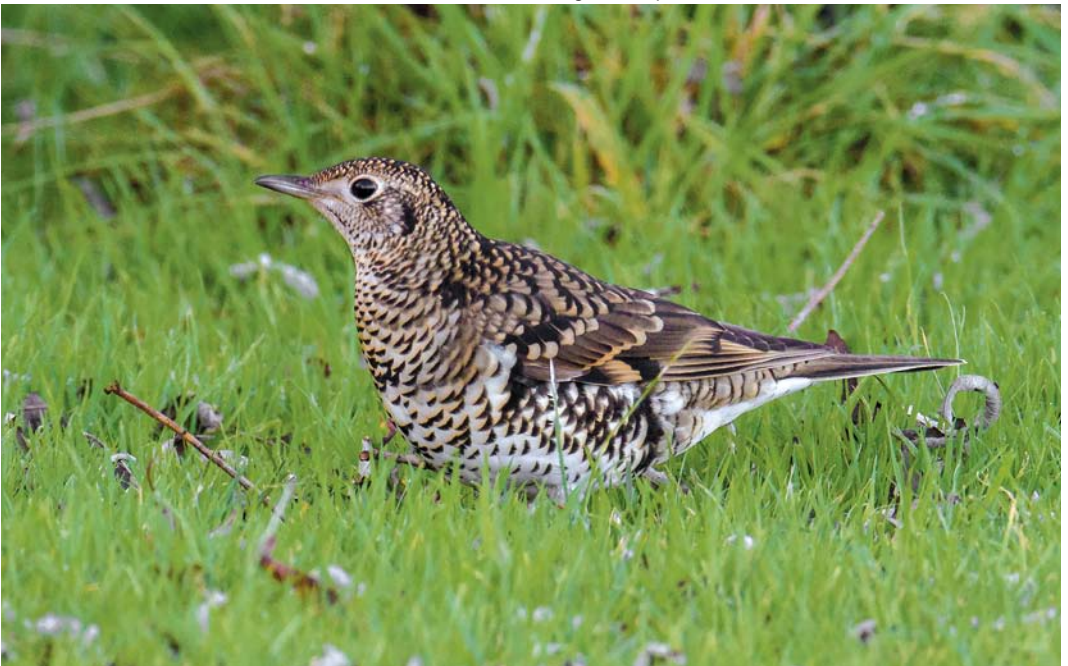
550 White's Thrush / Goudlijster Zoothera aurea , first-year, Durigarth, Mainland, Shetland, Scotland, 1 October 2014