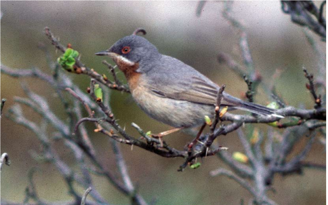
523 Balkanbaardgrasmus / Eastern Subalpine Warbler Sylvia cantillans , tweede-kalenderjaar mannetje, Groet, Noord-Holland, 7 mei 1986 (Arnoud B van den Berg)