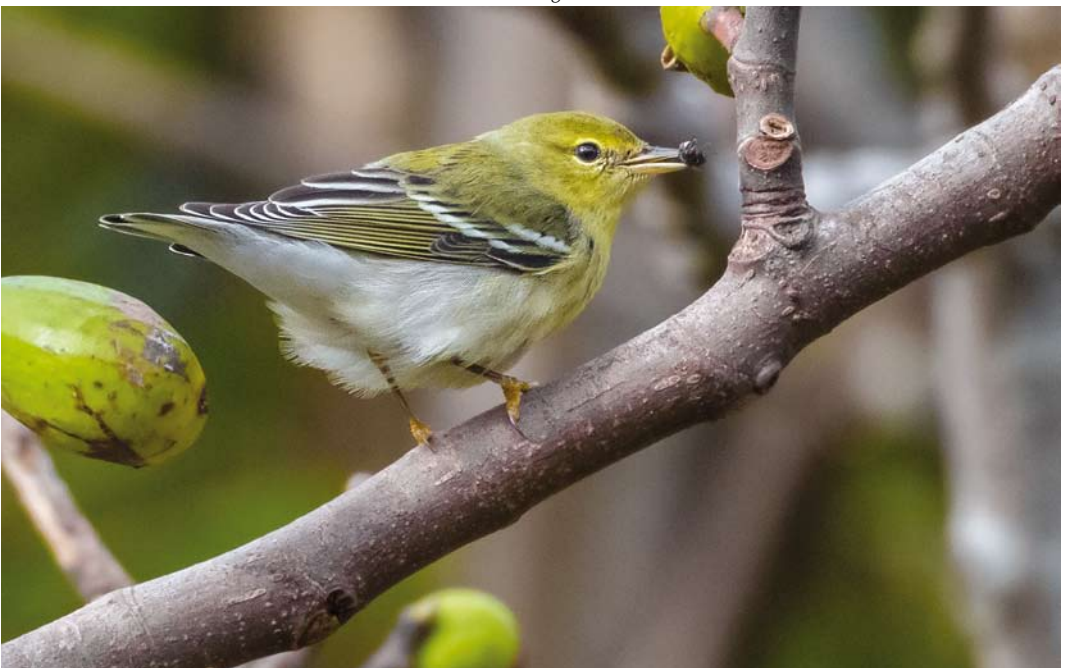
552 Blackpoll Warbler / Zwartkopzanger Setophaga striata , Vila do Corvo, Corvo, Azores, 20 October 2014