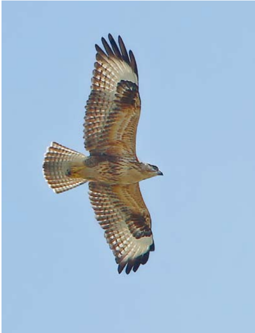
500 Long-legged Buzzard / Arendbuizerd Buteo rufinus , Maasvlakte, Zuid-Holland, 26 September 2013 (Martin van der Schalk)

summer, moulting into winter plumage, photographed, sound-recorded (P van Franeker et al; Dutch Birding 35: 354, plate 451, 2013); 3-20 November, Bantpolder, Dongeradeel , Friesland, adult winter (M Olthoff et al).