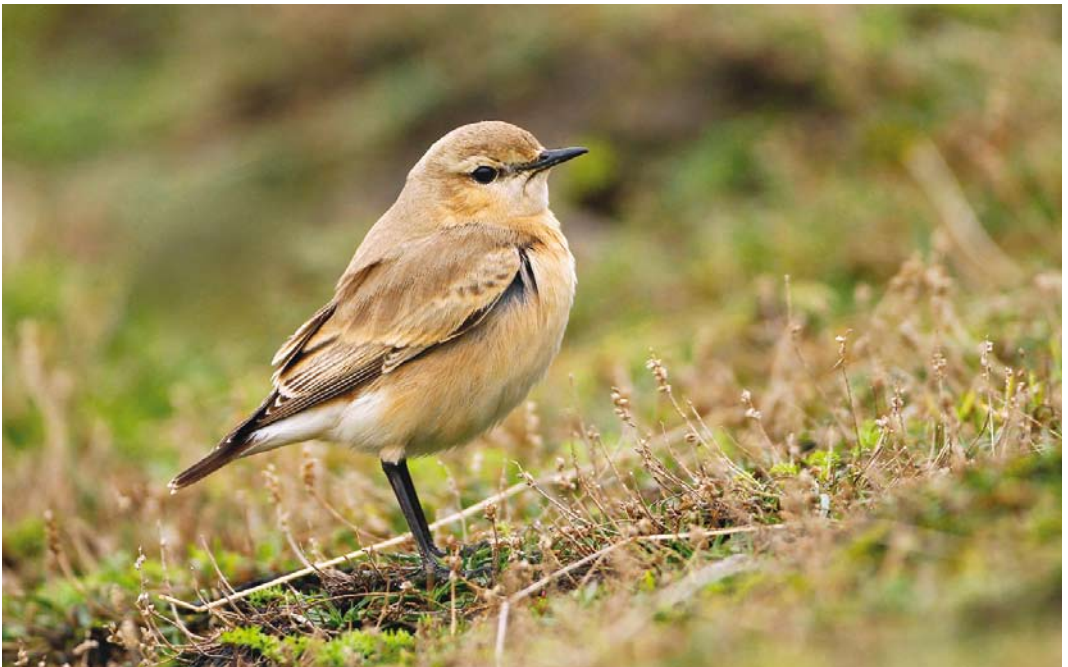
520 Isabelline Wheatear / Izabeltapuit Oenanthe isabellina , first-winter, Maasvlakte, Zuid-Holland, 1 November 2013