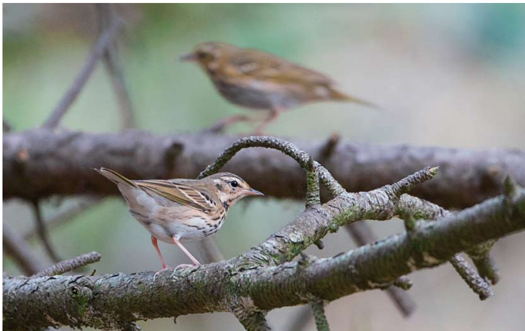
575 Siberische Boompiepers / Olive-backed Pipits Anthus hodgsoni , Vlieland, Friesland, 4 oktober 2014