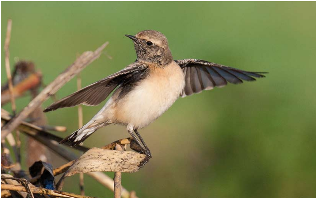
560 Pied Wheatear / Bonte Tapuit Oenanthe pleschanka , first-year male, Zoeterwoude, Zuid-Holland, Netherlands, 13 November 2014