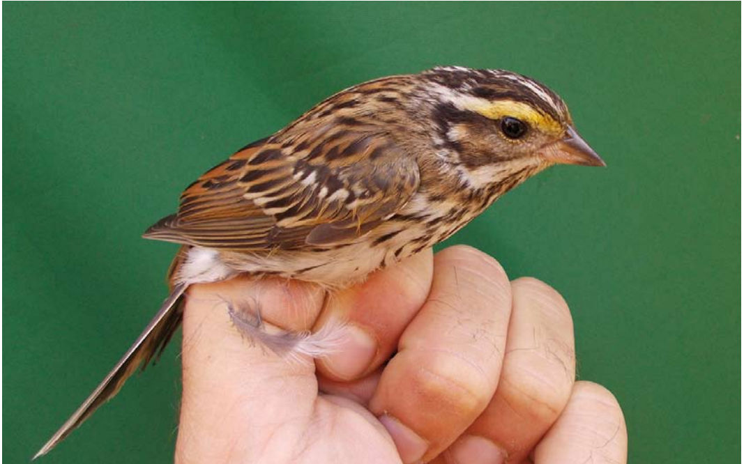
555 Yellow-browed Bunting / Geelbrauwgors Emberiza chrysophrys , first-year, Dąbkowice, Slawno, Pomerania, Poland, 5 October 2014 (Michał Polakowski)