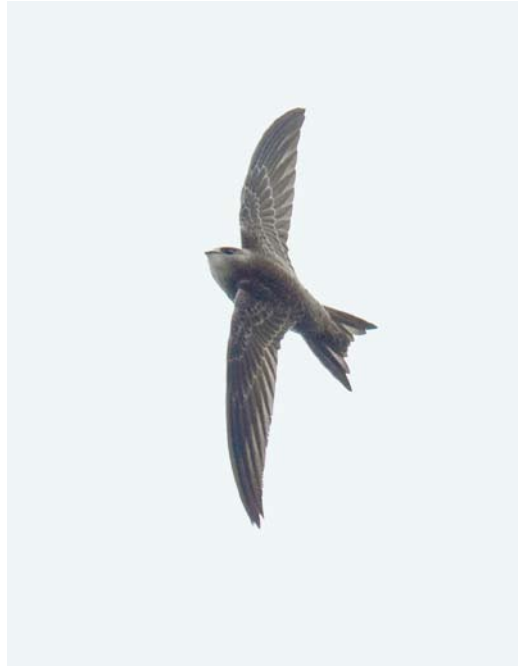
534 Pallid Swift / Vale Gierzwaluw Apus pallidus , juvenile, Heerhugowaard, Noord-Holland, Netherlands, 9 November 2014 535 Pallid Swift / Vale Gierzwaluw Apus pallidus , juvenile, Friebertshausen, Hessen, Germany, 23 November 2014 536 Pied-billed Grebe / Dikbekfuut Podilymbus podiceps , with Red Swamp Crayfish / Rode Amerikaanse Rivierkreeft Procambarus clarkii , Lagoa Azul, São Miguel, Azores, 28 October 2014