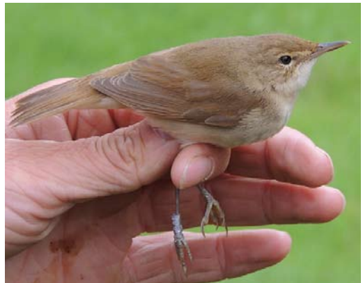
506 Two-barred Warbler / Swinhoes Boszanger Phylloscopus plumbeitarsus , first-winter, Kamperhoek, Flevoland, 1 December 2013 507 Sardinian Warbler / Kleine Zwartkop Sylvia melanocephala , male, Mokkebank, Friesland, 20 April 1996 508 Western Subalpine Warbler / Westelijke Baardgrasmus Sylvia inornata , Kennemerduinen, Bloemendaal, Noord-Holland, 6 August 2013 509 Blyth's Reed Warbler / Struikrietzanger Acrocephalus dumetorum , Ooijpolder, Gelderland, 19 August 2013