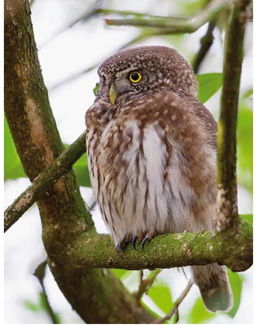
502 Northern Hawk-Owl / Sperweruil Surnia ulula , first-winter, Zwolle, Overijssel, 6 January 2014 (Jaap Denee) 503 Eurasian Pygmy Owl / Dwerguil Glaucidium passerinum , Oostermaet, Lettele, Overijssel, 4 January 2014 (Jaap Denee) 504 Boreal Owl / Ruigpootuil Aegolius funereus , Eemshaven, Groningen, 17 October 2013 (Marcel Sandifort)