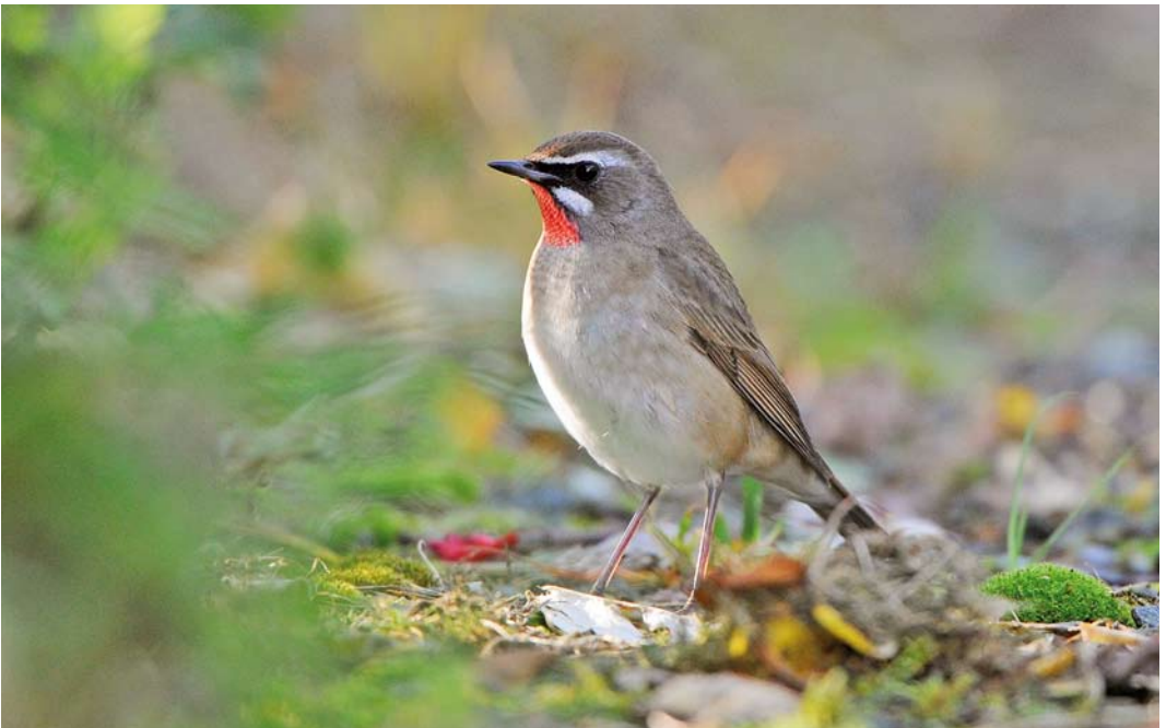
548 Siberian Rubythroat / Roodkeelnachttegaal Calliope calliope , male, Levenwick, Mainland, Shetland, Scotland, 8 October 2014