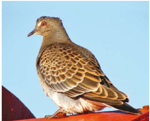
492 Baikal Teal / Siberische Taling Anas formosa , male, Meinerswijk, Gelderland, 25 December 2013 (Alex Bos) 493 Pallid Swift / Vale Gierzwaluw Apus pallidus , Neeltje Jans, Zeeland, 2 November 2013 (Alex Bos) 494-495 Rufous Turtle Dove / Meenartortel Streptopelia orientalis meena , first-year, at sea, 53°25'N 03°39'E, Continentaal Plat (north-west off Texel, Noord-Holland), 16 November 2010 (R Neumann)

2010 16 November, at sea, 53°25'N 03°39'E, Continentaal Plat (north-west off Texel, Noord-Holland), first-year, photographed (via R Neumann).