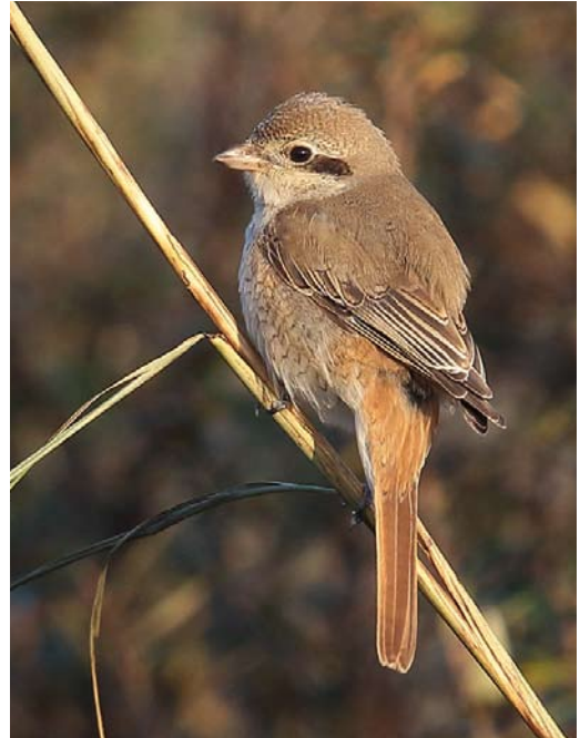
562 Presumed Red-tailed Shrike / vermoedelijke Turkestaanse Klauwier Lanius phoenicuroides , first-year Castricum, Noord-Holland, Netherlands, 21 November 2014

for the Azores. A late Thrush Nightingale Luscinia luscinia was photographed at Warszawa, Poland, on 18 November. A male Siberian Rubythroat Calliope calliope stayed at Levenwick, Mainland, Shetland, on 3-8 October. A Red-flanked Bluetail Tarsiger cyanurus at Blacksod, Mayo, was (only) the fourth for Ireland. Presumed Stejneger's Stonechats Saxicola stejnegeri were found, eg, at Lauwersmeer, Groningen, the Netherlands, on 28 October and on Fair Isle from 31 October to 2 November. Pied Wheatears Oenanthe pleschanka occurred, for instance, at Furilden, Gotland, Sweden, on 27 October; Mortsel, Antwerpen, Belgium, from 8 November; Zoeterwoude, Zuid-Holland, the Netherlands, on 10-13 November; and Madland, Rogaland, Norway, from 11 November. If accepted, an adult White-crowned Wheatear O leucopyga at Poelgeest, Oegstgeest, Zuid-Holland, from at least 23 September through November will be the first for the Netherlands; its tattered appearance provoked lengthy and sometimes entertaining discussions about its provenance (there have been records in c 13 other European countries, north to Denmark and England). Another individual, apparently wearing a red ring, was photographed on Ameland, Friesland, the Netherlands, on 2 November, adding more spice to the discussion.