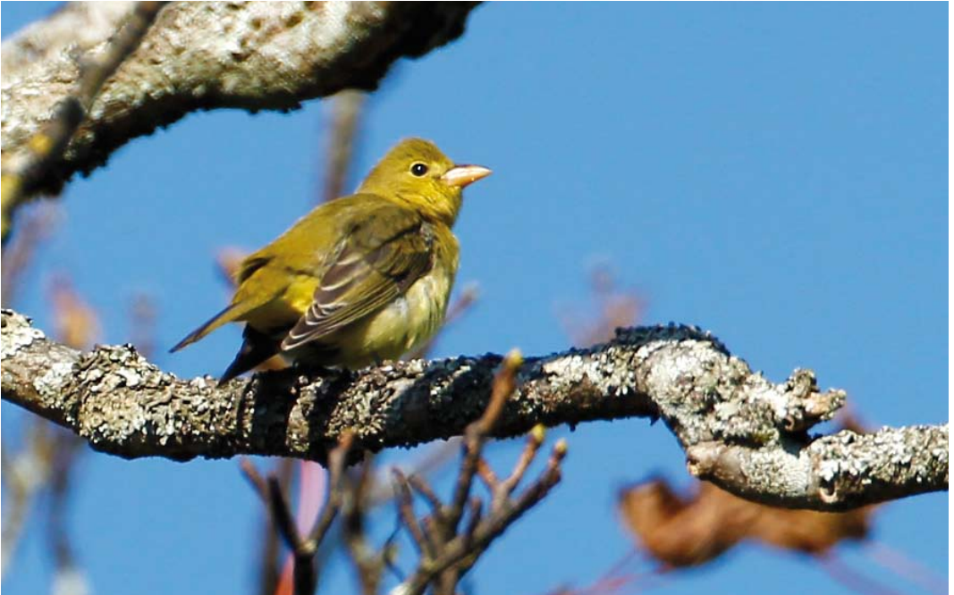
547 Scarlet Tanager / Zwartvleugeltangare Piranga olivacea , first-year male, Barra, Outer Hebrides, Scotland, 8 October 2014