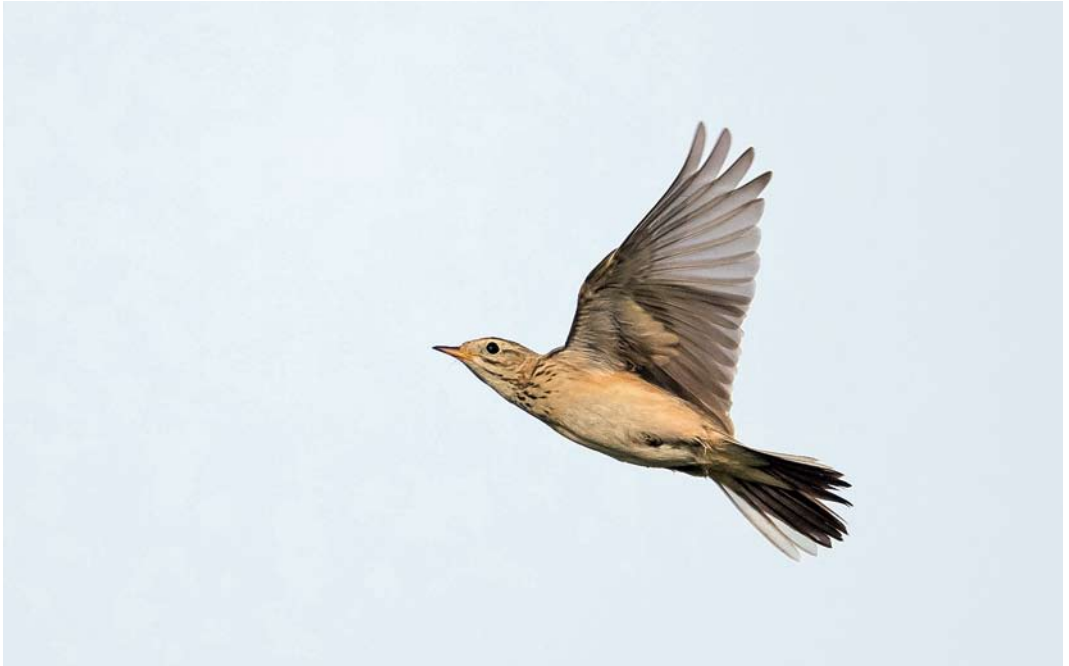
559 Blyth's Pipit / Mongoolse Pieper Anthus godlewskii , first-year, Kieldrecht, Oost-Vlaanderen, Belgium, 25 October 2014 ( Chris Steeman )