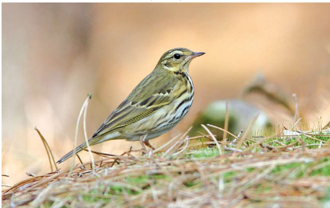
576 Siberische Boompieper / Olive-backed Pipit Anthus hodgsoni , Vlieland, Friesland, 4 oktober 2014