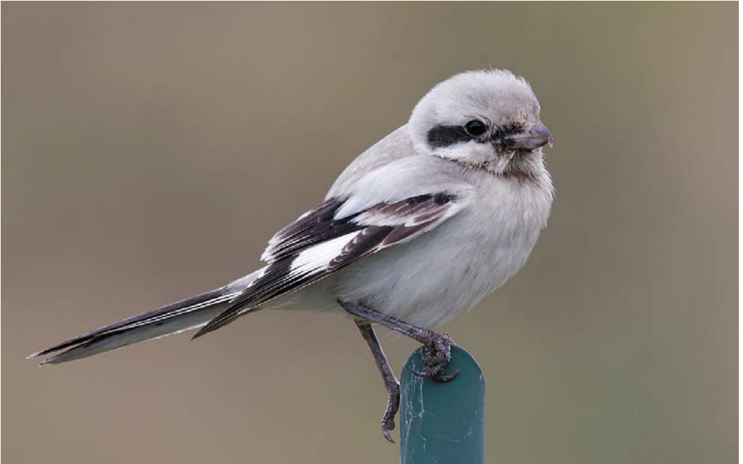
570 Steppeklapekster / Steppe Grey Shrike Lanius lahtora pallidirostris , eerstejaars, Den Helder, Noord-Holland, 25 oktober 2014 (Eric Menkveld) 571 IZabelklauwier / isabelline shrike Lanius isabellinus/phoenicuroides , tweedekalenderjaar vrouwtje, Westerduinen, Texel, Noord-Holland, 11 oktober 2014 (Eric Menkveld) 572 Daurische Klauwier / Daurian Shrike Lanius isabellinus , eerstejaars, Wimmenummerduinen, Egmond aan Zee, Noord-Holland, 18 oktober 2014 (Eric Menkveld)