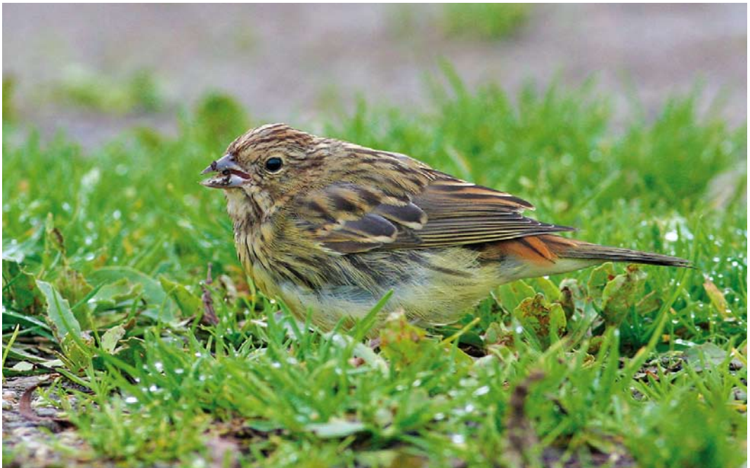
556 Chestnut Bunting / Rosse Gors Emberiza rutila , first-year, Ouessant, Finistère, France, 24 October 2014 (Julien Piette)