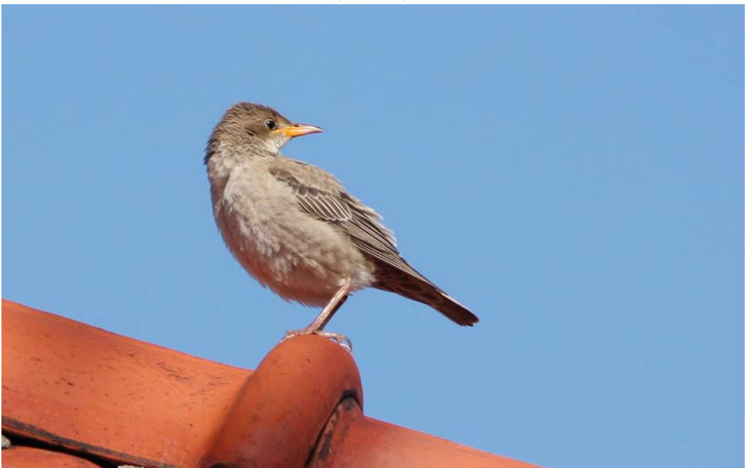
580 Roze Spreeuw / Rosy Starling Pastor roseus , juveniel, Den Helder, Noord-Holland, 16 oktober 2014