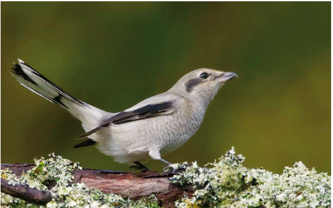
558 American Northern Shrike / Amerikaanse Noordelijke Klapekster Lanius borealis borealis , first-year, Caldeira, Corvo, Azores, 18 October 2014 ( David Monticelli )