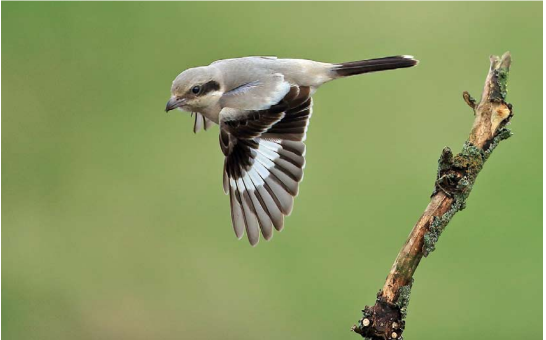
557 Steppe Grey Shrike / Steppeklapekster Lanius lahtora pallidirostris , first-year, Burnham Norton, Norfolk, England, 12 October 2014