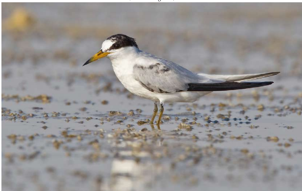
22 Saunders's Tern / Saunders' Dwergstern Sternula saundersi , first-summer, Ras Sudr, Sinai, Egypt, 25 July 2013 (Vincent Legrand)