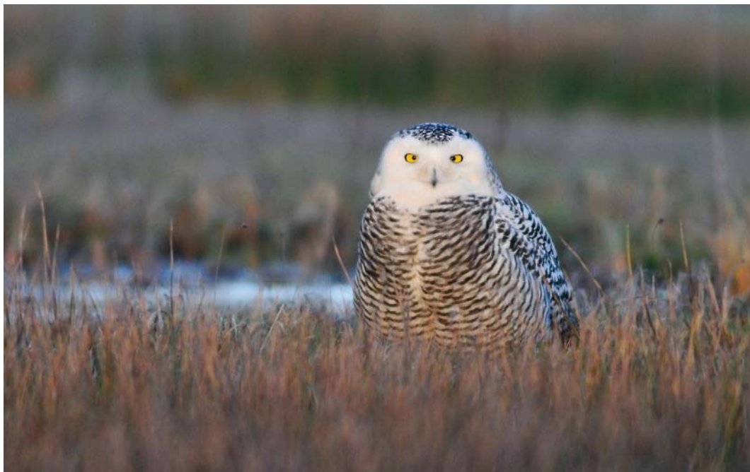
90 Sneeuwuil / Snowy Owl Bubo scandiacus , eerste-winter vrouwtje, De Cocksdorp, Texel, Noord-Holland, 28 december 2013 ( René Pop )