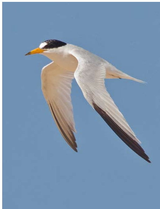
20-21 Saunders's Tern / Saunders' Dwergstern Sternula saundersi , adult, Ras Sudr, Sinai, Egypt, 25 July 2013