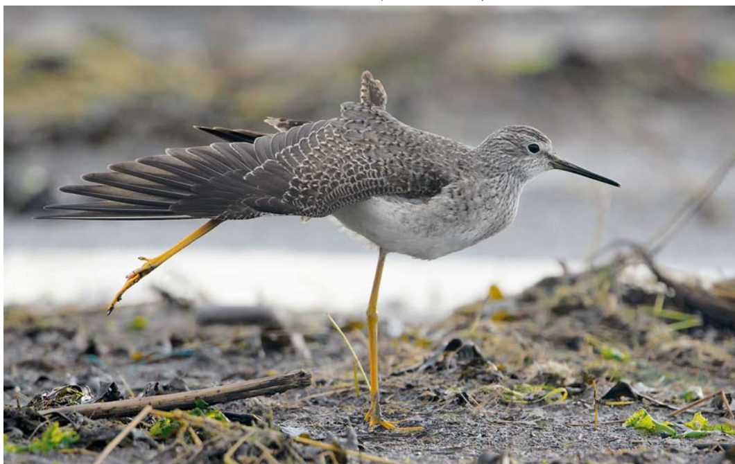
67 Kleine Geelpootruiter / Lesser Yellowlegs Tringa flavipes , eerste-winter, Vatrop, Noord-Holland, 28 december 2013 ( Frans Bruinsma )