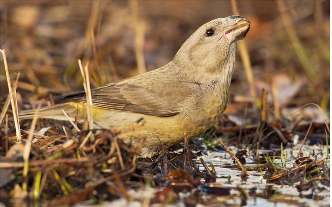
62 Parrot Crossbill / Grote Kruisbek Loxia pytyopsittacus , female, Lanaken, Limburg, Belgium, 2 January 2014