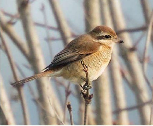
97 Bruine Klauwier / Brown Shrike Lanius cristatus , tweede-kalenderjaar, Azewijnsche Broek, Gelderland, 19 januari 2014 (Arno ten Hoeve)