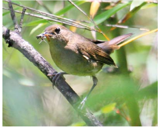
41 Blackthroat / Zwartkeelnachtegal Calliope obscura , female, Changqing NP, Shaanxi, China, 23 June 2012