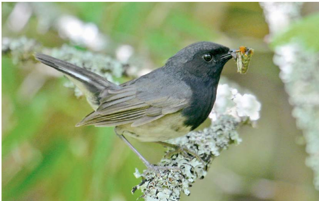
38 Blackthroat / Zwartkeelnachtegal Calliope obscura , male, Changqing NP, Shaanxi, China, 23 June 2012