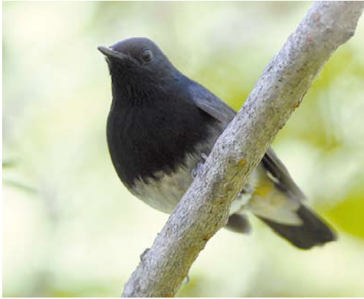
40 Blackthroat / Zwartkeelnachtegal Calliope obscura , male, Changqing NP, Shaanxi, China, 4 June 2013