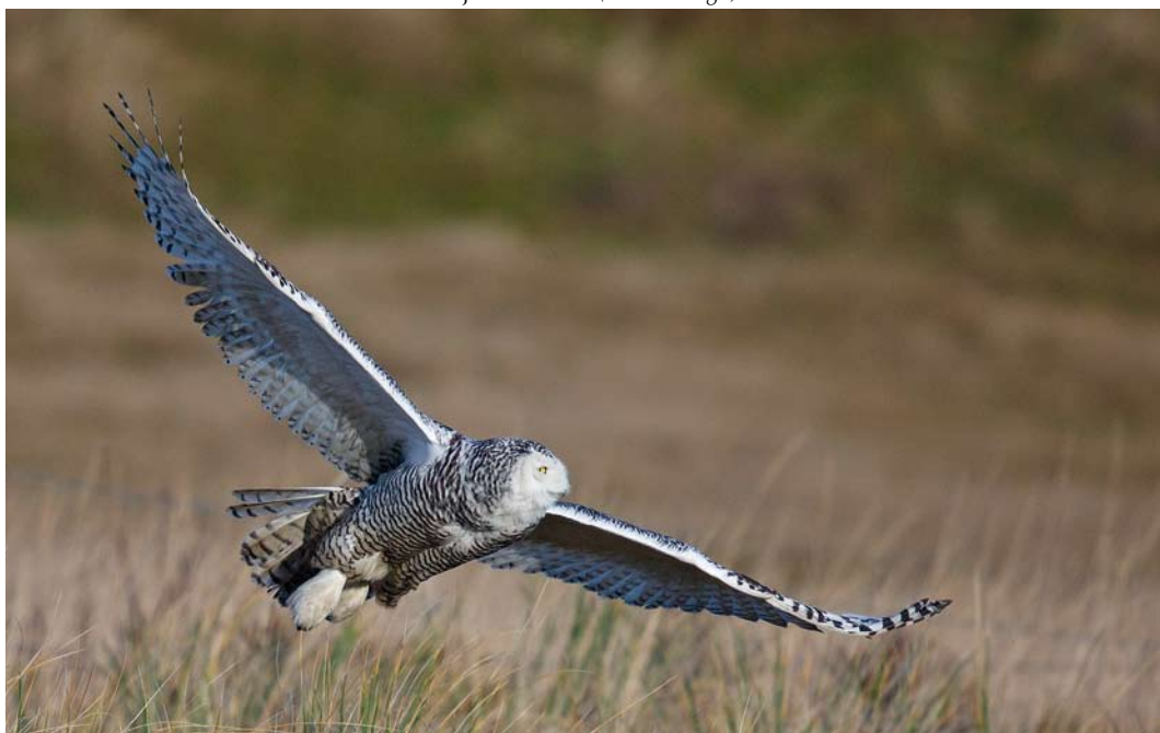
91 Sneeuwuil / Snowy Owl Bubo scandiacus , eerste-winter vrouwtje, Pad van Twintig, Vlieland, Friesland, 17 januari 2014 ( Frank Dröge )