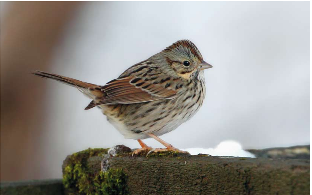
61 Lincoln's Sparrow / Lincolns Gors Melospiza lincolnii , Hafnarfjörður, Iceland, 9 December 2013 (Sindri Skúlason)