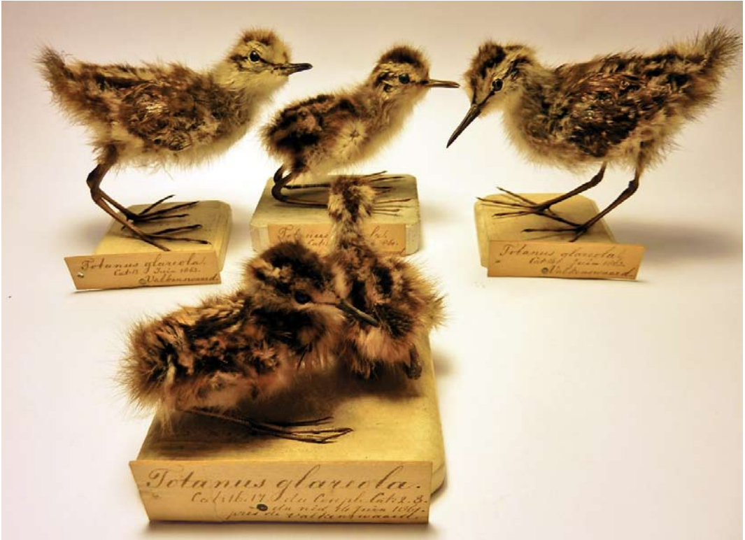
15 Wood Sandpipers / Bosruiters Tringa glareola , five hatchlings (collected at Valkenswaard, Noord-Brabant, on 31 May 1861, 14 June 1861 (two) and June 1863 (two)), Naturalis Biodiversity Center, Leiden, Netherlands, 11 February 2013 (Justin J F Jansen). Collected by local people employed by A Bots and P Jaspers, who sold these birds to Hermann Schlegel in Leiden, on the latter's request. The same men also sold eggs to various English collectors in subsequent periods.

from five nests are preserved in various museums, with an additional clutch, comprising an unknown number of eggs, mentioned in the Merckelbach notebook (see below). Comprehensive data are known from 17 clutches. The earliest date in the year on which a clutch was collected was 11 May, while the latest was in July. Clutches were found in the first half of May (five), the second half of May (eight), the first half of June (three) and the second half of June (one). Young were collected as early as 31 May (indicating that egg laying occurred around 6 May, based on an incubation period of 22-23 days; Cramp & Simmons 1983). This accords with the clutch of four eggs found on 11 May (laying interval 1-2 days; Cramp & Simmons 1983).