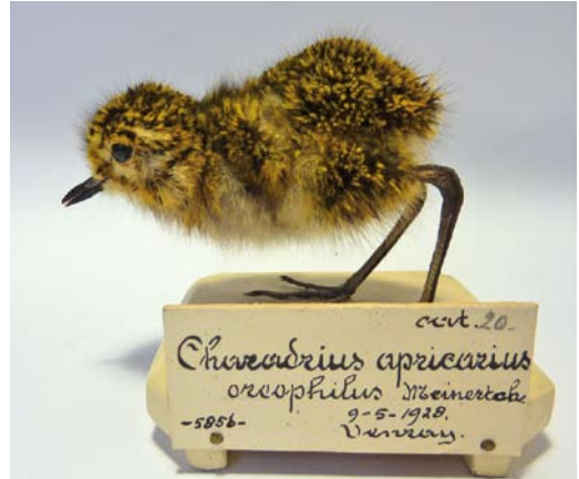
12 Eurasian Golden Plover / Goudplevier Pluvialis apricaria apricaria , hatchling (collected at Nieuwe Weg, Westerbeek, Noord-Brabant, Netherlands, on 9 May 1928), Naturalis Biodiversity Center, Leiden, Netherlands, 11 February 2013 (Justin J F Jansen)

University of Manchester, Manchester, England (MMUM); Natuurmuseum Brabant, Tilburg, the Netherlands (NBNM); Naturalis Biodiversity Center, Leiden, the Netherlands (Naturalis; containing the collections of former Rijksmuseum van Natuurlijke Historie, Leiden, and former Zoologisch Museum Amsterdam, Amsterdam, the Netherlands); Natuurmuseum Fryslân, Leeuwarden, the Netherlands (NMF); Amgueddfa Cymru – National Museum Wales, Cardiff, Wales (NMW); Natural History Museum (former British Museum of Natural History), Tring, England (NHM); and University Museum of Zoology Cambridge, Cambridge, England (UMZC).