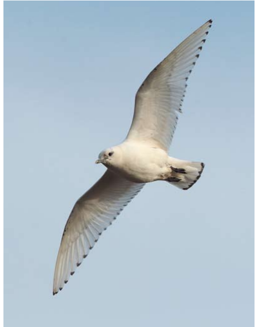
54 Ivory Gull / Ivoormeeuw Pagophila eburnea , first-year, Patrington, East Yorkshire, England, 19 December 2013 ( Glyn Sellors ) 55 Ivory Gull / Ivoormeeuw Pagophila eburnea , first-year, Patrington, East Yorkshire, England, 22 December 2013 ( Dave Barnes ) 56 Ivory Gull / Ivoormeeuw Pagophila eburnea , first-year, and Snowy Owl / Sneeuwuil Bubo scandiacus , Hanstholm, Nordjylland, Denmark, 22 December 2013 ( Kenneth Bach Christensen )