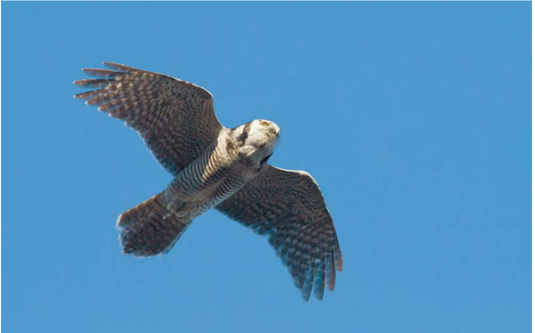
7 Sperweruil / Northern Hawk-Owl Surnia ulula , Zwolle, Overijssel, 12 januari 2014 (Herman Bouwman) 8 Sperweruil / Northern Hawk-Owl Surnia ulula , Zwolle, Overijssel, 31 december 2013 (Sam Woods) 9 Sperweruil / Northern Hawk-Owl Surnia ulula , Zwolle, Overijssel, 6 januari 2014 (Jaap Denee)