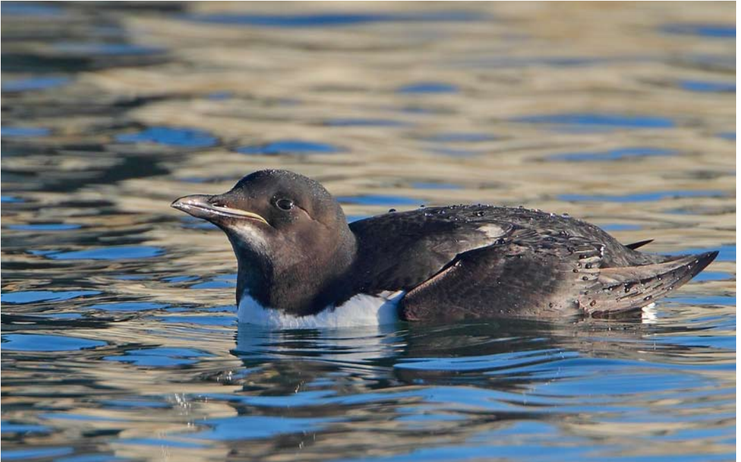
48 Thick-billed Murre / Kortbekzeekoet Uria lomvia , Portland harbour, Dorset, England, 29 December 2013