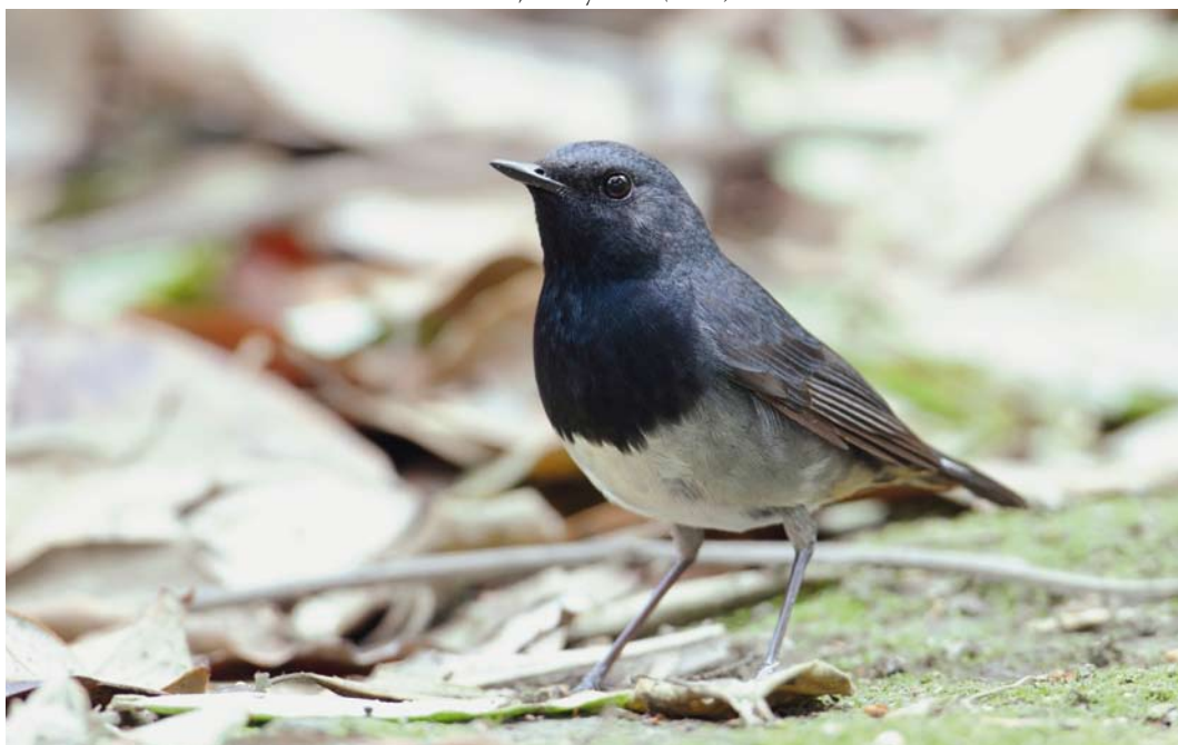
39 Blackthroat / Zwartkeelnachtegal Calliope obscura , first-summer male, Sichuan University, Shengdu, Sichuan, China, 2 May 2011 (He Yi)