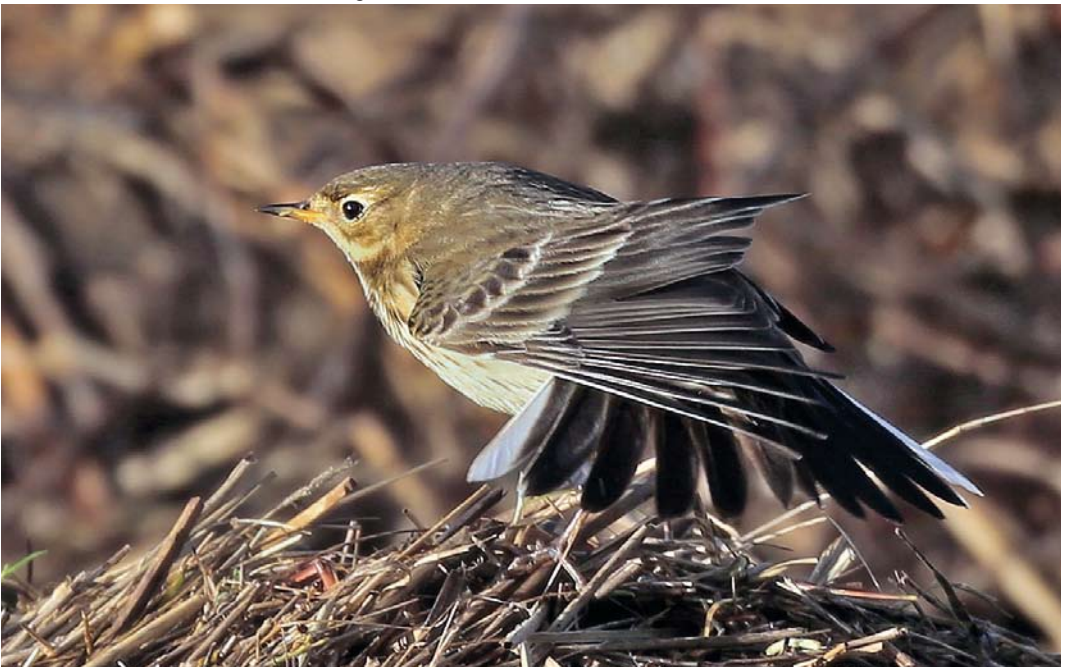
63 American Buff-bellied Pipit / Amerikaanse Waterpieper Anthus rubescens rubescens , Burton Marsh, Cheshire, England, 21 December 2013 (Dave Kelsall)