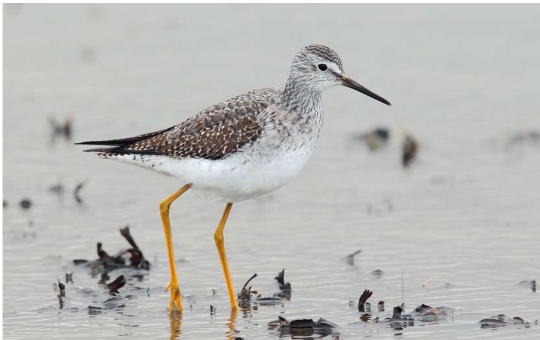
66 Kleine Geelpootruiter / Lesser Yellowlegs Tringa flavipes , eerste-winter, Vatrop, Noord-Holland, 16 december 2013