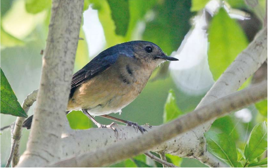
37 Firethroat / Père Davids Nachtegaal Calliope pectardens , first-winter male, North 24 Parganas district, West Bengal, India, 11 March 2012 ( Kshounish S Ray )

2500 m in large, dense expanses of bamboo in open coniferous and mixed coniferous-broad-leaved forest. The species has in the past also been recorded from Jiuzhaigou and Baihe Nature Reserves in Sichuan and Taibai Shan National Nature Reserve in Shaanxi. Forest cover has declined rapidly in Sichuan since the late 1960s, through exploitation of timber and clearance for cultivation and pasture, and substantial areas of temperate forest have been lost; clearing of bamboo forest may have affected Blackthroat in particular and explain, eg, the disappearance from Jiuzhaigou (James Eaton in litt). A number of protected areas established for Giant Panda Ailuropoda melanoleuca contain potentially suitable habitat but the species' distribution in these areas is poorly known (BirdLife International 2013b).