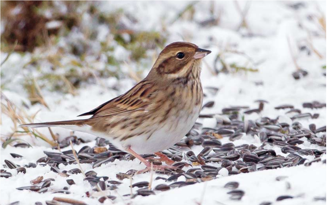
60 Black-faced Bunting / Maskergors Emberiza spodocephala , first-winter female, Ratvika, Møre og Romsdal, Norway, 10 December 2013