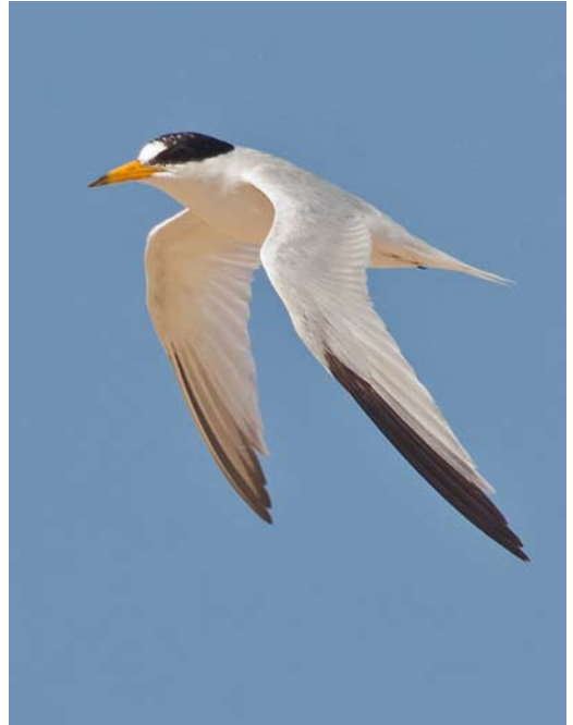
20-21 Saunders's Tern / Saunders' Dwergstern Sternula saundersi , adult, Ras Sudr, Sinai, Egypt, 25 July 2013