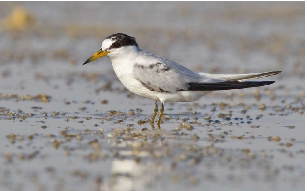
22 Saunders's Tern / Saunders' Dwergstern Sternula saundersi , first-summer, Ras Sudr, Sinai, Egypt, 25 July 2013