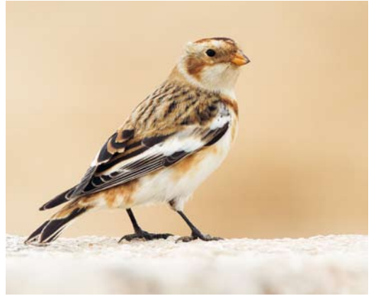
65 Snow Bunting / Sneeuwgor Plectrophenax nivalis , first-year male, Acre, Israel, 26 December 2013

was the first for Denmark since 1959 (when the species became extinct as a breeder). A Brown Shrike Lanius cristatus at Azewijnsche Broek, Achterhoek, Gelderland, from 18 January onwards was the first for the Netherlands and the c 27th for Europe (of which 10 were in Scotland and seven in England). The first Streak-throated Swallow Petrochelidon iluvicola for Kuwait and second for the WP sensu BWP was photographed at Jahra Pools Reserve, Al-Jahra, on 6-7 December; the first for the WP was in Egypt on 19 November 2003.