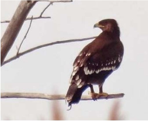
58 Greater Spotted Eagle / Bastaardarend Aquila clanga , first-year, Daimiel, Ciudad Real, Castilla-La Mancha, Spain, 30 December 2013 (Edward J van IJzendoorn)