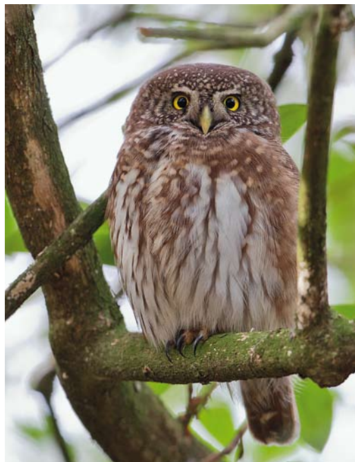
76 Sneeuwuil / Snowy Owl Bubo scandiacus , eerste-winter vrouwtje, De Cocksdoorp, Texel, Noord-Holland, 28 december 2013 77 Dwerguil / Eurasian Pygmy Owl Glaucidium passerinum , Lettele, Overijssel, 4 januari 2014 78 Sneeuwuil / Snowy Owl Bubo scandiacus , eerste-winter vrouwtje, Pad van Twintig, Vlieland, Friesland, 13 januari 2014