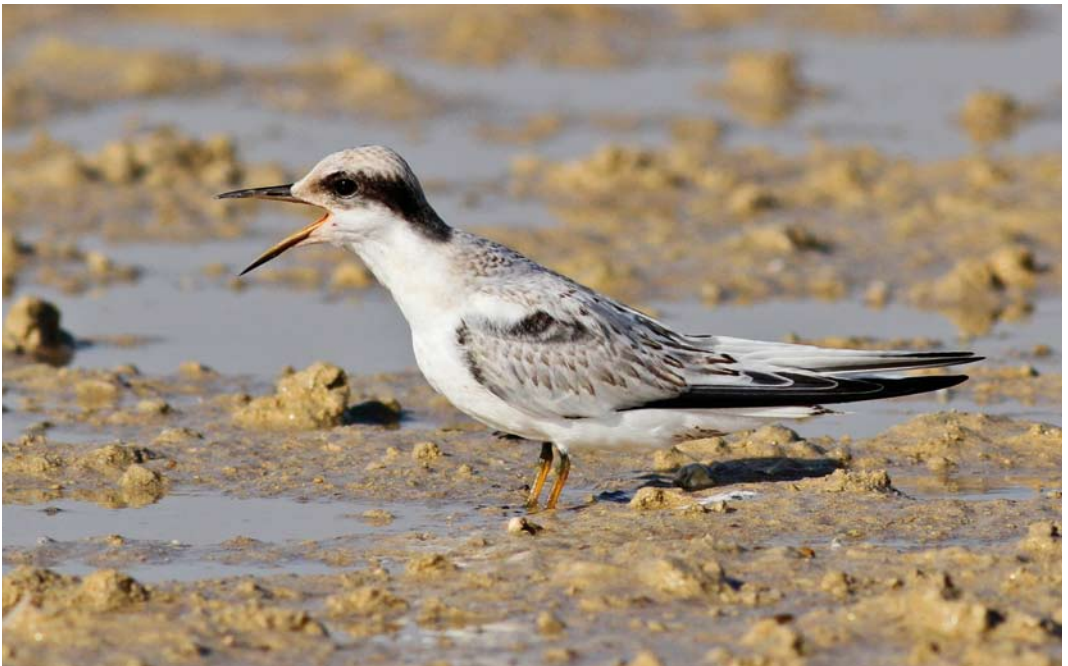
24 Saunders's Tern / Saunders' Dwergstern Sternula saundersi , juvenile, Ras Sudr, Sinai, Egypt, 25 July 2013 (Richard Bonser)