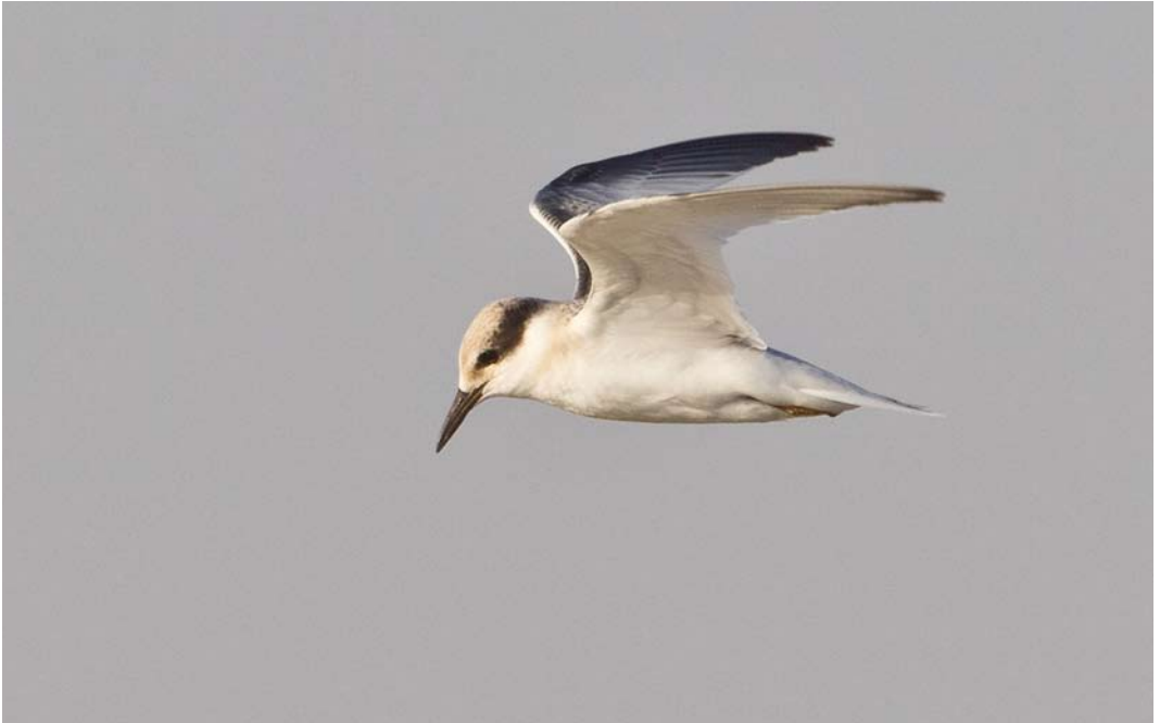
23 Saunders's Tern / Saunders' Dwergstern Sternula saundersi , juvenile, Ras Sudr, Sinai, Egypt, 25 July 2013 (Vincent Legrand)