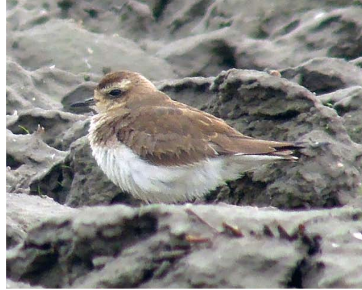
96 Kaspische Plevier / Caspian Plover Charadrius asiaticus , eerste-winter, Wissenkerke, Zeeland, 18 januari 2014 (Kris De Rouck)

op met een aantal Kieviten en verdween in westelijke richting. Zoekacties leverden in de laatste paar uur daglicht niets meer op; enkele 10-tallen vogelaars waren vergeefs gekomen. De volgende ochtend duurde het een paar uur totdat Hans Moerman en Hugo Moerman hem tussen enkele Watersnippen Gallinago gallinago terugvonden op een geploegde akker nabij Wissenkerke. Hier werd hij tot 12:30 waargenomen en de dagen erna was hij met enige moeite steeds terug te vinden op akkers in de omgeving, vaak solitair en lastig te zien tussen de kleihopen of de lage begroeiing. Op zaterdag en zondag trok hij in totaal enkele 100en belangstellenden en daarna enkele 10-tallen op doordeweekse dagen en weer meer dan 100 in het weekend van 18-19 januari; onder de bezoekers waren veel vogelaars uit België en enkele uit Brittannië, Duitsland en Frankrijk. De vogel werd gezien tot ten minste 26 januari.