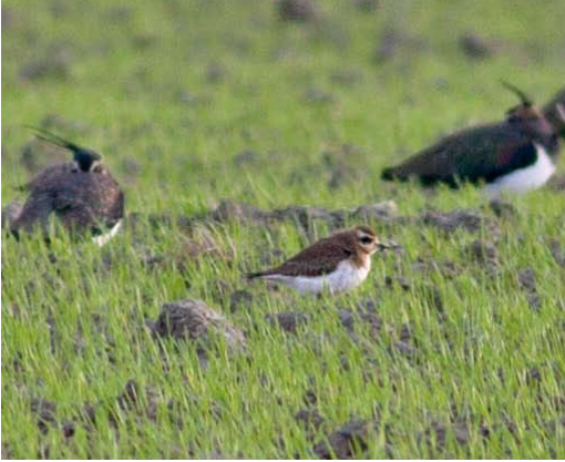
95 Kaspische Plevier / Caspian Plover Charadrius asiaticus , eerste-winter, met Kieviten / Northern Lapwings Vanellus vanellus , Colijnsplaat, Zeeland, 10 januari 2014