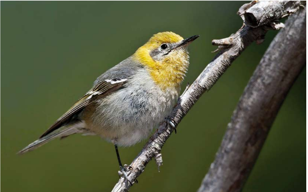
182 Olive Warbler / Oranjekopzanger Peucedramus taeniatus , first-summer male, Cochise County, Arizona, USA, 2 May 2011 ( Brian E Small )