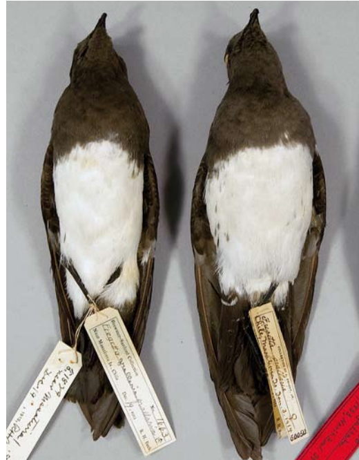
130 White-bellied Storm Petrels / Witbuikstormvogeltjes Fregatta grallaria segethi (collected off or on Robinson Crusoe, Chile, 3 January 1914 (right) and 19 December 1913), American Museum of Natural History, New York, USA, 25 October 2014. Note variation in flank streaking, corresponding to birds photographed at sea (cf plate 131-133).

A dark morph prominently occurs in the nominate subspecies F g gallaria (hereafter gallaria ) that breeds on Lord Howe Island, Australia (pers obs; Murphy & Snyder 1952, Serventy et al 1971, Van Tets & Fullagar 1984, Spear & Ainley 2007; plate 135). This morph was even described as a separate species by Mathews (1914) but soon after