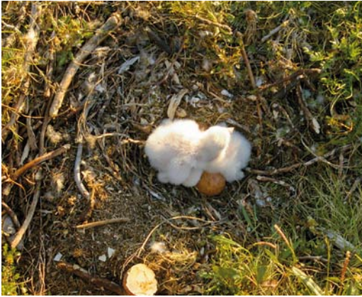
119 Nest of Tundra Peregrine Falcon Falco peregrinus calidus , Nenetsky Nature reserve, Nenets, Siberia, Russia, 9 July 2011. Nest with one pullet hatching; one young from this nest was found injured near Nuoro, Sardinia, Italy, on c 20 November 2011.