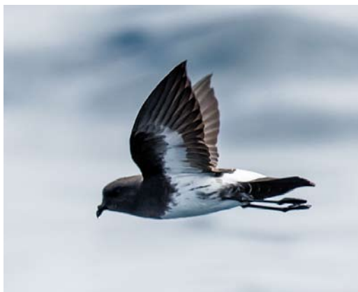
131-133 White-bellied Storm Petrel / Witbuikstormvogeltje Fregetta grallaria , off Robinson Crusoe, Chile, 21 February 2015. F. g. segethi of Juan Fernández archipelago also varies in dark streaking on flanks, a feature found in c 80% of birds, but with moderate to extensive streaking (plate 132-133) occurring in only c 15% of birds. All birds showed here are estimated to be of small type.

may have been a vagrant of the dark morph of grallaria from Lord Howe, considering its strong resemblance in plumage to the latter (cf plate 134-135) and which is the only subspecies for which a dark plumage has been documented. If so, the Masafuera bird originated from at least 10 500 km away (in a straight line from Lord Howe to Masafuera). More chumming sessions as well as night trapping on Masafuera are required to elucidate the status of this dark storm petrel.