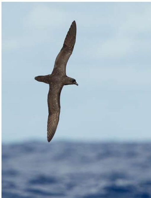
167-168 Mascarene Petrel / Réunionstormvogel Pseudobulweria aterrima , off Réunion, Indian Ocean, 22 December 2012 ( Hadoram Shirihai/©Tubenoses Project ) 169 Mascarene Petrel / Réunionstormvogel Pseudobulweria aterrima , off Réunion, Indian Ocean, 22 December 2012 ( Hadoram Shirihai/©Tubenoses Project ). Note visible bulge from egg in uterus (cf plate 178).