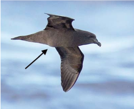
178 Mascarene Petrel / Réunionstormvogel Pseudobulweria aterrima , adult female, off Réunion, Indian Ocean, 22 December 2012. Note bulge from egg in uterus.

the weight of the adult female and it is known that Pterodroma species can have an egg 50% the length of the body. Once in the uterus, the egg of a petrel can be visible and its outline obvious when in the hand.