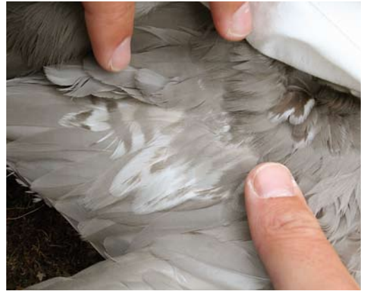
137 Long-tailed Jaeger / Kleinste Jäger Stercorarius longicaudus, adult, Björkfjället, Ammarnäs, Västerbotten, Sweden, 20 June 2011. Same bird as plate 136 and 138-139. 138 Long-tailed Jaeger / Kleinste Jäger Stercorarius longicaudus, adult, Björkfjället, Ammarnäs, Västerbotten, Sweden, 12 June 2010. Detail of right underwing. Same bird as plate 136-137 and 139. 139 Long-tailed Jaeger / Kleinste Jäger Stercorarius longicaudus, adult, Björkfjället, Ammarnäs, Västerbotten, Sweden, 12 June 2010. Detail of left underwing. Same bird as plate 136-138.

Long-tailed and Parasitic. Hence, jaegers showing these features cannot be aged with any certainty.