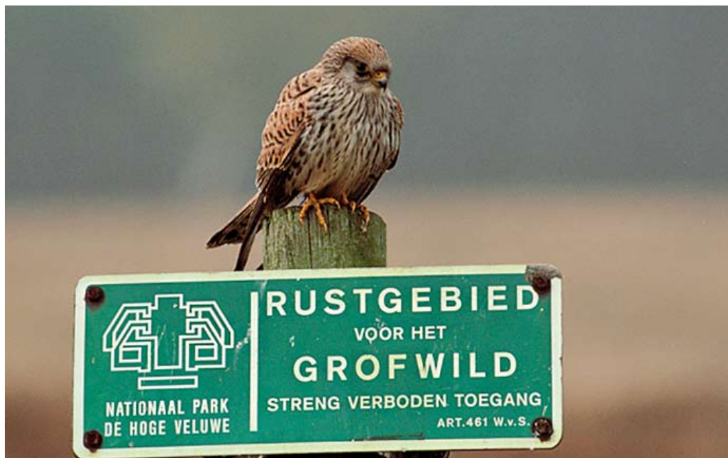
158 Kleine Torenvalk / Lesser Kestrel Falco naumanni , vrouwtje, De Hoge Veluwe, Gelderland, 23 maart 2002

kening op mantel, schouder, rug, stuit en kleine en middelste vleugeldekveren (alleen bruikbaar in vergelijking met nominaat Torenvalk F tinnunculus ), vorm van de streping van de borst (alleen bruikbaar als zekere juveniele exemplaren van beide soorten vergeleken worden), en (in zit) afstand tussen staartpunt en vleugelpunt. Deze verschillen tonen echter enige overlap tussen beide soorten. De afronding van de staart, bij volwassen mannetjes vaak een kenmerkend verschil (verschil tussen t1 en t6 relatief groot bij Kleine Torenvalk), geldt niet als determinatiekenmerk voor vrouwtjes omdat de overlap met Torenvalk aanzienlijk is (cf Clark 1996, Forsman 1999, Corso 2001, Ferguson-Lees & Christie 2001, van Duivendijk 2011; Nils van Duivendijk in litt). De lichte nagels zijn echter een uniek kenmerk voor Kleine in alle kleden en sluiten andere kleine valken uit en op basis hiervan is de vogel van De Hoge Veluwe als Kleine te determineren.