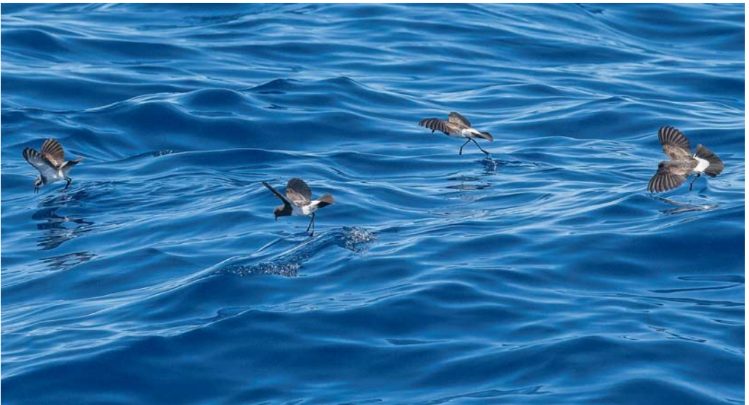
128 White-bellied Storm Petrels / Witbuikstormvogeltjes Fregetta grallaria , off Robinson Crusoe, Chile, 6 March 2013 ( Hadoram Shirihai /© Tubenoses Project ). Small (left) and large type (right) side by side. Latter constantly appearing distinctly larger overall, at sea estimated to be at least 15-20% larger than small type. 129 White-bellied Storm Petrels / Witbuikstormvogeltjes Fregetta grallaria , off Robinson Crusoe, Chile, 6 March 2013 ( Hadoram Shirihai /© Tubenoses Project ). Small type (two birds at centre) appearing about same size as White-faced Storm Petrels Pelagodroma marina , both being clearly smaller by at least 15-20% than large type (rightmost bird). At sea, large type constantly appearing heavier/deeper-bodied and notably larger headed, and also clearly longer and broader winged. As stated in main text, however, only when these storm petrels could be handled for biometrics it will be possible to determine whether these size differences are indeed representing different populations or taxa, rather than extreme individual variation. Note also large bird on right showing stronger-patterned upperparts, with heavy white-and-black scales.