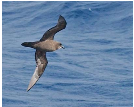
170-171 Mascarene Petrel / Réunionstormvogel Pseudobulweria aterrima , off Réunion, Indian Ocean, 22 December 2012 (Hadoram Shirihai/©Tubenoses Project) 172 Great-winged Petrel / Langvleugelstormvogel Pterodroma macroptera , off Durban, South Africa, 22 November 2013 (Hadoram Shirihai/©Tubenoses Project). On first appearance, practically identical to Mascarene Petrel Pseudobulweria aterrima (cf plate 170) but see main text. 173 Great-winged Petrel / Langvleugelstormvogel Pterodroma macroptera , off Crozet Islands, 25 March 2004 (Hadoram Shirihai/©Tubenoses Project)

at sea (eg, Attié et al 1997), none documented plumage, behaviour and other aspects in detail. There were some putative photographs but we have now shown these to be of birds incorrectly identified. Therefore, the accompanying plates are the first photographs taken of the species at sea.