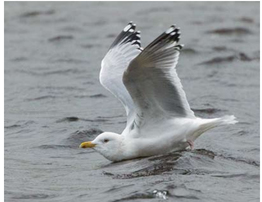
190 Smithsonian Gull / Amerikaanse Zilvermeeuw Larus smithsonianus , adult, Lires, A Coruña, Spain, 5 February 2015 ( Martin Gottschling ) 191 Kumlien's Gull / Kumliens Meeuw Larus glaucooides kumlieni , first-winter, Aveiro, Portugal, 7 March 2015 ( David Monticelli ) 192 Bonaparte's Gull / Kleine Kokmeeuw Chroicocephalus philadelphia , adult winter, Cariño, A Coruña, Spain, 3 February 2015 ( Martin Gottschling ) 193 Smithsonian Gull / Amerikaanse Zilvermeeuw Larus smithsonianus , adult, Lires, A Coruña, Spain, 1 March 2015 ( David Monticelli )

WADERS In the Azores, up to seven (on 1 February) Semipalmated Plovers Charadrius semipalmatus were present at Cabo da Praia, Terceira, from late January to at least 16 February. In the Cape Verde Islands, single Least Sandpipers Calidris minutilla were photographed on Sal on 21 January and on Boa Vista on 11 February. The Spotted Sandpiper Actitis macularius at Hamrarna, Fårabäck, Skåne, from 25 November 2014 to at least 9 February was the eighth for Sweden. The fourth for the Netherlands was present at Medemblik, Noord-Holland, from 19 January into March. In the Azores, one was seen on Pico on 22 February. Also in the Azores, up to two Hudsonian Whimbrels Numenius hudsonicus and a first-winter Short-billed Dowitcher Limnodromus griseus stayed at Cabo da Praia until at least 17 March and three Wilson's Snipes Gallinago delicata were seen at Lagoa do Ginjal, Santa Maria, on 11 February.