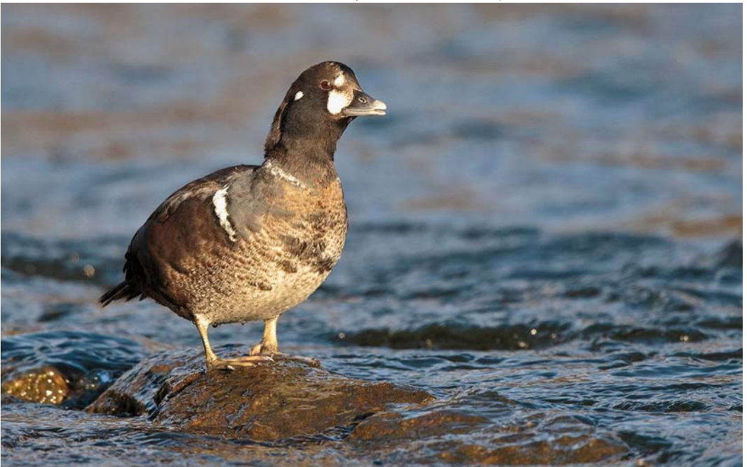
187 Harlequin Duck / Harlekijneend Histrionicus histrionicus , first-winter male, Donmouth, Aberdeenshire, Scotland, 5 February 2015