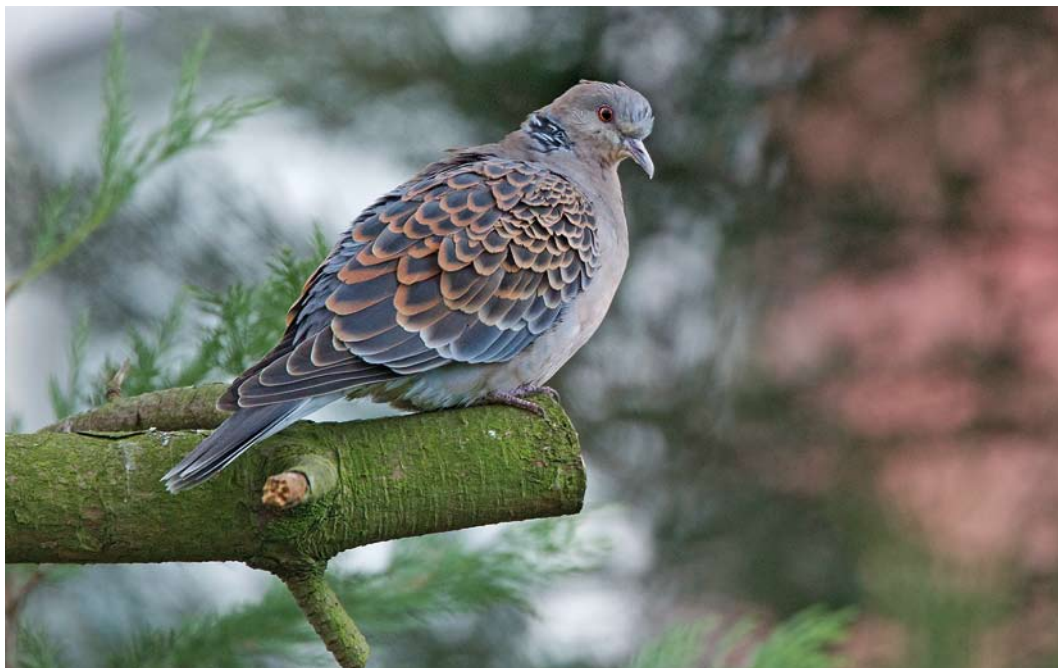
212 Oosterse Tortel / Oriental Turtle Dove Streptopelia orientalis , Vlaardingen, Zuid-Holland, 31 januari 2015 (Harvey van Diek)