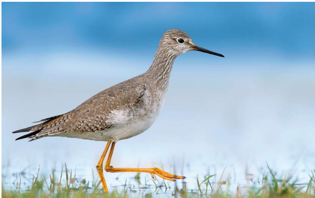
200 Kleine Geelpootruiter / Lesser Yellowlegs Tringa flavipes , adult-winter, Schokland, Flevoland, 27 februari 2015