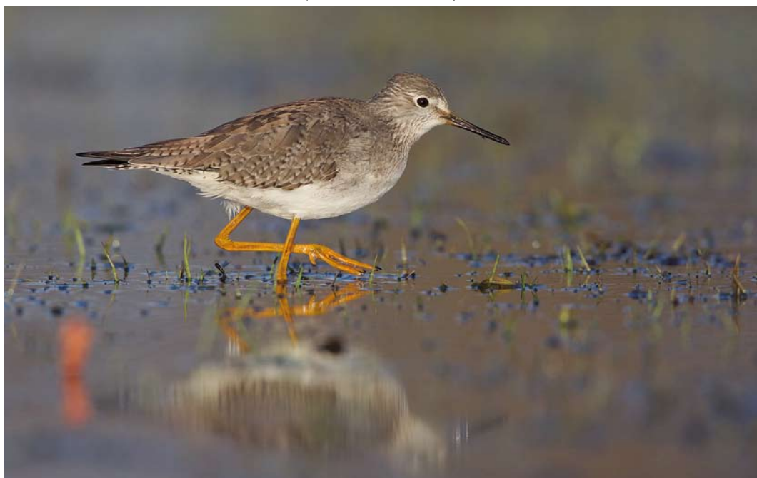
201 Kleine Geelpootruiter / Lesser Yellowlegs Tringa flavipes , adult-winter, Schokland, Flevoland, 27 februari 2015 (Martin van der Schalk)