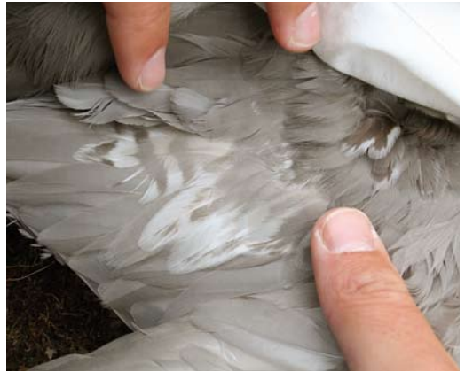
137 Long-tailed Jaeger / Kleinste Jäger Stercorarius longicaudus, adult, Björkfjället, Ammarnäs, Västerbotten, Sweden, 20 June 2011. Same bird as plate 136 and 138-139. 138 Long-tailed Jaeger / Kleinste Jäger Stercorarius longicaudus, adult, Björkfjället, Ammarnäs, Västerbotten, Sweden, 12 June 2010. Detail of right underwing. Same bird as plate 136-137 and 139. 139 Long-tailed Jaeger / Kleinste Jäger Stercorarius longicaudus, adult, Björkfjället, Ammarnäs, Västerbotten, Sweden, 12 June 2010. Detail of left underwing. Same bird as plate 136-138.

Long-tailed and Parasitic. Hence, jaegers showing these features cannot be aged with any certainty.