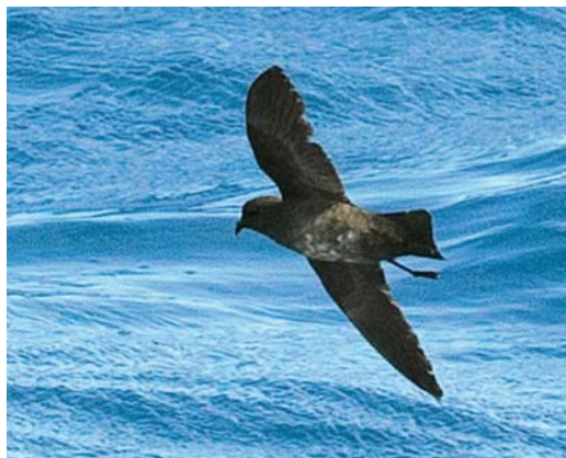
134 Storm petrel / stormvogeltje Fregetta , off Masafuera, Chile, 12 March 2013. Possible dark morph White-bellied Storm Petrel F. grallaria . This bird was not only dark plumaged, it was also clearly tiny in size and showing advanced moult, making it highly striking altogether.