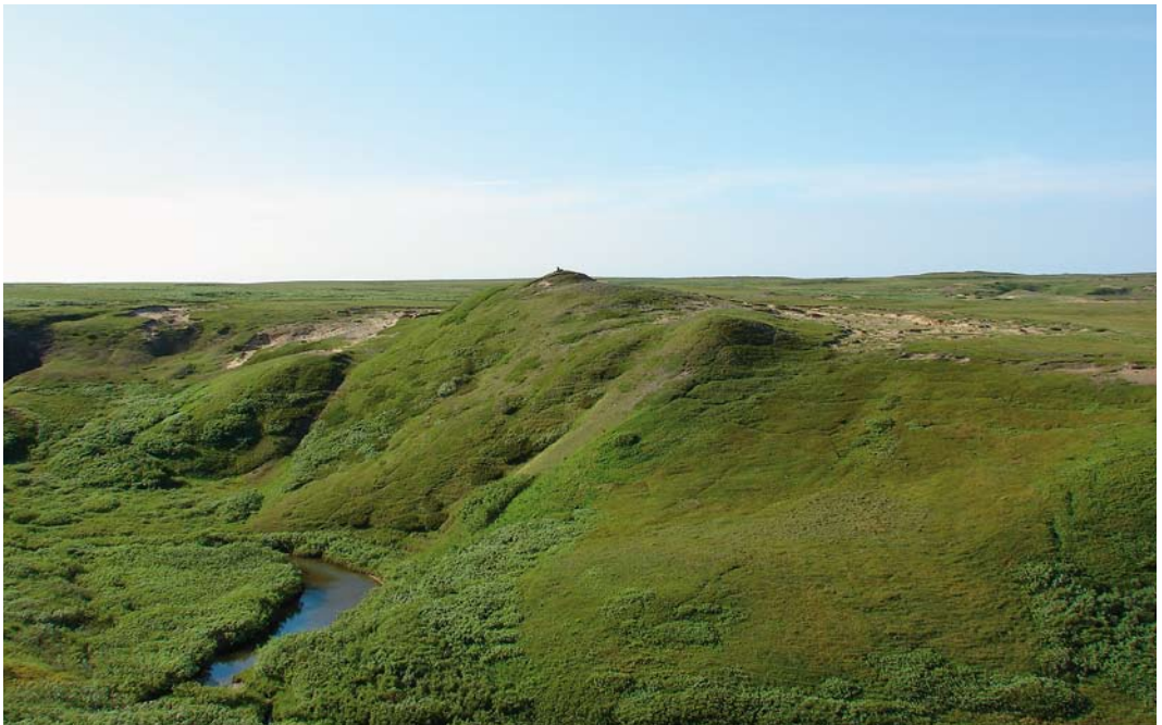
121 Breeding habitat of Tundra Peregrine Falcon Falco peregrinus calidus , Nenetsky Nature reserve, Nenets, Siberia, Russia, 7 July 2007

In Italy, calidus was considered a rare vagrant with no more than 10 records (Fasce & Fasce 1992) but more recently, Corso (2001) pointed out that the presence in Italy is overlooked because of the difficulty of identification. Contrary to historic statement, Corso (2001) considered calidus a regular winterer with an estimated population of 20-50 individuals (mostly juveniles) widespread in the southern part, mostly in Sicily and Puglia. Corso (2001) and Corso et al (2009) consider that calidus is also a regular passage migrant in Italy, occurring mostly along the Adriatic-Ionian migration flyway (coming from the east) with overshooting birds reaching the Tyrrhenian side of Italy. During the springs of 1997-2000, c 30 individuals were recorded in the Straits of Messina in April-May (Corso 2001, 2005), and 28 in 2006-08 during spring and autumn migration surveys at Pelagie Islands in the Sicilian Channel (Corso et al 2009). Besides, in 2009-11, one satellite-tagged female that wintered in Portugal (figure 1) passed through Italy on autumn and spring migration each year (except in spring 2011 when it passed north of Italy). The first