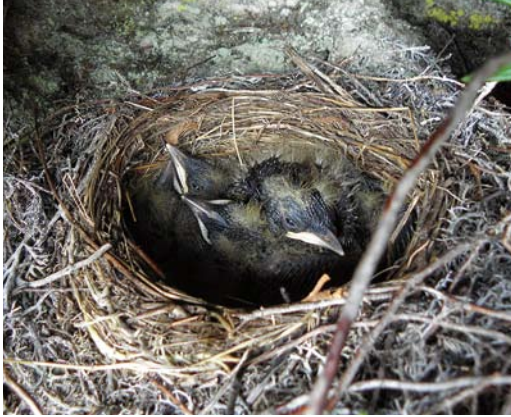
160 Ring Ouzels / Beflijsters Turdus torquatus , Northern Timan mountains, Arkhangelsk region, Russia, 27 June 2014 (Dmitry Dorofeev). Nest with pulli.