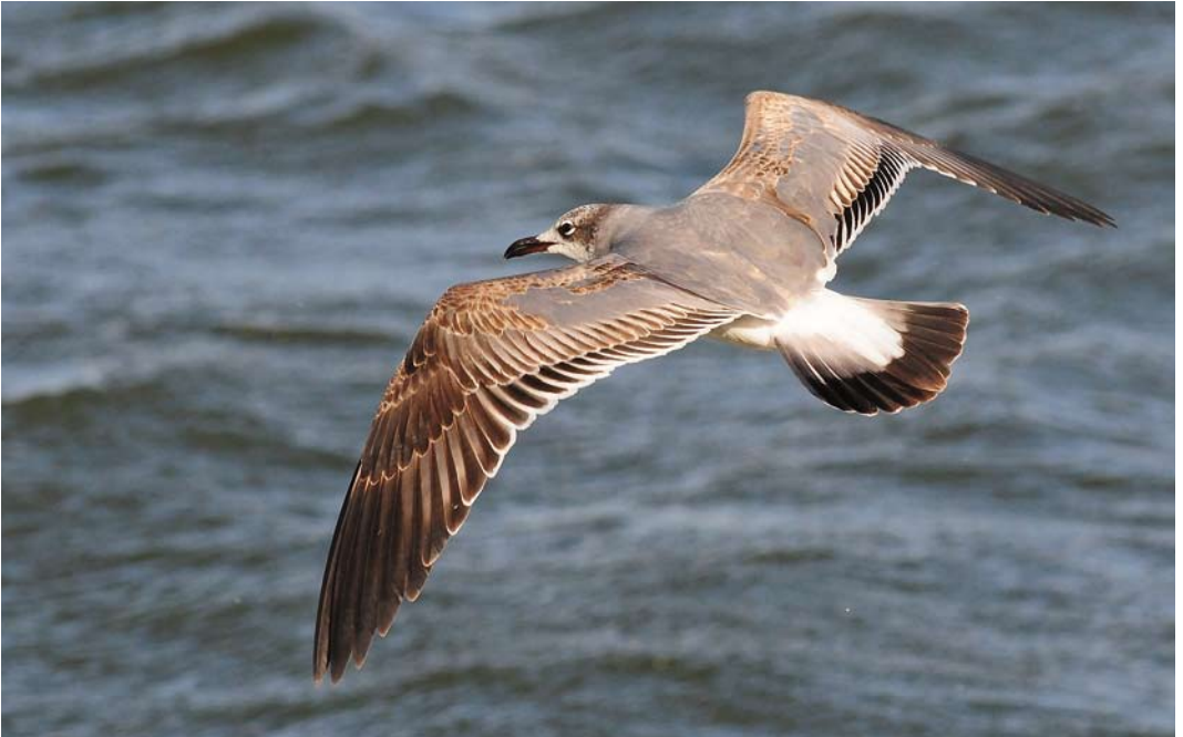
188 Laughing Gull / Lachmeeuw Larus atricilla , first-winter, New Brighton, Cheshire, England, 1 March 2015