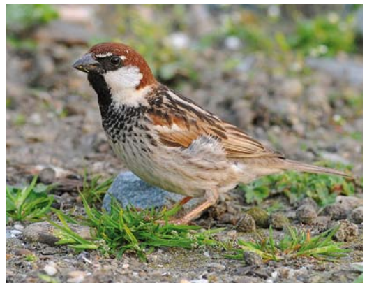
103 Spaanse Mussen / Spanish Sparrows Passer hispaniolensis , drie mannetjes en zes vrouwtjes, Eemshaven, Groningen, 9 april 2009 ( Gert-Jan Versteeg ) 104 Spaanse Mussen / Spanish Sparrows Passer hispaniolensis , twee mannetjes en drie vrouwtjes, Eemshaven, Groningen, 10 april 2009 ( Guido Meeuwissen ). Vrouwtje rechts met opvallende donkere borsttekening. 105 Spaanse Mussen / Spanish Sparrows Passer hispaniolensis , drie mannetjes en vijf vrouwtjes, Eemshaven, Groningen, 10 april 2009 ( Guido Meeuwissen ). Vrouwtje links met opvallende donkere borsttekening. 106 Spaanse Mus / Spanish Sparrow Passer hispaniolensis , mannetje, waarschijnlijk tweede-kalenderjaar, Eemshaven, Groningen, 12 april 2009 ( Roef Mulder ). Mannetje met beperkte donkere tekening op borst, buik en flank.