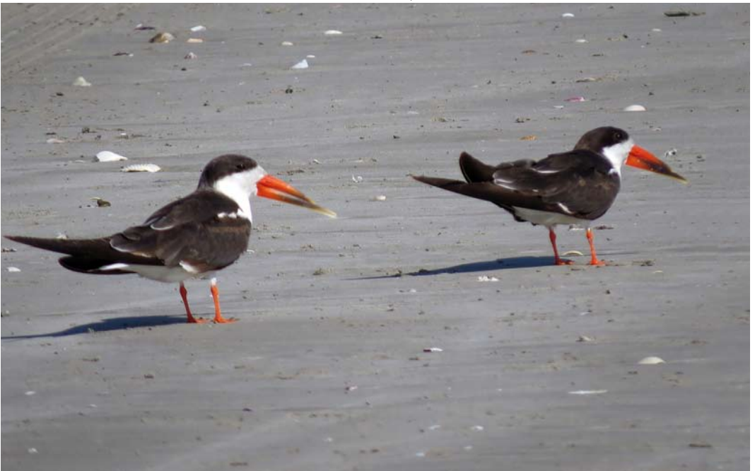
189 African Skimmers / Afrikaanse Schaarbekken Rhynchops flavirostris , Taqah, Salalah, Oman, 27 January 2015