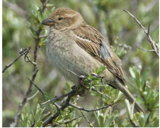
115 Spaanse Mus / Spanish Sparrow Passer hispaniolensis , vrouwtje, Zuidpier, IJmuiden, Noord-Holland, 6 mei 2010 (Jacob Garvelink)

Op zondagmiddag 26 oktober 2014 ontdekte Garry Bakker samen met Daniel Benders en Wil van den Hoven een mannetje Spaanse Mus in vers kleed ('winterkleed') langs de Missouriweg op de Maasvlakte. De vogel foerageerde in de wegberm met een aantal Vinken Fringilla coelebs . Tijdens de ontdekking zat de vogel in een hek met de borst naar de waarnemers toe en vielen de bruine kruin (zonder grijs) en zwarte tekening op borst en flanken op, wat GB direct de uitroep 'Spaanse Mus!' ontlokte. De vogel verdween snel uit beeld en