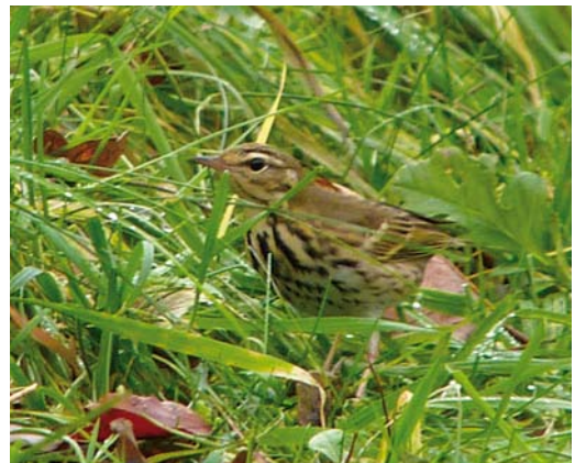
208 Roze Spreeuw / Rosy Starling Pastor roseus , eerste-winter, Vlaardingen, Zuid-Holland, 27 februari 2015 ( Eric Menkveld ) 209 Roze Spreeuw / Rosy Starling Pastor roseus , eerste-winter, Kollum, Friesland, 8 februari 2015 ( Alex Bos ) 210 Dwerggors / Little Bunting Emberiza pusilla , Zwanenwater, Callantsoog, Noord-Holland, 3 februari 2015 ( Eric Menkveld ) 211 Siberische Boompieper / Olive-backed Pipit Anthus hodgsoni , Muiderberg, Noord-Holland, 1 januari 2015 ( Conny Leijdekker-Winthorst )

dingen verbleef werd tot 25 februari waargenomen. Een tweede-kalenderjaar Kwartelkoning Crex crex werd op 11 januari dood gevonden bij Holwerd, Friesland. Winterwaarnemingen zijn extreem zeldzaam, met in januari waarschijnlijk slechts één eerder gedocumenteerd geval: op 1 januari 2002 gefilmd in Honselersdijk, Zuid-Holland ( www.youtube.com/watch?v=JtGtwGbjwb0 ). Een Kleine Trap Tetrax tetrax verbleef van 23 tot 29 januari in Polder Arnhemheen bij Nijkerk, Gelderland. Drie Ijsduikers Gavia immer op ten minste 10 en 11 februari op het Volkerak, Zuid-Holland, zijn het vermelden waard. De overwinterende Zwarte Ooievaar Ciconia nigra verbleef in ieder geval tot in maart in de (wijde) omgeving van Schiphol, Noord-Holland. Daarnaast waren er waarnemingen op 15 februari over Rijnsaterwoude en later Moerkapelle in Zuid-Holland. De ongeringde Roze Pelikaan Pelecanus onocrotalus in Noord-Holland bleef de gehele periode trouw aan een vijvertje midden in