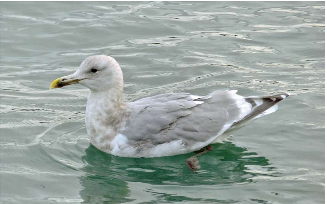
185 Glaucous-winged Gull / Beringmeeuw Larus glaucescens , subadult, Reykavík, Iceland, 19 February 2015