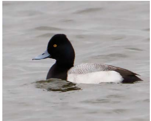
204-205 Kleine Trap / Little Bustard Tetrax tetrax , eerste-winter, Polder Arkemheen, Nijkerk, Gelderland, 27 januari 2015 (Jaap Denee) 206 Kleine Burgemeester / Iceland Gull Larus glaucoides , eerste-winter, Amsterdam, Noord-Holland, 6 januari 2015 (Rob Halff) 207 Kleine Topper / Lesser Scaup Aythya affinis , mannetje, Lorentzhaven, Harderwijk, Gelderland, 28 januari 2015 (Jaap Denee)

Limburg. Er werden c 12 Witoogeenden Aythya nyroca doorgegeven. Een vogel op 23 januari bij Ouderkerk aan de Amstel, Noord-Holland, droeg een gele kleuring en was vermoedelijk afkomstig uit een introductieproject in Niedersachsen, Duitsland. Een mannetje Ringsnaveleend A collaris bevond zich van 31 januari tot in maart in de Vlietlanden bij Vlaardingen, Zuid-Holland; mogelijk betrof het dezelfde vogel als in maart 2014. Op 8 februari maakte hij een uitstapje naar de Nieuwe Maas bij Vlaardingen. Mannetjes Kleine Topper A affinis werden gemeld tot 27 februari op het Veluwemeer bij Biddinghuizen, Flevoland; van 3 tot 26 januari onregelmatig een tweede op diezelfde locatie; van 27 tot 30 januari op het Veluwemeer bij Harderwijk (Lorentzhaven), Gelderland; op 31 januari en 1 februari op de Dijkwielen in de Wieringermeer, Noord-Holland; en van 20 tot 22 februari bij Medemblik, Noord-Holland; de laatste vogel liet zich matig documenteren en was daarom niet geheel zeker. Een mannetje Zomertaling Anas querquedula vanaf