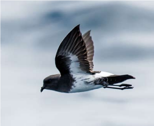
131-133 White-bellied Storm Petrel / Witbuikstormvogeltje Fregetta grallaria , off Robinson Crusoe, Chile, 21 February 2015. F. g. segethi of Juan Fernández archipelago also varies in dark streaking on flanks, a feature found in c 80% of birds, but with moderate to extensive streaking (plate 132-133) occurring in only c 15% of birds. All birds showed here are estimated to be of small type.

may have been a vagrant of the dark morph of grallaria from Lord Howe, considering its strong resemblance in plumage to the latter (cf plate 134-135) and which is the only subspecies for which a dark plumage has been documented. If so, the Masafuera bird originated from at least 10 500 km away (in a straight line from Lord Howe to Masafuera). More chumming sessions as well as night trapping on Masafuera are required to elucidate the status of this dark storm petrel.