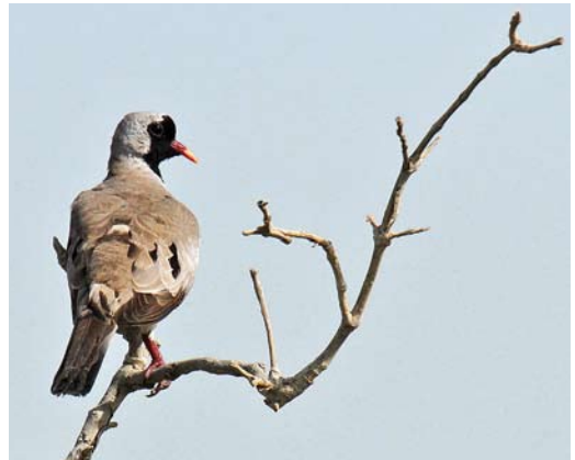
153-154 Nest with brood (arrow) of Namaqua Dove Oena capensis , southern edge of Wadi Lahami mangrove forest, Red Sea, Egypt, 12 July 2013 (Jens Hering) 155 Namaqua Dove / Maskerduif Oena capensis , breeding female, Wadi Lahami mangrove forest, Red Sea, Egypt, 12 July 2013 (Jens Hering) 156 Namaqua Dove / Maskerduif Oena capensis , male near nest, Wadi Lahami mangrove forest, Red Sea, Egypt, 8 July 2013 (Jens Hering)

other pair was searching on the dry ground for sowing seed. When we controlled the nest on 15 July, it was empty. An eggshell, probably eaten by a mouse, was lying on the ground.