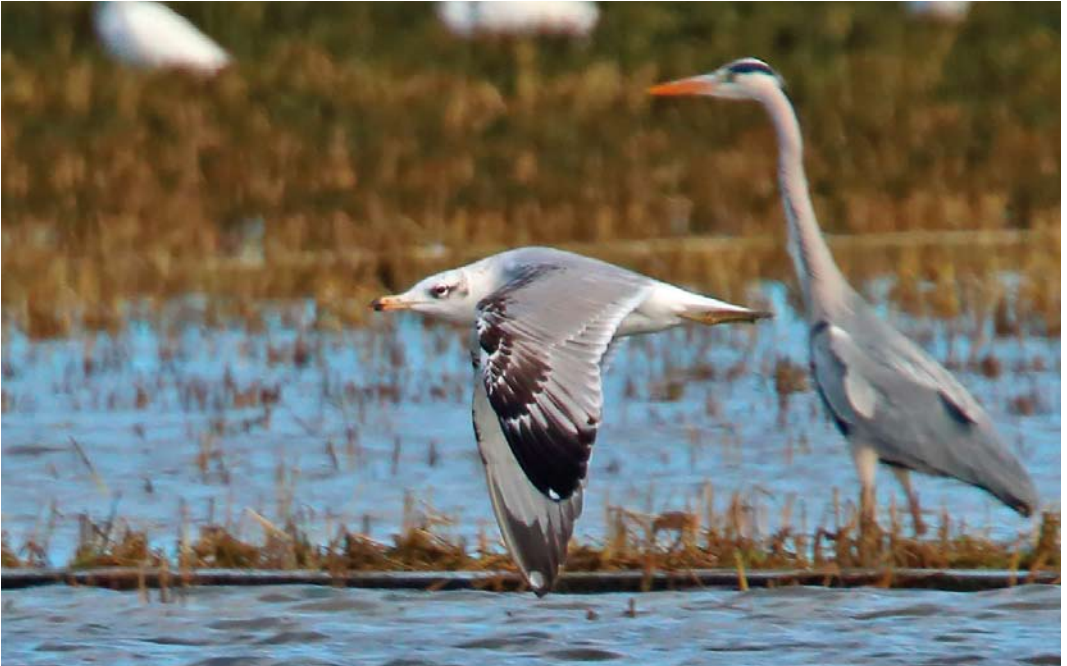
184 Pallas's Gull / Reuzenzwartkopmeeuw Larus ichthyaetus , third calendar-year, with Grey Heron / Blauwe Reiger Ardea cinerea , Parc natural de l'Albufera, València, Spain, 9 February 2015