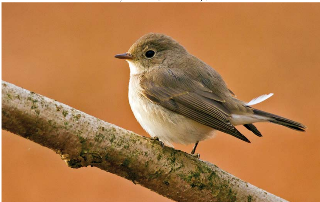
213 Kleine Vliegenvanger / Red-breasted Flycatcher Ficedula parva , Tenkinkbos, Winterswijk, Gelderland, 6 januari 2015