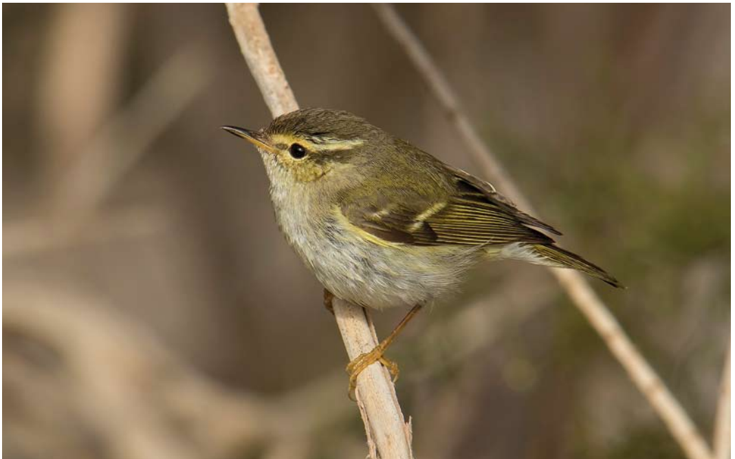
199 Yellow-browed Warbler / Bladkoning Phylloscopus inornatus , Fuerteventura, Canary Islands, 27 January 2015