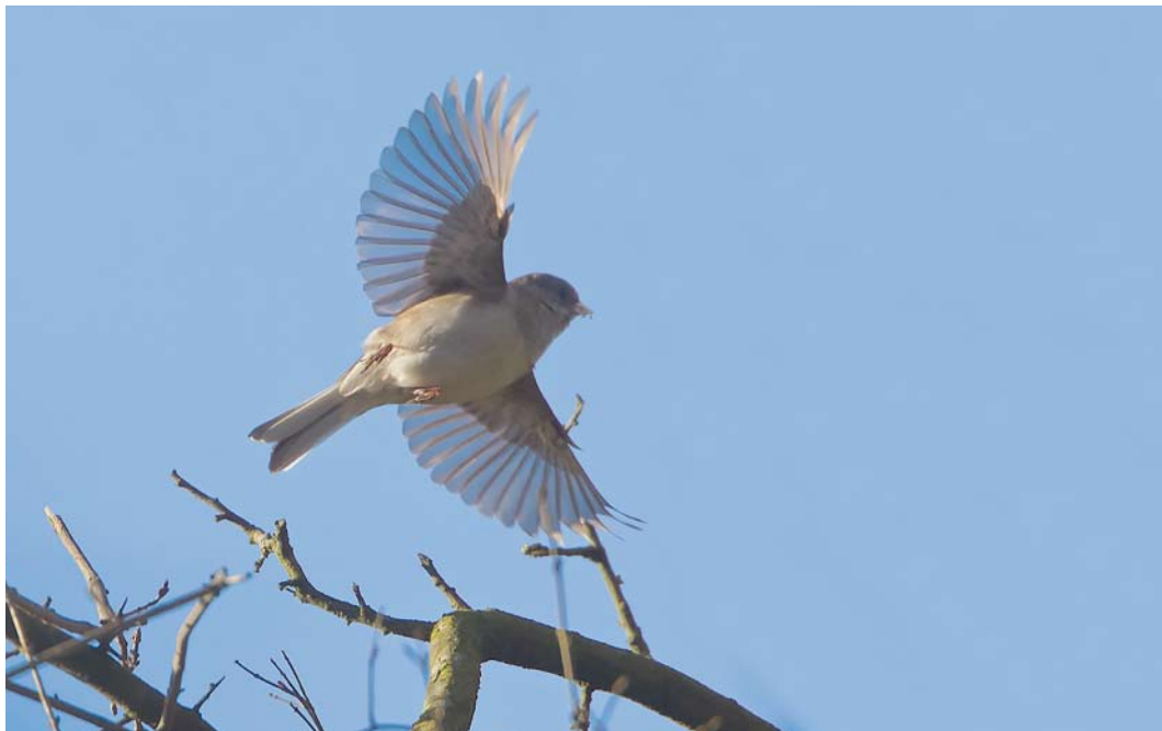
218 Grijs Junco / Dark-eyed Junco Junco hyemalis , eerste-winter, Beijum, Groningen, Groningen, 3 februari 2015

van deze soort zijn hoogst uitzonderlijk en voor zover bekend is dit het eerste januari-geval.