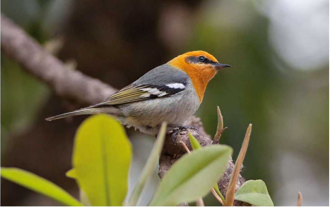
181 Olive Warbler / Oranjekopzanger Peucedramus taeniatus , male, Upper Durango Highway, Sinaloa, Mexico, 14 March 2010 ( Ron Knight )