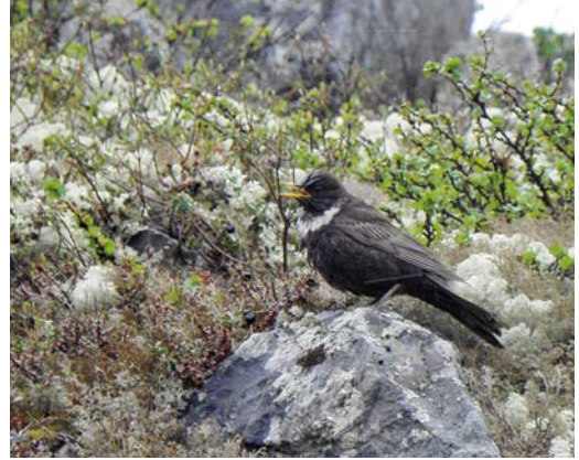
161 Ring Ouzel / Beflijster Turdus torquatus , adult female, Northern Timan mountains, Arkhangelsk region, Russia, 27 June 2014

There are no published avifaunistic studies of the area between the rivers Volonga and Indiga. Earlier researchers worked only further east, along the Indiga (Mineev & Mineev 2009), or west, on the lower western parts of Kanin Peninsula.