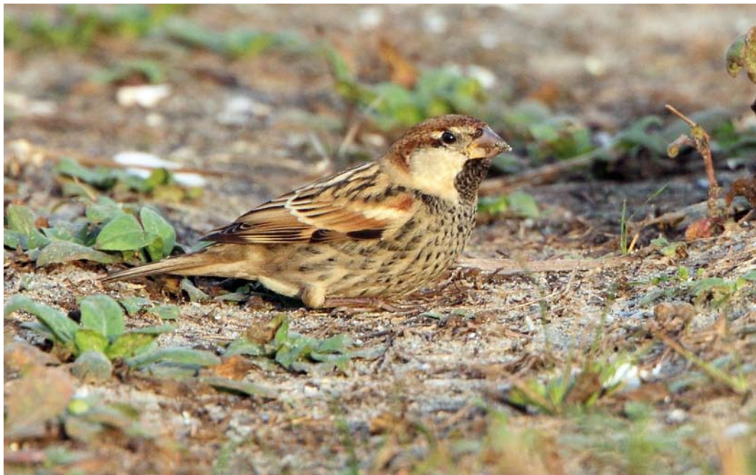
116-117 Spaanse Mus / Spanish Sparrow Passer hispaniolensis , mannetje, Maasvlakte, Zuid-Holland, 26 oktober 2014