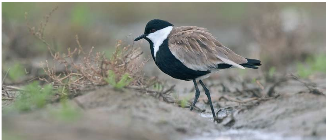
563 Spur-winged Lapwing / Sporenkievit Vanellus spinosus , adult, Strzelno, Kujawsko-Pomorskie, Poland, 25 September 2017 (Stanisław Turowski)

A adalberti were seen at Point Cires, Tangier, crossing the Strait of Gibraltar to Morocco. C 1500 Steppe Eagles A nipalensis at Raysut waste disposal site on 24 January was the highest-ever number for Oman. The second Eastern Imperial Eagle A heliaca for the Netherlands was a fourth calendar-year photographed at Brobbelbies, Schaijk, Noord-Brabant, on 27 September, and then turning up in north-western Overijssel and into Flevoland on 3-4 and 8-10 October (the first was in April 2005). It had been ringed as a chick on the nest at Dévaványa, Békés, Hungary, on 18 June 2014. Surprisingly, based on feather details, it was identified as the same individual as the one in January at Lago di Massaciuccoli, Toscana, where it was erroneously considered to be the first Spanish Imperial Eagle for Italy, partly the result of its ring not read (cf Dutch Birding 39: 45, plate 54, 2017). In Scotland, an adult male Northern Harrier C hudsonius was reported at Rendall, Mainland, Orkney, on 13 October. The second Northern Goshawk Accipiter gentilis for the Faeroes stayed on Kunoy from 30 September to 3 October. A kite flying over Slikken van de Heen, Zeeland, Netherlands, on 10 October was identified as an 'intergrade' between Black Kite M migrans and Black-eared Kite M lineatus .