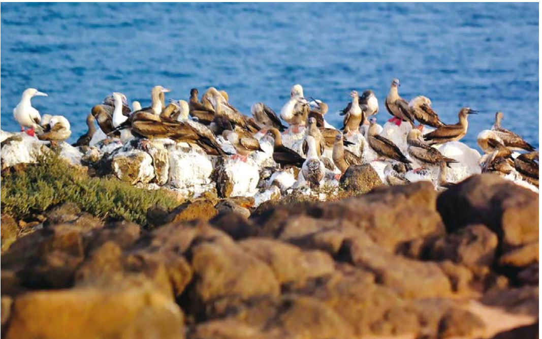
551 Red-footed Boobies / Roodpootgenten Sula sula , Raso, Cape Verde Islands, 28 August 2017