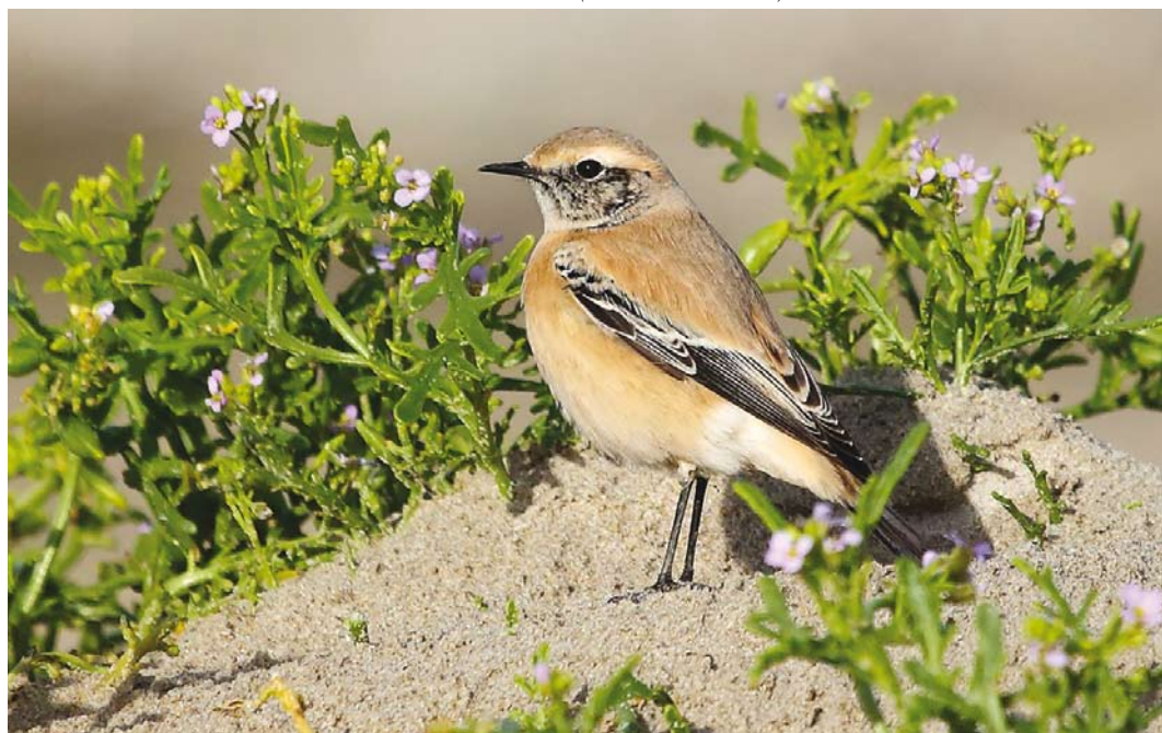
535 Desert Wheatear / Woestijntapuit Oenanthe deserti , first calendar-year male, Paal 29, Texel, Noord-Holland, 6 November 2016