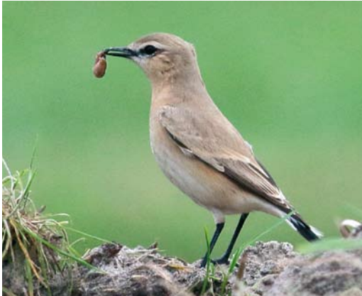
610 Izabeltapuit / Isabelline Wheatear Oenanthe isabellina , eerstejaars, Dorpszicht, Texel, Noord-Holland, 26 oktober 2017