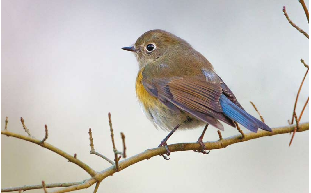
536 Red-flanked Bluetail / Blauwstaart Tarsiger cyanurus , first calendar-year, Pan van Persijn, Wassenaar, Zuid-Holland, 6 December 2016 ( Martin van der Schalk )