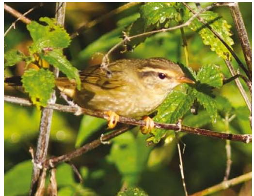
524 Hume's Leaf Warbler / Humes Bladkoning Phylloscopus humei , Noordwijkerhout, Zuid-Holland, 6 January 2017 525 Iberian Chiffchaff / Iberische Tjiftjaf Phylloscopus ibericus , Leyenburg, Den Haag, Zuid-Holland, 14 April 2016 526 Eastern Crowned Warbler / Kroonboszanger Phylloscopus coronatus , Noordhollands Duinreservaat, Castricum, Noord-Holland, 23 October 2016 527 Raddes Warbler / Raddes Boszanger Phylloscopus schwarzi , Kobbbeduinen, Schiermonnikoog, Friesland, 3 October 2016

(A Wijker et al; Dutch Birding 38: 461, plate 704, 479, plate 731-732, 2016).