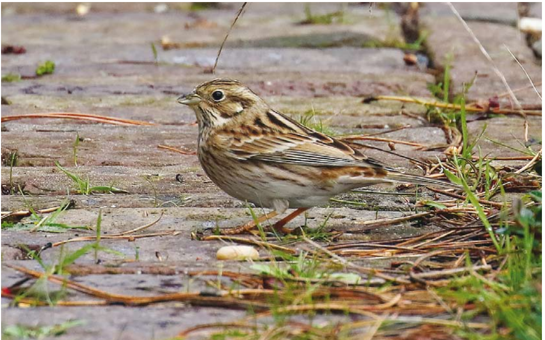
545 Pine Bunting / Witkopgors Emberiza leucocephalos , first-year female, Oost-Vlieland, Vlieland, Friesland, 21 October 2016 (Wietze Janse)