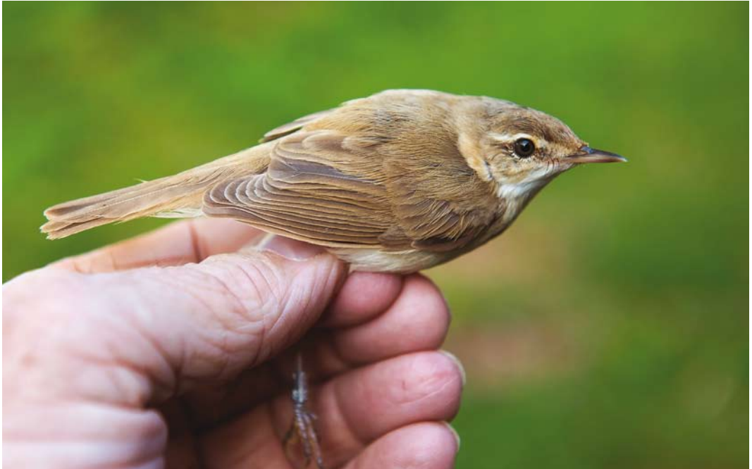
528 Paddyfield Warbler / Veldrietzanger Acrocephalus agricola , first-calendar year, Wormer- en Jisperveld, Noord-Holland, 31 August 2016