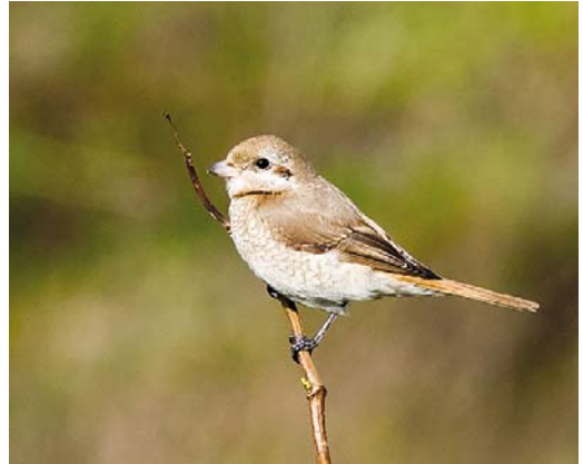
611 Daurische Klauwier / Daurian Shrike Lanius isabellinus , eerstejaars, Maasvlakte, Zuid-Holland, 23 oktober 2017

Maarnse Berg, Utrecht. De laatste datum was 18 oktober, toen een vogel bij Camperduin (rond)vloog. Tot 24 september werden diverse Witwangsters Chlidonias hybrida waargenomen in het Zuidlaardermeergebied, Groningen. Verder werden er twee gemeld van telposten en vanaf 26 oktober tot in november verbleef een adult bij Stellendam, Zuid-Holland. Trektellers noteerden nog zes Witvleugelsters C leucopterus en tussen 13 en 24 september pleisterden er ten minste vier (waaronder één adulte) bij Medemblik.