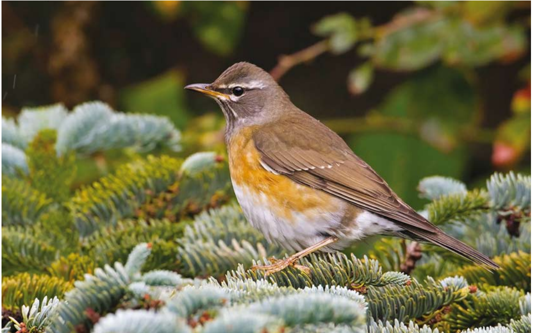
618 Vale Lijster / Eyebrowed Thrush Turdus obscurus , eerstejaars mannetje, Oost-Vlieland, Vlieland, Friesland, 21 oktober 2017

egaal groenbeige rug en zag ik een hagelwit, flinterdun vleugelstreepje... Mijn hart bonsde in mijn keel en ik kon maar aan één ding denken: 'Dit is bingo! Dit is bingo!' In de stress keek ik om mij heen om te zien waar ik mijn camera had gelaten en zag ik hem twee tuintjes verderop staan. Ik trok een sprintje naar mijn camera. Even later keek ik door de zoeker en bleek de vogel nog steeds op de zelfde plek te zitten, half verscholen achter de taxus. Ik drukte af en checkte de display van de camera. Op dat moment sprong de vogel iets naar voren, kwam ineens vrij en zag ik de abrikoosoranje flanken. Ik riep VH die snel naar beneden kwam. Omdat de vogel inmiddels volledig achter een standbeeld in de tuin was verdwenen liet ik VH mijn display zien... 'Dat is een Vale Lijster, man!'. We wachtten gespannen tot de vogel weer zou verschijnen. Na enkele 10-tallen seconden hipte hij weer achter het standbeeld vandaan. We balden onze vuisten en vierden kort ons feestje. Ik maakte in de DF-appgroep melding 'Vale Lijster!!!', gevolgd door de locatie en een paar 'back-of-camera' foto's. Meteen daarna verstuurde ik een Rare Bird Alert om ook de mensen op de vaste wal op de hoogte te brengen van de vondst. Even later arriveerden RdB en RH, kort daarna gevolgd door andere vogelaars. Terwijl de groep groeide, speurde iedereen geconcentreerd de tuintjes af. Het duurde minuten, en voor mijn gevoel een eeuwig-