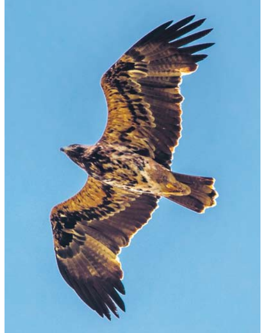
615 Keizerarend / Eastern Imperial Eagle Aquila heliaca , vierde-kalenderjaar, Brobbelbies, Schaijk, Noord-Brabant, 27 september 2017 (Toy Janssen)

springen. Ook was hij op ten minste twee plekken in gevecht met lokale Zeearenden. Rond 11:00 zat hij langere tijd in een weiland, waar hij door veel mensen mooi werd gezien. Na 13:05 werd het stil – gedurende de hele middag zochten er nog 10-tallen mensen maar hij werd niet meer gevonden.