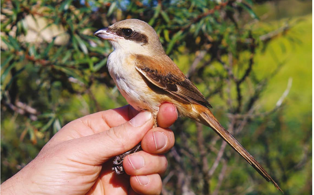
564 Long-tailed Shrike / Langstaartklauwier Lanius schach , first-year, Het Zwin, Knokke, West-Vlaanderen, Belgium, 15 October 2017 ( Patrick Beirens )