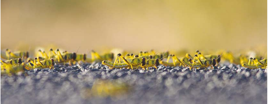
548 Desert Locusts / Woestijnsprinkhanen Schistocerca gregaria , bands, gregarious late instars, Aousserd road, Oued Al-Debeh, Western Sahara, Morocco, 20 April 2016 (Peter Stronach)