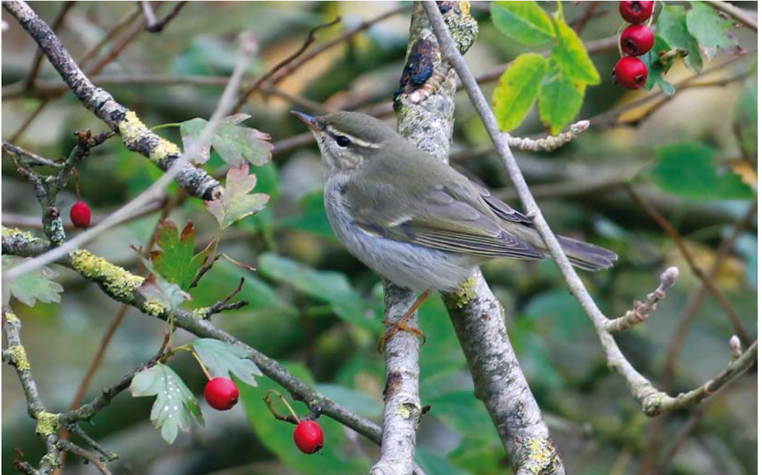
604 Noordse Boszanger / Arctic Warbler Phylloscopus borealis , camping Seedune, Schiermonnikoog, Friesland, 9 oktober 2017