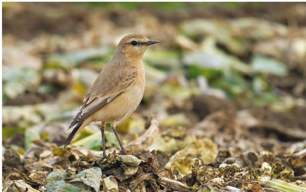
534 Isabelline Wheatear / Izabeltapuit Oenanthe isabellina , first calendar-year, Polredijk, Veere, Zeeland, 25 October 2016