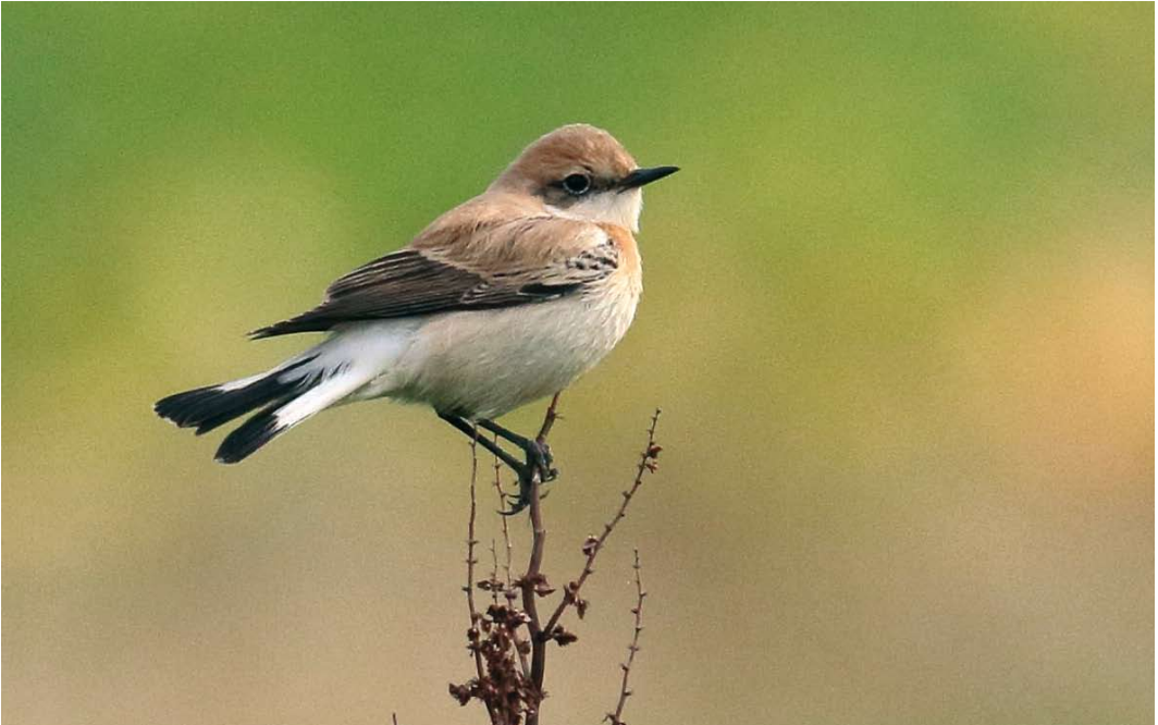
617 Westelijke Blonde Tapuit / Western Black-eared Wheatear Oenanthe hispanica , eerstejaars mannetje, Waal en Burg, Texel, Noord-Holland, 19 oktober 2017

O. melanoleuca zijn deze delen kouder grijsbruin getekend. Omdat hispanica met maar twee eerdere gevallen – waarvan maar één twitchbaar (in 2004) – een stuk zeldzamer is dan melanoleuca nam het belangstellingsniveau flink toe en in de loop van de dag kwamen vele 10-tallen vogelaars naar Texel. De tapuit liet zich de hele dag goed bekijken en fotograferen, zij het vaak op flinke afstand omdat hij bij voorkeur verbleef op een grote stapel gemaaid riet in het weiland. Naast de kleur is ook de handpenprojectie een kenmerk om beide ‘blonde tapuiten’ te onderscheiden; de projectie van c 90% paste goed op hispanica . Aan het eind van de middag werd een poepje verzameld voor DNA-analyse waarmee hopelijk de determinatie verder ondersteund kan worden. De volgende dag werd de vogel niet meer aangetroffen. Eerdere gevallen van hispanica in Nederland waren een mannetje op Terschelling, Friesland, op 11 mei 2001 en een vrouwtje in de Eemshaven, Groningen, van 30 oktober tot 28 november 2004. Daarnaast zijn er zes gevallen van niet nader gedetermineerde ‘blonde tapuiten’ (mei 1937, mei 1970, juni 1975, april 1982, juni 1991 en mei 2006). Vooral bij oudere gevallen is de documentatie onvoldoende om de subtiele verschillen tussen beide soorten te kunnen vaststellen. Daarnaast is er één geval waarbij het een ‘blonde tapuit’ of Bonte Tapuit O. pleschanka betrof (oktober 1992). KOEN STORK & ENNO B EBELS