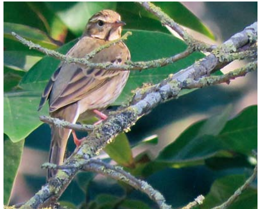
577 Dickcissel / Dickcissel Spiza americana , first-year female, Corvo, Azores, 18 October 2017 (Daniele Occhiato) 578 Ovenbird / Ovenvogel Seiurus aurocapilla , Flores, Azores, 23 October 2017 (Michael Gerber) 579 Eyebrowed Thrush / Vale Lijster Turdus obscurus , first-year male, Aktau, Mangystau, Kazakhstan, 2 October 2017 (Anna Yasko) 580 Olive-backed Pipit / Siberische Boompieper Anthus hodgsoni , Rabat, Morocco, 5 November 2017 (Pedro Fernandes)

for these species (Br Birds 110: 652-654, 2017). A Hume's Leaf Warbler P humei at Vík, Lón, on 21-24 October was the first for Iceland. A Dusky Warbler P fuscatus trapped at Aras on 8 October was the sixth for Turkey. The second and third for Austria were trapped at Illmitz, Burgenland, on 10 and 14 October. The first for Serbia was trapped at Ludas lake, Vojvodine, on 20 October. If accepted, one found at Mandria on 3 November will be the third for Cyprus. A record seven were reported in Italy this autumn, including three on Linosa, Sicily, on 5 November. A first-winter Asian Desert Warbler Sylvia nana was seen and then trapped at Halias, Hanko, Finland, on 17-20 October. The third for Germany was twitched by many birders on Helgoland, Schleswig-Holstein, from 20 October to 2 November (previous ones were in June-July 1981 and May 2002). In Scilly, the first Eastern Orphean Warbler S crassirostris for Britain on St Agnes on 12-20 October was identified with certainty after its departure.