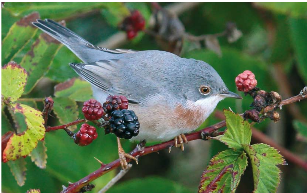
602 Balkanbaardgrasmus / Eastern Subalpine Warbler Sylvia cantillans , adult mannetje, Robbenjager, Texel, Noord-Holland, 9 september 2017