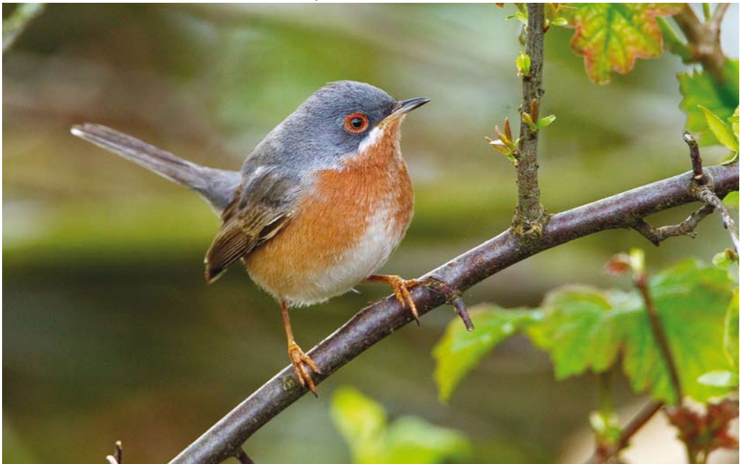
529 Western Subalpine Warbler / Westelijke Baardgrasmus Sylvia inornata , male, Wageningen, Gelderland, 16 April 2016