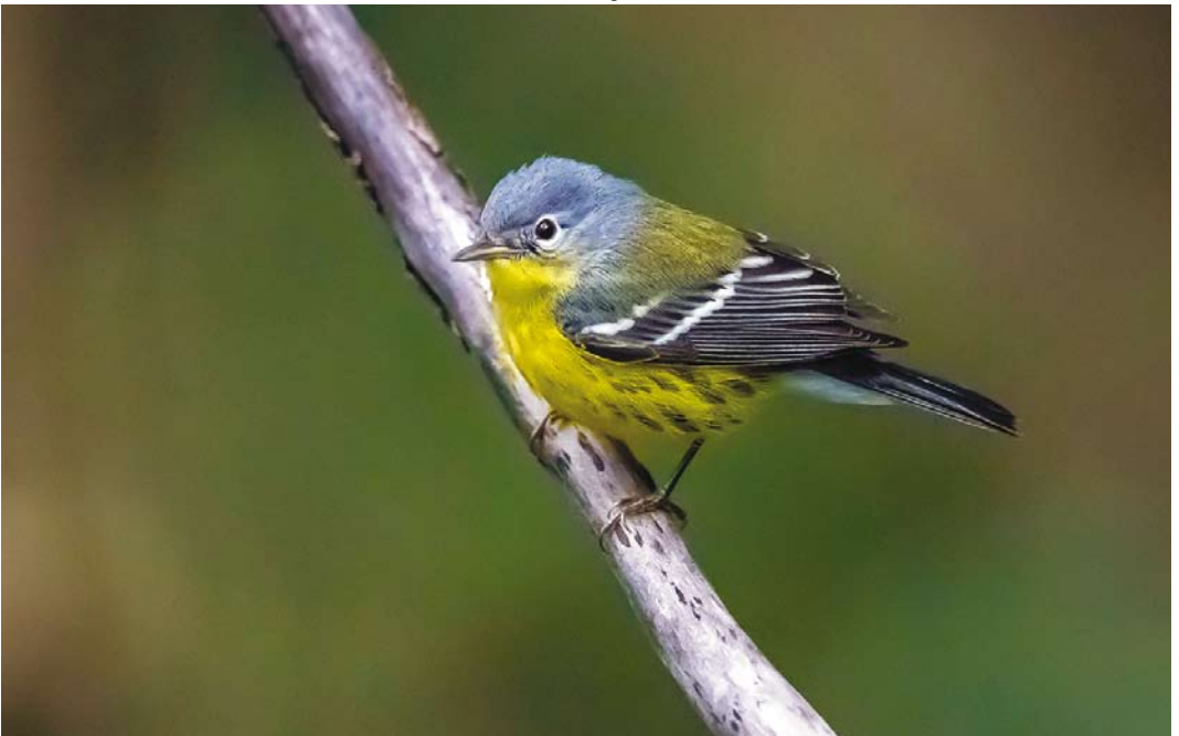
594 Magnolia Warbler / Magnoliazanger Setophaga magnolia , first-year, Corvo, Azores, 19 October 2017 (Vincent Legrand)