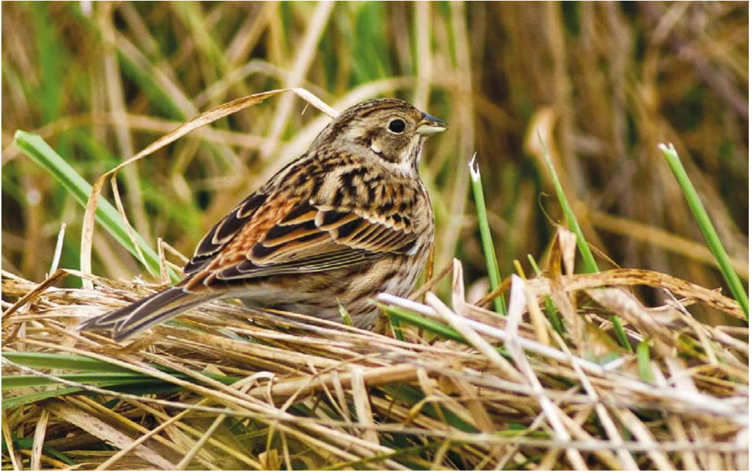
544 Pine Bunting / Witkopgors Emberiza leucocephalos , first-year female, Oosternieuwlandpolder, Veere, Zeeland, 24 October 2016 (Corstiaan Beeke)