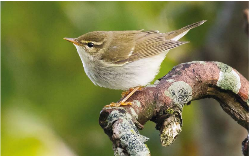
605 Noordse Boszanger / Arctic Warbler Phylloscopus borealis , Oost, Texel, Noord-Holland, 15 september 2017 (Klaas de Jong)