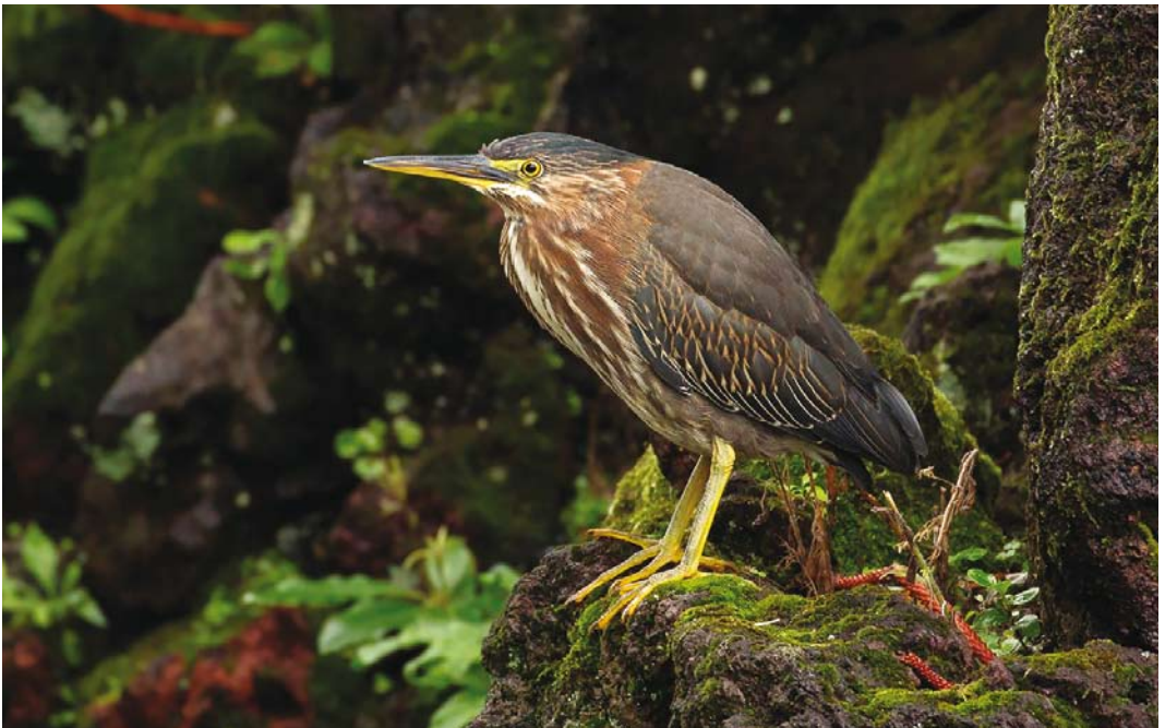
553 Green Heron / Groene Reiger Butorides virescens , first-year, Faial, Azores, 27 October 2017