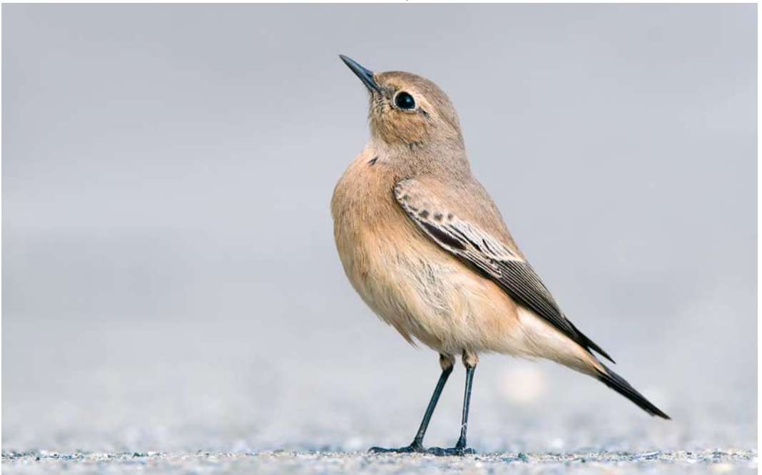
567 Desert Wheatear / Woestijntapuit Oenanthe deserti , first-year female, Zeebrugge, West-Vlaanderen, Belgium, 9 October 2017