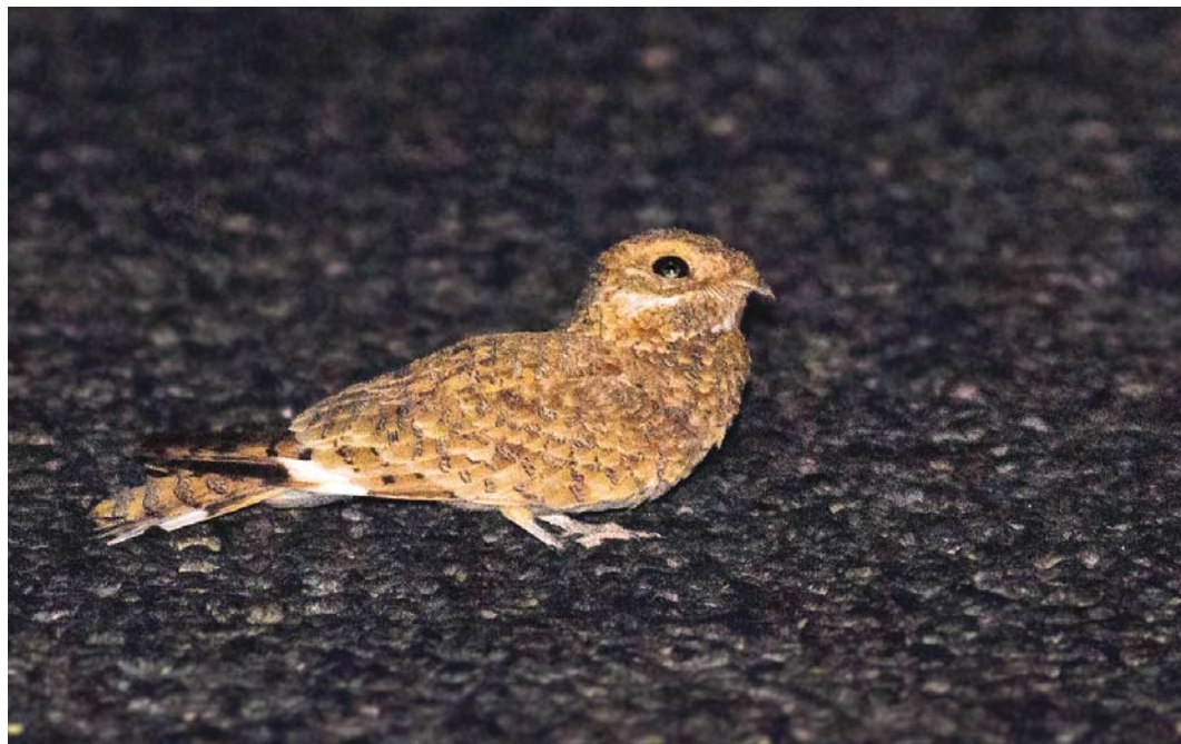
547 Golden Nightjar / Goudgele Nachtzwaluw Caprimulgus eximius , Aousserd road, Oued Ad-Deheb, Western Sahara, Morocco, 21 April 2016. Presumed male because of length of white tip on outer tail feather.

The next evening, on 21 April, the Dutch group again went spotlighting around Oued Jenna. They saw and photographed one Golden Nightjar, almost at the exact spot where they had found the roadkill (point 3). Almost an hour later, they again found one 850 m further west (again at point 5,