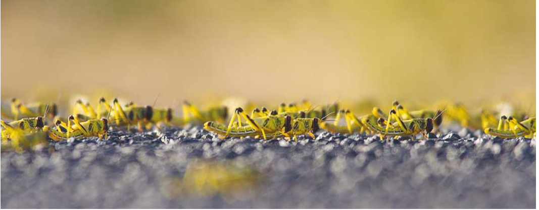
548 Desert Locusts / Woestijnsprinkhanen Schistocerca gregaria , bands, gregarious late instars, Aousserd road, Oued Al-Debeh, Western Sahara, Morocco, 20 April 2016 (Peter Stronach)