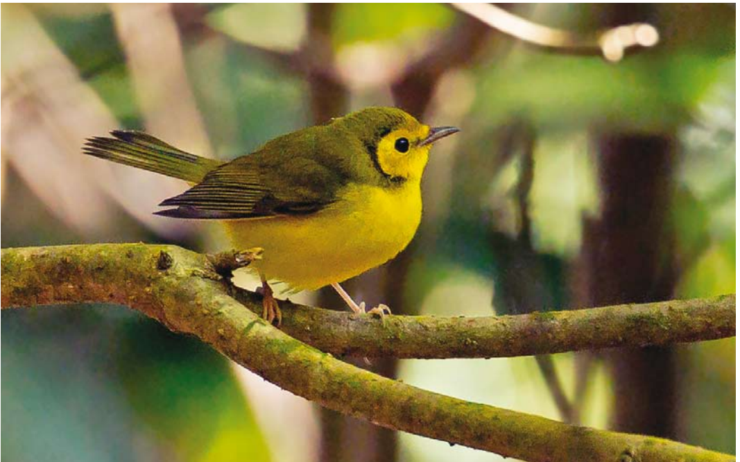
587 Hooded Warbler / Monnikszanger Setophaga citrina , first-year female, Corvo, Azores, 20 October 2017