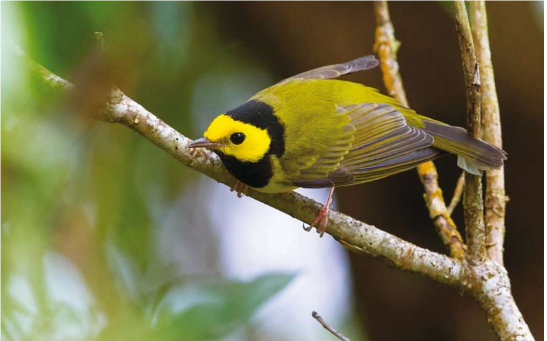
586 Hooded Warbler / Monnikszanger Setophaga citrina , first-year male, Corvo, Azores, 23 October 2017 (Mika Bruun)