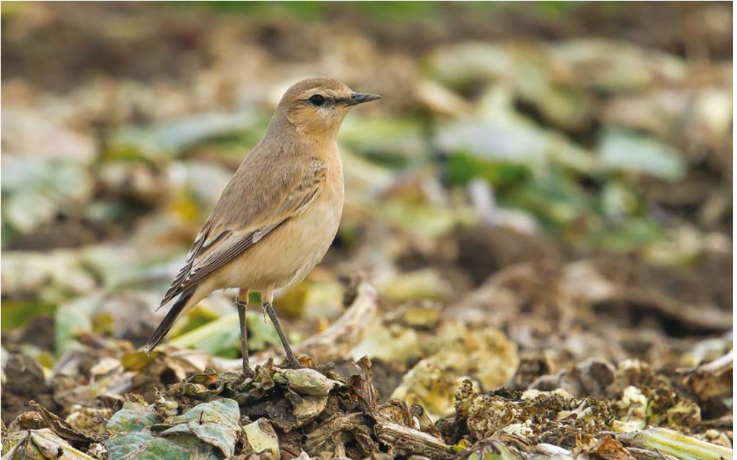
534 Isabelline Wheatear / Izabeltapuit Oenanthe isabellina , first calendar-year, Polredijk, Veere, Zeeland, 25 October 2016