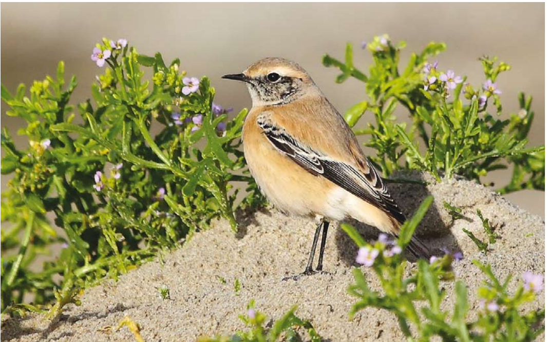
535 Desert Wheatear / Woestijntapuit Oenanthe deserti , first calendar-year male, Paal 29, Texel, Noord-Holland, 6 November 2016