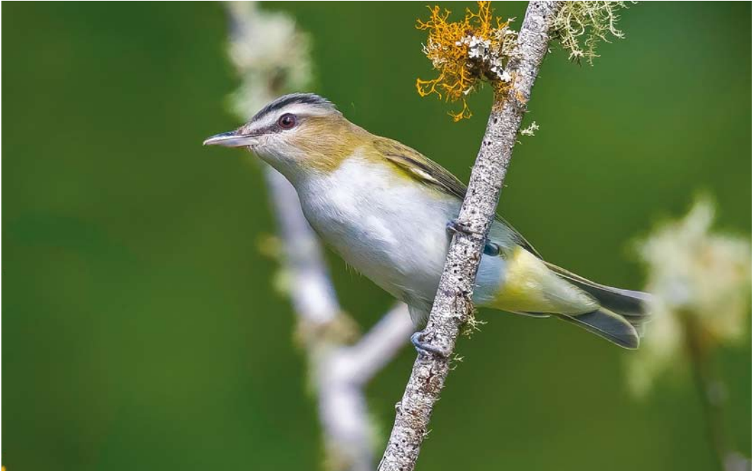
571 Red-eyed Vireo / Roodoogvireo Vireo olivaceus , first-year, Corvo, Azores, 8 October 2017 (Rafael Armada)