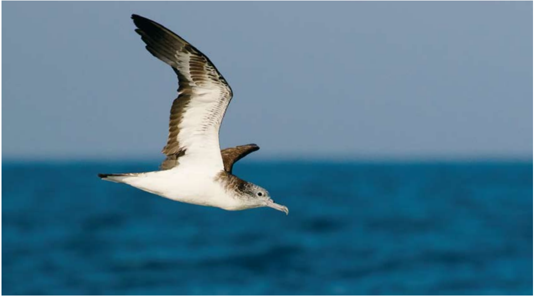
556 Streaked Shearwater / Gestreepte Pijlstormvogel Calonectris leucomelas , off Mirbat, Oman, 10 November 2017