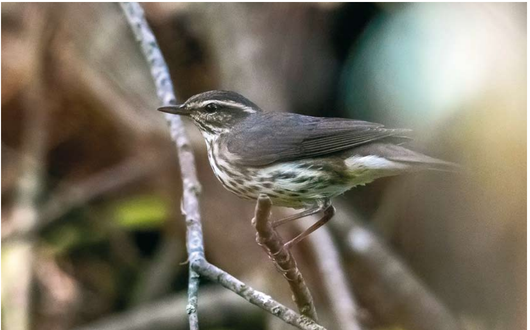
572 Northern Waterthrush / Noordse Waterlijster Parkesia noveboracensis , Corvo, Azores, 6 October 2017