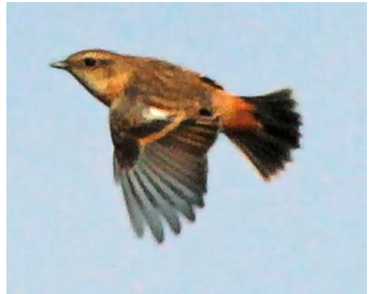
598 Geelsnavelduiker / Yellow-billed Loon Gavia adamsii , Westkapelle, Zeeland, 3 oktober 2017 599 Siberische Boompieper / Olive-backed Pipit Anthus hodgsoni , Katwijk aan Zee, Zuid-Holland, 19 oktober 2017 600 Vale Gierzwaluw / Pallid Swift Apus pallidus , juveniel, Ruige Plak, Vlieland, Friesland, 20 oktober 2017 601 Stejnegers Roodborsttapuit / Stejneger's Stonechat Saxicola stejnegeri , eerstejaars vrouwtje, Noordoosthoek, Vlieland, Friesland, 16 oktober 2017

mee was dit ook het beste jaar sinds 2011. Voorts werden 331 Middelste Jagers S pomarinus en 2867 Grote Jagers S skua genoteerd. Voor laatstgenoemde soort was dit de beste september-oktober in de afgelopen 10 jaar (het gemiddelde over 2008-17 is 977). De hoogste aantallen passeerden de telposten op 14 september, waaronder 307 langs Schiermonnikoog en 276 langs de Tweede Maasvlakte. Deze aantallen betekenden respectievelijk het op drie en vier na hoogste aantal ooit voor ons land. Stevige aanlandige winden zorgden voor een totaal van 73 langstreckende Vorkstaartmeeuwen Xema sabini waaronder enkele adulte in zomerkleed. De meeste werden waargenomen vanaf de telposten bij Westkapelle en Den Haag. Bij de Maasvlakte verbleef op 6 oktober langdurig een fraaie adult in zomerkleed. Op 12 september werd een gekleuringde Baltische Mantelmeeuw Larus fuscus fuscus (zwart J167K) gefotografeerd bij 's-Gravenzande, Zuid-Holland; hij was als nestjong geringd op