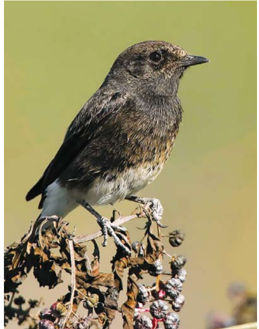
568 Pallas's Reed Bunting / Pallas' Rietgors Emberiza pallasi , first-year, Linosa, Sicily, Italy, 15 October 2017 569 Pied Bushchat / Zwarte Roodborsttapuit Saxicola caprata , first-year male, Bonifica di Vecchiano, Pisa, Toscana, Italy, 20 October 2017 570 Blyth's Pipit / Mongoolse Pieper Anthus godlewskii , first-year, Linosa, Sicily, Italy, 26 October 2017