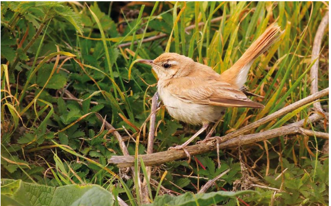
537 Western Rufous-tailed Scrub Robin / Westelijke Rosse Waaierstaart Cercotrichas galactotes galactotes , Maasvlakte, Zuid-Holland, 20 September 2016 ( Marcel Klootwijk )