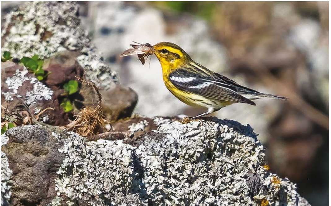
592 Blackburnian Warbler / Sparrenzanger Setophaga fusca , first-year male, Corvo, Azores, 15 October 2017