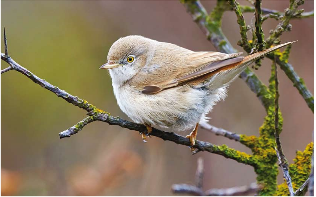
566 Asian Desert Warbler / Woestijngrasmus Sylvia nana , Helgoland, Schleswig-Holstein, Germany, 22 October 2017