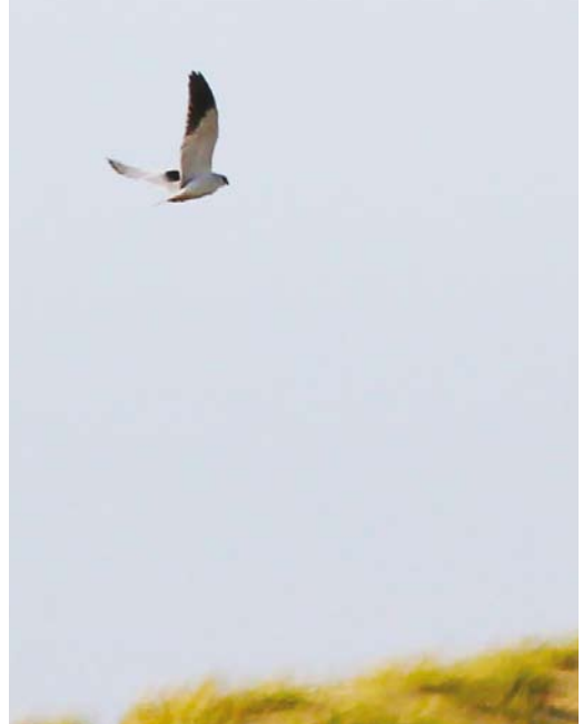
523 Black-winged Kite / Grijze Wouw Elanus caeruleus , adult, Noordhollands Duinreservaat, Castricum, Noord-Holland, 4 April 2016

Again, a crazy number for one year! The first record of this former mega rarity was in 1971, the second in 1998 and the third in 2000. The remaining 15 followed since 2009, with six in 2015 and four in 2016. Limburg is now