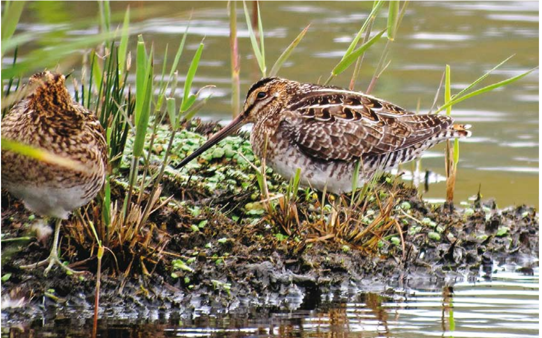
554 Wilson's Snipe / Amerikaanse Watersnip Gallinago delicata (right), St Mary's, Scilly, England, 11 October 2017