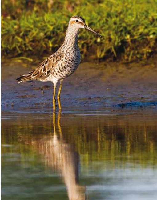
522 Stilt Sandpiper / Stelstrandloper Calidris himantopus , first-summer, Borculo, Gelderland, 16 May 2016

These were (only) the first and second for Texel. The second was found dead in a tern colony; it had been ringed as a chick on Coquet Island, Northumberland, England, on 26 July 2014 (486 km north-west of Texel).