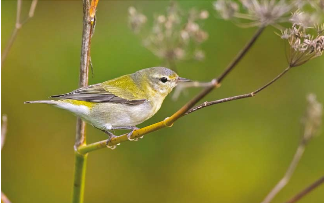
591 Tennessee Warbler / Tennesseezanger Oreothlypis peregrina , first-year, Corvo, Azores, 21 October 2017 (David Monticelli)