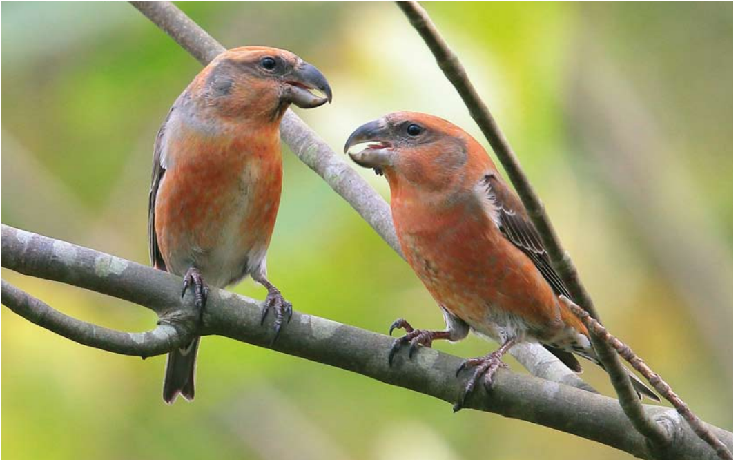
612 Grote Kruisbekken / Parrot Crossbills Loxia pytyopsittacus , mannetjes, Staatsbossen, Texel, Noord-Holland, 12 oktober 2017