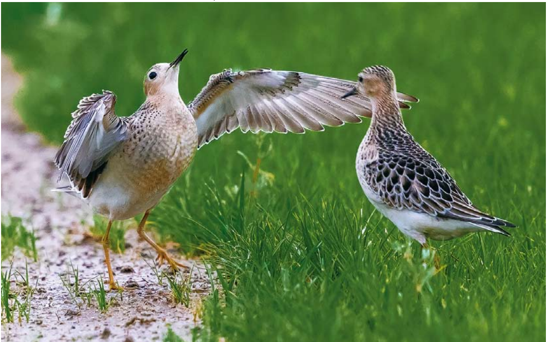
555 Buff-breasted Sandpipers / Blonde Ruiters Calidris subruficollis , juveniles, Ebro delta, Tarragona, Spain, 25 September 2017 (Rafael Armada)