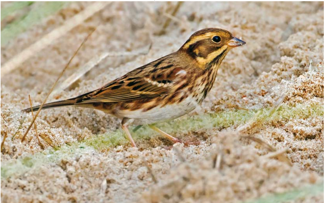
613 Bosgors / Rustic Bunting Emberiza rustica , eerstejaars, Vlieland, Friesland, 29 september 2017