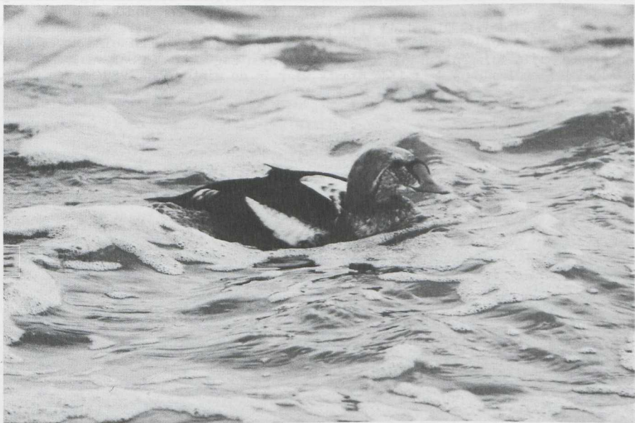
71. Koningseider/King Eider Somateria spectabilis , Texel (NH), december 1981 (Edward van IJzendoorn)