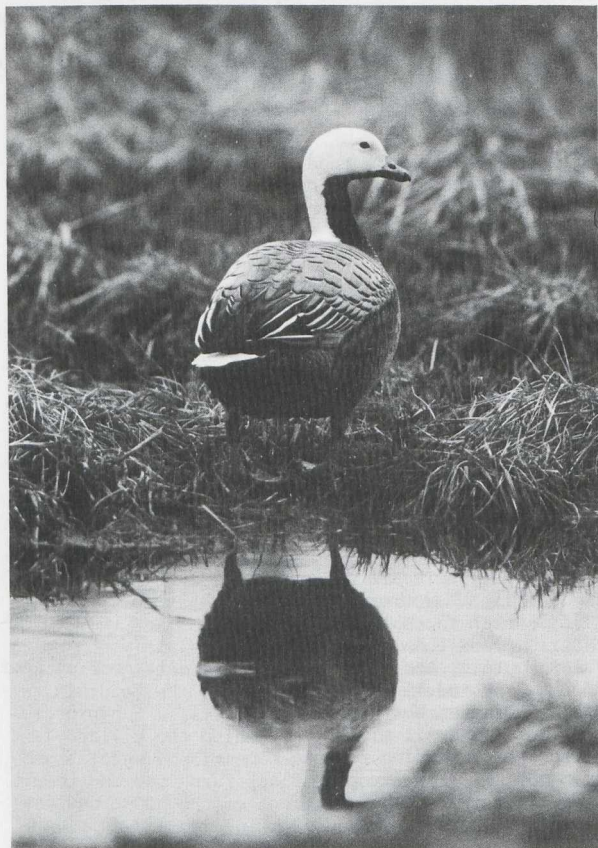
68. Emperor Goose/Keizergans Philacte canagica , Alaska, April 1981

Saint Lawrence Island is c. 240 km off the mainland at the south edge of the Bering Strait. The native village of Gambell is located at the north-west tip and offers similar birding as Wales. The chance for Asiatic vagrants is better here than at Wales or Nome. A few of the Asiatics recorded at Attu Island are occasionally observed here but the possibilities are fewer since the island is so much further north. A large alcid colony, on Sevuckok Mountain, contains