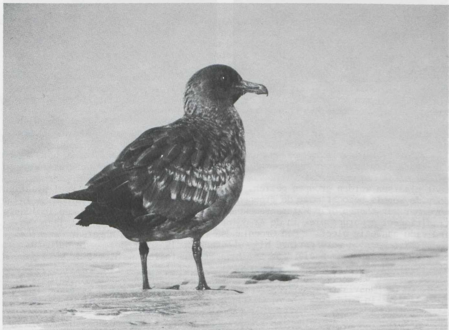
74-75. Grote Jager/Great Skua Stercorarius skua , eerste kalenderjaar, De Westplaat (ZH), december 1981 (René Pop); Papegaaiduiker/Puffin Fratercula arctica , De Maasvlakte (ZH), december 1981 (René Pop)