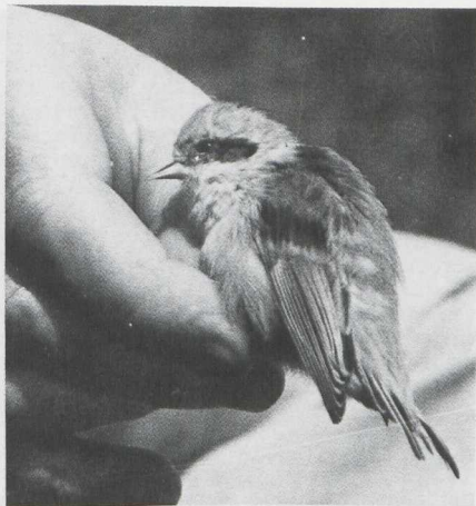
69-70. Kuhls Pijlstormvogel/Cory's Shearwater Calonectris diomedea , Noordwijk (ZH), november 1981; Buidelmees/Penduline Tit Remiz pendulinus , Makkum (F), september 1981