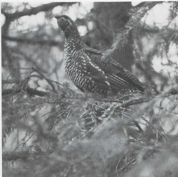
64. Spruce Grouse/Sparrehoen Canachites canadensis , female, Alaska, July 1977 (Theodore Tobish)