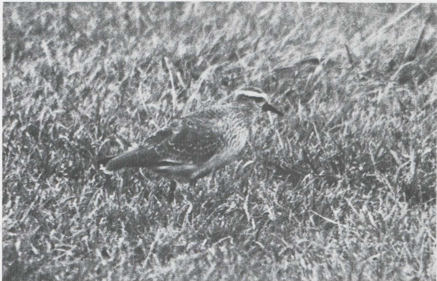
72-73. Steppiekievit/Sociable Plover Chettusia gregaria , eerste kalenderjaar, Me-naldum (F), november 1981; Grote Franjepoot/Wilson's Phalarope Phalaropus tricolor , Hondsbosse Zeewering (NH), september 1931