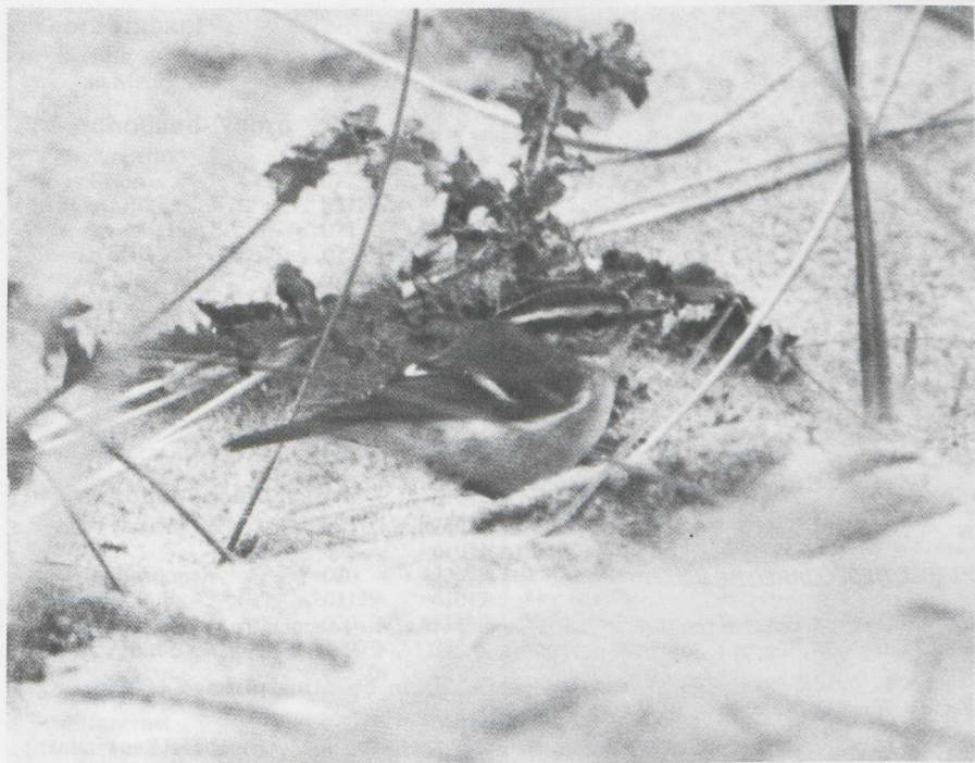
78. Pallas' Boszanger/Pallas's Warbler Phylloscopus proregulus , De Maasvlakte (ZH), oktober 1981 (Edward van IJzendoorn)