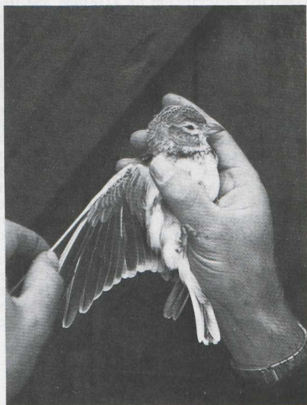
54-55. Kalanderleeuwerik/Calandra Lark Melanocorypha calandra , Castricum (NH), oktober 1980 (Frans Jongerling)