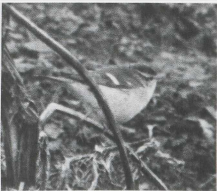
76-77. Kortteenleeuwerik/Short-toed Lark Calandrella brachydactyla , AW-duinen (NH), november 1981; Bladkoninkje/Yellow-browed Warbler Phylloscopus inornatus , De Maasvlakte (ZH), oktober 1981