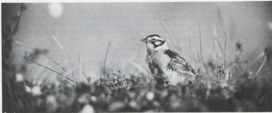
67. Smith's Longspur/Smiths IJsgors Calcarius pictus , adult male, Denali Highway, Alaska, July 1979 (John Pitcher)