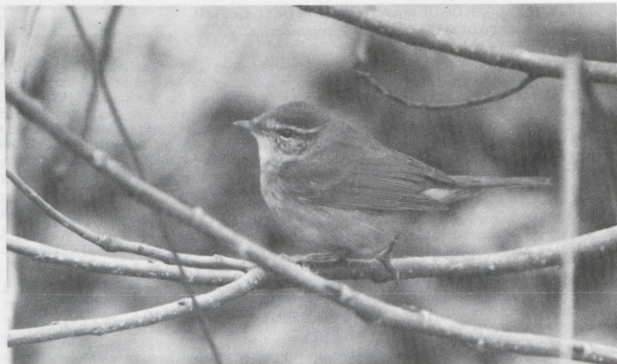
53. Raddes Boszanger/Radde's Warbler Phylloscopus schwarzi , De Maasvlakte (ZH), oktober 1981 (René Pop)

bijvoorbeeld Johns & Wallace 1980 over Raddes Boszanger vermeldden); snavel was stevig en breed en deed aan die van Tuinfluiter Sylvia borin denken; poten waren dik, tenen lang en krachtig.