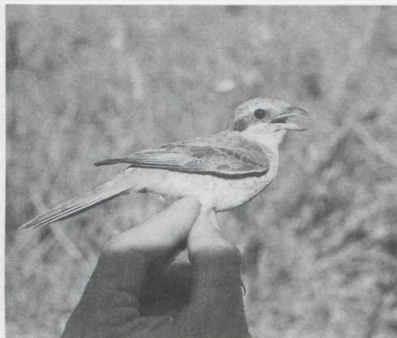
57-58. Isabelline Shrikes/Isabelklawieren Lanius isabellinus phoenicuroides , first-autumn, November 1981 (David Pearson); 59-60. Red-backed Shrike/Grauwe Klawier Lanius collurio , first-autumn, Sudan, September 1981 (David Pearson)