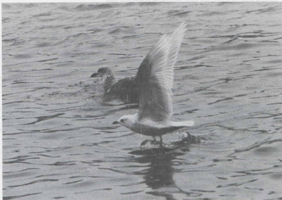
23. Iceland Gull/Kleine Burgemeester Larus glaucooides , first-winter, IJmuiden (Noord-Holland), February 1981 (Jan Mulder)