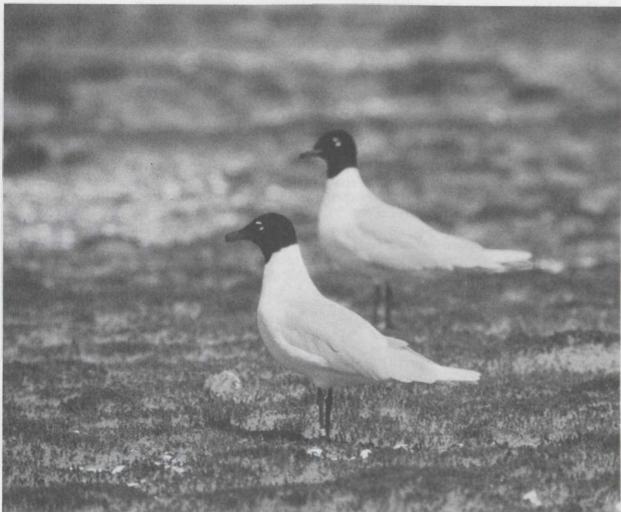
32. Mediterranean Gulls/Zwartkopmeeuwen Larus melanocephalus , De Maasvlakte (Zuid-Holland), April 1981

period. The two juvenile White-tailed Eagles/Zeearenden Haliaeetus albicilla of Den Nul (Overijssel) stayed until 12 March. On Texel (Noord-Holland) an adult White-tailed appeared on 18 April; it was last seen on 25 April. The juvenile Golden Eagle/Steenarend Aquila chrysaetos of Flevoland (Zuidelijke IJsselmeerpolders) was present until 7 April. From 11 May onwards 20+ Red-footed Falcons/Roodpootvalken Falco vespertinus were reported. A maximum number of eight was counted at Schoorl (Noord-Holland) on 11 May. From 18 until 23 May up to three individuals were watched at the Hollandse Hout near Lelystad, Oostelijk Flevoland (Zuidelijke IJsselmeerpolders) in the evening hours.