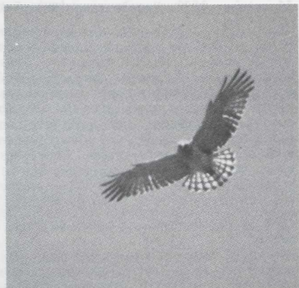
15-16. Slangenarend/Short-toed Eagle Circaetus gallicus , Frankrijk, mei 1980

arend pleiten de rijen donkere vlekken op de ondervleugels en het ontbreken van polsvlekken. Opgemerkt dient te worden dat sommige Wespddieven precies hetzelfde vertonen (cf. Svensson). Svensson noemt de staart juist smal, met zeer rechte zijanten en, hoewel enigszins rond aan het eind, met scherpe hoeken aan de zijden. Andere roofvogels zoals met name de Wespddief en minder frequent de Bui-zerd, draaien ook wel met de staart.