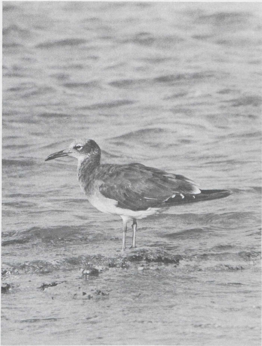
26. White-eyed Gull/Witoogmeeuw Larus leucophthalmus , first calendar-year, Hurgada, Egypt, September 1980