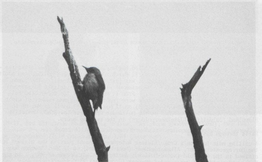
33. Grey-headed Woodpecker/Grijskopspecht Picus canus , male, Brunssumerheide (Limburg), May 1981

A maximum number of 12 (or 14) Mediterranean Gulls/Zwartkopmeeuwen Larus melanocephalus was seen on De Maasvlakte on 24 April! Single Gull-billed Terns/Lachsterns Gelochelidon nilotica were seen on De Maasvlakte on 1 May and in the Lauwersmeer (Groningen/Friesland) on 28 May. The only reported Caspian Tern/Reu-