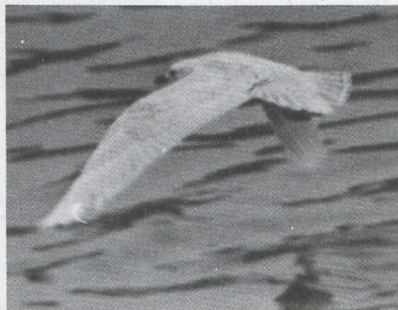
21-22. Iceland Gull/Kleine Burgemeester Larus glaucooides , first-winter, IJmuiden (Noord-Holland), February 1981 (Jan Mulder)