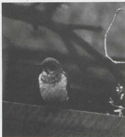
35-36. Black-throated Thrush/Zwartkeellijster Turdus ruficollis atrogularis , Groningen (Groningen), March-April 1981 ( Anonymus )