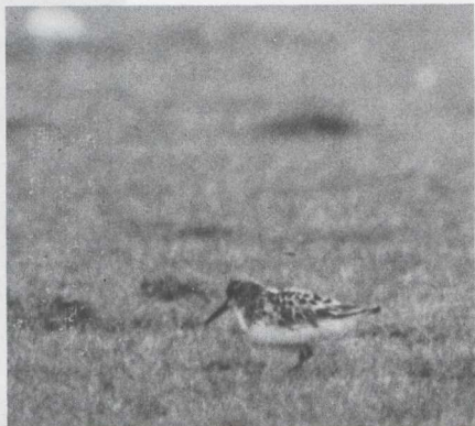
30-31. Red Kite/Rode Wouw Milvus Milvus , Castricum (Noord-Holland), May 1981 (Pieter Bison); Broad-billed Sandpiper/Breedbekstrandloper Limicola falcinellus , De Maasvlakte (Zuid-Holland), May 1981 (René Pop)