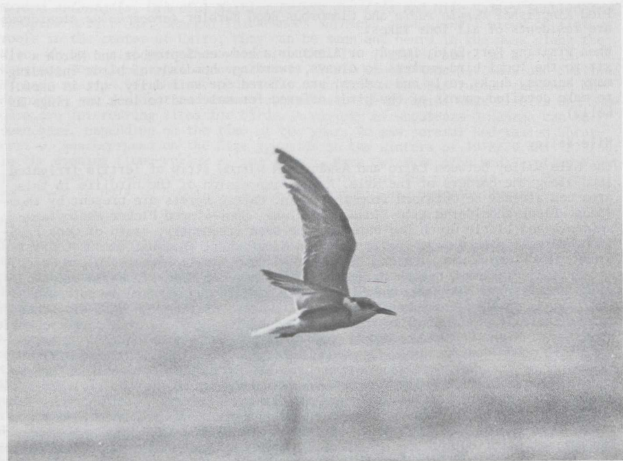
27-28. Whiskered Tern/Witwangstern Chlidonias hybridus , Lake Burullus, Egypt, January 1979; Eagle Owl/Oehoe Bubo bubo , Kalabsha Island, Lake Nasser, Egypt, January 1980 (Wim Mullié)