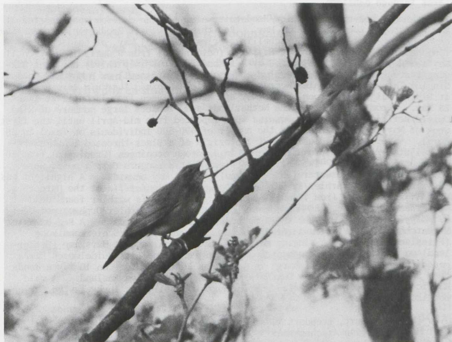
34. River Warbler/Krekelzanger Locustella fluviatilis , singing, Oostelijk Flevoland (Zuidelijke IJsselmeerpolders), May 1981 (Jan Mulder)

zenstern Sterna caspia flew north off Bergen aan Zee (Noord-Holland) on 12 May. Whiskered Terns/Witwangsterns Chlidonias hybridus were observed at Spaarnwoude on 8 May, in the Horstermeerpolder (Noord-Holland) on 18 May, at Amstelveen (Noord-Holland) on 19 May and at Harderwijk (Gelderland) from 19 until 22 May. White-winged Black Terns/Witvleugelsterns C. leucopterus were reported at the Alkmaardermeer on 21 May and at Harderwijk on 30 May.