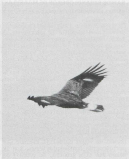
17-18. Steenarend/Golden Eagle Aquila chrysaetos , Flevoland (ZIJP), maart 1981

De Steenarend van Flevoland had een typisch juveniel kleed. De staart was voor tweederde wit en op de boven- en ondervleugel was duidelijk de witte basis aan de slagpennen waarneembaar. De hoeveelheid wit was echter sterk afhankelijk van de waarnemingsomstandigheden. Tussen de flank- en buikveren was bij enige wind het witte basale gedeelte van de lichaamsveren goed te zien.