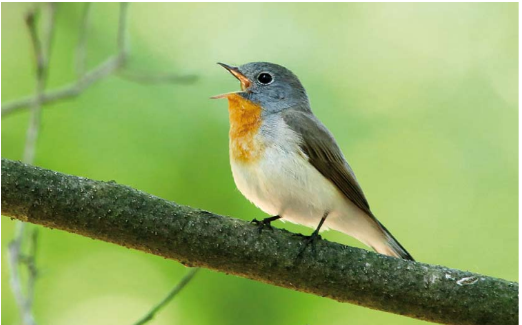
369 Kleine Vliegenvanger / Red-breasted Flycatcher Ficedula parva , adult mannetje, Hoge Veluwe, Gelderland, 22 mei 2018 ( Rob Half )