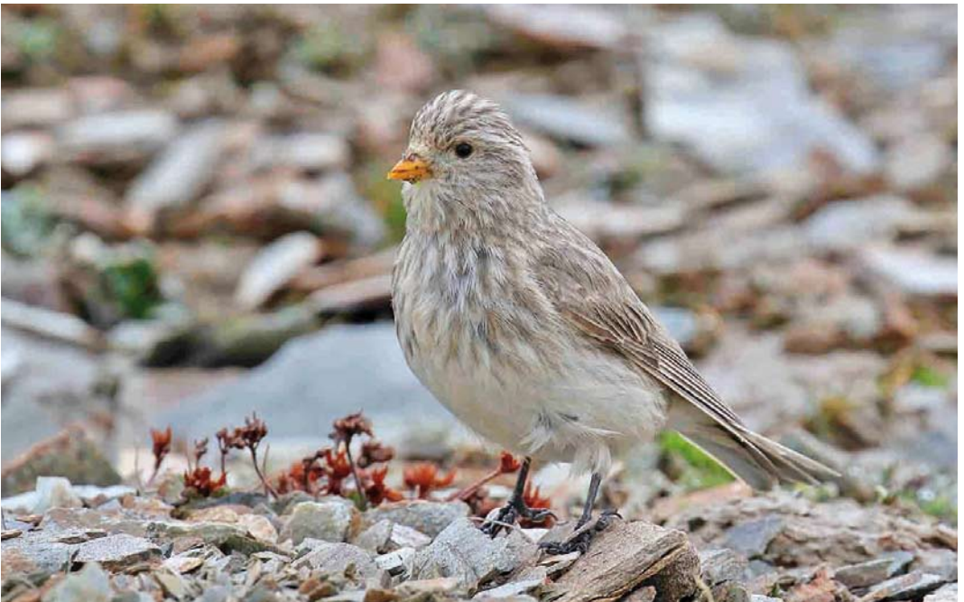
352 Sillem's Mountain Finch / Sillems Bergvink Leucosticte sillemi , female, Qinghai, China, 25 June 2018 (Karen Rose)