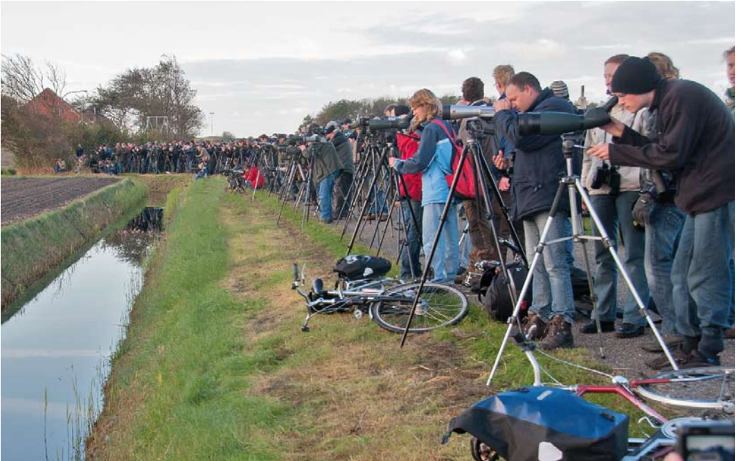
285 Vogelaars bij Kaspische Plevier / birders at Caspian Plover Anarhynchus asiaticus , Texel, Noord-Holland, 18 oktober 2009 (Arnaud B van den Berg)