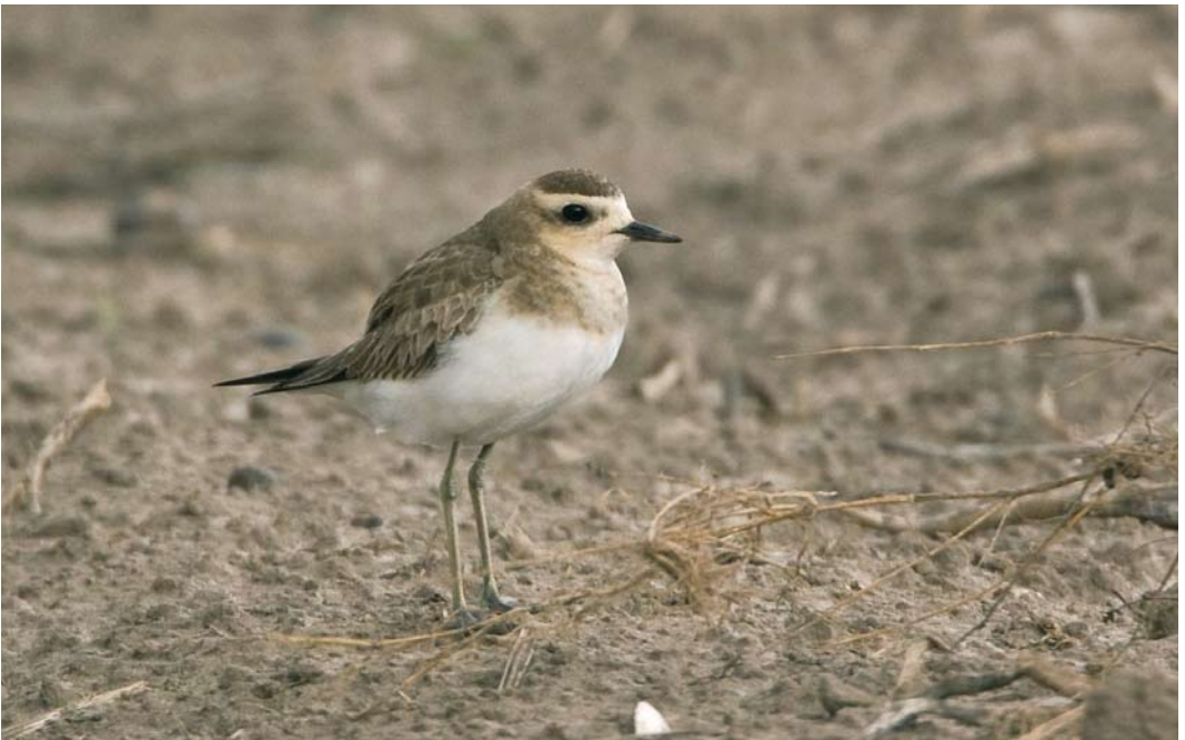
286 Kaspische Plevier / Caspian Plover Anarhynchus asiaticus , eerstejaars, Texel, Noord-Holland, 19 oktober 2009