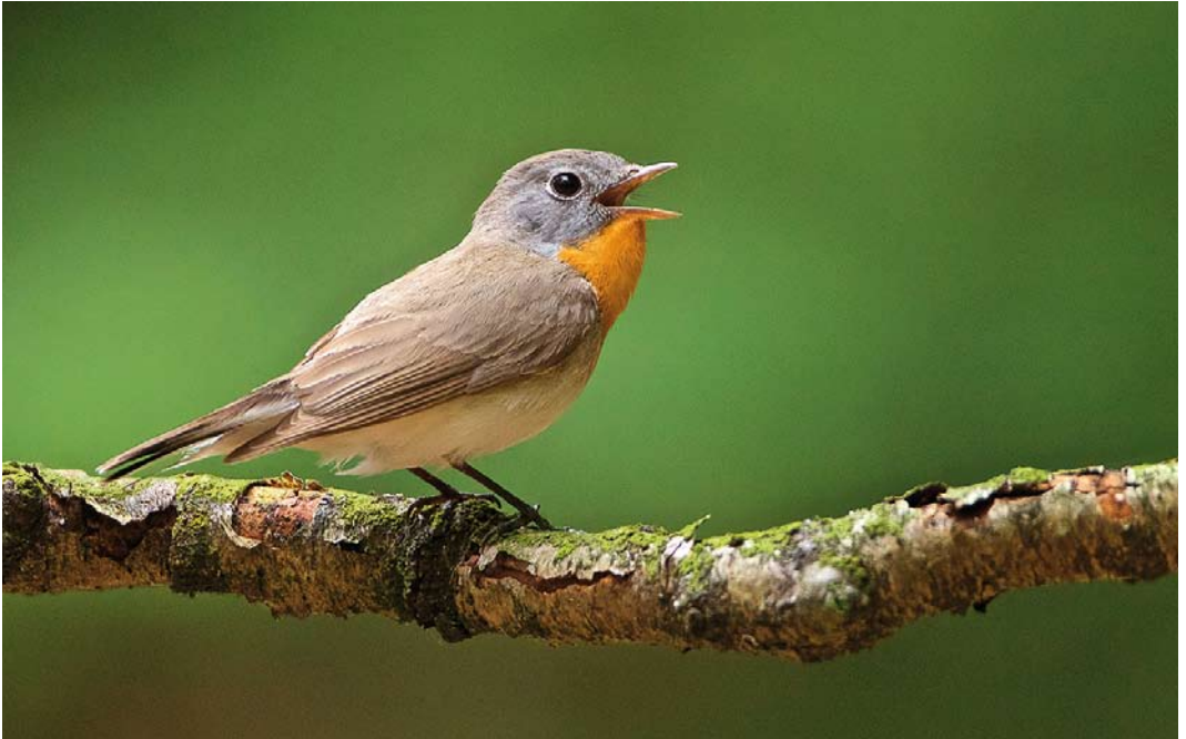
368 Kleine Vliegenvanger / Red-breasted Flycatcher Ficedula parva , adult mannetje, Hoge Veluwe, Gelderland, 3 juni 2018 ( Martin van der Schalk )