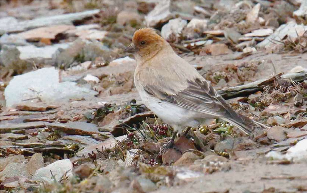
351 Sillem's Mountain Finch / Sillems Bergvink Leucosticte sillemi , male, Qinghai, China, 25 June 2018 (Werner Müller)