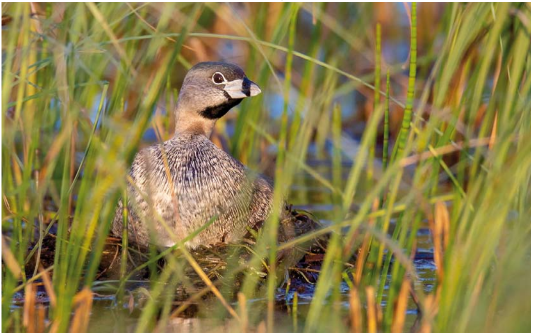
329 Pied-billed Grebe / Dikbekfuut Podilymbus podiceps , adult male, Loch Feorlin, Argyll, Scotland, 27 May 2018