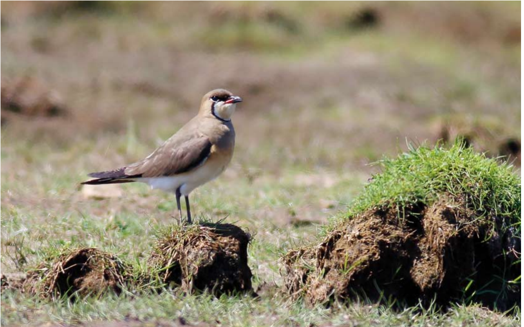
330 Oriental Pratincole / Oosterse Vorkstaartplevier Glareola maldivarum , adult, Nærland, Hå, Rogaland, Norway, 20 May 2018 (Ove Ferling)