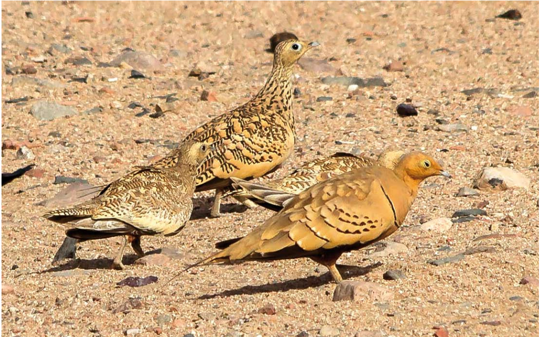
328 Chestnut-bellied Sandgrouse / Roodbuikzandhoenders Pterocles exustus floweri , male and female with juveniles, Gebel Elba, Hala'ib Triangle, Egypt, 24 July 2018