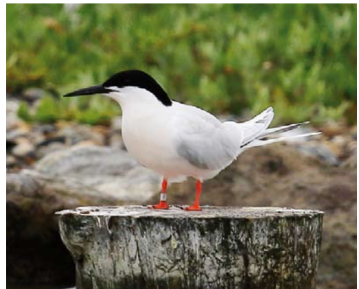
362 Bastaardarend / Greater Spotted Eagle Aquila clanga , vierde-kalenderjaar, Texel, Noord-Holland, 27 mei 2018 (Eric Menkveld) 363 Terekruijer / Terek Sandpiper Xenus cinereus , met Bontbekplevier / Common Ringed Plover Charadrius hiaticula , Den Oever, Noord-Holland, 21 mei 2018 (Fred Visscher) 364 Ralreiger / Squacco Heron Ardeola ralloides , Noordervroon, Westkapelle, Zeeland, 26 mei 2018 (Corstiaan Beeke) 365 Dougalls Stern / Roseate Tern Sterna dougallii , adult zomerkleed, De Putten, Camperduin, Noord-Holland, 25 juni 2018 (Eric Menkveld)

op 6 mei gefotografeerd bij Mirns, Friesland. Diezelfde dag was er ook een melding vanuit een rijdende auto vanaf de A2 bij Velddriel, Gelderland. Een onvolwassen Lammergier Gypaetus barbatus zonder 'merktekens' werd op 27 mei ontdekt op Walcheren, Zeeland, waar hij de nacht doorbracht bij Klein Valkenisse. Nadat hij de volgende ochtend hoog was opgestegen, ontbrak elk spoor tot hij op 29 mei kortstondig werd waargenomen bij Krabbendijke, Zeeland. Weer een dag later bleek hij zich te hebben verplaatst naar Noord-Holland, waar hij zich op 31 mei en 1 juni uitvoerig liet bekijken in de Schoorlse Duinen. De laatste waarnemingen werden gedaan op 2 juni, toen hij ver oostwaarts ten noorden van Deventer, Overijssel, vloog. Slangenarenden Circaetus gallicus werden op c negen verschillende plaatsen gemeld, maar alleen op de beste locaties voor deze soort, het Fochteloërveen, Drenthe/Friesland, en het Deelensche Veld op de Hoge Veluwe, Gelderland, bleven ze