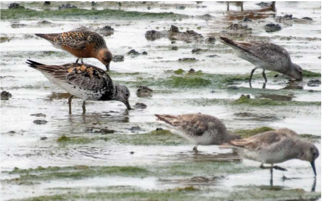
331 Great Knot / Grote Kanoet Calidris tenuirostris , with Red Knots / Kanoeten C. canutus , Seeryp, Terschelling, Friesland, Netherlands, 17 June 2018 (Wim van Zwieten)