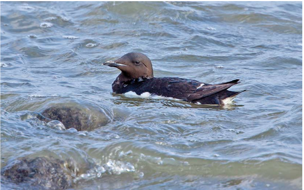
306 Kortbekzeekoet / Thick-billed Murre Uria lomvia , adult, Lauwersoog, Groningen, 29 juli 2012 (Alex Bos)