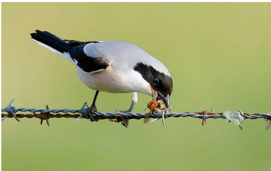
375 Kleine Klapekster / Lesser Grey Shrike Lanius minor , mannetje, Texel, Noord-Holland, 26 mei 2018 (Eric Menkveld)