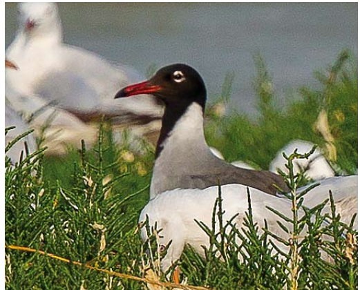
333 Northern Harrier / Amerikaanse Blauwe Kiekendief Circus hudsonius , male, Røstlandet, Nordland, Norway, 8 June 2018 334 Western Reef Heron / Westelijke Riffreiger Egretta gularis gularis , Dakhla, Western Sahara, Morocco, 17 March 2018 cf Dutch Birding 40: 118, 2018 335 American Royal Tern / Amerikaanse Koningsstern Sterna maxima , second-summer, Church Norton, West Sussex, England, 19 June 2018 336 White-eyed Gull / Witoogmeeuw Larus leucophthalmus , adult, Jahra pools reserve, Kuwait, 22 May 2018 cf Dutch Birding 40: 183, 2018

a female Black-browed on Bird Island, South Georgia, southern Atlantic, in 2007-10 were indeed genuine hybrids; previously, there were only five known or suspected mixed-species pairs, and three different hybrids in albatrosses, mostly between closely related species ( https://tinyurl.com/y739gwzu ). If accepted, a Leach's Storm Petrel Hydrobates leucorhous photographed off Khor Kalba on 25 May will be the first alive for the United Arab Emirates (UAE); the previous one was found dead on the road at the old Sharjah airfield on 8 June 1969. In the context of Jouanin's Petrel Bulweria fallax photographs in Sandgrouse 40: 86-89, 2018, it is worthwhile to add locality details for captions of two pictures of this species published in Dutch Birding 9: 72-73, 1987; the upper picture was taken in Arabian Sea at 11.47°N, 60.54°E (1 July 1985; east of Socotra) and the lower one in Gulf of Aden at 12.42°N, 50.56°E (4 July