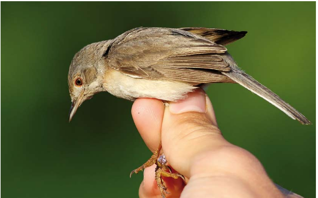
342 Nominate Eastern Subalpine Warbler / nominaat Balkanbaardgrasmus Sylvia cantillans cantillans , female, Christiansø, Denmark, 2 June 2018 (Thomas Varto Nielsen)