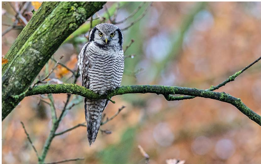
313 Sperweruil / Northern Hawk-Owl Surnia ulula , Zwolle, Overijssel, 28 november 2013