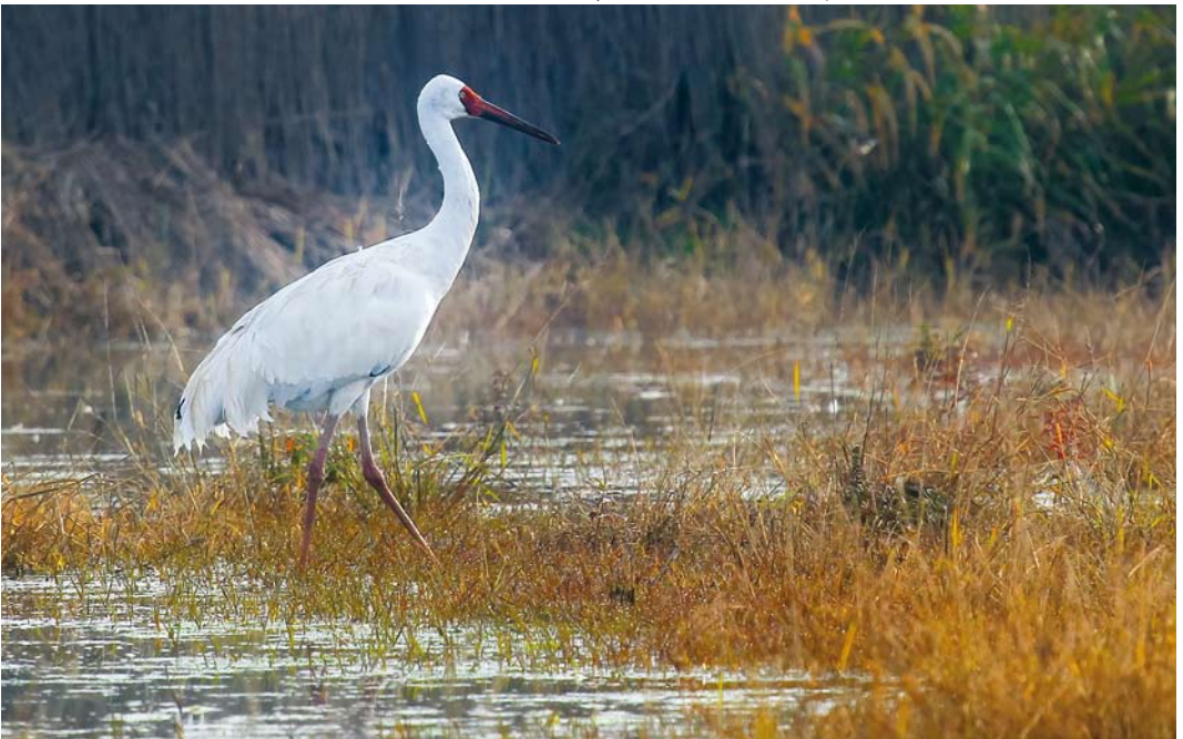
323 Siberian Crane / Siberische Witte Kraanvogel Grus leucogeranus , adult male ('Omid'), Fereydunkenar, Mazandaran, Iran, 15 January 2015 (Hamed Tizrooyan)