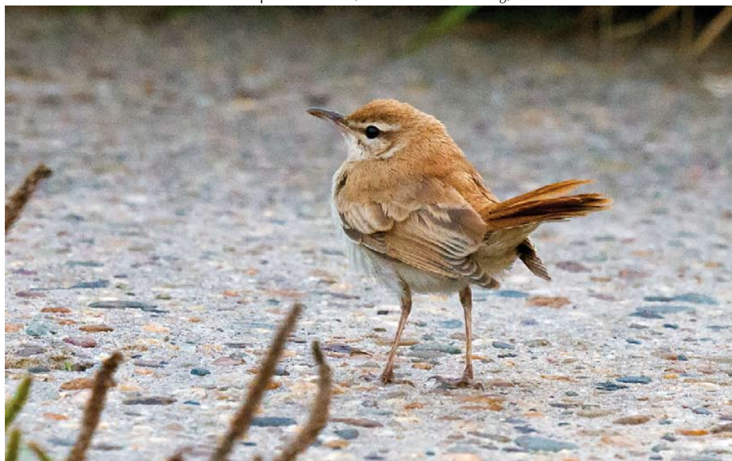
314 Rosse Waaiersstaart / Rufous-tailed Scrub Robin Cercotrichas galactotes , Petten, Noord-Holland, 27 september 2013 (Arnoud B van den Berg)