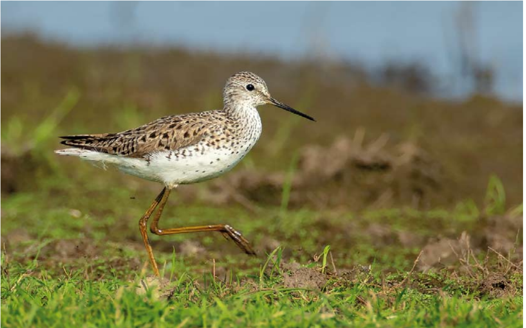
355 Poelruiter / Marsh Sandpiper Tringa stagnatilis , Middelburg, Zeeland, 26 mei 2018 (Corstiaan Beeke)