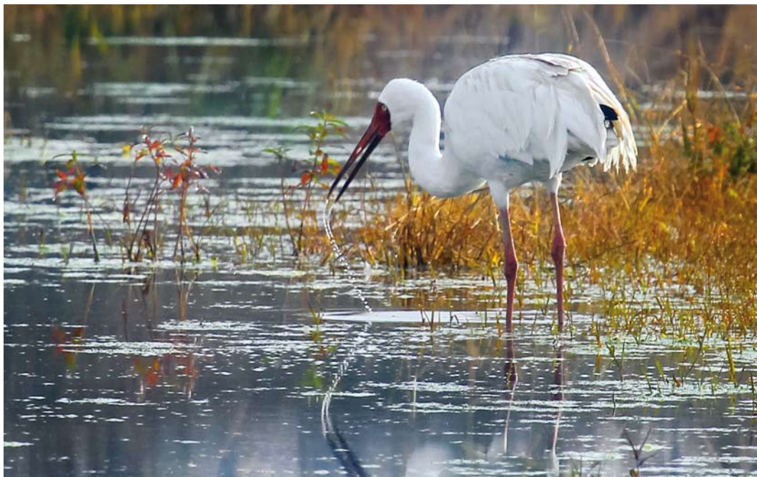
324 Siberian Crane / Siberische Witte Kraanvogel Grus leucogeranus , adult male ('Omid'), Fereydunkenar, Mazandaran, Iran, 15 January 2015 (Hamed Tizrooyan)

National Park, and Kurinskaya Kosa in Kyzyl-Agachsky reserve (Patrikeev 2004). The most recent records in Azerbaijan concerned two individuals in wetlands near Julfa in early November 2008 (Sorokin 2012), and a single bird in Kyzyl-Agachsky reserve on 29 January 2010 (Rozenfeld 2012). The status in Turkey is uncertain. Once, it may have been a vagrant or even a scarce but regular passage migrant but no certain evidence for this is forthcoming (for details, see Kirwan et al 2008). There are at least two records in Ukraine: three individuals were reported near Donetsk in September 1906 and a group of four and a single one were present at Askania Nova reserve near the Black Sea coast from 16 to 24 October 1996 (Snow & Perrins 1998, Havrilenko et al 2012; Paul Bradbeer in litt). Surprising was the first record for Jordan, which concerned three adults roosting at Qa' Khanna, 35 km north-west of Azraq, on 2 February 2001 (Hamidan 2003). A medieval record from the Nile delta in Egypt is also interesting (Provençal & Sørensen 1998).