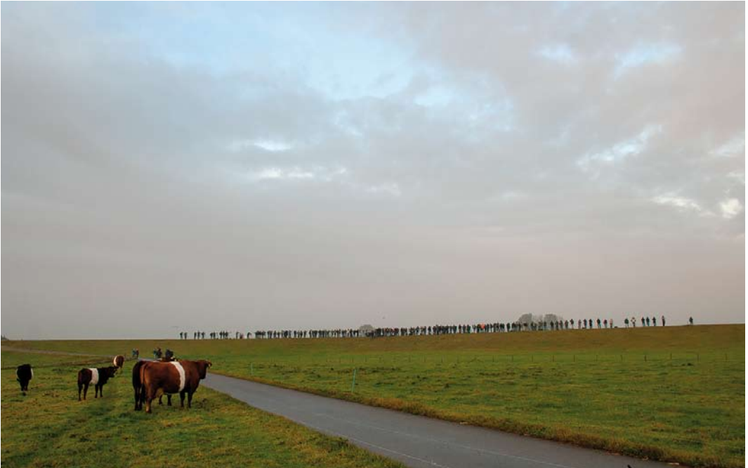
287 Vogelaars bij Taigastrandloper / birders at Long-toed Stint Calidris subminuta , Vreugderijkerwaard, Zwolle, Overijssel, 24 oktober 2009 (Roland Wantia)

schap van Martijn Renders. Een dergelijke stabiele situatie is natuurlijk gewoon goed nieuws omdat het iets zegt over waardering en behoefte van deze rubrieken. Wel stopte al vroeg in de periode, na 12 jaar, de rubriek 'Masters of Mystery'. De zesde en laatste ronde verscheen in het eerste nummer van 2009, waarna alle auteurs twee nummers later gezamenlijk nog eenmaal terugblikten waarbij en passant nog een foute determinatie werd gerectificeerd (een Oostelijke Orpheusgrasmus Sylvia crassirostris bleek toch een Braamsluiper S curruca )... Gelukkig bleek deze determinatiefout geen invloed te hebben gehad op de uitslag: hierover kon dan ook niet worden gecorrespondeerd. Een direct resultaat van de enquête, dat wellicht door slechts enkelen zal zijn opgemerkt, was de overstap naar mat papier met ingang van nummer 2 in 2010 zodat de leesbaarheid verbeterde en de foto's (nog!) scherper uitkwamen. Een andere veel gehoorde wens werd sinds maart 2011 gerealiseerd toen alle oude nummers van Dutch Birding als pdf online beschikbaar kwamen.