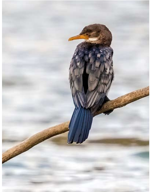
325 Red-footed Booby / Roodpootgent Sula sula , subadult, Punta de la Vaca, Gozón, Asturias, Spain, 6 June 2018 326 Reed Cormorant / Afrikaanse Dwergaalscholver Phalacrocorax africanus , Pedra Badejo, Santiago, Cape Verde Islands, 30 April 2018 cf Dutch Birding 40: 183, 2018 327 Mauritanian Heron / Mauritaanse Reiger Ardea monicae , La Sagra, Dakhla, Western Sahara, Morocco, 23 February 2018 cf Dutch Birding 40: 118, 2018