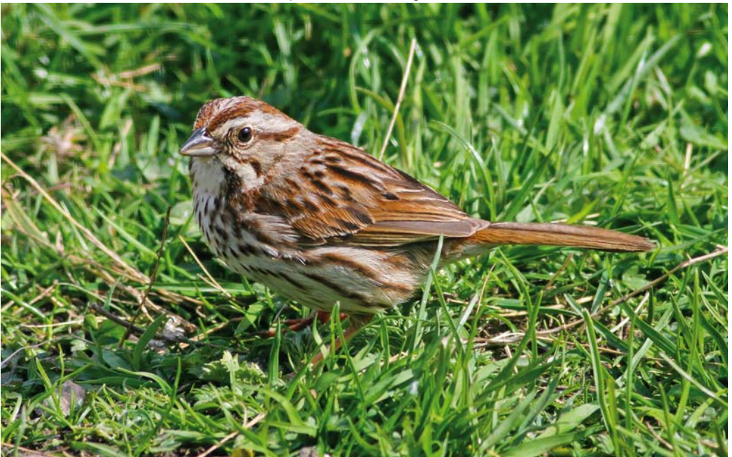
350 Song Sparrow / Zanggors Melospiza melodia , adult, Fair Isle, Shetland, Scotland, 15 May 2018 cf Dutch Birding 40: 198, 2018