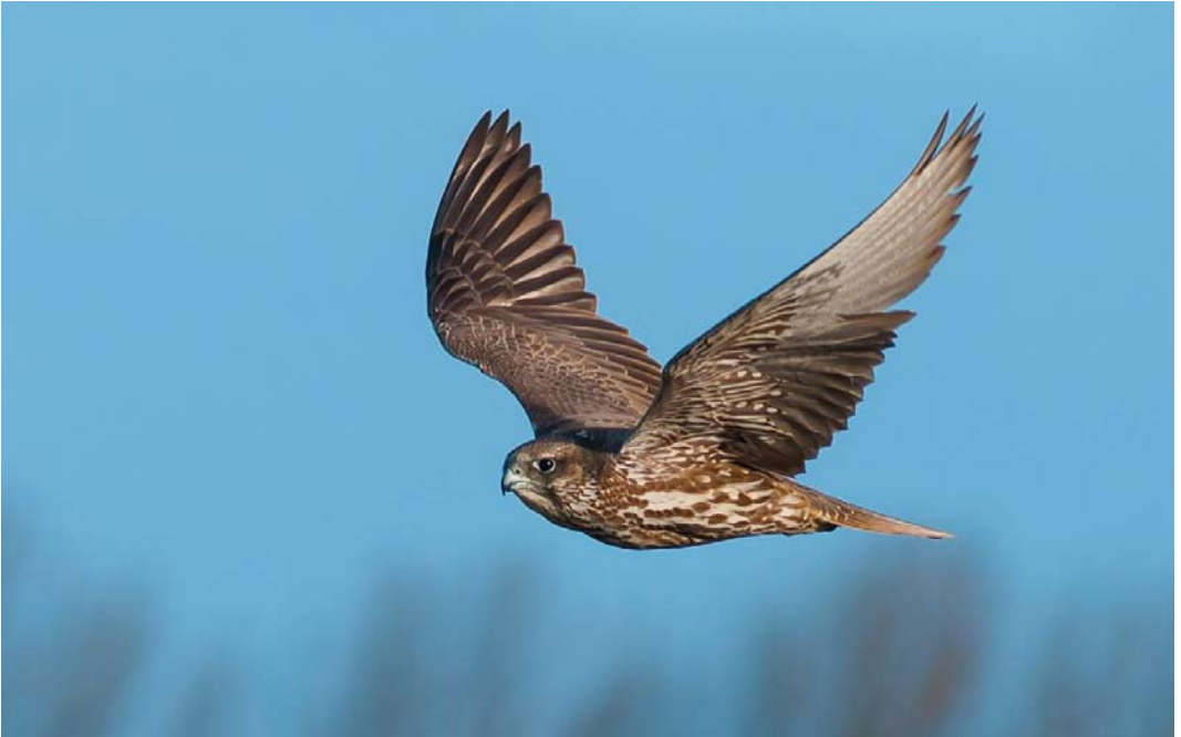
305 Giervalk / Gyr Falcon Falco rusticolus , Zandstraat, Sas van Gent, Zeeland, 22 januari 2012