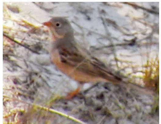
343 Little Bustard / Kleine Trap Tetrax tetrax , adult male, Karsiborska Kępa, Świnoujście, Pomerania, Poland, 12 May 2018 344 Red-tailed Shrike / Turkestaanse Klauwier Lanius phoenicuroides , male, Lezíria da Ponta da Erva, Vila Franca de Xira, Lisboa, Portugal, 14 July 2018 345 Amur Wagtail / Amoerkwikstaart Motacilla leucopsis , male, Kanshengel, Taukum, Kazakhstan, 21 May 2018 346 Black-faced Bunting / Maskergors Emberiza spodocephala , first-year male, Norwick, Unst, Scotland, 14 May 2018 347 Bimaculated Lark / Bergkalanderleeuwerik Melanocorypha bimaculata , Hillesland, Karmøy, Rogaland, Norway, 1 June 2018 348 Grey-necked Bunting / Steenortolaan Emberiza buchanani , male, Gotska Sandön, Gotland, Sweden, 2 June 2018