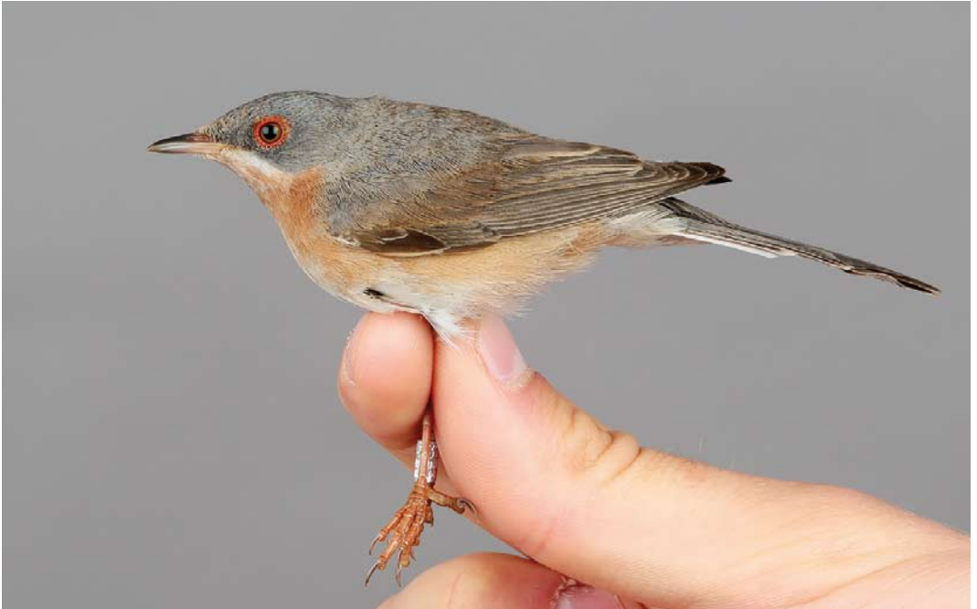
341 Moltoni's Warbler / Moltoni's Beardgrasmus Sylvia subalpina , male, Ottenby, Öland, Sweden, 26 May 2018