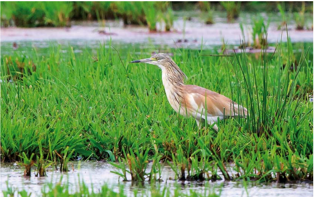
356 Ralreiger / Squacco Heron Ardeola ralloides , Oostpolder, Zuidlaardermeer, Groningen, 12 mei 2018