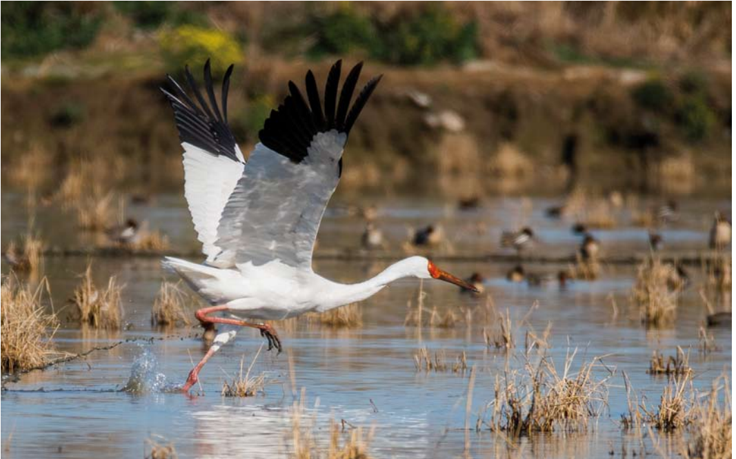
322 Siberian Crane / Siberische Witte Kraanvogel Grus leucogeranus , adult male ('Omid'), Fereydunkenar, Mazandaran, Iran, 30 January 2017 (Hamed Tizrooyan)