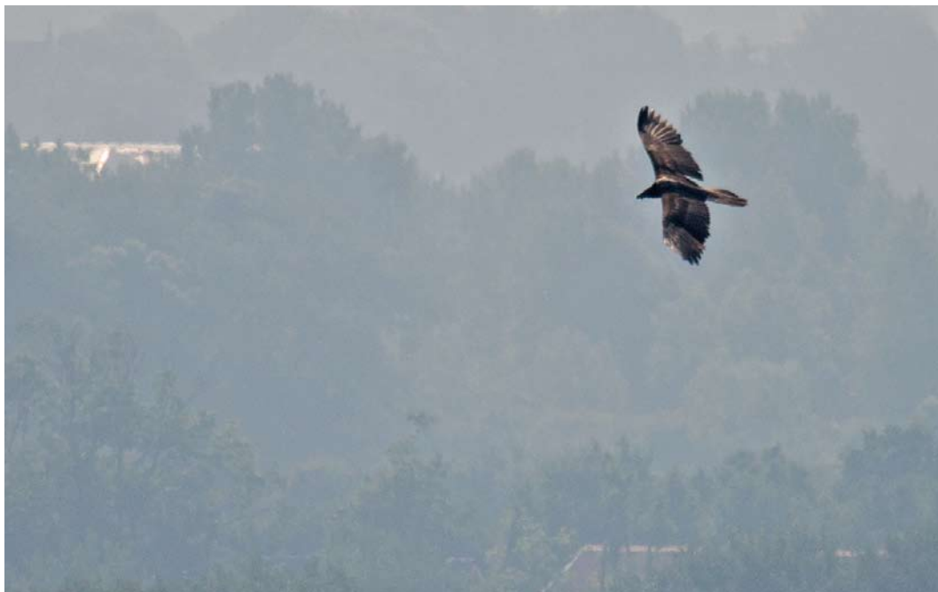
337 Bearded Vulture / Lammergeier Gypaetus barbatus , third calendar-year, Dishoek, Zeeland, Netherlands, 28 May 2018