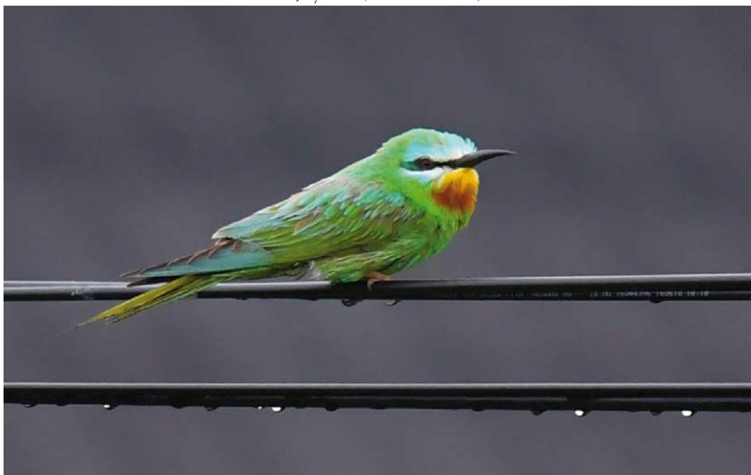
338 Blue-cheeked Bee-eater / Groene Bijeneter Merops persicus , Bulandet, Sogn og Fjordane, Norway, 14 July 2018