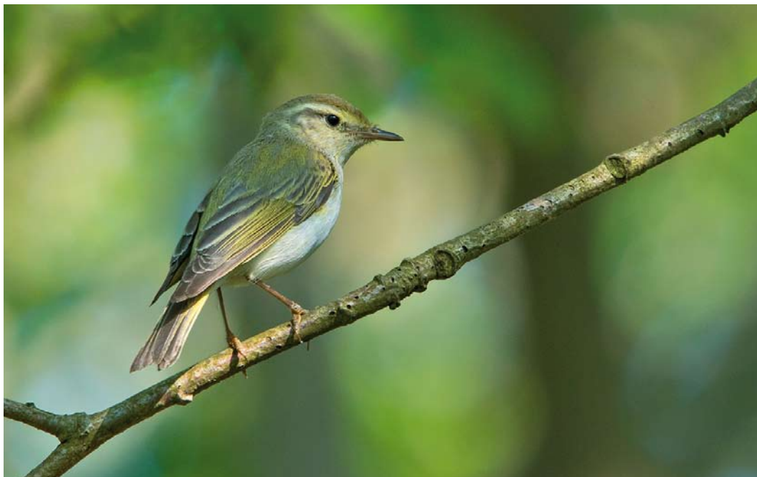
366 Hybride Bergfluitier x Fluitier / hybrid Western Bonelli's x Wood Warbler Phylloscopus bonelli x sibilatrix , Noordhollands Duinreservaat, Noord-Holland, 15 mei 2018 (Leo J R Boon)