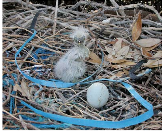
317-318 Goliath Heron / Reuzenreiger Ardea goliath , nest with one egg and one young chick, Wadi Lahami, Egypt, 28 April 2006

a recently hatched chick. The nest was a near-circular platform more than 1 m wide with a central depression, built of dead sticks and c 0.5-0.8 m above the water surface in low branches of a mangrove tree (plate 317-318). The size of the nest and egg and appearance of the chick, together with the fact that an adult was flushed from the vicinity of the nest, left no doubt that this nest was from a Goliath. As soon as the nest was photographed, PAC left the area and the three of us moved away to allow the adult to return to the nest. We did not visit the spot again to minimize disturbance and left the area the next day so we have no information on the fate of the nest.