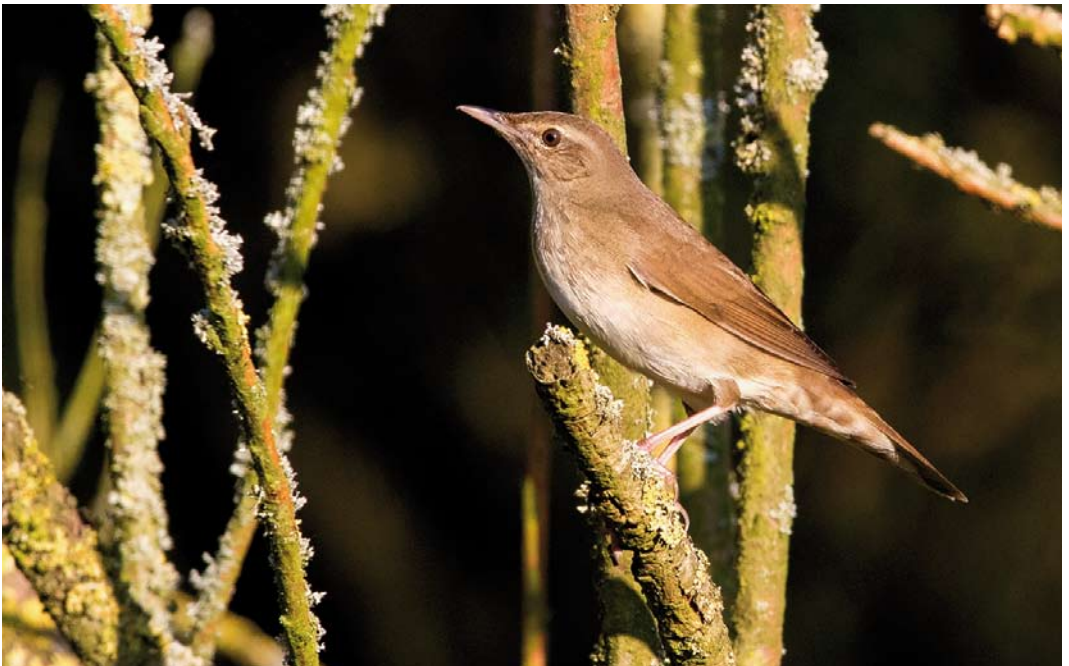
377 Krekelzanger / River Warbler Locustella fluviatilis , Boetelerbroek, Raalte, Overijssel, 15 mei 2018