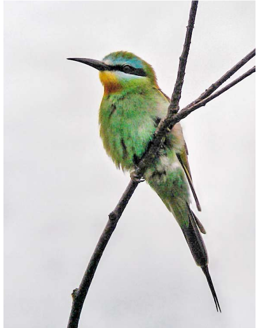
297 Groene Bijeneter / Blue-cheeked Bee-eater Merops persicus , Castricum, Noord-Holland, 16 augustus 2010 (Leo Heemskerck)

leuca werd op 17 oktober door Mark Hoekstein gevonden op zijn geliefde Noord-Beveland, Zeeland. De vogel zou tot 7 mei 2012 – bijna 19 maanden – blijven: dat is nog eens een kans voor de late beslisser! De eerste Daurische Klauwier voor het binnenland zat op 31 oktober bij Bergen, Limburg. Het was ook een najaar met vier Blauwstaarten Tarsiger cyanurus (drie vangsten): ooit een mega maar in de hier behandelde tijdsperiode werden tot jaarsoort. De tweede Meenatortel werd op 16 november door een Duitse visser gefotografeerd op een boot ter hoogte van Texel. Arnold Meijer zorgde bijna 20 jaar na het eerste geval op 22 november voor veel vreugde onder vogelaars met zijn Rotskruiper Tichodroma muraria in de ENCI-groeve bij Maastricht. Niet iedereen was echter even blij: de vogel was vaak erg moeilijk te vinden en er is een auto die er vanuit de Randstad vijf keer heen is gereden. Zonder resultaat voor de inzittenden. De vogel zou in maart 2012 nogmaals – eenmalig – worden gezien. Op 24 en 25 december was Nederland bedekt met sneeuw en ijs. Precies op deze dagen besloot de eerste Grote Trap Otis tarda sinds 1997 zich eerst te laten zien en vervolgens flink te verplaatsen van Gelderland