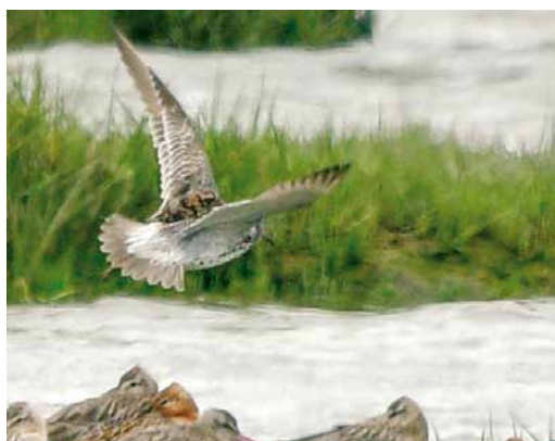
178 Grote Kanoet / Great Knot Calidris tenuirostris , adult, met Rosse Grutto's / Bar-tailed Godwits Limosa lapponica en Kanoeten / Red Knots C canutus , Seeryp, Terschelling, Friesland, 16 juni 2018 179-180 Grote Kanoet / Great Knot Calidris tenuirostris , adult, met Rosse Grutto's / Bar-tailed Godwits Limosa lapponica en Kanoeten / Red Knots C canutus , Seeryp, Terschelling, Friesland, 16 juni 2018 181 Grote Kanoet / Great Knot Calidris tenuirostris , adult, met Kanoet / Red Knot C canutus , Seeryp, Terschelling, Friesland, 17 juni 2018 182 Grote Kanoet / Great Knot Calidris tenuirostris , adult, Seeryp, Terschelling, Friesland, 18 juni 2018