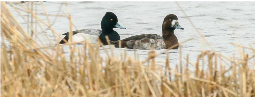
252 Bastaardarend / Greater Spotted Eagle Clanga clanga , of hybride met Schreeuwarend / Lesser Spotted Eagle C pomarina , tweede kalenderjaar, Maashorst, Noord-Brabant, 19 April 2019 ( Alain Hofmans ) 253 Grijze Wouw / Black-winged Kite Elanus caeruleus , De Horde, Lopik, Utrecht, 5 april 2019 ( Arjan Boele ) 254 Ringsnaveleend / Ring-necked Duck Aythya collaris , adult mannetje, met Kuifeenden / Tufted Ducks A fuligula , mannetjes, Reeuwijkse Plassen, Zuid-Holland, 28 maart 2019 ( Johannes Luiten ) 255 Kleine Topper / Lesser Scaup Aythya affinis , mannetje, met Topper / Greater Scaup A marila , vrouwtje, Dijkwielen, Noord-Holland, 21 maart 2019 ( Fred Visscher )