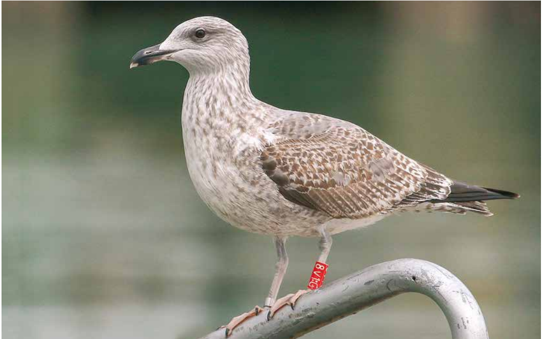
201 Yellow-legged Gull / Geelpootmeeuw Larus michahellis, Ondarroa, País Vasco, Spain, 10 November 2017. Typical second-winter, with some grey feathers in mantle and wing-coverts (type 3 plumage). Bird 8V1G was ringed as nestling on 1 July 2016. 202 Yellow-legged Gull / Geelpootmeeuw Larus michahellis, San Sebastián, País Vasco, Spain, 7 February 2016. Typical first-winter, assigned to plumage type 2, with juvenile feathers in wing-coverts. Bird 8L2G was ringed as nestling on 25 June 2015.