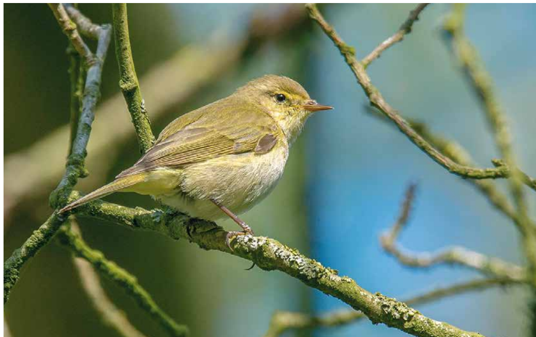
262 Iberische Tjiftjaf / Iberian Chiffchaff Phylloscopus ibericus , Stadspark, Groningen, Groningen, 19 april 2019 (Marnix Jonker) 263 Iberische Tjiftjaf / Iberian Chiffchaff Phylloscopus ibericus , De Tuintjes, Texel, Noord-Holland, 8 april 2019 (Jeroen de Bruijn) 264 Balkanbaardgrasmus / Eastern Subalpine Warbler Sylvia cantillans , eerste-zomer mannetje, Schiermonnikoog, Friesland, 26 april 2019 (Wouter van der Ham)