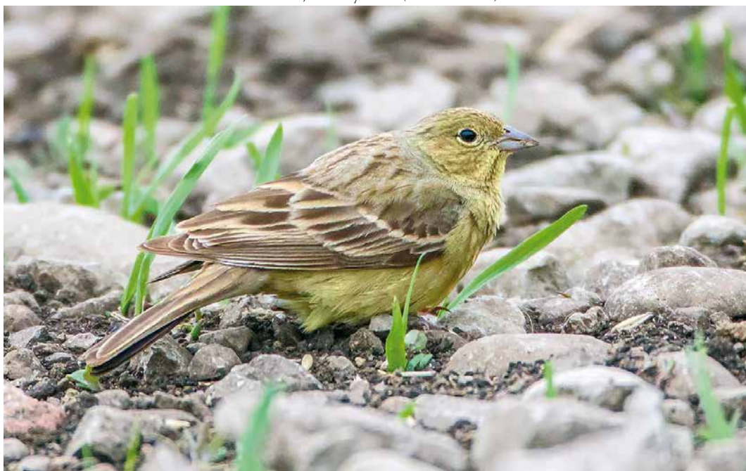
249 Eastern Cinereous Bunting / Oostelijke Smyrnagors Emberiza cineracea semenowi , male, Sundre, Gotland, Sweden, 17 May 2019 ( Fredrik Ström )