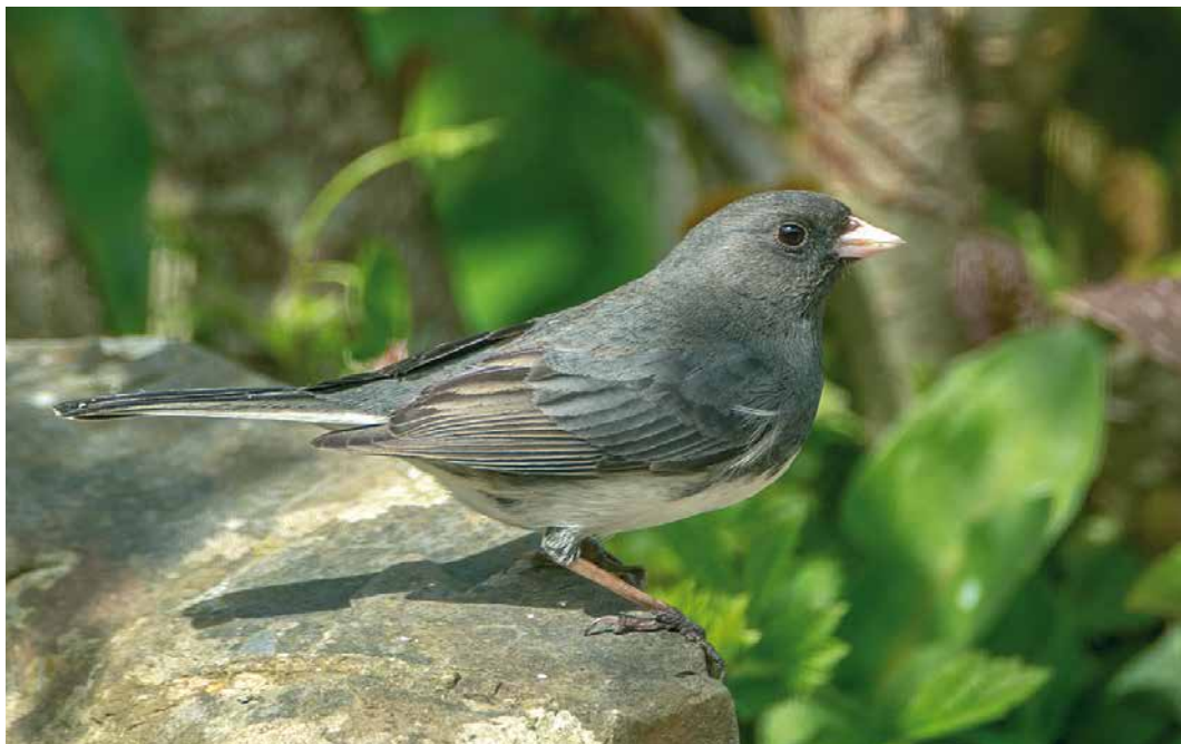
248 Dark-eyed Junco / Grijze Junco Junco hyemalis , first-summer male, Westward Ho!, Devon, England, 27 April 2019