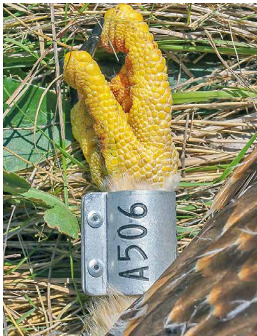
191-192 Keizerarend / Eastern Imperial Eagle Aquila heliaca , mannetje, nestjong na ringen op nest (A506, 'Ladybird'), Devavanya, Békés, Hungary, 18 juni 2014 (Márton Horváth)

rige waren geruid en dus niet te vergelijken) overeen, hoewel deze in oktober door verdere veroudering meer beschadigd waren (Nils van Duiven-dijk in litt).