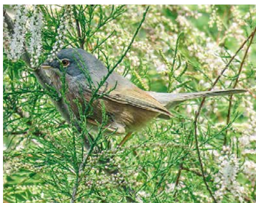
242 Seebohm's Wheatear / Seebohms Tapuut Oenanthe seebohmi , first-summer male, Templeuve, Hainaut, Belgium, 7 May 2019 ( Vincent Legrand ) 243 Pallas's Reed Bunting / Pallas' Rietgors Emberiza pallasii , male, Rönnskär, Kirkkonummi, Finland, 19 May 2019 ( Mika Bruun ) 244 White-crowned Sparrow / Witkruingors Zonotrichia leucophrys , Sandøy, Bulandet, Sogn og Fjordane, Norway, 5 May 2019 ( Anders Braanaas ) 245 Spanish Sparrow / Spaanse Mus Passer hispaniolensis , male, Brovande, Skagen, Denmark, 15 May 2019 ( Leif Jensen ) 246 Black-headed Wagtail / Balkankwikstaart Motacilla feldegg , male, Santa Maria, Sal, Cape Verde Islands, 19 April 2019 ( Uwe Thom ) 247 Tristram's Warbler / Atlasgrasmus Sylvia deserticola , male, Platja de l'Arbre del Gos, Albufera de Valencia, Valencia, Spain, 13 April 2019 ( Joan Ballagon )