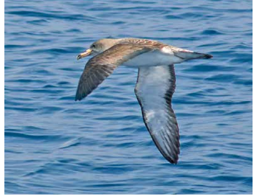
197 Scopoli's Shearwater / Scopoli's Pijlstormvogel Calonectris diomedea , Canó de Palamós, Catalunya, Spain, 23 May 2018 (Ricard Gutiérrez). Fairly typical diomedea phenotype, with white tongues on all primaries (category 5), and fairly clean underwing-coverts, although with intermediate robustness. 198 Scopoli's Shearwater / Scopoli's Pijlstormvogel Calonectris diomedea , Canó de Palamós, Catalunya, Spain, 23 May 2018 (Ricard Gutiérrez). As bird in plate 197 but with even cleaner underwing-coverts.

Randi et al 1989, Granadeiro 1993, Gómez-Díaz et al 2006, Pyle 2008).