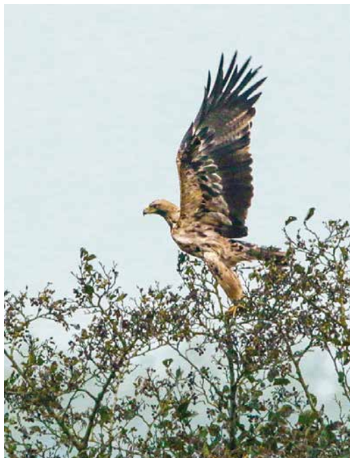
188-189 Keizerarend / Eastern Imperial Eagle Aquila heliaca , vierde-kalenderjaar mannetje (A506), Zwartsluis, Overijssel, 10 oktober 2017

dere staart. Lange, brede, diep gevingerde vleugels; zeven vingers duidelijk zichtbaar. Staart niet uitgesproken kort of lang, afgerond. Achterrand van vleugels met lichte S-bocht. Zware borst. Kop redelijk ver uitstekend. Zware, sterk gekromde licht gekleurde snavel, opvallend groot, washuid geel. Zware, dikke poten met opvallende klauwen. Lange broekveren.