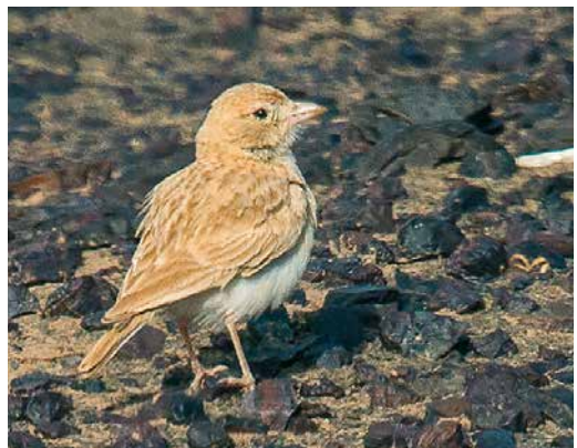
219 Red-footed Booby / Roodpootgent Sula sula , adult, Raso, Cape Verde Islands, 24 April 2019 ( Daniel López-Velasco ) 220 Black-winged Kite / Grijze Wouw Elanus caeruleus , Kondratowice, Dolnośląskie, Poland, 12 April 2019 ( Krzysztof Ostrowski ) 221 Black Heron / Zwarte Reiger Egretta ardesiaca , Santiago, Cape Verde Islands, 28 April 2019 ( Daniel López-Velasco ) 222 Belted Kingfisher / Bandijsvogel Megasceryle alcyon , female, Varmá river, Mosfellsbær, Iceland, 10 April 2019 ( Guðmundur Falk ) 223 Mourning Dove / Treurduif Zenaida macroura , North Ronaldsay, Orkney, Scotland, 29 April 2019 ( Toby Green ) 224 African Dunn's Lark / Afrikaanse Dunns Leeuwerik Eremalauda dunnii dunnii , Dayet Srij, Merzouga, Morocco, 2 April 2019 ( Arnoud B van den Berg )