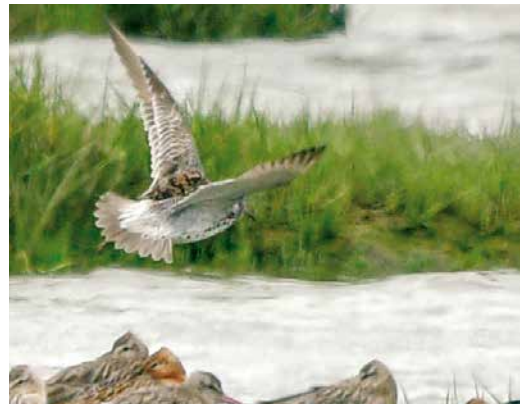
178 Grote Kanoet / Great Knot Calidris tenuirostris , adult, met Rosse Grutto's / Bar-tailed Godwits Limosa lapponica en Kanoeten / Red Knots C canutus , Seeryp, Terschelling, Friesland, 16 juni 2018 179-180 Grote Kanoet / Great Knot Calidris tenuirostris , adult, met Rosse Grutto's / Bar-tailed Godwits Limosa lapponica en Kanoeten / Red Knots C canutus , Seeryp, Terschelling, Friesland, 16 juni 2018 181 Grote Kanoet / Great Knot Calidris tenuirostris , adult, met Kanoet / Red Knot C canutus , Seeryp, Terschelling, Friesland, 17 juni 2018 182 Grote Kanoet / Great Knot Calidris tenuirostris , adult, Seeryp, Terschelling, Friesland, 18 juni 2018