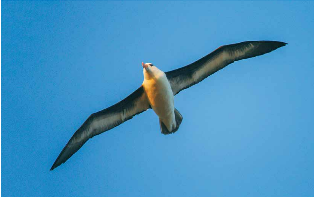
229 Black-browed Albatross / Wenkbrauwalbatros Thalassarche melanophris , adult, Helgoland, Schleswig-Holstein, Germany, 8 April 2019 ( Nico Ordax Sommer ) 230 African Grey Woodpecker / Grijsgroene Specht Dendropicos goertae , male, 15 km north-east of Ouadâne, Adrar, Mauritania, 12 March 2019 ( Daniel Mauras ) 231 Blue-cheeked Bee-eater / Groene Bijeneter Merops persicus , Drilon, Korçë, Albania, 3 May 2019 ( Anna Dénes )