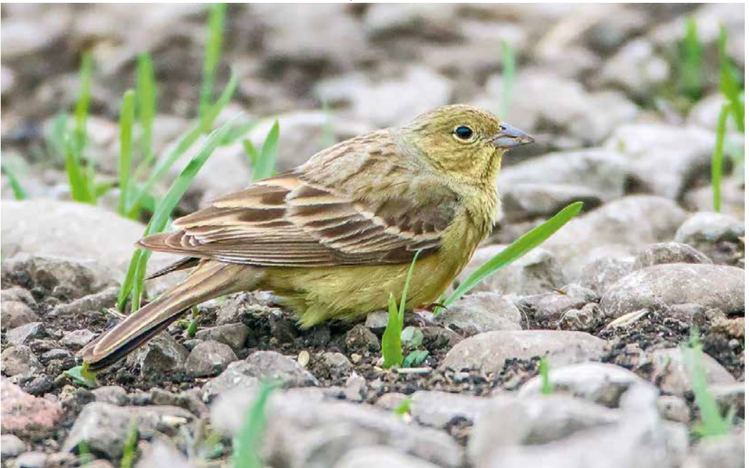
249 Eastern Cinereous Bunting / Oostelijke Smyrnagors Emberiza cineracea semenowi , male, Sundre, Gotland, Sweden, 17 May 2019 ( Fredrik Ström )