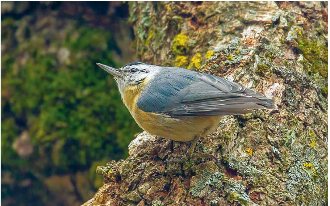
236 Algerian Nuthatch / Algerijnse Boomklever Sitta ledanti , male, Djimla forest, Jijel, Algeria, 27 March 2019