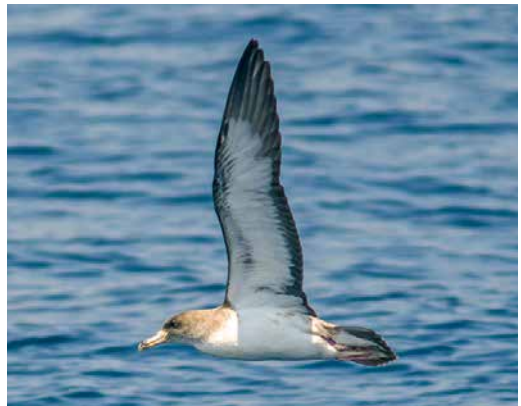
193 Cory's Shearwater / Kuhls Pijlstormvogel Calonectris borealis , Xàbia, Alicante, Spain, 7 May 2018. Short whitish tongue basally on underside of p9 and at very base of p10 fits category 2/3 being presumed borealis (see main text). This individual has intermediate robustness fairly typical of borealis phenotype. 194 Cory's Shearwater / Kuhls Pijlstormvogel Calonectris borealis , Badia de Roses, Catalunya, Spain, 12 May 2007. Classic borealis phenotype with under primaries all dark (category 1), relatively heavy density of dark markings in lesser and median underwing-coverts, and fairly robust bill. 195 Cory's Shearwater / Kuhls Pijlstormvogel Calonectris borealis , Cap de Creus, Catalunya, Spain, 28 May 2016. Comments same as in caption of plate 194. 196 Cory's Shearwater / Kuhls Pijlstormvogel Calonectris borealis , Canó de Palamós, Catalunya, Spain, 23 May 2018. Comments same as in caption of plate 194, although overall somewhat more robust, suggesting male.

diomedea colony on Linosa, Sicily, with no report of breeding (Janni & Fracasso 2015). However, there is no evidence that hybrids were reared on Linosa.