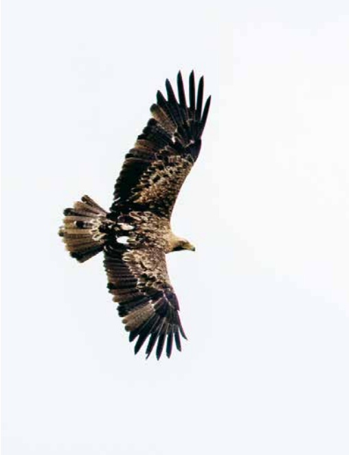
190 Keizerarend / Eastern Imperial Eagle Aquila heliaca , vierde-kalenderjaar mannetje (A506), Genemuiden, Overijssel, 4 oktober 2017 (Edwin Winkel)

name buitenste middelste armdekveren lichter. Grote dekveren met vrij brede lichte randen. Ondervleugel met groot contrast tussen overwegend donkere slagpen en veel lichtere dekveren. Handpennen en armpennen overwegend donker (zwartachtig), met onopvallende lichtere bandering. Binnenste handpennen en buitenste armpennen veel lichter, duidelijk venster vertoend, als op bovenzleugel; basale bandering hier meest opvallend. Ondervleugeldekveren licht geelbruin, met opvallende, donkerdere vlekking/streping (in middelste dekveren bijna 50% donkere veren).