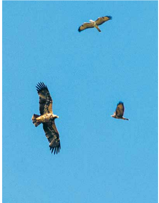
183 Keizerarend / Eastern Imperial Eagle Aquila heliaca , vierde-kalenderjaar mannetje (A506), Brobbelbies-Noord, Noord-Brabant, 27 september 2017 ( Toy Janssen ) 184 Keizerarend / Eastern Imperial Eagle Aquila heliaca , vierde-kalenderjaar mannetje (A506), met Buizerds / Common Buzzards Buteo buteo , Brobbelbies-Noord, Noord-Brabant, 27 september 2017 ( Herman Bouman ) 185 Keizerarend / Eastern Imperial Eagle Aquila heliaca , vierde-kalenderjaar mannetje (A506), met Haas / Brown Hare Lepus europaeus , Genemuiden, Overijssel, 4 oktober 2017 ( Ruud E Brouwer )