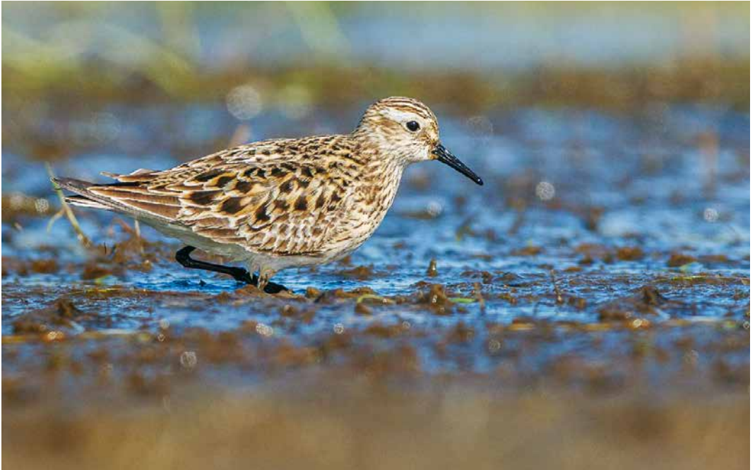
227 Baird's Sandpiper / Bairds Strandloper Calidris bairdii , Garður, Iceland, 10 May 2019