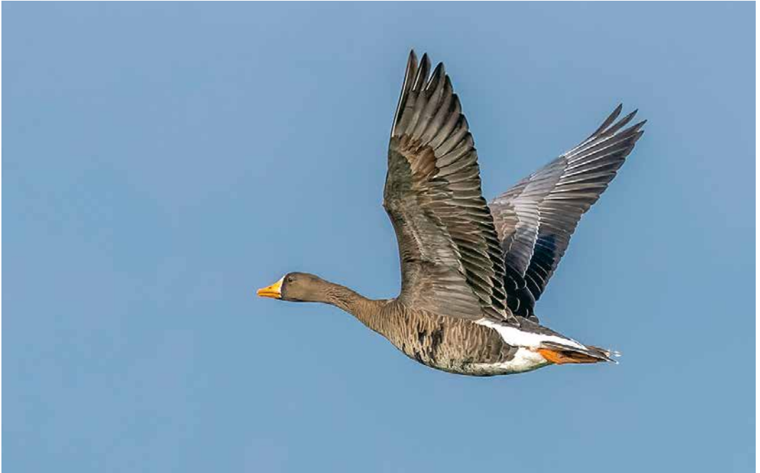
256 Groenlandse Kogans / Greenland White-fronted Goose Anser albifrons flavirostris , adult, Emmadorp, Zeeuws-Vlaanderen, Zeeland, 14 maart 2019 (Vincent Legrand)