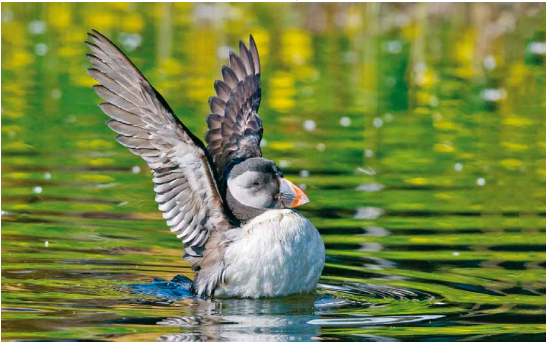
257 Papegaiduiker / Atlantic Puffin Fratercula arctica , tweede-kalenderjaar, Dordrecht, Zuid-Holland, 29 maart 2019 (Jaap Denee)