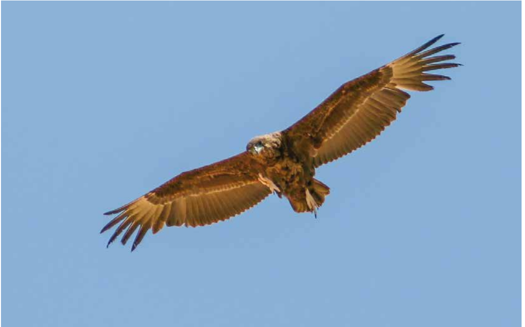
232 Bateleur / Bateleur Terathopius ecaudatus , second calendar-year, Eilat, Israel, 10 April 2019 ( Tapani Lilja ) 233 Omani Owl / Omaanse Uil Strix butleri , juvenile, Kangan, Bushehr, Iran, 10 May 2019 ( Ali Kasravi ) 234 Brown-necked Raven / Bruinnekraaf Corvus ruicollis , Lampedusa, Italy, 29 March 2019 ( Aldo Lauricella )