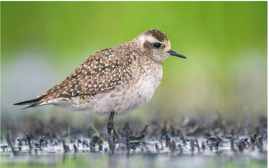
226 American Golden Plover / Amerikaanse Goudplevier Pluvialis dominica , first-summer, Padule di Fucecchio, Toscana, Italy, 23 April 2019