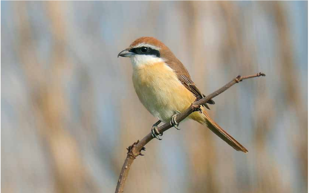
235 Brown Shrike / Bruine Klauwier Lanius cristatus , adult male, Great Cowden, East Yorkshire, England, 11 May 2019 (Graham Jepson)