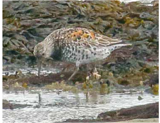
177 Grote Kanoet / Great Knot Calidris tenuirostris , adult, De Cocksdorp, Texel, Noord-Holland, 15 mei 2016 (Eric Menkveld)

hebben enkele 100-en vogelaars de vogel bezocht (Kok 2016).