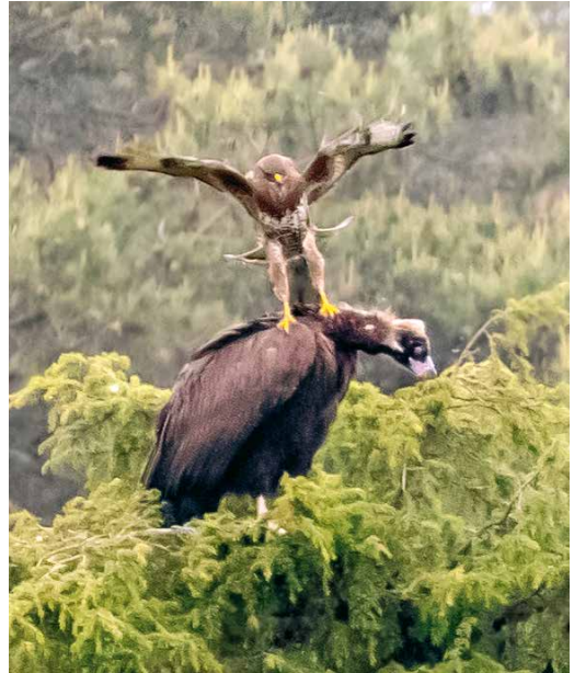
268 Monniksgier / Cinereous Vulture Aegypius monachus , tweede-kalenderjaar, aangevallen door Buizerd / Common Buzzard Buteo buteo , Hellendoorn, Overijssel, 25 mei 2019

landse grens. De vogel was in het wild geboren, droeg een witte kleurring met zwarte letters FUH en was afkomstig van de Franse herintroductiepopulatie in de Grands Causses (sinds 2004 zelfvoorzienend). Op 21 mei gingen beide gieren aan het begin van de middag op de wieden en werden door drie waarnemers boven Nederlands grondgebied gezien aan de noordkant van Maastricht, Limburg, om daarna van de radar te verdwijnen.