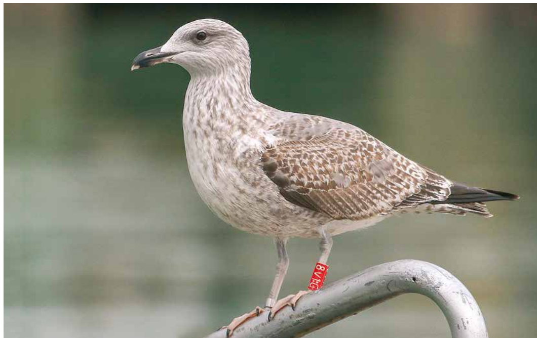
201 Yellow-legged Gull / Geelpootmeeuw Larus michahellis, Ondarroa, País Vasco, Spain, 10 November 2017. Typical second-winter, with some grey feathers in mantle and wing-coverts (type 3 plumage). Bird 8V1G was ringed as nestling on 1 July 2016. 202 Yellow-legged Gull / Geelpootmeeuw Larus michahellis, San Sebastián, País Vasco, Spain, 7 February 2016. Typical first-winter, assigned to plumage type 2, with juvenile feathers in wing-coverts. Bird 8L2G was ringed as nestling on 25 June 2015.