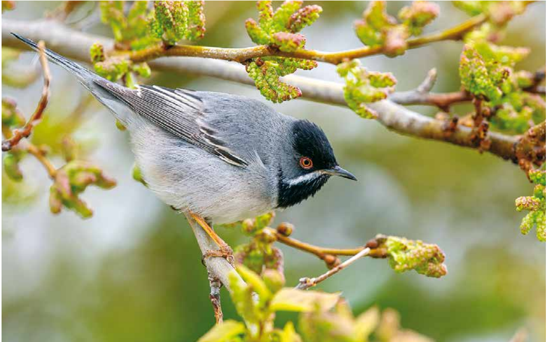
237 Rüppell's Warbler / Rüppells Grasmus Sylvia ruppeli , second calendar-year male, Saintes-Maries-de-la-Mer, Bouches-du-Rhône, France, 6 April 2019