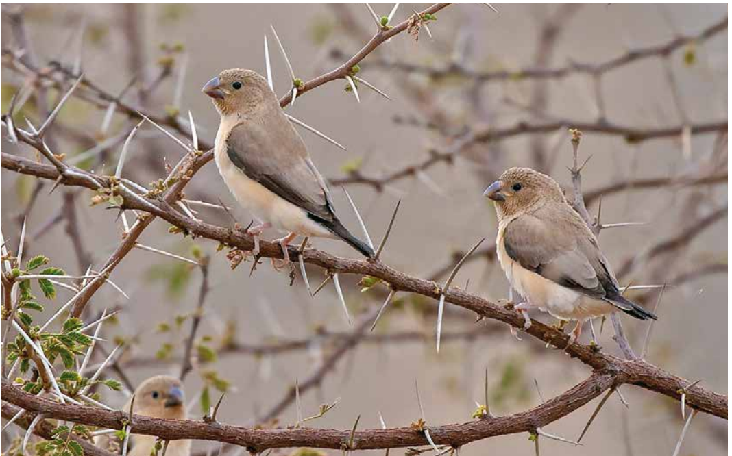
251 African Silverbills / Zilverbekjes Euodice cantans , Oued Tamanrasset, Algeria, 24 March 2019