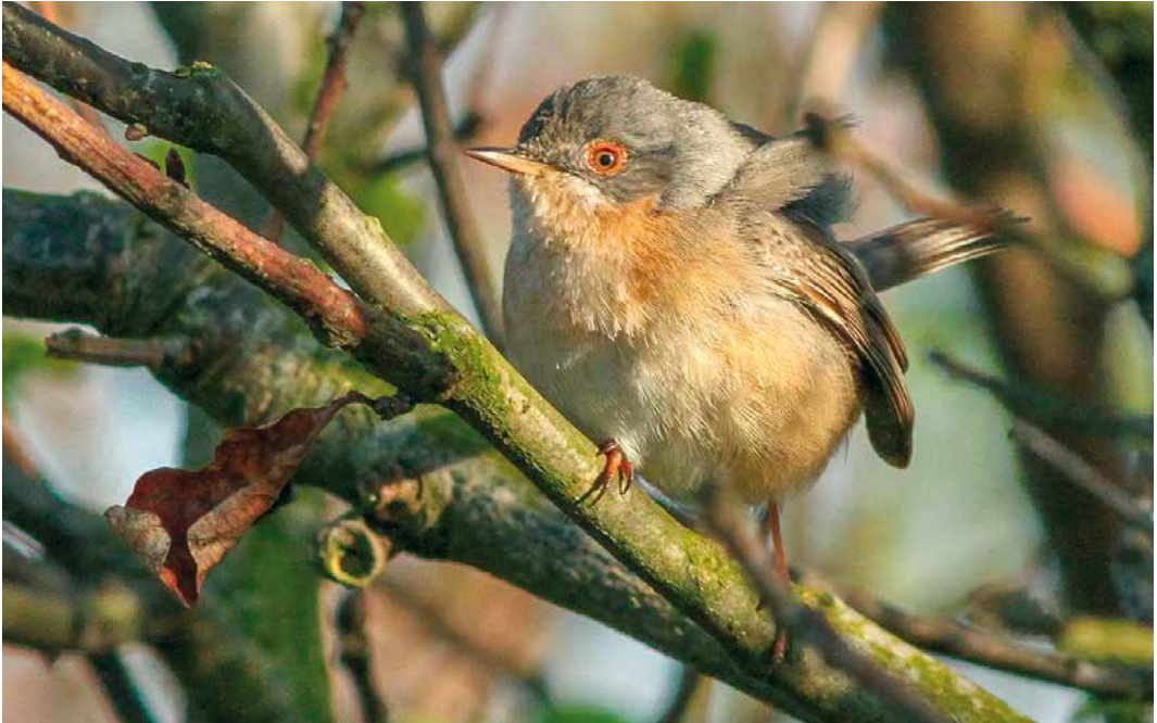
265 Baardgrasmus / subalpine warbler Sylvia inornata/cantillans/subalpina , Ameland, Friesland, 26 april 2019

posten passeerden, werden er vijf vanaf deze befaamde plek waargenomen; leuk was een exemplaar op 16 april dat c 20 minuten later recht over de tuin van een vogelaar in Middelburg, Zeeland, vloog. De invasie van Witkopstaartmezen Aegithalos caudatus caudatus doofde langzaam uit; verspreid over de periode kwamen er nog meldingen uit 45 uurhokken.