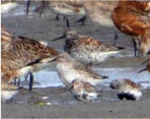
176 Grote Kanoet / Great Knot Calidris tenuirostris , adult, met Rosse Grutto's / Bar-tailed Godwits Limosa lapponica , Kanoeten / Red Knots C. canutus en Bonte Strandlopers / Dunlins C. alpina , De Cocksdorp, Texel, Noord-Holland, 15 mei 2016