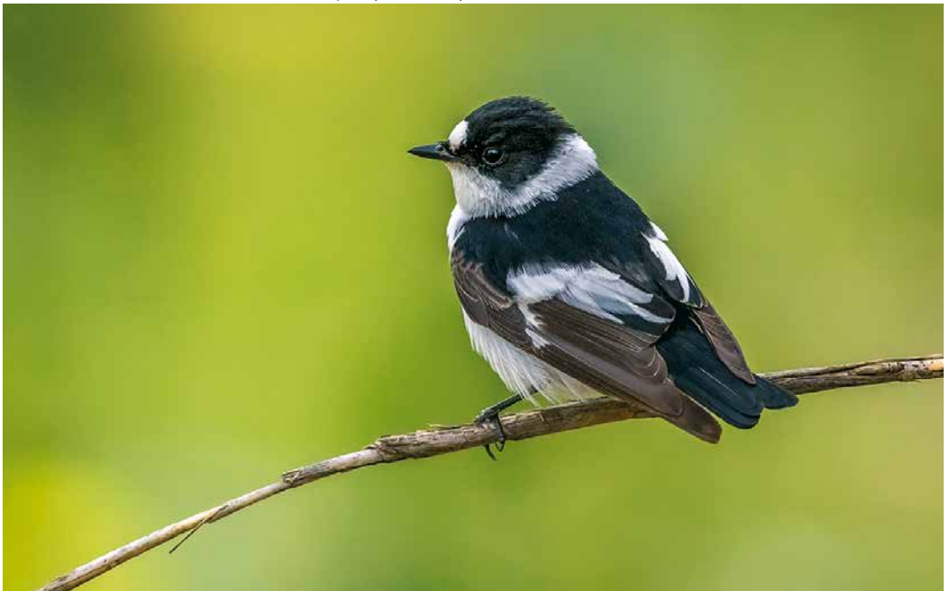
238 Collared Flycatcher / Withalsvliegenvanger Ficedula albicollis , second calendar-year male, Barcelona, Catalunya, Spain, 20 April 2019