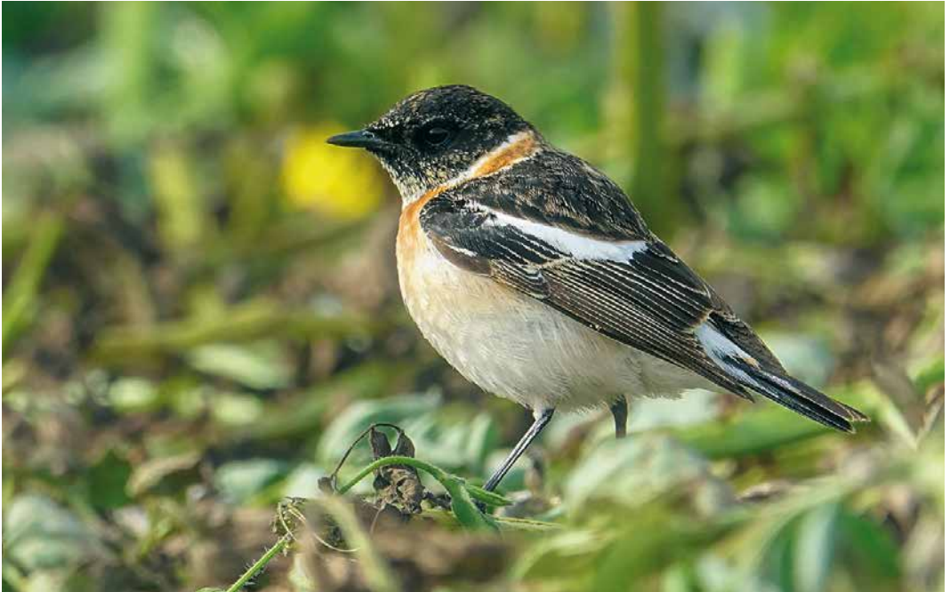
239 Caspian Stonechat / Kaspische Roodborstapuit Saxicola maurus hemprichii , male, Linosa, Italy, 19 April 2019 240 Egyptian Olivaceous Warbler / Egyptische Vale Spotvogel Iduna pallida pallida , Comino, Malta, 28 April 2019 241 Armenian Stonechat / Armeense Roodborstapuit Saxicola maurus variegatus , second calendar-year male, Reve, Rogaland, Norway, 24 April 2019