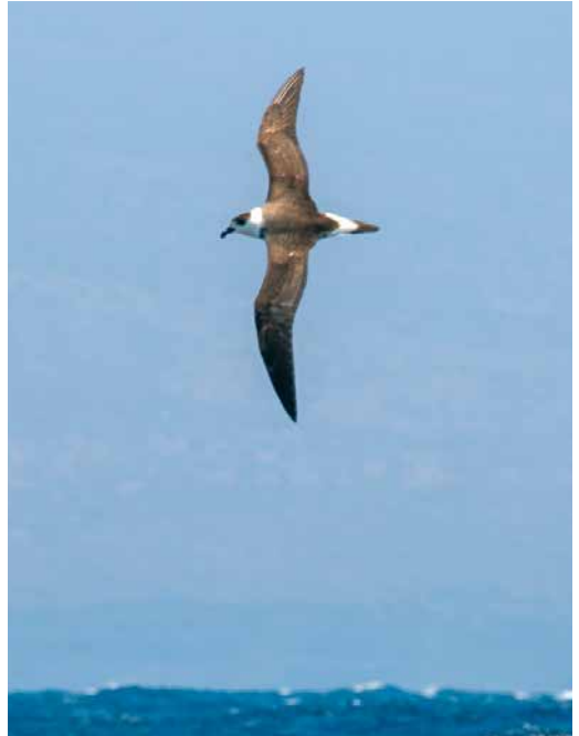
215 Wilson's Snipe / Amerikaanse Watersnip Gallinago delicata , How, Tierp, Uppland, Sweden, 21 April 2019 216 Black-capped Petrel / Zwartkapstormvogel Pterodroma hasitata , between Fogo and Ilhéus do Rombo, Cape Verde Islands, 27 April 2019 217 Tristan Albatross / Tristanalbatros Diomedea dabbenena , immature, off Judaberg, Finnøy, Rogaland, Norway, 2 May 2019 218 Trindade Petrel / Arminjons Stormvogel Pterodroma arminjoniana , pale morph, c 3.5 km east off Raso, Cape Verde Islands, 18 April 2019