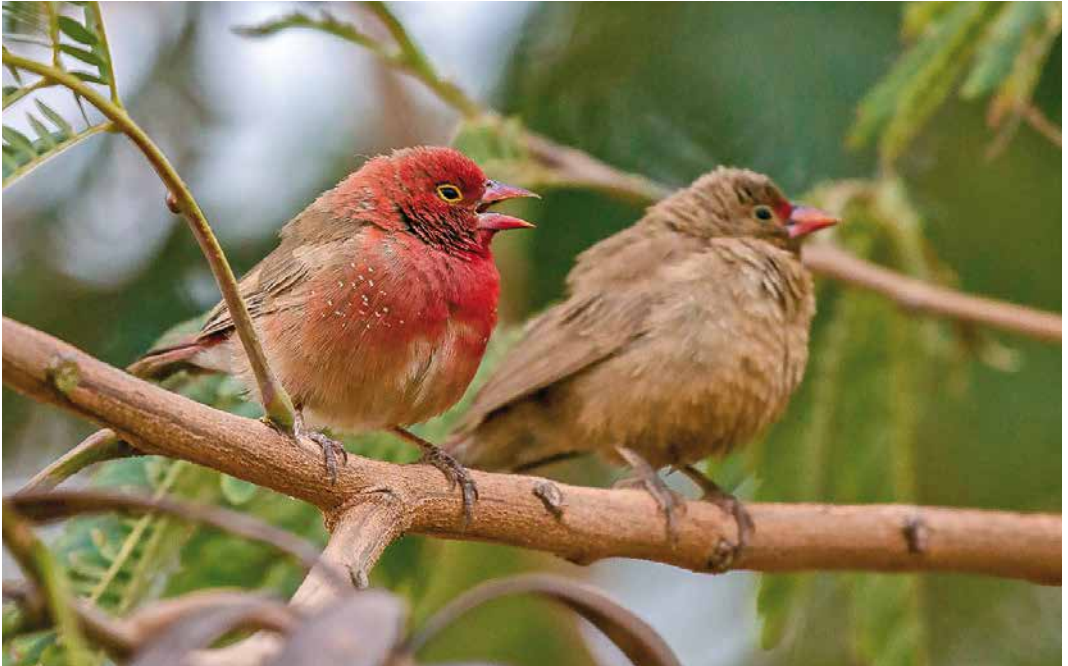
250 Red-billed Firefinches / Vuurvinkjes Lagonosticta senegala , male and female, garden at Hotel Bois Petrifie, Tamanrasset, Algeria, 24 March 2019 (Sam Viles)