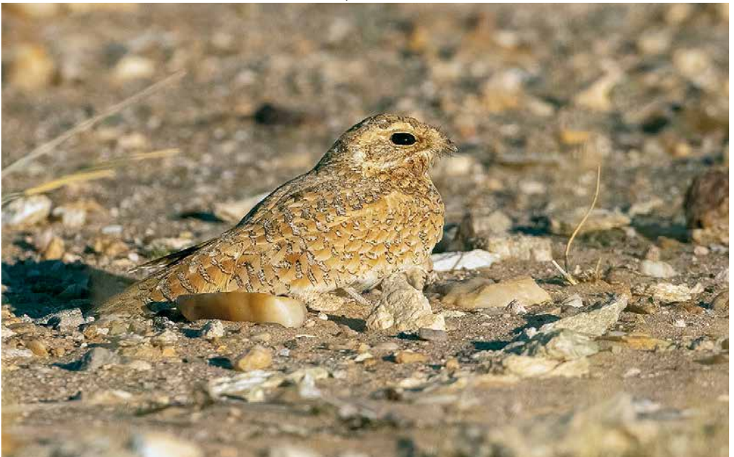
228 Golden Nightjar / Goudgele Nachtzwaluw Caprimulgus eximius , Oued Chiaf, c 55 km of Aousserd, Western Sahara, Morocco, 8 April 2019 (David Monticelli)