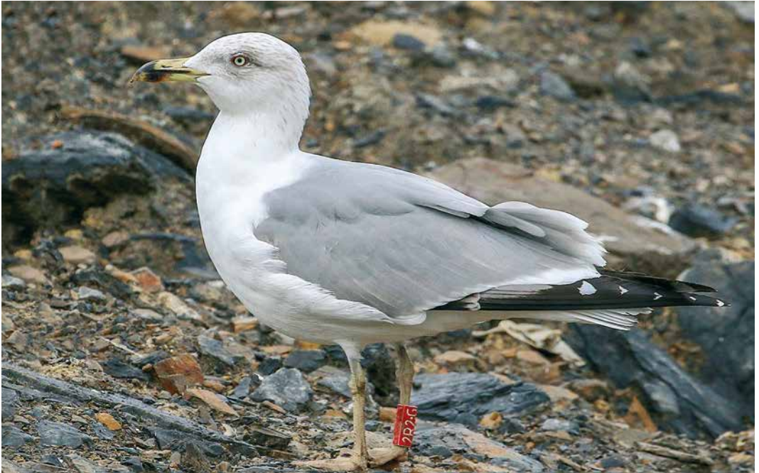
199 Yellow-legged Gull / Geelpootmeeuw Larus michahellis, Zaluaga, Pyrénées-Atlantiques, France, 2 January 2018. Bird 2R2G during its fourth year of life (ie, third-winter), ringed as nestling on 27 June 2015. 200 Yellow-legged Gull / Geelpootmeeuw Larus michahellis, Ondarroa, País Vasco, Spain, 20 November 2017. Second-winter with no grey feathers in mantle and wing-coverts. These kinds of bird would be assigned to type 2 plumage. Note, however, that whole plumage is new due to complete moult during summer of its second year of life.