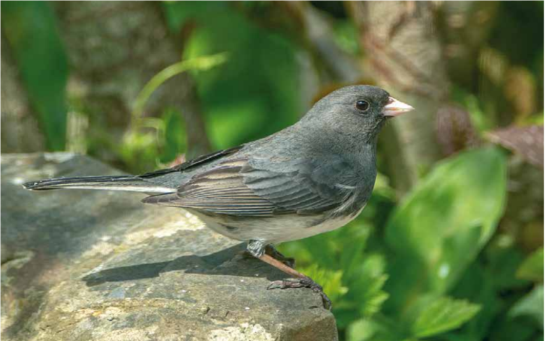
248 Dark-eyed Junco / Grijze Junco Junco hyemalis , first-summer male, Westward Ho!, Devon, England, 27 April 2019