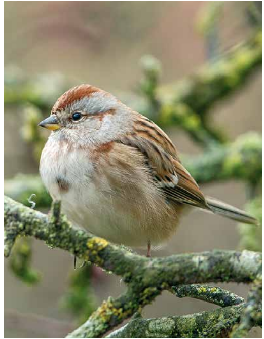
209-210 American Tree Sparrow / Toendragors Spizelloides arborea , Torreberga, Staffanstorp, Skåne, Sweden, 16 November 2016 (Ronny Malm)

However, just when I was about to leave, the bird started calling as it continued to forage in the trees. The call was a repeated, short, high pitched tjick . The sound superficially resembled that of Little Emberiza pusilla or Rustic Bunting E rustica and that was what really excited me. Standing on the path below the trees in which the bird was constantly moving around, it was impossible to get more decent photographs. So, I decided to leave the pathway and waited in the field for the bird to show again. Suddenly, it popped up and I was able to follow it for c one minute until it flew off to one of the ponds. Looking at the pictures that I obtained, it did not match any of the Emberiza species and as I still could not figure it out I sent a screenshot to my friend Oskar Nilsson. He immediately called to say that it had to be one of the American sparrows, most likely a new species for Sweden! Panic spread during our short conversation and, when I hung up the phone, adrenalin started pumping. I could barely speak when I called my girlfriend to tell her what just happened and her response was 'Just an American sparrow? Sounds more like you discovered a dead body!'. About half an hour later, ON, Petter Olsson and Karl-Erik Splittorff showed up and we were