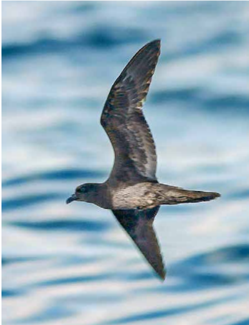
211 Bulwer's Petrel / Bulwers Stormvogel Bulweria bulwerii , just south of Madeira, North Atlantic Ocean, 31 August 2015 (Tor Olsen)