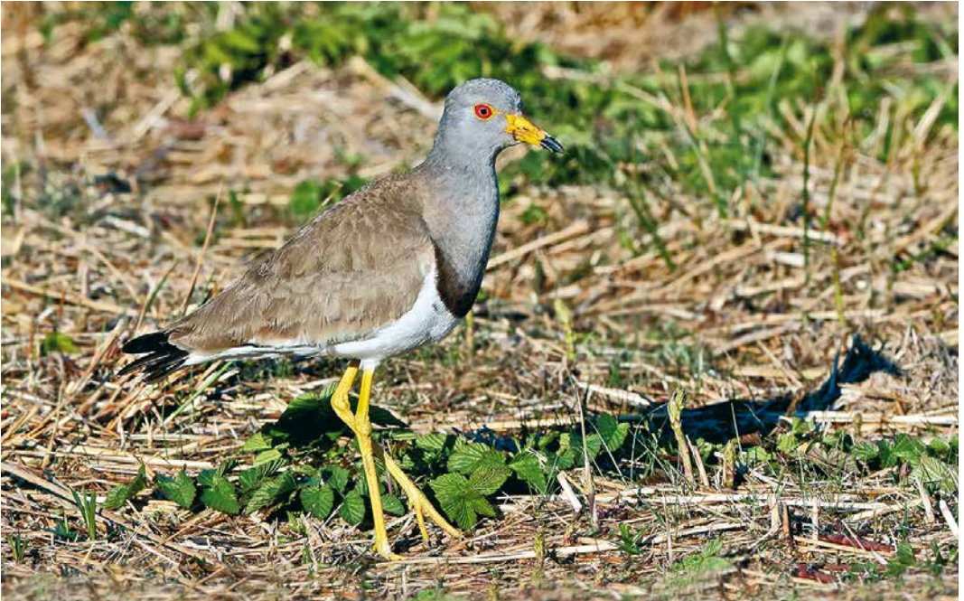
225 Grey-headed Lapwing / Grijskopkievit Vanellus cinereus , Gjervoldsøy, Arendal, Aust-Agder, Norway, 3 May 2019 (Knut Arne Monrad)