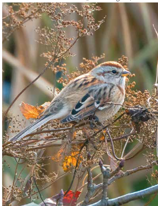
207 American Tree Sparrow / Toendragors Spizelloides arborea , Torreberga, Staffanstorp, Skåne, Sweden, 13 November 2016