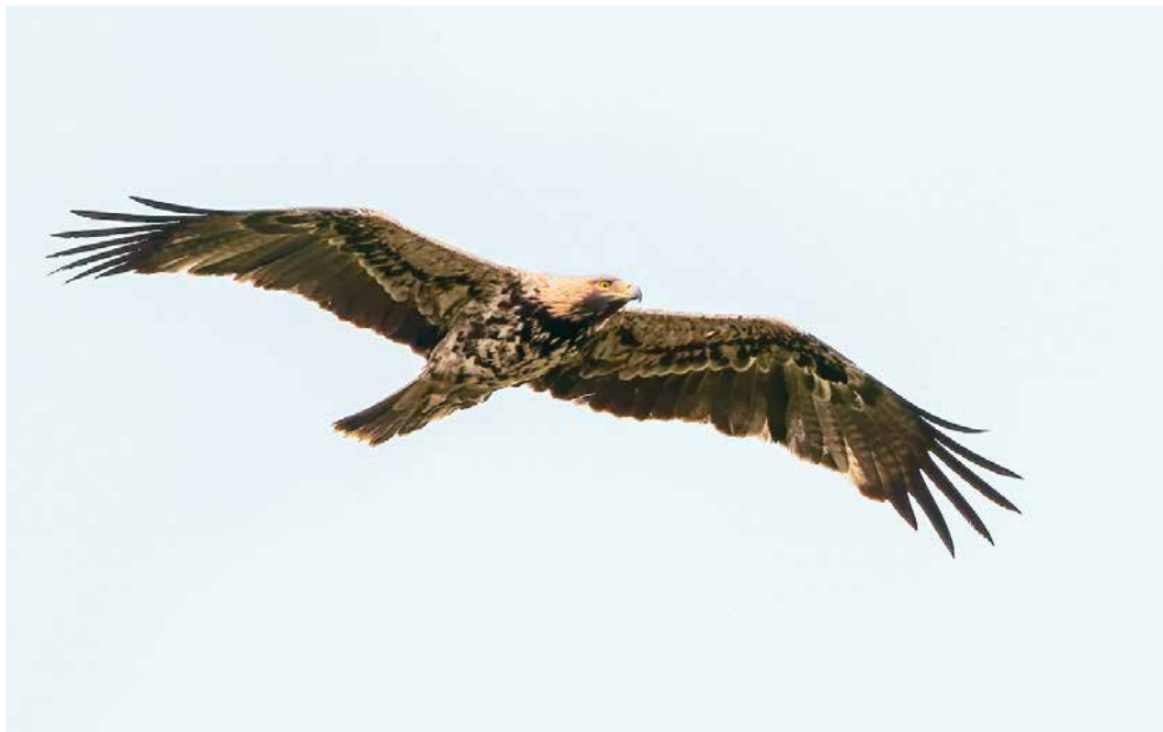
186-187 Keizerarend / Eastern Imperial Eagle Aquila heliaca , vierde-kalenderjaar mannetje (A506), Genemuiden, Overijssel, 4 oktober 2017 ( Michel Veldt )