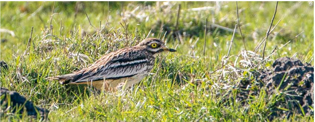
258 Dwerggors / Little Bunting Emberiza pusilla , Bilthoven, Utrecht, 2 maart 2019 ( Edial Dekker ) 259 Pallas' Boszanger / Pallas's Leaf Warbler Phylloscopus proregulus , Haarlem, Noord-Holland, 6 april 2019 ( Jan Aalders ) 260 Griel / Eurasian Stone-Curlew Burhinus oediconemus , Lentevreugd, Wassenaar, Zuid-Holland, 24 maart 2019 ( Marc Kolkman )

Voor al deze soorten waren dit de hoogste aantallen in maart-april van de laatste 10 jaar (Grauwe Kiekendief scoorde ook in 2011 51 exemplaren)! Vooral de telposten Noordkaap en Eemshaven in Groningen scoorden erg goed. Sperwer Accipiter nisus verdient een aparte vermelding, met maar liefst 6130 over telposten. De nieuwe voorjaarsrecords die daarbij op 17 (165), 18 (174) en 19 april (228) in de Eemshaven werden opgetekend, bleven telkens maar kort staan en culmineerden toen er op 24 april zelfs 260 passeerden. Op die dag vlogen er ook 235 (ongetwijfeld veelal dezelfde) langs de nabijgelegen Noordkaap, waardoor de hele top vijf van beste voorjaarsdagen nu uit 2019 stamt. Het oude record was ook van de Eemshaven: 159 in 2003. Het najaarsrecord ligt niet alleen een stuk hoger (387 op 3 oktober 2010 langs De Vulkaan), ook stammen alle topdagen van de westkust. Het aantal Grijze Wouwen Elanus caeruleus was opnieuw amper bij te houden. Er waren meldingen op 30 en 31 maart in het Haaksbergerveen, Overijssel; op 31 maart bij Slenaken, Limburg; op 5 april bij Lopik,