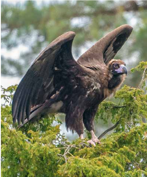
267 Monniksgier / Cinereous Vulture Aegypius monachus , tweede-kalenderjaar, Hellendoorn, Overijssel, 25 mei 2019