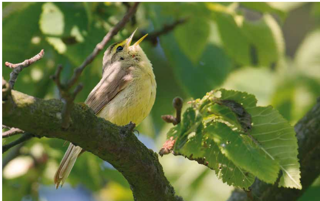
203-204 Sulphur-bellied Warbler / Steenboszanger Phylloscopus griseolus , Christiansø, Bornholm, Denmark, 3 June 2016 (Thomas Varto Nielsen)