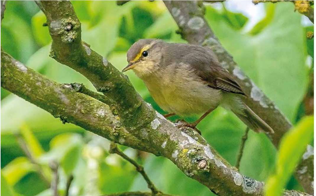
205-206 Sulphur-bellied Warbler / Steenboszanger Phylloscopus griseolus , Christiansø, Bornholm, Denmark, 31 May 2016 ( Christian Leth )