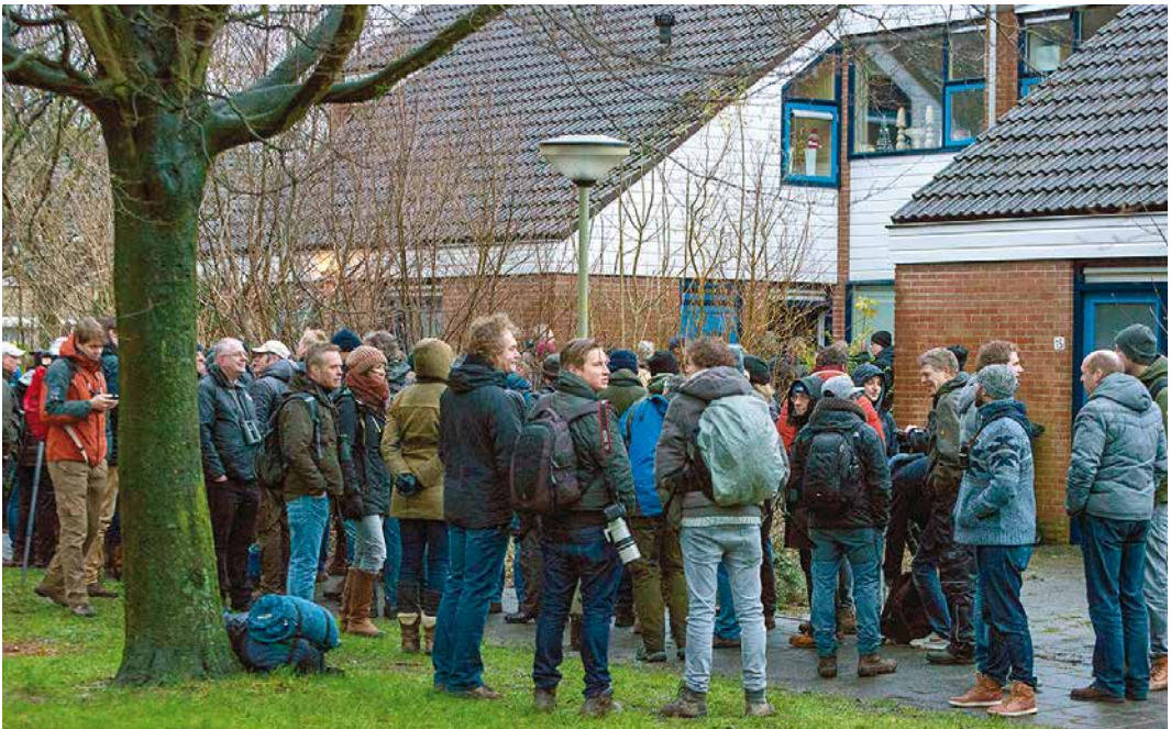
11 Vogelaars op hun beurt wachtend bij Roodkeelnachtegaal / birders waiting for their turn at Siberian Rubythroat Calliope calliope , Hoogwoud, Noord-Holland, 16 januari 2016 (Arnoud B van den Berg)

onbeduidende Facebookgroepen afstruint. Hanneke de Boer vroeg zich op 15 januari af welke vogel haar zoon al een week in zijn tuin in Hoogwoud, Noord-Holland, had... Nou, een Roodkeelnachtegaal! Met dank aan de oplettendheid van Wietze, het CSI-werk van Jaap Denee en doortastend optreden van Remco Hofland werd dit een van de opmerkelijkste twitches uit de geschiedenis van de DBA. Voor vijf euro per persoon – een idee van Remco om de aanvankelijk niet zo enthousiaste zoon over te halen – kon iedereen om beurten (kort) naar de vogel kijken, waarna de meesten weer achteraan de rij aansloten voor de volgende sessie. Buiten werden door andere buurtbewoners op meerdere plekken koffie en koeken verkocht en ook burens begonnen hun huis tegen betaling aan te bieden. Na verloop van tijd liet de vogel zich tot 12 april ook steeds vaker buiten de tuin zien. Op waarneming.nl werd de vogel liefst 2000 keer ingevoerd. Dat de vogel geboren en getogen was op de taiga, bleek uit de grote hoeveelheid imitaties van Noord-Aziatische soorten die hij aan het einde van zijn verblijf in zijn zang liet horen. Toen dat bekend werd, reisden zelfs vogelaars uit verre buitenland naar Hoogwoud af om de soort bij te schrijven.