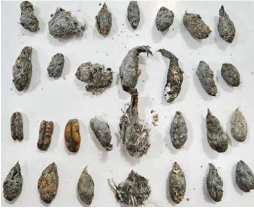
37 Pellets of Sooty Falcon / Woestijnvalk Falco concolor , Wadi el Gemal island, Egypt, 29 November 2017. Note date palm seeds.

Seven pellets found at 'nest 1' on Wadi El Gemal in October 2017 ranged in size between 20 mm and 27 mm in length and between 11 mm and 12.5 mm in width. The 24 pellets found at 'nest 2' on the same island in October 2017 ranged in size between 17 mm and 31 mm in length and between 8.5 mm and 12 mm in width. Pellets of nest 1 only contained passerine remains (bone and feather fragments), while those of nest 2 also some insect material (12.5%), besides passerine remains (87.5%). For an extensive list of prey items in the Arabian peninsula, see Jennings (2010).