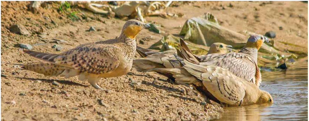
44 Chestnut-bellied Sandgrouse / Roodbuikzandhoen Pterocles exustus floweri , male, Gebel Elba, Halaib Triangle, Egypt, 25 June 2013 ( Ali Dora ) 45 Chestnut-bellied Sandgrouse / Roodbuikzandhoenders Pterocles exustus floweri , males, Gebel Elba, Halaib Triangle, Egypt, 22 August 2015 ( Ali Dora ) 46 Chestnut-bellied Sandgrouse / Roodbuikzandhoenders Pterocles exustus floweri , males, with Crowned Sandgrouse / Kroonzandhoenders P. coronatus , males, Gebel Elba, Halaib Triangle, Egypt, 8 June 2016 ( Ali Dora )

Cinnyris habessinicus (Goodman & Meininger 1989, Meininger & Goodman 1996, Baha El Din 2002, Moldovan 2012). It is also a hotspot for vagrants (mainly Afrotropical species), and many have been recorded here, eg, Pied Crow Corvus albus , Black Scrub Robin Cercotrichas podobe and Red-tailed Wheatear Oenanthe chrysopygia (Baha El Din & Baha El Din 2001, Jiguet et al 2014, 2018; see below). If accepted, a Broad-billed Roller Eurystomus glaucurus found dead at Adal Deeb on 30 October 2010 will be the first record of this species for Egypt and the third for the WP (Haas 2017). Very few foreign birdwatchers have been able to visit Gebel Elba because access to this area is still restricted for foreign visitors (Meininger & Goodman 1996, Baha El Din 2002, Moldovan 2012). As