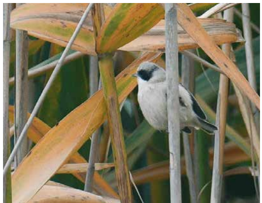
70 Dusky Thrush / Bruine Lijster Turdus eunomus , first-winter male, Whalsay, Shetland, Scotland, 5 December 2018 ( John L Irvine ) 71 Naumann's Thrush / Naumanns Lijster Turdus naumanni , first-winter female, Patamalm, Mönsterås, Småland, Sweden, 13 November 2018 ( Oscar Nordahl ) cf Dutch Birding 40: 419, 2018 72 Siberian Buff-bellied Pipit / Siberische Waterpieper Anthus rubescens japonicus , Clos de Gouine, Arles, France, 22 December 2018 ( Frédéric Veyrunes ) 73 East Siberian Wagtail / Oost-Siberische Kwikstaart Motacilla ocularis , first-winter, Sandhamn, Gotland, Sweden, 24 November 2018 ( Mats Engquist ) 74 Pied Crow / Schilddraaf Corvus albus , adult, between Ad Duqm and Haima, Al Wusta, Oman, 21 November 2018 ( Kees de Jager ) 75 White-crowned Penduline Tit / Witkruinbuidelmees Remiz coronatus , male, Alagol lake, Golestan, Iran, 2 December 2018 ( Ehsan Talebi )