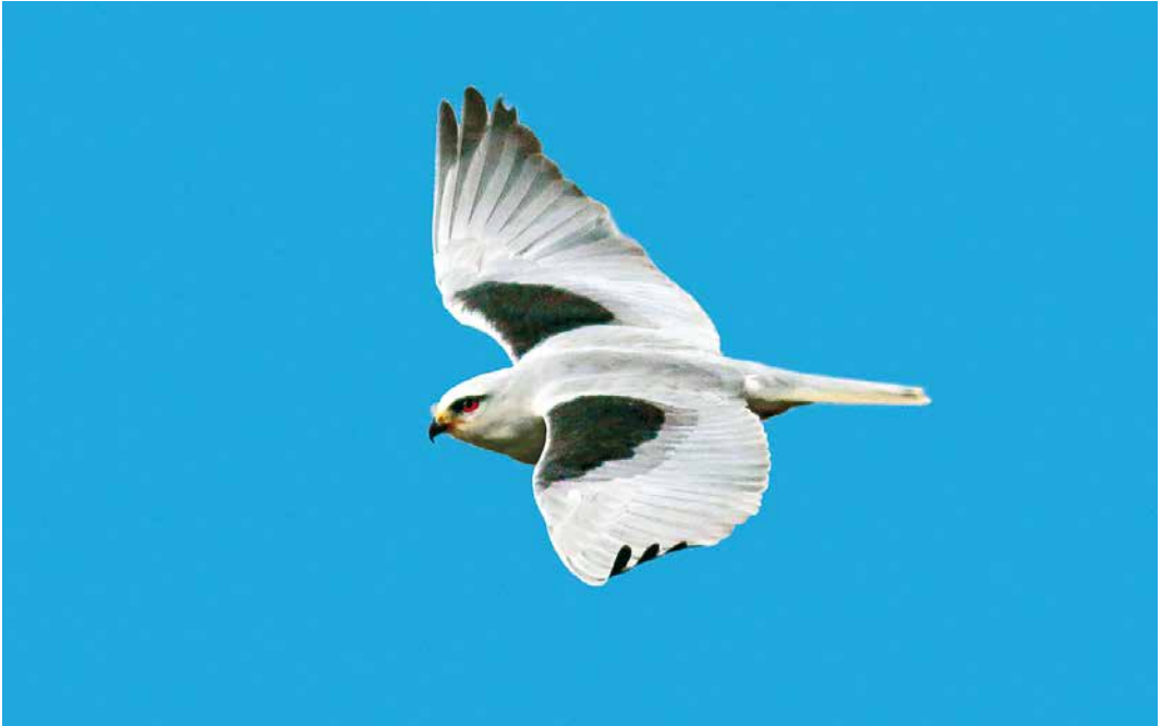
90 Grijsze Wouw / Black-winged Kite Elanus caeruleus , eerstejaars, Polderweg, Wieringen, Noord-Holland, 11 november 2018 (Fred Visscher)

onvolwassen Grauwe Franjepoot P lobatus van 17 tot 22 november in Waal en Burg op Texel. Deze periode was niet goed voor zeetrek. Dat bleek ook uit het lage aantal van acht Rosse Franjepoten langs telposten, een soort die normaliter in november-december piekt. In de afgelopen 10 jaar was alleen 2009 slechter (met twee). Topjaar was 2011 met 81 in deze twee maanden. Vermeldenswaard is een exemplaar op 4 en 5 december nabij Aerdt, Gelderland, vlakbij de grens met Duitsland. De eerstejaars Steppevorkstaartplevier Glareola nordmanni die zich van 21 oktober tot 7 november ophield bij Batenburg, Gelderland, werd op 18 november teruggevonden bij Lith, Noord-Brabant, waar hij tot 30 november bleef.