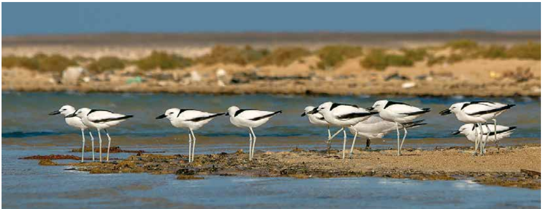
51 Pied Crow / Schildraaf Corvus albus , Red Sea coast, Gebel Elba, Halaib Triangle, Egypt, 2 April 2015 ( Ali Dora ) 52 Black Scrub Robin / Zwarte Waaiersaart Cercotrichas podobe , Wadi Shallal, Gebel Elba, Halaib Triangle, Egypt, 8 March 2016 ( Ali Dora ) 53 Crested Honey Buzzard / Aziatische Wespensdief Pernis ptilorhynchus , adult male, Wadi Shallal, Gebel Elba, Halaib Triangle, Egypt, 10 May 2016 ( Ali Dora ) 54 Lappet-faced Vulture / Oorgier Torgos tracheliotos , Gebel Elba, Halaib Triangle, Egypt, 29 April 2017 ( Ali Dora ) 55 Crab-plovers / Krabplevieren Dromas ardeola , Red Sea coast, Gebel Elba, Halaib Triangle, Egypt, 11 April 2018 ( Ali Dora )