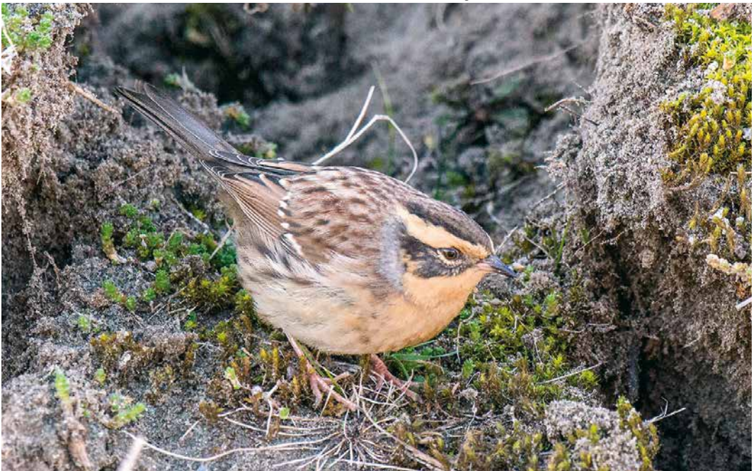
15 Bergheggenmus / Siberian Accentor Prunella montanella , eerstejaars, Maasvlakte, Zuid-Holland, 21 oktober 2016