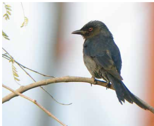
22-23 Ashy Drongo / Griize Drongo Dicrurus leucophaeus , Minab, Hormozgan, Iran, 19 February 2014 ( Leander Khil ). First for Iran. 24 Ashy Drongo / Griize Drongo Dicrurus leucophaeus , Dargas, Raask, Sistan and Baluchestan, Iran, 26 January 2017 ( Ehsan Talebi ). Third for Iran. 25 Ashy Drongo / Griize Drongo Dicrurus leucophaeus , Abu Dhabi, United Arab Emirates, 17 December 2006 ( Nick Moran ). First for UAE and 'greater' WP.

eastern vagrants, eg, two Olive-backed Pipits Anthus hodgsoni (the third record for Iran). On 19 January, they were birding in Jahad park (27.26071°N, 56.41677°E), 16 km east of Bandar Abbas, when Mattias spotted a drongo. Magnus and Per Øystein were involved in the discovery of the first Ashy Drongo for Oman (Klunderud et al 2016; plate 28) so identification was straightforward (plate 27). The bird was still around in the same trees when Magnus and Mattias again visited Jahad Park on 26 January. The record was accepted as the second for Iran (Khaleghizadeh et al 2017).