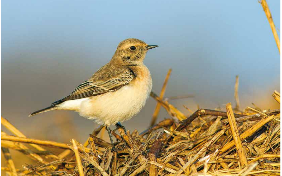
93 Bonte Tapuit / Pied Wheatear Oenanthe pleschanka , eerste-winter mannetje, Schiermonnikoog, Friesland, 4 november 2018

Braamsluiers S althaea blythi werden gezien op 17 en 18 november bij Netterden, Gelderland, en op ten minste 1 en 26 december in Spijkenisse, Zuid-Holland.