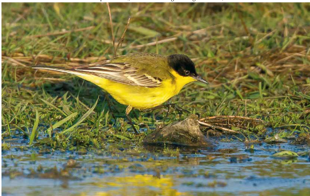
13 Balkankwikstaart / Black-headed Wagtail Motacilla feldegg , mannetje, De Nederlanden, Texel, Noord-Holland, 30 april 2016