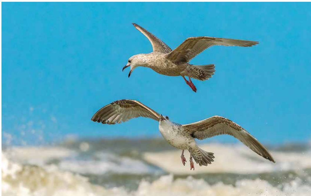
9 Thayers Meeuw / Thayer's Gull Larus thayeri , juveniel, met Zilvermeeuw / European Herring Gull L. argentatus , Egmond aan Zee, Noord-Holland, 12 april 2015