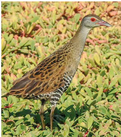
[Dutch Birding 41: 51-62, 2019]

56 African Crane / Afrikaanse Kwartelkoning Crex egregia , Santa Maria, Sal, Cape Verde Islands, 6 January 2019