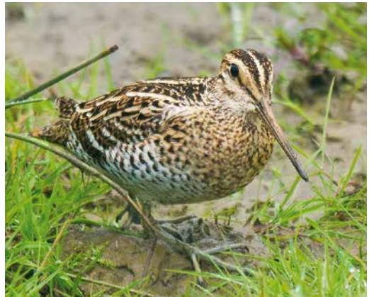
5 Amerikaanse Oeverloper / Spotted Sandpiper Actitis macularius , Medemblik, Noord-Holland, 17 april 2015 (Co van der Wardt) 6 Grijsje Junco / Dark-eyed Junco Junco hyemalis , tweede-kalenderjaar vrouwtje, Beijum, Groningen, Groningen, 19 februari 2015 (Arnoud B van den Berg) 7 Woestijngasmus / Asian Desert Warbler Sylvia nana , Terschelling, Friesland, 14 november 2015 (Jaap Denee) 8 Poelsnip / Great Snipe Gallinago media , Broekhuizen, Limburg, 28 april 2015 (Arnoud B van den Berg)

uit te gaan. Wel trok na acht jaar zonder Siberische Strandloper C acuminata de door Pierre van der Wielen ontdekte vogel in de Putten van Camperduin, Noord-Holland, tussen 6 en 19 september veel aandacht (achtste geval van in totaal negen vogels) en was een Ruigpootuil Aegolius funereus die zich tegen een Amsterdams schoolraam doodvloog op 12 oktober opmerkelijk als 's lands meest westelijke ooit. Curieus was dat een Vorkstaartplevier G pratincola op 18-23 oktober juist Terneuzen, Zeeland, uitkoos omdat de vorige twee gevallen in het late najaar uit precies dezelfde gemeente stamden. Een Mongoolse Pieper A godlewskii , de eerste twitchbare sinds 2007, liet zich op 31 oktober en 1 november bij tijd en wijle goed zien bij Ridderkerk, Zuid-Holland. De vogel was op de