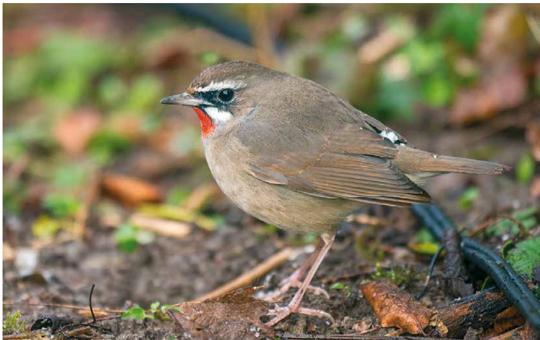
12 Roodkeelnachtegaal / Siberian Rubythroat Calliope calliope , eerste-winter mannetje, Hoogwoud, Noord-Holland, 7 maart 2016