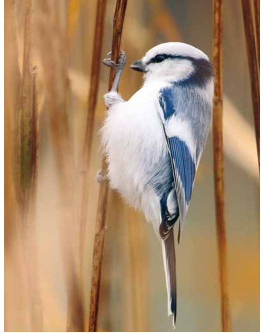
82 Dwarf Bittern / Afrikaanse Woudaap Ixobrychus sturmii , Barranco del Rio Cabras, Fuerteventura, Canary Islands, 3 January 2019 83 Azure Tit / Azuurmees Cyanistes cyanus , Fehér lake, Szeged, Hungary, 19 November 2018 84 Cretzschmar's Bunting / Bruinkeelortolaan Emberiza caesia , first-winter male, Skutskär, Uppsala, Sweden, 6 January 2019