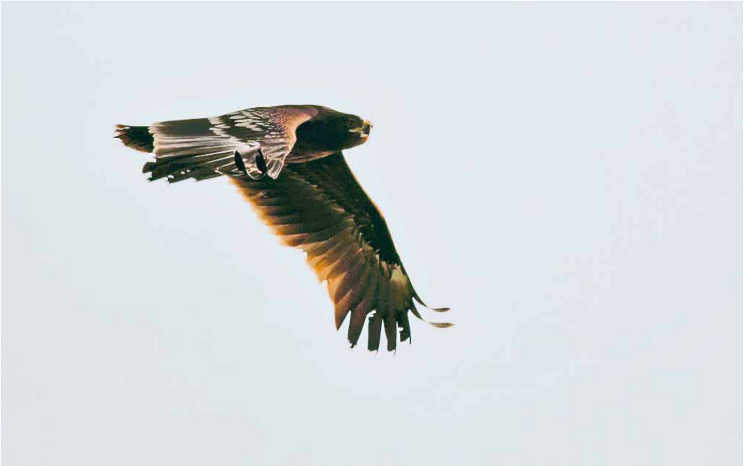
21 Bastaardarend / Greater Spotted Eagle Clanga clanga , eerste-winter, Polsbroekerdam, Utrecht, 18 februari 2018 (Kees de Leeuw)

langsvliegende Kuhls Pijlstormvogel C borealis langs drie trektelposten in Zuid-Holland had men natuurlijk direct in de auto moeten springen richting Westkapelle, waar de vogel inderdaad zeer fraai en op zijn dooie akkertje langs kwam vliegen; hij kon daarna nog tot ver langs de Vlaamse kust worden opgepikt. Voor de 'next generation' was de negende Roodoogvireo Vireo olivaceus zeer welkom want het was slechts de derde twitchbare: te zien op Texel op 27-30 oktober. Na een Geelkop-troepiaal Xanthocephalus xanthocephalus uit een ver en grijs verleden was dit pas de tweede Amerikaanse zangvogel voor het eiland. Het was extra leuk dat hij werd ontdekt door Arend Wassink die 40 jaar geleden aan de wieg stond van de DBA. Een juveniele Bairds Strandloper C bairdii te Deventer, Overijssel, op 2-3 november was de eerste waarneming in deze maand voor deze soort en zelfs een van de weinige zo laat in het jaar voor het noordelijke halfrond. De beste soort van het jaar kwam ons pas op 20 november ter ore, toen bekend werd gemaakt dat op 5 november een sterk vermagerde Grijswangdwerglijster Catharus minimus in de duinen van Monster, Zuid-Holland, was gevonden en naar een nabijgelegen vogelasiel gebracht. Daar kon hij worden opgelapt, waarna hij in de ochtend van 20 november werd losgela-