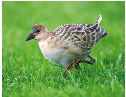
62 Great Blue Heron / Amerikaanse Blauwe Reiger Ardea herodias , adult, Tunguvötn, Landbrot, Iceland, 6 January 2019 (Yann Kolbeinsson) 63 Squacco Heron / Ralreiger Ardeola ralloides , adult winter, Tromsø harbour, Troms, Norway, 24 November 2018 (Espen Bergersen) 64 Mourning Dove / Treurduif Zenaida macroura , Doonloughan, Galway, Ireland, 16 November 2018 (Gerard Murray) cf Dutch Birding 40: 408, 2018 65 Allen's Gallinule / Afrikaans Purperhoen Porphyrio alleni , first-year, Caleta de Fuste, Fuerteventura, Canary Islands, 16 December 2018 (Daniel Mauras)

into care. In Spain, a first-winter was found at Río Chillar, Nerja, Málaga, on 20 January. In the Azores, the American Coot Fulica americana stayed at Lagoa das Furnas, São Miguel, from at least 21 November to 16 December.