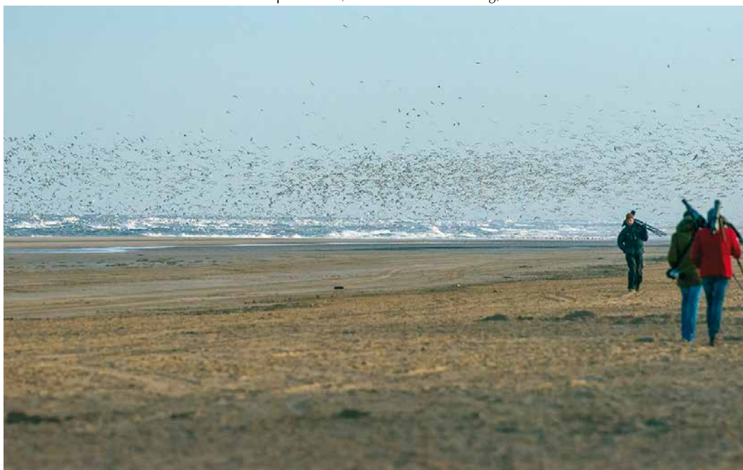
10 Vogelaars bij Thayers Meeuw / birders at Thayer's Gull Larus thayeri , Egmond aan Zee, Noord-Holland, 12 april 2015