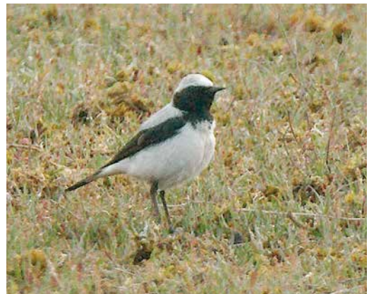
17 Seebohms Tapuit / Seebohm's Wheatear Oenanthe seebohmi , eerste-zomer mannetje, Solleveld, Den Haag, Zuid-Holland, 22 mei 2017

26 april was ook 2017 geen uitzondering. Twitchers hadden veel moeite met deze vogel omdat hij op 26 april vertrok net voor de aankomst van de meute. Wonder boven wonder werd hij echter herontdekt halverwege het eiland, c 7 km van de oorspronkelijke locatie, waar hij tot het einde van de dag bleef. De derde Grijze Junco op 7-8 mei in