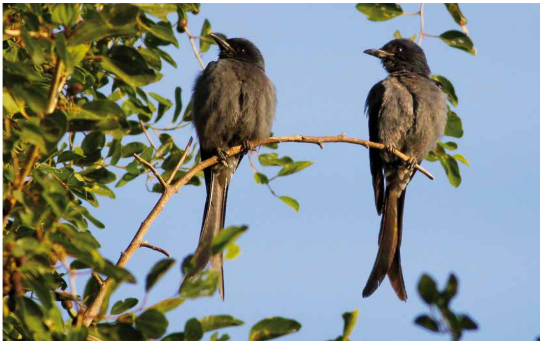
26 Ashy Drongos / Grijze Drongo's Dicrurus leucophaeus , Jahra farms, Kuwait, 10 December 2010 ( Mike Pope ). One of two records of two individuals together in the WP. 27 Ashy Drongo / Grijze Drongo Dicrurus leucophaeus , Jihad park, Bandar Abbas, Hormozgan, Iran, 19 January 2016 ( Magnus Ullman ). Second for Iran. 28 Ashy Drongo / Grijze Drongo Dicrurus leucophaeus , Qatbit, Oman, 24 November 2014 ( Magnus Ullman ). First for Oman.