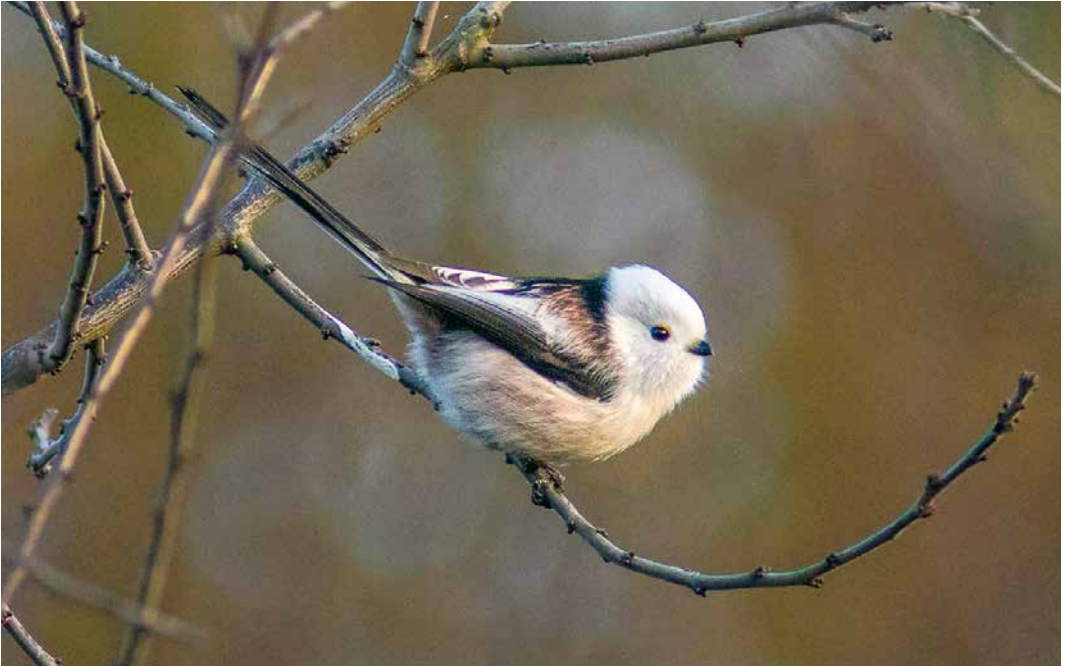
91 Witkopstaartmees / White-headed Long-tailed Tit Aegithalos caudatus caudatus , Bunnik, Utrecht, 18 november 2018 ( Julian Bosch )