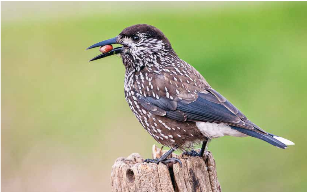
92 Dunsnavelnotenkraaker / Siberian Spotted Nutcracker Nucifraga caryocatactes macrorhynchos , eerste-winter, Wageningen, Gelderland, 27 november 2018 ( Co van der Wardt )