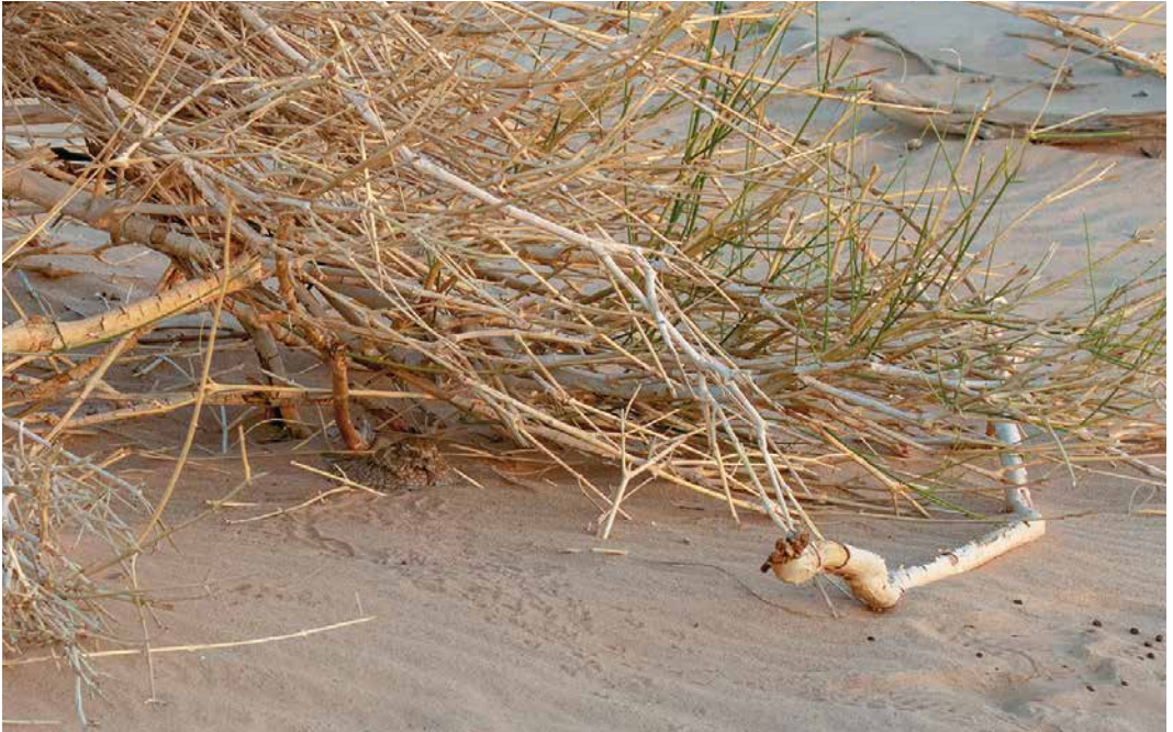
119 Golden Nightjar / Goudgele Nachtzwaluw Caprimulgus eximius , female incubating, near Ouadâne, Adrar, Mauritania, 19 April 2018 (Peter Stronach)