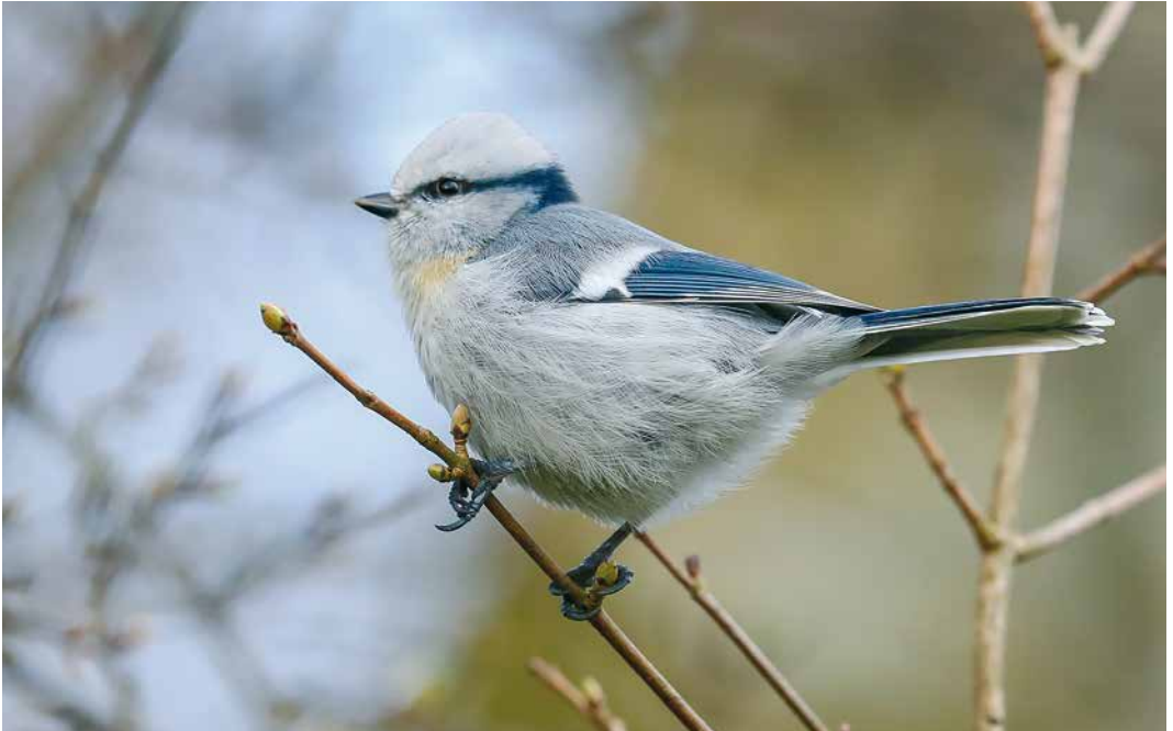
168 Vermoedelijke Azuurmees / presumed Azure Tit Cyanistes cyanus , Bergen, Noord-Holland, 15 maart 2019