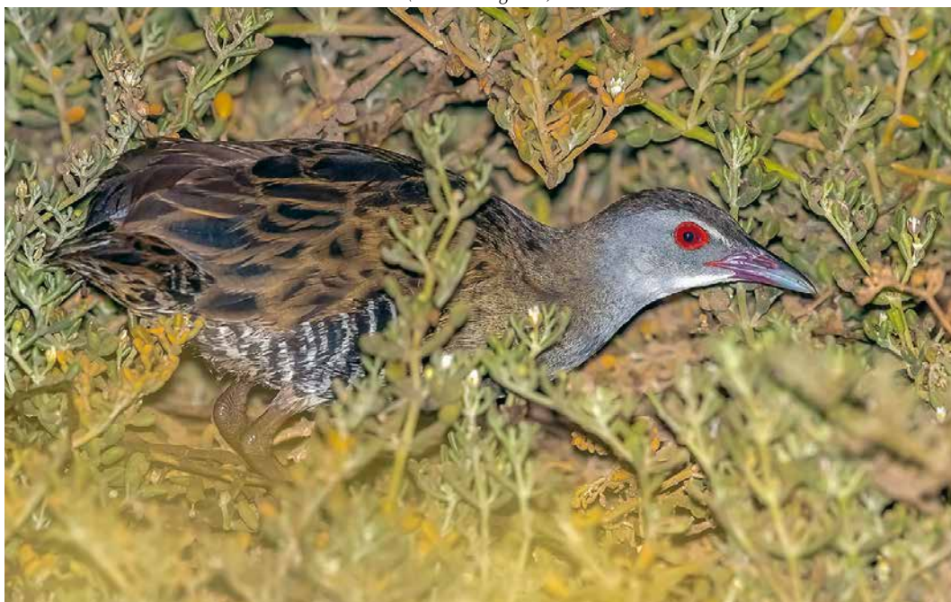
132 African Crane / Afrikaanse Kwartelkoning Crex egregia , Santa Maria, Sal, Cape Verde Islands, 9 March 2019