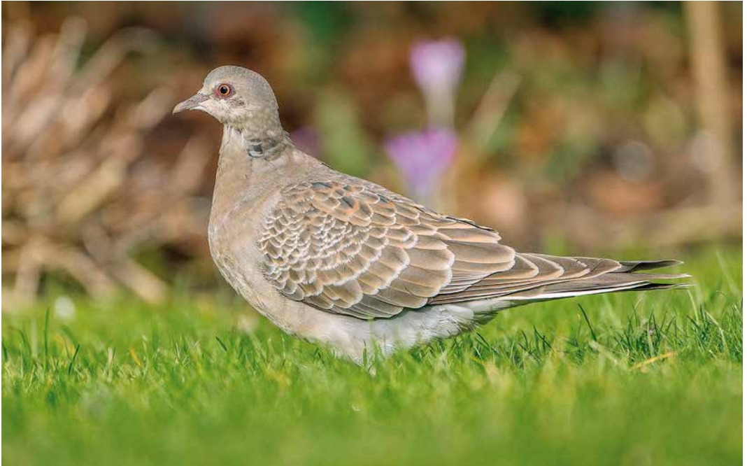
166 Meenatortel / Rufous Turtle Dove Streptopelia orientalis meena , eerste-winter, Limmen, Noord-Holland, 12 februari 2019