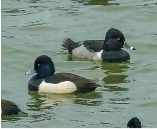
172 Ringsnaveleend / Ring-necked Duck Aythya collaris , mannetje, met Kuifeend / Tufted Duck A fuligula , mannetje, Europoort, Zuid-Holland, 17 januari 2019