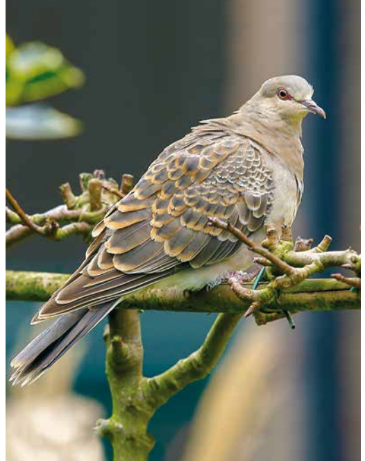
153 Upland Buzzard / Mongoolse Buizerd Buteo hemilasius , Lar, Fars, Iran, 16 November 2018 ( Adel Shamsizadegan ) 154 Rufous Turtle Dove / Meenatortel Streptopelia orientalis meena , first-winter, Limmen, Noord-Holland, Netherlands, 30 January 2019 ( Eric Menkveld ) 155 Yellow-browed Warbler / Bladkoning Phylloscopus inornatus , first-winter, Berenice, Egypt, 5 January 2019 ( Vincent Legrand ) cf Dutch Birding 41: 59, 2019