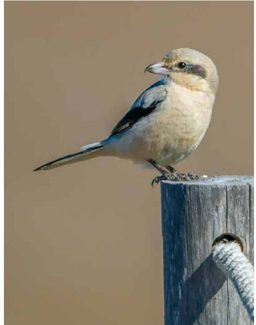
156 Daurian Shrike / Daurische Klauwier Lanius isabellinus , Tamri estuary, Morocco, 2 January 2019 157 Steppe Grey Shrike / Steppeklapekster Lanius lahtora pallidirostris , first-winter, Tancada marshes, Tarragona, Spain, 12 February 2019 158 Bar-tailed Lark / Rosse Woestijnleeuwerik Ammomanes cinctura , Puerto del Carmen, Lanzarote, Canary Islands, 18 February 2019