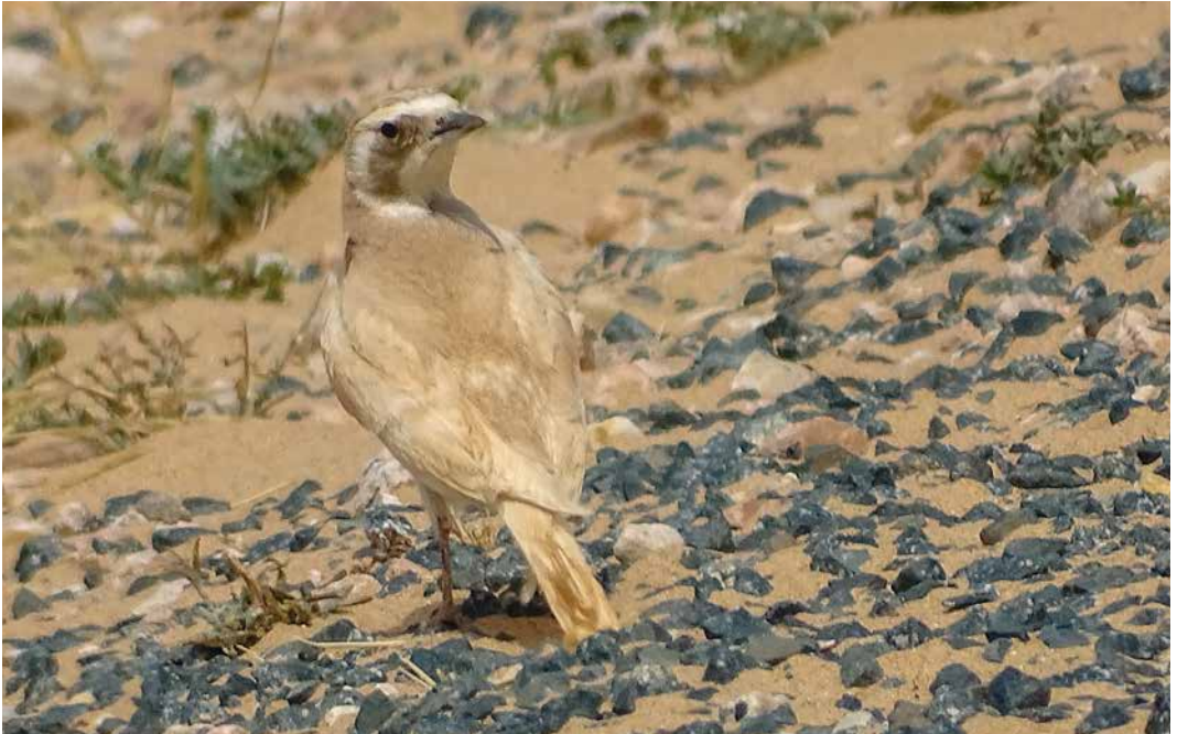
129-130 Temminck's Lark / Temmincks Strandleeuwerik Eremophila bilopha , c 100 km west of Aousserd, Western Sahara, Morocco, 30 March 2018. Bird with mutation 'Brown'.