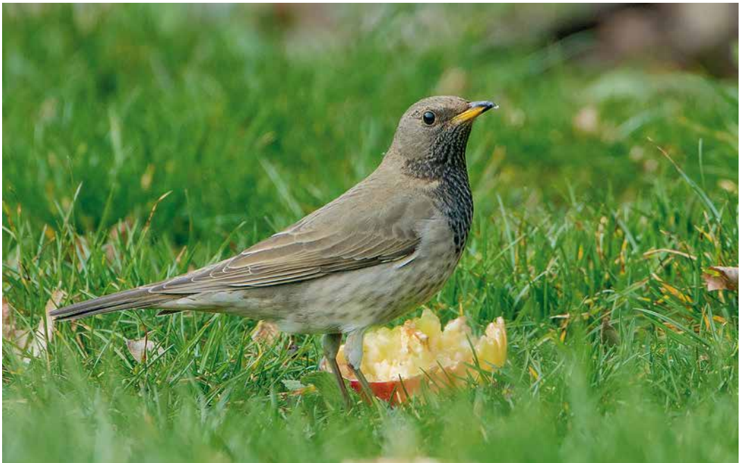
159 Black-throated Thrush / Zwartkeellijster Turdus atrogularis , male, Coevorden, Drenthe, Netherlands, 20 February 2019

HUNTING In Br Birds 112: 153-166, 2019, legal shooting of migratory birds has been summarized for EU countries plus Norway and Switzerland in 2010-15. The number of registered hunters for all countries combined