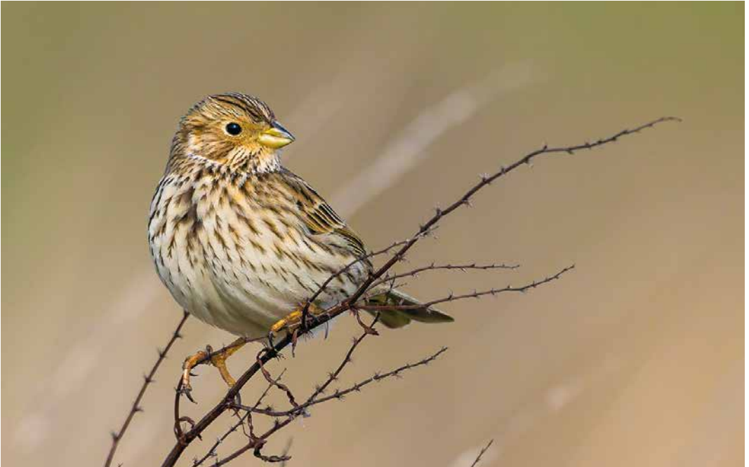
170 Grauwe Gors / Corn Bunting Emberiza calandra , Bruinisse, Zeeland, 2 maart 2019