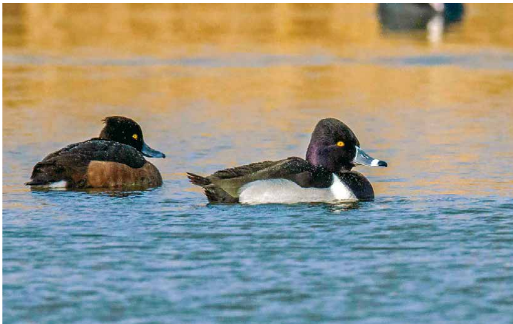
164 Ringsnaveleend / Ring-necked Duck Aythya collaris , adult mannetje, met Kuifeend / Tufted Duck Aythya fuligula , vrouwtje, Appingedam, Groningen, 3 januari 2019