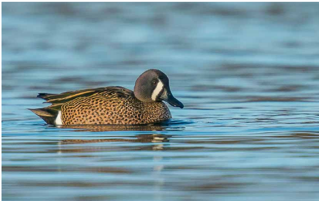
149 Blue-winged Teal / Blauwvleugeltaling Spatula discors , male, Boisdorfer See, Kerpen, Nordrhein-Westfalen, Germany, 1 February 2019 (Norbert Uhlhaas)