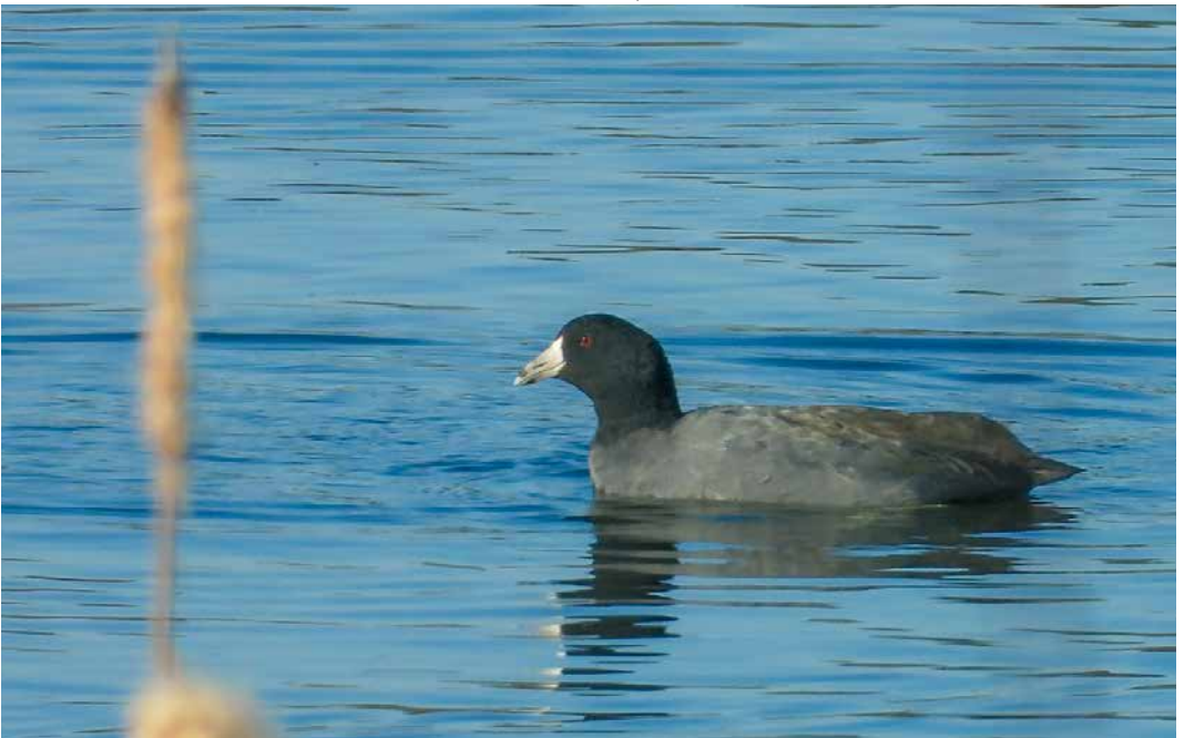
134 American Coot / Amerikaanse Meerkoet Fulica americana , Lagoa de Cospeito, Lugo, Spain, 26 February 2019 (David Calleja)