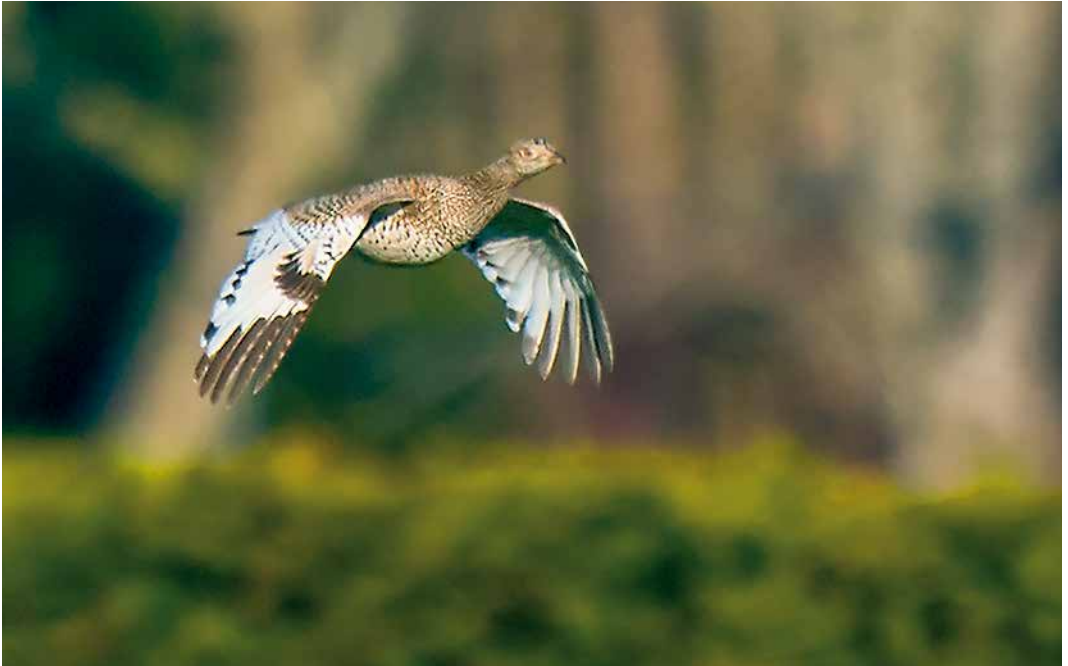
162 Kleine Trap / Little Bustard Tetrax tetrax , eerste-winter, De Zilk, Zuid-Holland, 15 februari 2019 (Arnoud B van den Berg)