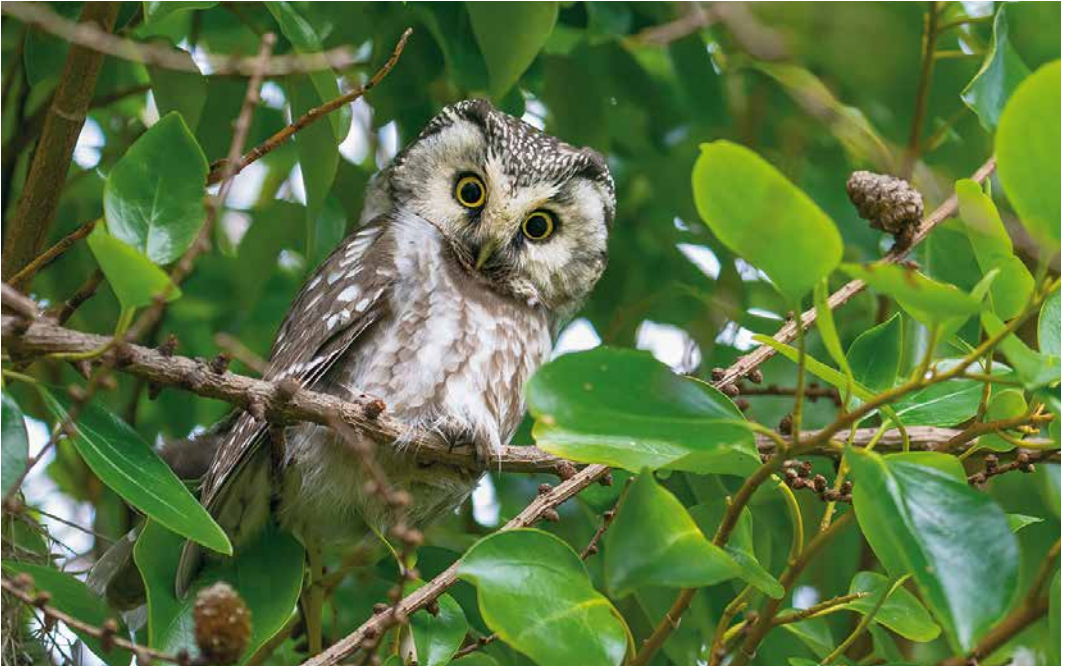
133 Tengmalm's Owl / Ruigpootuil Aegolius funereus , Tresta, Mainland, Shetland, Scotland, 2 March 2019