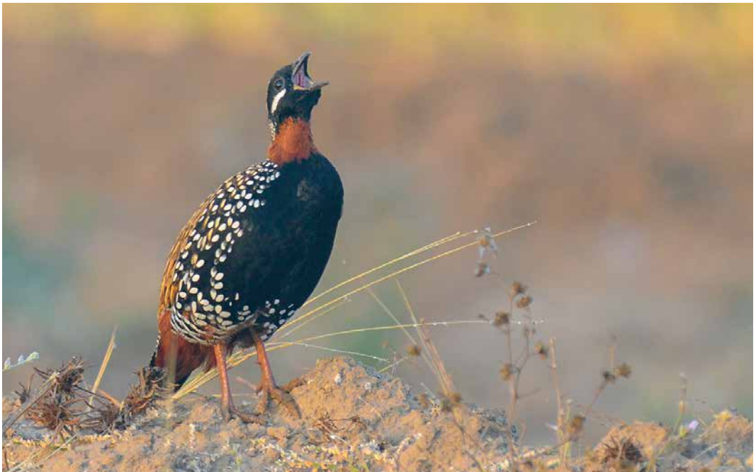
108 Black Francolin / Zwarte Frankolijn Francolinus francolinus , Gujarat, India, 21 February 2012 (Laurens B Steijn)

Morphological differences between the six subspecies of Black Francolin appear to be largely clinal (McGowan & Kirwan 2018) and thus do not support a division in two distinct groups. However, a thorough analysis of mitochondrial DNA data (Forcina et al 2012) revealed that the western group ( francolinus and arabisticus ) is genetically very uniform and quite distinct from all eastern subspecies, most of which also differ from each