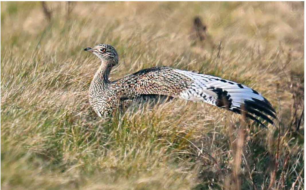
163 Kleine Trap / Little Bustard Tetrax tetrax , eerste-winter, De Zilk, Zuid-Holland, 17 februari 2019 (René van Rossum)