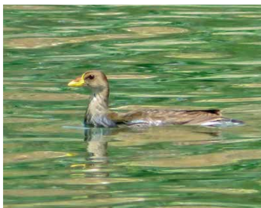
139 Little Bustard / Kleine Trap Tetrax tetrax , first-winter, De Zilk, Zuid-Holland, Netherlands, 15 February 2019 140 Lesser Moorhen / Afrikaans Waterhoen Paragallinula angulata , immature, Santa Maria, Sal, Cape Verde Islands, 9 March 2019 141 Bufflehead / Buffelkoepeend Bucephala albeola , female, Rabil lagoon, Boa Vista, Cape Verde Islands, 24 January 2019 142 Lesser Moorhen / Afrikaans Waterhoen Paragallinula angulata , first-winter, Barragem de Figueira Gorda, Santiago, Cape Verde Islands, 24 February 2019

mental North America and the Atlantic Ocean was seen out of Hatteras, North Carolina, USA, on 29 May 2018. One photographed from a boat off Durban on 11 November 2018 was the first for South Africa. The first for the WP was photographed c 5 nautical miles south off Mirbat, Dhofar, Oman, on 23 February. A Jouanin's Petrel Bulweria fallax at Jahra pools reserve on 12 May 2018 has been accepted as the first for Kuwait; in the 'greater' WP, the species is a regular visitor to the coasts of Yemen, Oman and the United Arab Emirates (UAE). Roman et al analysed the cause of death of 1733 seabirds (mainly tubenoses) from 51 species in Australia and New Zealand. They found that one in three had ingested debris and that balloons were the highest-risk plastics, being 32 times more likely to kill seabirds than hard plastics (Sci Rep 9: 3202, 2019).