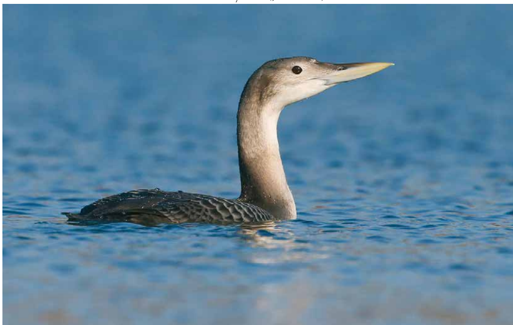
150 Yellow-billed Loon / Geelsnavelduiker Gavia adamsii , juvenile, Hódmezővásárhely, Csongrád, Hungary, 7 February 2019 (János Oláh)