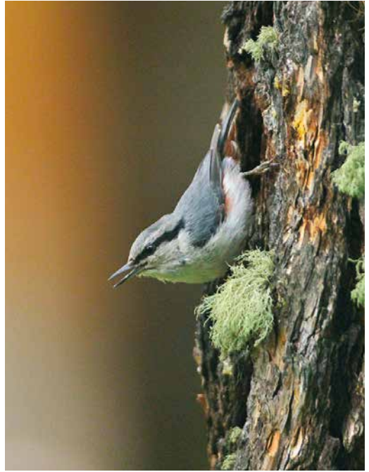
115 Eurasian Nuthatch / Boomklever Sitta europaea asiatica , Aktru Camp, Siberian Altai, Russia, 23 June 2017 (Laurent Vallotton). Viewed from an angle, maybe in conjunction with abrasion or coal staining, one can get impression of black cap. Small size, whitish underparts and white supercilium may lead to confusion with Chinese Nuthatch S. villosa . 116-117 Eurasian Nuthatch / Boomklever Sitta europaea asiatica , Aktru Camp, Siberian Altai, Russia, 23 June 2017 (Laurent Vallotton). Rufous on flank and undertail-coverts rule out Chinese Nuthatch S. villosa .