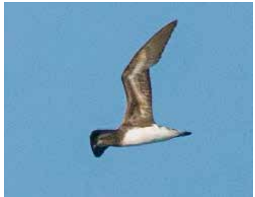
135 African Darter / Afrikaanse Slangenhalsvogel Anhinga rufa , Hour-al-Azeem, Khuzestan, Iran, 13 February 2019 ( Radosław Gwóźdź ) 136 Goliath Heron / Reuzenreiger Ardea goliath , Hour-al-Azeem, Khuzestan, Iran, 13 February 2019 ( Radosław Gwóźdź ) 137-138 Tahiti Petrel / Tahitistormvogel Pseudobulweria rostrata , c 5 nautical miles south off Mirbat, Dhofar, Oman, 23 February 2019 ( Bill Simpson )

Dutch Birding 39: 89-91, 152, 2017). The American Coot Fulica americana at Lagoa das Furnas, São Miguel, Azores, from 21 November 2018 was still present on 26 January. The fourth for Spain stayed at Lagoa de Cospeito, Lugo, from 23 February to at least 23 March.