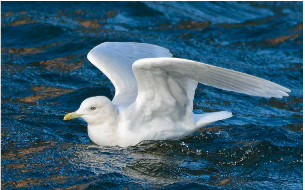
167 Kleine Burgemeester / Iceland Gull Larus glaucooides , adult winter, Amsterdam-Westerpark, Noord-Holland, 9 februari 2019