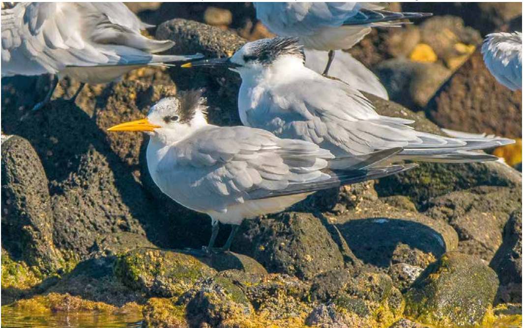
152 Lesser Crested Tern / Bengaalse Stern Sterna bengalensis , with Sandwich Terns / Grote Sterns S sandvicensis , Arrecife, Lanzarote, Canary Islands, 12 February 2019 (David Pérez Rodríguez)