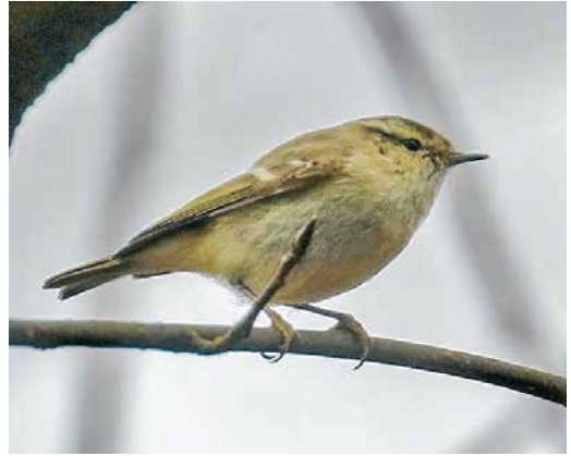
173 Humes Bladkoning / Hume's Leaf Warbler Phylloscopus humei , Balkbrug, Overijssel, 21 februari 2019

Europese Kanaries Serinus serinus gemeld, vrijwel uitsluitend solitaire vogels die snel verdwenen. Op telposten, vooral in het noorden, werden 29 Ijsgorzen Calcarius lapponicus genoteerd. Pleisteraars waren er op c 15 plekken, met de grootste groepen langs de Oorsprongweg op Texel (20) en, nog steeds, nabij de Kwade Hoek, Zuid-Holland (15). Grauwe Gorzen Emberiza calandra waren goed vertegenwoordigd, met ook buiten de bekende plekken in Groningen, Zuid-Limburg en Zeeuws-Vlaanderen pleisteraars, zoals vanaf 28 december op de Kwade Hoek; van 1 januari tot 2 maart in de Wieringermeer (drie); van 7 tot 21 januari bij Barneveld, Gelderland (twee); van 18 januari tot 5 maart bij Brui-