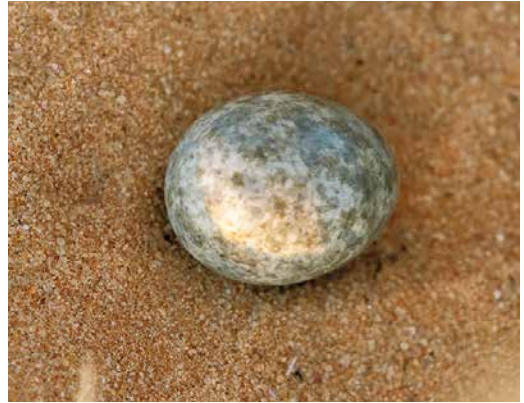
122 Single egg in nest of Golden Nightjar / Goudgele Nachtzwaluw Caprimulgus eximius , near Ouadâne, Adrar, Mauritania, 19 April 2018 (Peter Stronach)

Nightjar at El Beyed, Adrar, some 60 km north-north-east of the Ouadâne site (plate 123; cf Dutch Birding 40: 181, plate 233, 2018). Here we found a roosting female during daylight and heard a male singing after dark in an expansive area of suitable habitat, consisting of grass and sand dunes. Given