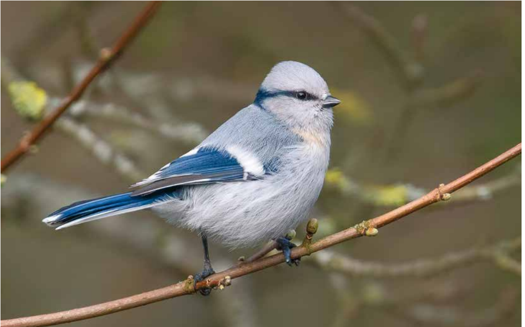
160 Presumed Azure Tit / vermoedelijke Azuurmees Cyanistes cyanus , Bergen, Noord-Holland, Netherlands, 11 March 2019