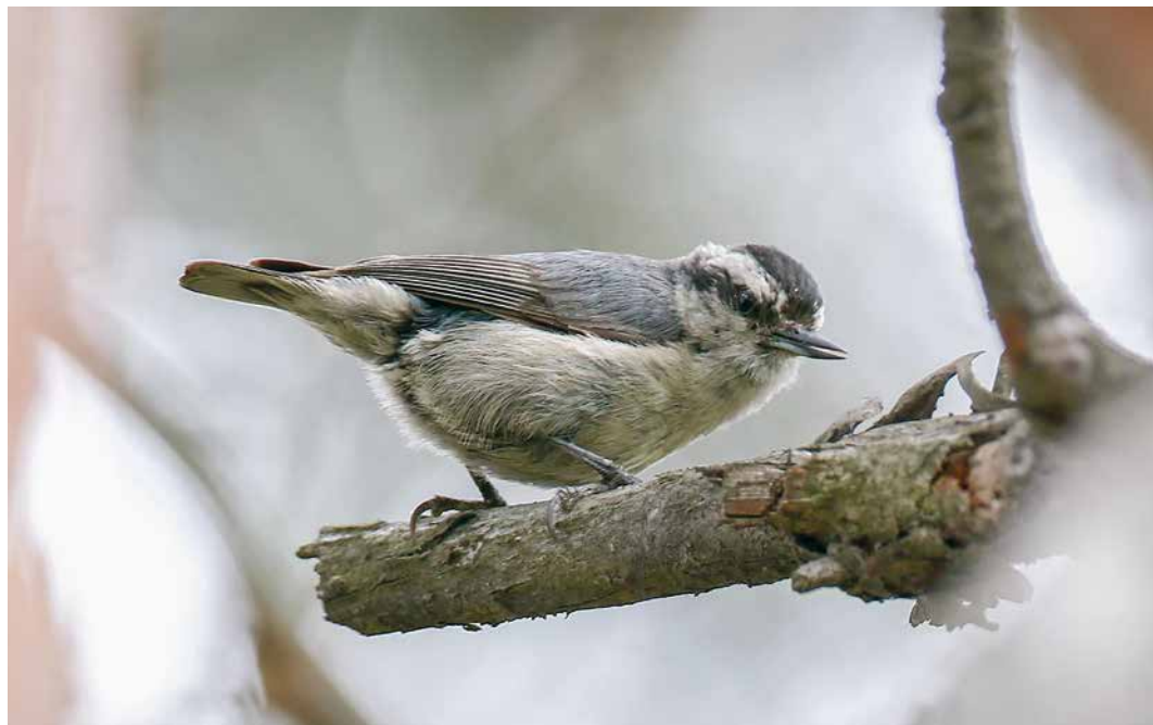
118 Chinese Nuthatch / Chinese Boomklever Sitta villosa , Nikolayevka, Mikhaylovsky, Primorie, Russia, 7 June 2018