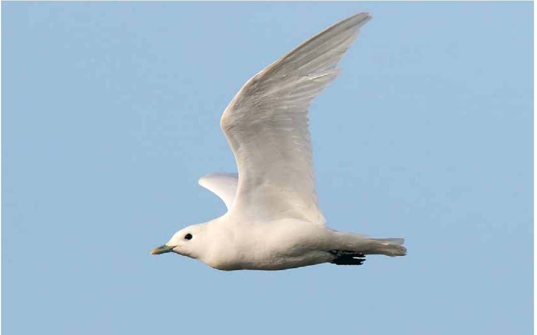
151 Ivory Gull / Ivoormeeuw Pagophila eburnea , adult, Stevenston Point, Ayrshire, Scotland, 11 February 2019 (Andrew Jordan)