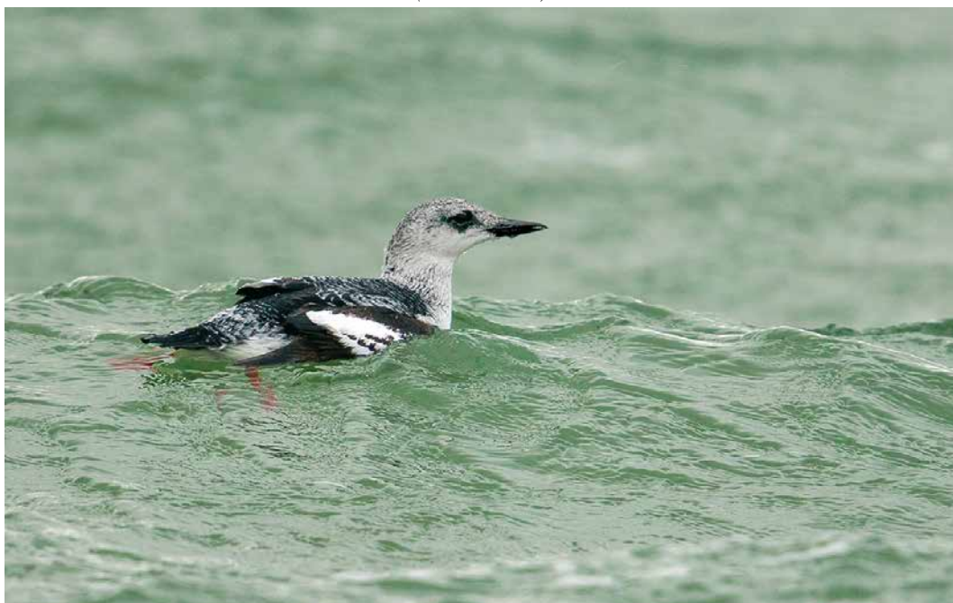
165 Zwarte Zeekoet / Black Guillemot Cephus grylle , eerste-winter, Brouwersdam, Zuid-Holland, 27 januari 2019