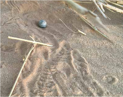
121 Nest with egg of Golden Nightjar / Goudgele Nachtzwaluw Caprimulgus eximius , near Ouadâne, Adrar, Mauritania, 19 April 2018. Close up of nest and single egg, showing footprints on and off nest.