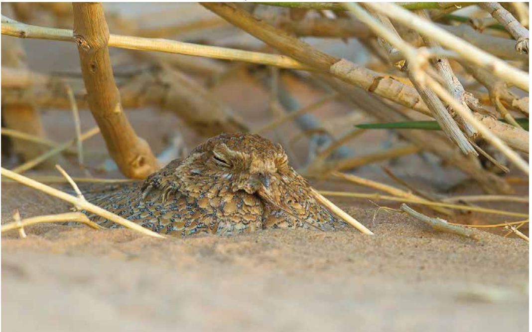
120 Golden Nightjar / Goudgele Nachtzwaluw Caprimulgus eximius , female incubating, near Ouadâne, Adrar, Mauritania, 19 April 2018