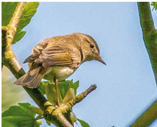
113 Balkanbergfluitier / Eastern Bonelli's Warbler Phylloscopus orientalis , Noordhollands Duinreservaat, Heemskerk, Noord-Holland, 14 mei 2018