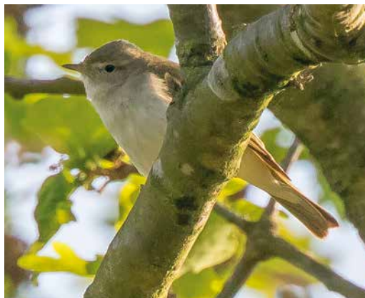
114 Balkanbergfluitier / Eastern Bonelli's Warbler Phylloscopus orientalis , Noordhollands Duinreservaat, Heemskerk, Noord-Holland, 14 mei 2018

gevonden. In dit artikel wordt dit geval gedocumenteerd en het voorkomen van de soort in Noordwest-Europa besproken.