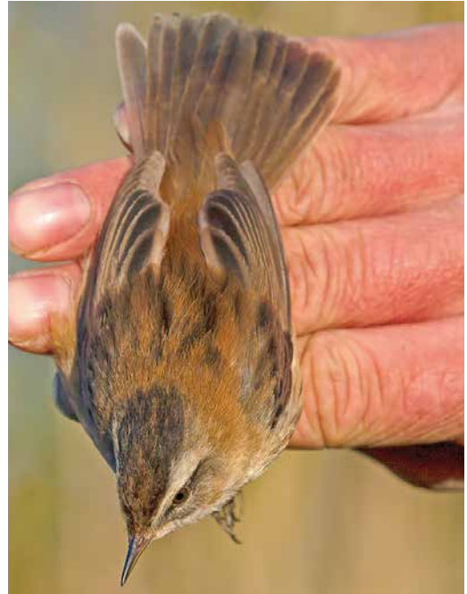
110-111 Zwartkoprietzanger / Moustached Warbler Acrocephalus melanopogon , Ooijse Graaf, Gelderland, 21 april 2016