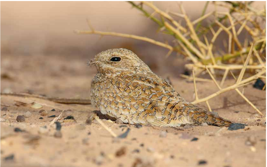
123 Golden Nightjar / Goudgele Nachtzwaluw Caprimulgus eximius , El Beyed, north of Ouadâne, Adrar, Mauritania, 20 April 2018

we found the species here so easily, we speculate that Golden Nightjar must be locally common in suitable habitat in northern Mauritania, and crepuscular exploration of other suitable sites in early spring will likely produce more records. Given that birds seem to be singing only sporadically by