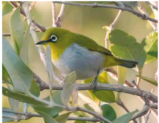
143 Intermediate Egret / Middelste Zilverreiger Ardea intermedia , Khour-e Tiab, Hormozgan, Iran, 21 November 2018 (Lasse / Laine) 144 Long-billed Dowitcher / Grote Grijsze Snip Limnodromus scolopaceus , first-winter, Bandar Abbas, Hormozgan, Iran, 10 February 2019 (Zbigniew Kajzer) 145 Vega Gull / Vegameeuw Larus vegae , adult, Qeshm island, Hormozgan, Iran, 24 January 2019 (Javad Parastegari) 146 Siberian Crane / Siberische Witte Kraanvogel Leucogeranus leucogeranus , adult male ('Omid'), Fereydunkenar, Mazandaran, Iran, 3 February 2019 (Zbigniew Kajzer) 147 White-crowned Wheatear / Witkruintapuit Oenanthe leucopyga , adult, Ghatrouiyeh, Fars, Iran, 14 February 2019 (Mohammad Rahimi) 148 Indian White-eye / Indiase Brillvogel Zosterops palpebrosus , Gaz river mouth, Bandar-e Sirik, Hormozgan, Iran, 8 February 2019 (Zbigniew Kajzer)