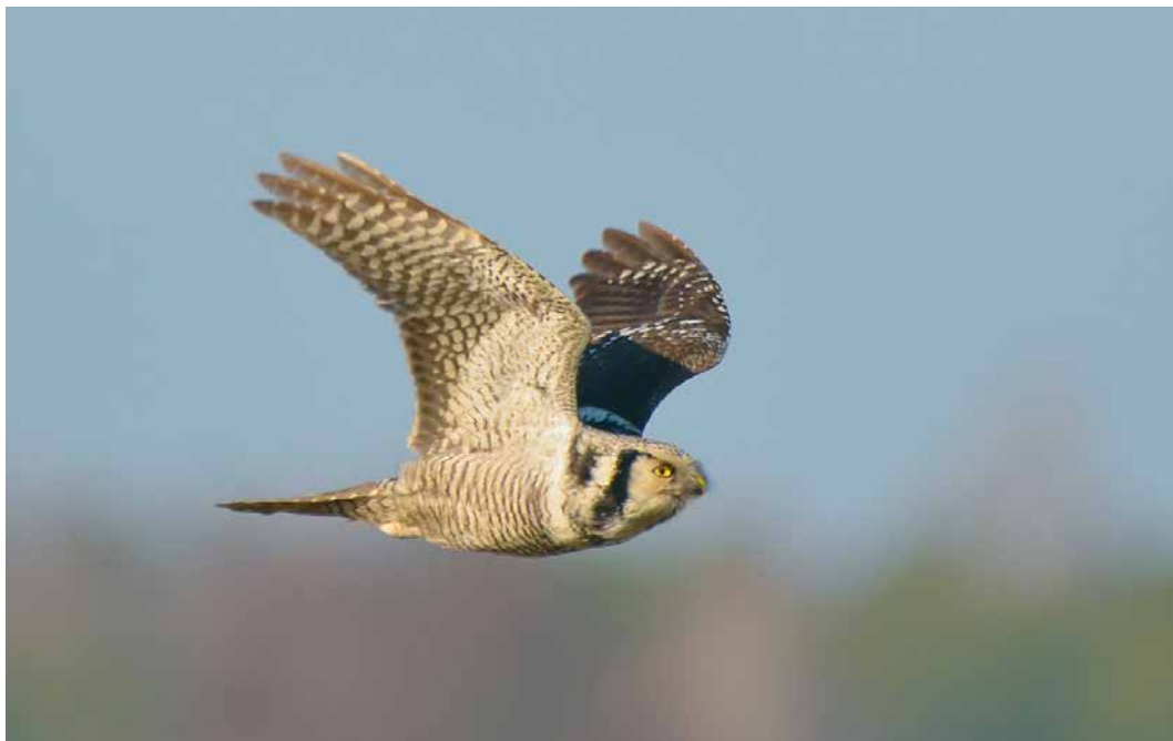
131 Northern Hawk-Owl / Sperweruil Surnia ulula , Bachury, Podlasie, Poland, 10 February 2019 (Młosz Cousens)