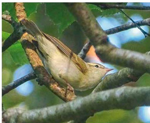
126 Grauwe Fitis / Greenish Warblers Phylloscopus trochiloides , Jacobspad, Schiermonnikoog, Friesland, 22 juli 2018 (Jaro Schacht). Juveniel (rechts) en adult direct na bedelen en voeren. 127 Grauwe Fitis / Greenish Warbler Phylloscopus trochiloides , Jacobspad, Schiermonnikoog, Friesland, 21 juli 2018 (Enno B Ebels). Adult mannetje op basis van zangactiviteit; let op rommelige bevedering op kop. 128 Grauwe Fitis / Greenish Warbler Phylloscopus trochiloides , Jacobspad, Schiermonnikoog, Friesland, 23 juli 2018 (Enno B Ebels). Vermoedelijk jonge vogel op basis van 'strak' verenkleed.

rect na dit moment. Daarna foerageerden de vogels langdurig aan weerszijden van het Jacobspad, waarbij nog zeker eenmaal bedelen en voeren werd vastgesteld. Alle vogels toonden kenmerken van Grauwe Fitis (bouw, verenkleed en geluid) en met het waarnemen van bedelen en voeren was het broedgeval een feit.