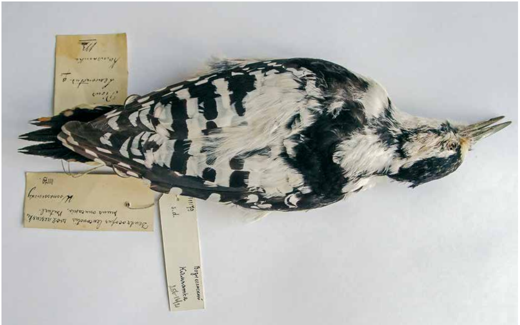
124-125 White-backed Woodpecker / Witrujspecht Dendrocopos leucotos voznesenskii Buturlin, 1907, type specimen, Zoological Museum, Moscow State University, Russia. Large white back patch and wide white dorsal bands. Flank slightly streaked on very white background, quite different from forms of Russian Far East ( D l sinicus-leucotos ). Rectrices predominantly white.

White-backed Woodpecker does not occur in Kamchatka, Russia