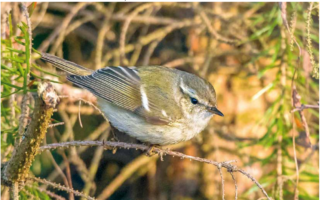
169 Humes Bladkoning / Hume's Leaf Warbler Phylloscopus humei , Sint-Oedenrode, Noord-Brabant, 2 januari 2019 (Paul van Tuil)