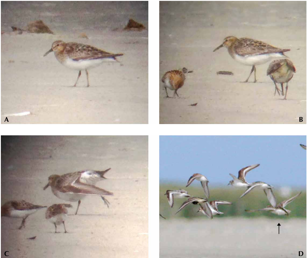
FIGURE 1 Presumed hybrid Sanderling x Pectoral Sandpiper / vermoedelijke hybride Drieteenstrandloper x Gestreepte Strandloper Calidris alba x melanotos , Ameland, Friesland, Netherlands, 2 August 2017 (Jan Bisschop). A 'horizontal' posture and drooping tail; B best image, together with Little Stint C minuta (left) and Dunlin C alpina (right); C showing stretched wing (together with two Little Stints); D in flight with four Sanderlings C alba , Dunlin and Little Stint. Arrow points to Calidris hybrid.

adult. Various features did not fit an (adult) Pectoral, most notably: 1 dark leg colour; 2 irregular, patchy pattern of the scapulars; 3 conspicuous white wing-bar; 4 absence of pale bill base; and 5 rather short tibia. The bird showed some features that can be seen in adult Baird's Sandpiper C bairdii , most notably the wing pattern. However, Baird's is a relatively small and slender sandpiper (eg, smaller, more elongated and shorter legged than Sanderling), and has primaries extending far beyond the tail-tip. The bird also somewhat recalled a Sanderling. Adult Sanderling in breeding plumage can show dense breast streaking that is sharply separated from the white belly. Adults may also develop a pale supercilium behind the