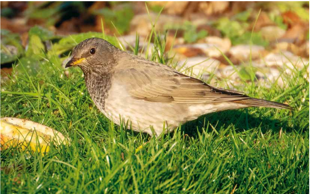
171 Zwartkeellijster / Black-throated Thrush Turdus atrogularis , mannetje, Coevorden, Drenthe, 16 februari 2019 (Hans Tetteroo)