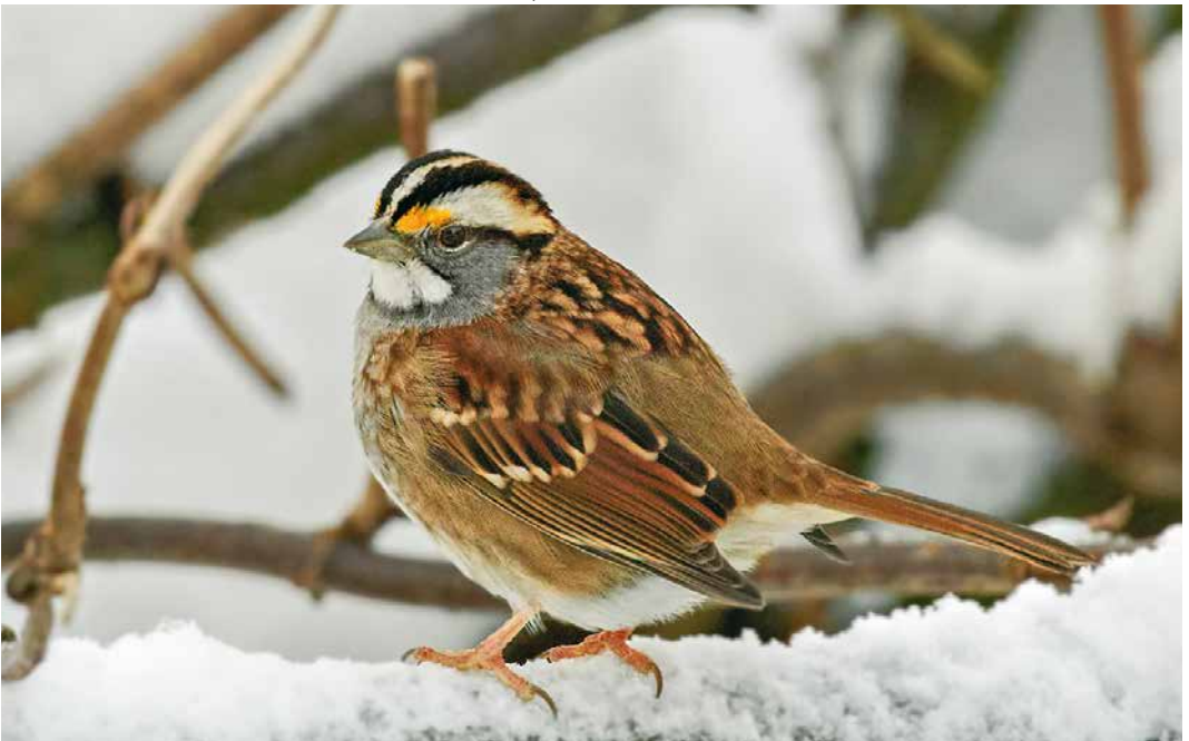
161 White-throated Sparrow / Witkeelgors Zonotrichia albicollis , Elliðahvammur, Kópavogur, Iceland, 27 January 2019 ( Óskar Andri )