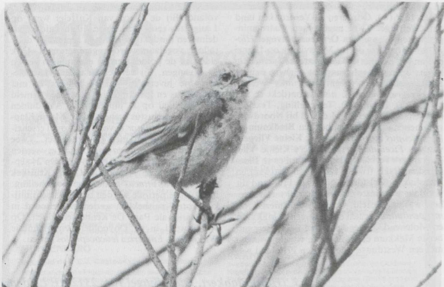
57-58. Buidelmezen Remiz pendulinus , jonge vogel in juveniel kleeed (boven) en ruiend naar volwassen kleeed (onder), De Blocq van Kuffeler (Fl), augustus en september 1982 ( René Pop )