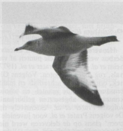
44. Ring-billed Gull Larus delawarensis , second calendar-year, Canary Islands, March 1982 (Eric Bos)

PLUMAGE. Worn, especially on smaller individual which showed extremely worn wing-coverts and remiges. Head and neck white with some dark markings, especially near eye, and dark spots on nape and upperneck. Mantle and scapulars greyish, only little darker than Black-headed Gull. Breast, belly and flanks white with few spots on latter. Upperwing greyish-brown, lesser coverts greyish, median coverts dark brown, greater coverts grey, tertials dark with narrow pale fringes, secondaries pale with dark subterminal bar, inner primaries very pale with dark subterminal spots, outer primaries blackish-brown; underwing showed almost same contrast as upperwing; inner primaries very pale, almost translucent; in flight, black and white wing pattern prominent. Uppertail white with broad dark subterminal band, tips of rectrices whitish (visible only in very good light conditions), outer webs of outer rectrices white; undertail with broad irregular subterminal band.