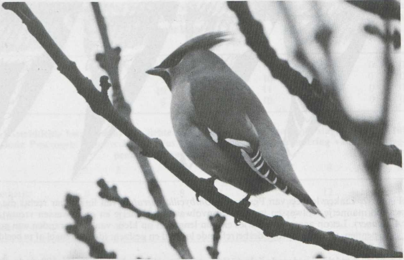
35-37. Pestvogels Bomycilla garrulus (Arie de Knijff). 35. Volwassen mannetje, Haarlem (NH), februari 1982. Lange kuif, groot aantal lange lakpuntjes en brede staarteindband wijzen op mannetje. Let op voor volwassen vogels kenmerkend 'haakjespatroon' op grote slagpennen. 36. Onvolwassen mannetje, Noordwijk (ZH), november 1981. Lange kuif, scherpe keelplekbe-grenzing, nauwelijks lichtere stuit, brede staarteindband en goed ontwikkelde lakpuntjes wijzen op mannetje. Let op voor onvolwassen vogels kenmerkende lichte streep over grote slagpennen. 37. Onvolwassen vrouwtje, Noordwijk (ZH), november 1981. Korte kuif, vage keelplekbe-grenzing en smalle staarteindband wijzen op vrouwtje.