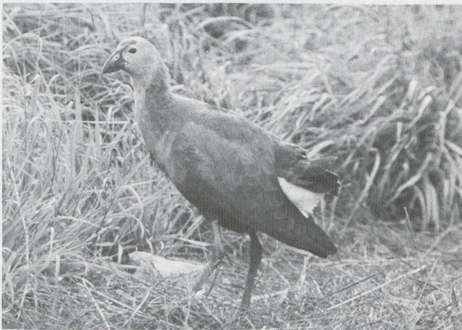
54. Purperkoet Porphyrio porphyrio , onvolwassen vogel, Oorderen (A), oktober 1982

Numansdorp (ZH) en in september te Antwerpen-Blokkersdijk (A), Ohé en Laak (L) en in het Verdrongen land van Saeftinge (Z).. In augustus was bijna dagelijks een drietal juveniele exemplaren te zien bij de observatiehut langs de Knardijk (F). Een Koereiger Bubulcus ibis werd gemeld bij Oudega (Fr) op 4 augustus en een te Emmen (D) op 10 september. Van half juli tot half september verbleven Kleine Zilverreigers Egretta garzetta te Blokkersdijk (maximaal vijf, Doel (OV) (twee), Kallo (OV), Ooypolder (Gld), Rotterdam (ZH) en Terschelling (Fr). Van drie Kleine Zilvers die zich in de Dortsche en Sliedrechtse Biesbosch (ZH) ophielden in augustus, stierven er twee aan botulisme. In Het Zwin (WV) broedde een gemengd paartje Kleine Zilverreiger x Blauwe Reiger Ardea cinerea twee jongen uit. Gedurende de gehele periode vertoefden Grote Zilverreigers E. alba in Zuidelijk Flevoland (F) en bij Piaam (Fr). In augustus werd langs de Knardijk een vermoedelijke