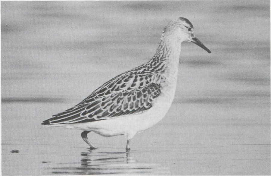
10 Juvenile male Ruff Philomachus pugnax showing typical shape, neat pattern of upperparts and unstreaked underparts, England, August (J.B. & S. Bottomley)