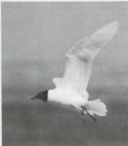
18. Zwartkopmeeuw Larus melanocephalus, De Maasvlakte (ZH), april 1981