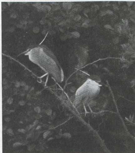
17. Kwak ( Nycticorax nycticorax , Kortenhoef (NH), juli 1979

Foto's van zeldzame en moeilijk te herkennen vogels De redactie van Dutch Birding (DB) verzoekt vogelfotografen om foto's en dia's van zeldzame vogels op te sturen naar haar fotografisch redacteur, René Pop (Jacob Gillesstraat 16, 3135 AP Vlaardingen/010-341128). Dit onder meer ten behoeve van de rubriek 'Recente meldingen'. Ook foto's en dia's van moeilijk te herkennen soorten en ondersoorten zijn van harte welkom. Deze kunnen bijvoorbeeld gebruikt worden voor de illustratie van herkenningsartikelen. Alle ontvangen foto's of kopieën ervan zullen in het DB -archief worden opgenomen. De redactie dankt iedereen bij voorbaat hartelijk voor zijn medewerking.