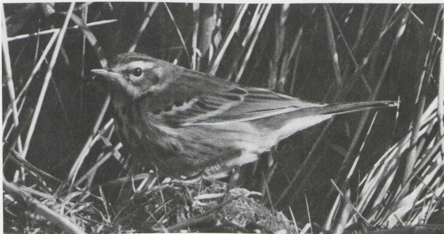
15. Mystery photograph 7. Solution in the next issue.

Killian Mullarney, The Mill House, Whitechurch Road, Rathfarnham, Dublin 14, Ireland