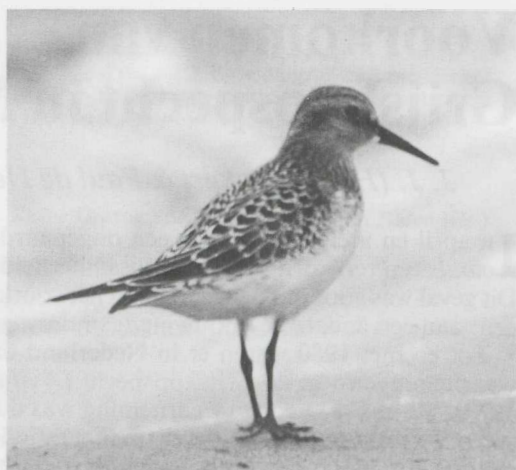
12-14. Bairds Strandloper Calidris bairdii , juveniel, Huizen (NH), augustus 1981