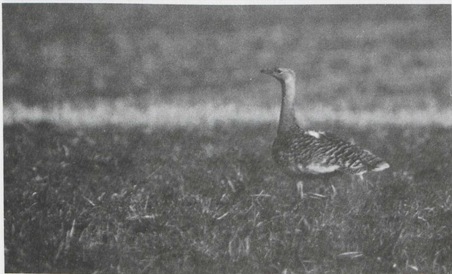
4. Grote Trap Otis tarda , Renkum (Gld), januari 1982 (René Pop)

Er werden in totaal 14 Grote Trappen waargenomen in Nederland en vlak over de grens in België en de BRD (tabel 1). Negen van de 14 vogels werden voor het eerst gezien in de periode van 15 tot en met 24 december 1981. Ook vier in Engeland (Kent) waargenomen Grote Trappen (Hume & Allsopp 1982) werden in deze periode ontdekt. De invasie kwam op gang vlak na het begin van een periode met streng winterweer. Begin en verloop van de invasie waren in overeenstemming met de theorie van Hummel & Berndt (1971). Volgens deze theorie kan een invasie in West-Europa alleen maar plaatsvinden als een winter vroeg en streng begint. Dit zou de dan nog latent aanwezige trekdrang bij een aantal Grote Trappen stimuleren waardoor deze wegtrekken. Voor een bespreking van de invasie in de winter van 1978/79 zij verwezen naar de Knijff (1981).