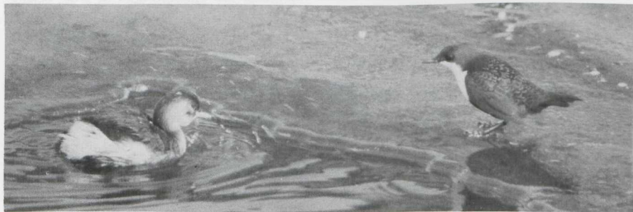
20. Dodaars Tachybaptus ruficollis (links) en Waterspreeuw Cinclus cinclus (rechts), Woudenberg (U), februari 1982