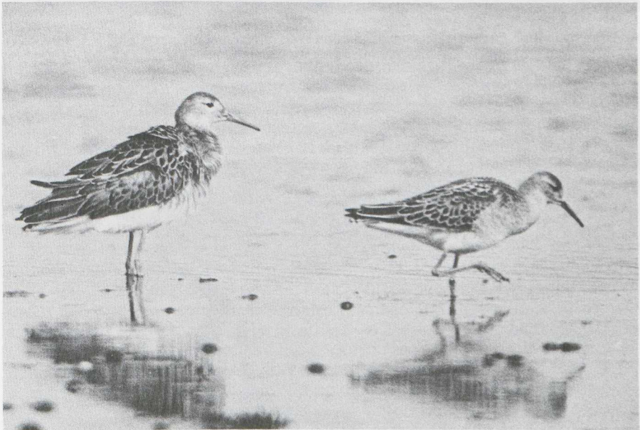
5. Juvenile male (left) and female (right) Ruff Philomachus pugnax showing size difference, Wales, August (R.J. Chandler)