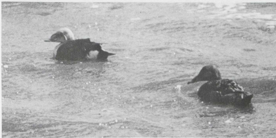
1. Koningseider Somateria spectabilis , Wieringen (NH), mei 1975 (Jan M. Boshuizen).

Dit was het derde geval van de Koningseider voor Nederland (cf. Avifauna van Nederland 1970, Tekke 1977). Het eerste geval werd vastgesteld op 16 januari 1966 te Wissekerke (Z); het tweede op 31 mei 1975 op Wieringen (NH) door Jan C. en Jan M. Boshuizen (zie plaat 1). Voor besprekingen van het voorkomen van deze arctische eend in Groot-Brittannië en Ierland en elders in Europa zij verwezen naar Cramp & Simmons (1977) en Sharrock & Sharrock (1976).