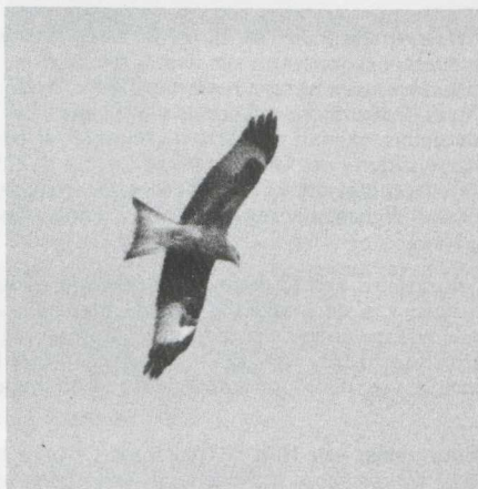
19. Rode Wouw Milvus milvus , Vogelenzang (NH), februari 1982 (René Pop)

Begin december werd een IJsduiker Gavia immer dood gevonden bij Dokkum (F). De IJsduiker die eind december bij Wijk bij Duurstede (U) verscheen bleef tot in 1982. Andere werden in januari gezien aan de Hondsbosse Zeewering (NH), bij Kats (Z) en De Maasvlakte (ZH). De laatste bleef tot in februari. Een Geelsnavelduiker G. adamsii verbleef van 10 tot en met 12 januari op het Veerse Meer (Z).